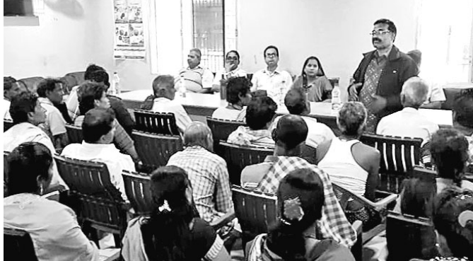
ତାଳରତାଠାରେ ଅନୁଷ୍ଠିତ ବୈଠକରେ ଆଲୋଚନା ଚାଲିଛି।

ତାଲିଆରୀ ନୂତନ ପାର୍କ ଓ ପାନୀୟ ଜଳ ପ୍ରକଳ୍ପ ଗୁଡ଼ିକୁ ଶୀଘ୍ର ସାରିବା ପାଇଁ ଉପସ୍ଥିତ