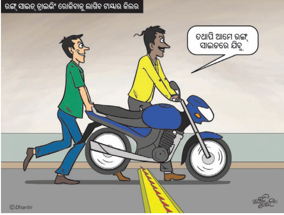
ରକ୍ତ ସାଇକ୍ଲ ପ୍ରାଇଭିଂ ରୋକିବାକୁ ଲାଗିବ ଟାୟାର କିଲର