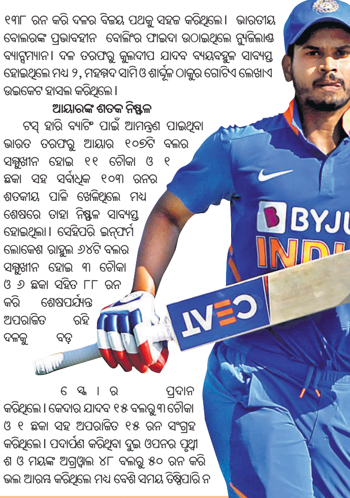
୧୩୮ ରନ କରି ଦଳର ବିଜୟ ପଥକୁ ସହଜ କରିଥିଲେ। ଭାରତୀୟ ବୋଲରଙ୍କ ପ୍ରଭାବହୀନ ବୋଲିଂର ଫାଇଦା ଉଠାଇଥିଲେ ଦୁଇଜଣାଙ୍କ ବ୍ୟାଟ୍ସମ୍ୟାନ।

ନୁଆଦିଲ୍ଲା, ୫-୧୨ - ଭାରତୀୟ ଅଧିନାୟକ ବିରାଟ କୋହଲି କେବଳ କ୍ରିକେଟ ଫିଲ୍ଡ ଯୋଗୁ ଚର୍ଚ୍ଚାରେ ରୁହନ୍ତି ତା ରୁହେଁ, ବରଂ ଫିଲ୍ଡ ବାହାରେ ମଧ୍ୟ। ତାଙ୍କ ବ୍ରାଣ୍ଡ ଭାଲ୍ୟୁ ଏବେ ଦେଶରେ ସର୍ବାଧିକ। କୋହଲିଙ୍କ ବ୍ରାଣ୍ଡ ଭାଲ୍ୟୁରେ ଗତବର୍ଷ ଅପେକ୍ଷା ୩୯ ପ୍ରତିଶତ ବୃଦ୍ଧି ପାଇଛି। ଫଳରେ ତାଙ୍କ ବ୍ରାଣ୍ଡ ଭାଲ୍ୟୁ ୨୩୨.୫ ନିୟୁଟ ଡଲାରରେ ପହଞ୍ଚିଛି। ଏହା ଭାରତୀୟ ମୂଲ୍ୟରେ ୧୨୯୯ କୋଟି ଟଙ୍କାରୁ ଅଧିକ। ଏହା ଗ୍ଲୋବାଲ ଆଡଭାଇଜରୀ ଫାର୍ମ ଡର୍ ପ୍ରେ ଆଓ ଫିଲେସ୍ ପକ୍ଷରୁ କୁହାଯାଇଛି। ବ୍ରାଣ୍ଡ ଭାଲ୍ୟୁ ସେଲିବ୍ରିଟିକ ବିଜ୍ଞାପନ ରୁହୁରୁ ଜଣାପଡ଼େ। କୋହଲି କ୍ରମାଗତ ତୃତୀୟ ଥର ପାଇଁ ଶୀର୍ଷ ସ୍ଥାନ ବଜାୟ ରଖିଛନ୍ତି।