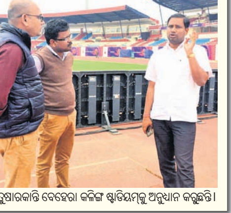
କ୍ରୀଡ଼ାମନ୍ତ୍ରୀ ତୁଷାରକାନ୍ତି ବେହେରା କଳିଙ୍ଗ ଷ୍ଟାଡ଼ିୟମ୍‌କୁ ଅନୁଧ୍ୟାନ କରୁଛନ୍ତି।