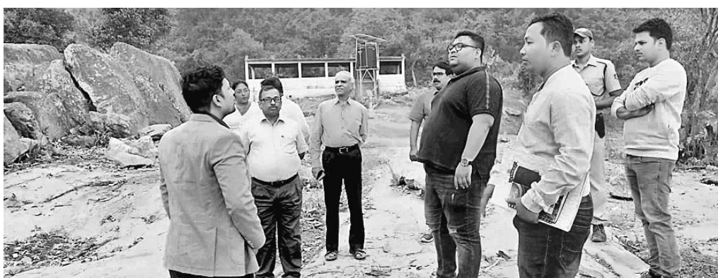
ବାକେଶ୍ଵରୀ ପାଠରେ ପ୍ରକଳ୍ପ ନିର୍ଦ୍ଦେଶକ ଅନୁଧ୍ୟାନ କରୁଛନ୍ତି।

ଦିଗପହଣ୍ଡି, ୫୨ (ଡି.ଏନ.ଏ.) ପଞ୍ଚାୟତ କମଳାପୁର ଗ୍ରାମର କାଶୀ ବିଶ୍ଵନାଥ ଓ ଖମ୍ବାରୀ ପଞ୍ଚାୟତର