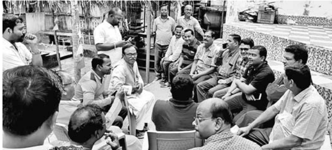
ମନ୍ଦିର ଉନ୍ନୟନ ବୈଠକରେ ଯୋଗଦେଇଥିବା ଅଧିକାରୀ ଓ ସଭ୍ୟ।

ଶେରଗଡ଼ ବ୍ଲକ କରଖୋଜ ପୀଠରେ ଉକ୍ତ ପୀଠ ସମନ୍ବନ୍ଧ ସମିତିର ବୈଠକ ରୁପସାରେ