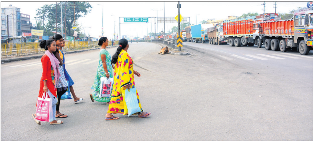
ବନ୍ଦ ଯୋଗୁ ସମ୍ବଲପୁର ଅଇଁଠାପାଲି ଛକ ଶୂନ୍ୟମାନ।