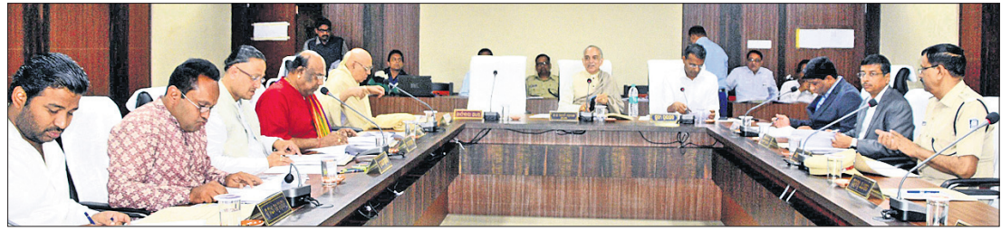
ବୈଠକରେ ଗଜପତି ମହାରାଜା, ଶ୍ରୀମନ୍ଦିର ମୁଖ୍ୟ ପ୍ରଶାସକ କ୍ରମେ କୁମାର ଏବଂ ଅନ୍ୟମାନେ।