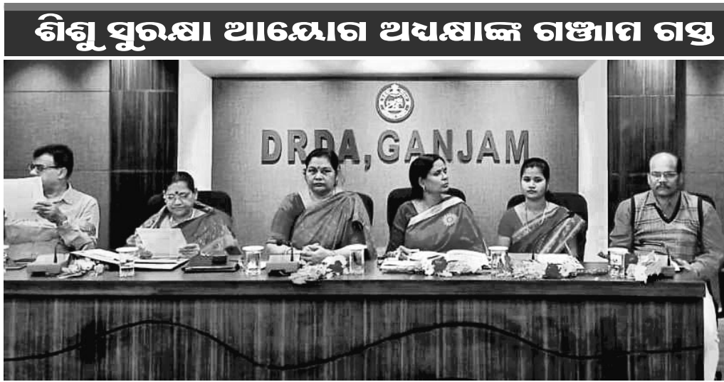
ଆୟୋଗ ଅଧ୍ୟକ୍ଷ ଓ ଅନ୍ୟମାନେ ଉପସ୍ଥିତ ଅଛନ୍ତି।

୨୦୨୪ ସୁଦ୍ଧା ଓଡ଼ିଶା ରାଜ୍ୟ ହେବ ଶିଶୁ ଶ୍ରମିକମୁକ୍ତ। ଏପରି କିଛି ଯୋଜନା ସରକାର ଲାଗୁ କରିଛନ୍ତି।