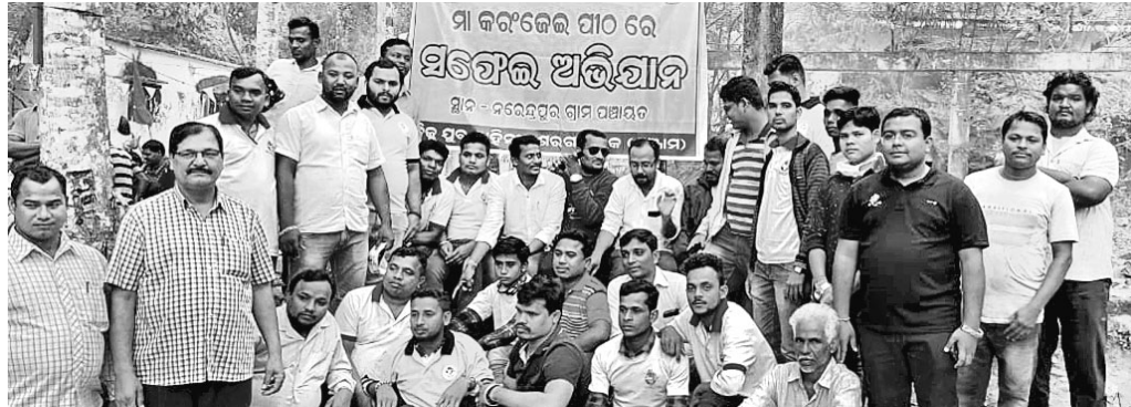
ସଫେଇ ଅଭିଯାନରେ ଯୋଗଦେଇଥିବା ବିଡିଓ ଓ ଅନ୍ୟମାନେ।

ଶେରଗଡ଼, ୫୨ (ଡି.ଏନ.ଏ.)- ଶେରଗଡ଼ ବ୍ଲକ ବିଜୁ ଯୁବ ବାହିନୀ ପକ୍ଷରୁ