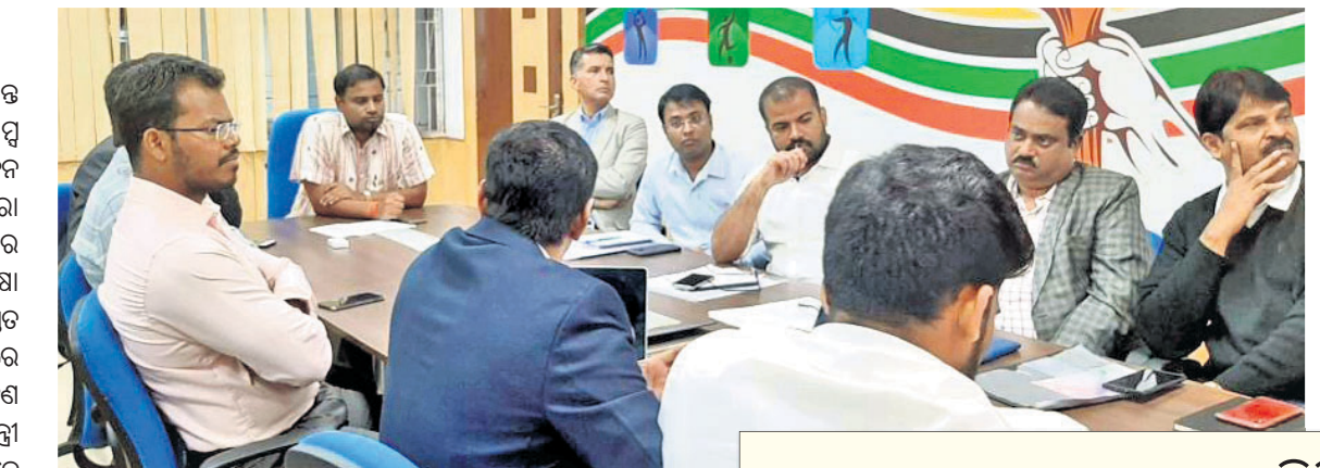
ବୈଠକ ଅବସରରେ କ୍ରୀଡ଼ାମନ୍ତ୍ରୀଙ୍କ ସହ ଅନ୍ୟ କର୍ମକର୍ମୀମାନେ।

ଚଳିତ ମାସ ୨୨ରୁ ମାର୍ଚ୍ଚ ୧ ପର୍ଯ୍ୟନ୍ତ ଓଡ଼ିଶାରେ ଖେଳା ଇଣ୍ଡିଆ ଯୁନିଭର୍ସିଟି ରେପ୍ଟ ଅନୁଷ୍ଠିତ ହେବ। ଏହାର ସଫଳ ଆୟୋଜନ ଉପରେ କ୍ରୀଡ଼ାମନ୍ତ୍ରୀ ତୁଷାରକାନ୍ତି ବେହେରା ଗୁରୁତ୍ୱରୋପ କରିଛନ୍ତି।