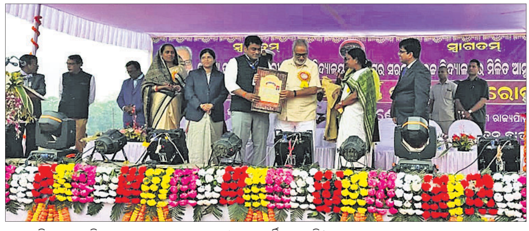
ଜଣେ ପ୍ରତିଭାବାନ ବ୍ୟକ୍ତିଙ୍କୁ ରାଜ୍ୟପାଳ ପ୍ରଫେସର ଗଣେଶୀ ଲାଲ୍ ସମ୍ବର୍ଦ୍ଧିତ କରୁଛନ୍ତି।