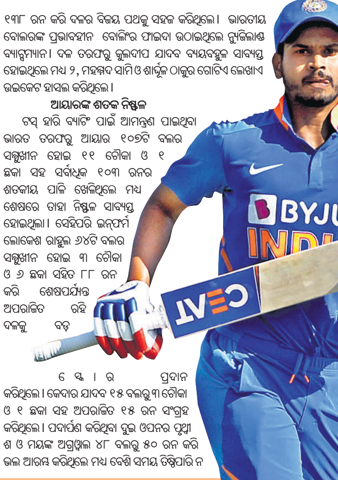
୧୩୮ ରନ କରି ଦଳର ବିଜୟ ପଥକୁ ସହଜ କରିଥିଲେ। ଭାରତୀୟ ବୋଲରଙ୍କ ପ୍ରଭାବହୀନ ବୋଲିଂର ଫାଲ୍‌ଦା ଉଠାଇଥିଲେ ଦୁଇଜଣାଙ୍କ ବ୍ୟାଟ୍‌ମ୍ୟାନ।

ନୂଆଦିଲ୍ଲୀ, ୫-୧୨ - ଭାରତୀୟ ଅଧିନାୟକ ବିରାଟ କୋହଲି କେବଳ କ୍ରିକେଟ ଫିଲ୍ଡ ଯୋଗୁ ଚର୍ଚ୍ଚାରେ ରୁହନ୍ତି ତା ବ୍ରାଣ୍ଡ, ବରଂ ଫିଲ୍ଡ ବାହାରେ ମଧ୍ୟ। ତାଙ୍କ ବ୍ରାଣ୍ଡ ଭାଲ୍ୟୁ ଏବେ ଦେଶରେ ସର୍ବାଧିକ। କୋହଲିଙ୍କ ବ୍ରାଣ୍ଡ ଭାଲ୍ୟୁରେ ଗତବର୍ଷ ଅପେକ୍ଷା ୩୯ ପ୍ରତିଶତ ବୃଦ୍ଧି ପାଇଛି। ଫଳରେ ତାଙ୍କ ବ୍ରାଣ୍ଡ ଭାଲ୍ୟୁ ୨୩୨.୫ ନିୟୁଟ ଡଲାରରେ ପହଞ୍ଚିଛି। ଏହା ଭାରତୀୟ ମୂଦ୍ରାରେ ୧୬୯୯୦ କୋଟି ଟଙ୍କାରୁ ଅଧିକ। ଏହା ଗ୍ଲୋବାଲ ଆଡଭାଇଜରୀ ଫାର୍ମ ଡର୍ ପ୍ରେ ଆଣ୍ଡ ଫିଲ୍ଡସ୍ ପକ୍ଷରୁ କୁହାଯାଇଛି। ବ୍ରାଣ୍ଡ ଭାଲ୍ୟୁ ସେଲିବ୍ରିଟିକ୍ ବିଜ୍ଞାପନ ରୁଣ୍ଡରୁ ଜଣାପଡ଼ିଛି। କୋହଲି କ୍ରମାଗତ ତୃତୀୟ ଥର ପାଇଁ ଶୀର୍ଷ ସ୍ଥାନ ବଜାୟ ରଖିଛନ୍ତି।