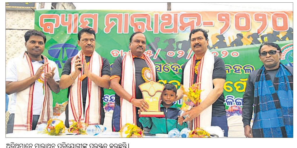
ଅତିଥିମାନେ ମାରାଥନ ପ୍ରତିଯୋଗୀଙ୍କୁ ପୁରସ୍କୃତ କରୁଛନ୍ତି।