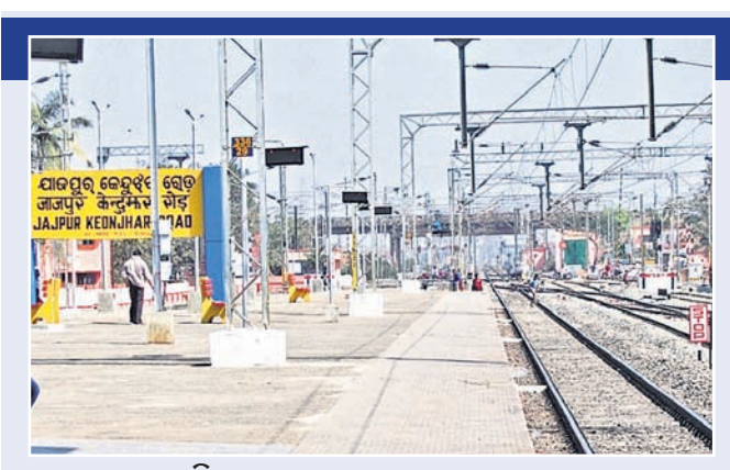
■ ସ୍ଥାନ ପାଇଲାନି ଧାମରାକୁ ନୂତନ ରେଳପଥ ■ ଯାଜପୁରରୋଡ୍ରେ ଡିଜିଟାଲ, ଘାଁଏଠର ନୋହିଲା ■ ସର୍ଭେରେ ସାମିତ ଘାଁଏଠର ପ୍ରକଳ୍ପ

ପୂର୍ବତନ ରେଳପଥ ପକ୍ଷରୁ ଯାଜପୁର ରୋଡକୁ ଧାମରା ପର୍ଯ୍ୟନ୍ତ ନୂତନ ରେଳପଥ ନିର୍ମାଣ ନିମନ୍ତେ ୨୦୧୨-୧୩ରେ ସର୍ବେକ୍ଷଣ ହୋଇଥିଲା। ୨୦୧୫ ଏପ୍ରିଲରେ ରେଳ ମନ୍ତ୍ରାଳୟ ଅଧିକାରୀଙ୍କୁ ରେଳବାଇ ବୋର୍ଡ଼ିନିକଟରେ ଏସଂଗ୍ରାହୀୟ ନଥିବାରୁ ଦାଖଲ କରାଯାଇଥିବାରୁ ଦୀର୍ଘ ୯୯.୯୫ କିମିର ଏହି ରେଳପଥ ନିର୍ମାଣ ପାଇଁ ୯୯୫କୋଟି ଟଙ୍କା ଖର୍ଚ୍ଚ ହେବ ବୋଲି ସେତେବେଳେ ଆକଳନ ମଧ୍ୟ ହୋଇଥିଲା। ଏହି ରେଳପଥ ନିର୍ମାଣ ହେଲେ ପୂର୍ବତନ ରେଳବାଇ ବର୍ଷକୁ ୩୩ପ୍ରତିଶତ ଲାଭଦାନ ହେବ ବୋଲି ସର୍ଭେ କରିଥିବା ଅଧିକାରୀମାନେ ଜଣାଇଛନ୍ତି। ଯାଜପୁରରେ ବିଶ୍ୱପ୍ରସିଦ୍ଧ ଷ୍ଟେଡ଼ିଂହା ମା' ବିରଜାକ୍ଷେତ୍ର ପାଠ୍ୟପାଠ୍ୟାଳୟରୁ ଉତ୍ପନ୍ନ ଶିଳ୍ପୀମାନେ ବିଶ୍ୱପ୍ରସିଦ୍ଧ ଆଖଣ୍ଡଳମଣୀ ଧାମ ରହିଛି। ଏହି ଦୁଇଟି ସ୍ଥାନକୁ ପ୍ରତ୍ୟେକ ଦିନ ଦେଶ ବିଦେଶରୁ ଯାତ୍ରୀମାନେ ଆସି ଦର୍ଶନଲାଭ କରିଥାନ୍ତି। ଏହି ରେଳପଥ ନିର୍ମାଣ ହେଲେ ପର୍ଯ୍ୟଟନ କ୍ଷେତ୍ରର ବିକାଶ ସମ୍ଭବ ହେବ। ଯାଜପୁର ଜିଲ୍ଲାର କଳିଙ୍ଗନଗର ଏସିଆ ମହାଦେଶର ଇତ୍ୟାଦି ରାଜଧାନୀଭାବେ ପରିଗଣିତ ହୋଇସାରିଲାଣି। ଏଠାରୁ ଧାମରା ବେଳ ଦେଶ ବିଦେଶକୁ ମାଲ ପରିବହନ କରିବା ପାଇଁ ସୁଗମ ହେବ।