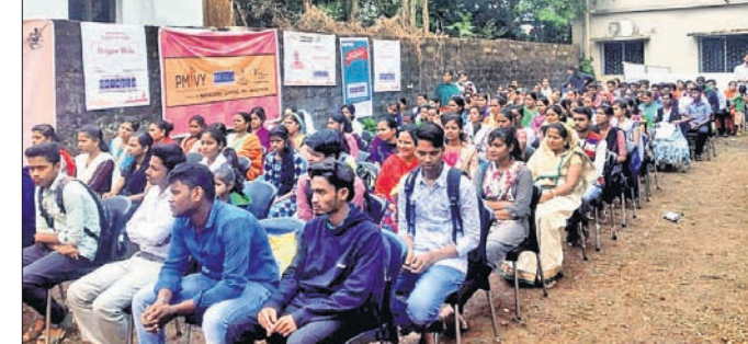
ତାଲିମ ପାଇଁ ଆସିଥିବା ଯୁବତୀଯୁବକମାନେ ।