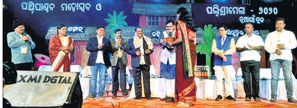
ଅତିଥିମାନଙ୍କୁ ଦଶପକ୍ଷା ବିଧାୟକ ସମର୍ଥନ କରୁଛନ୍ତି ।