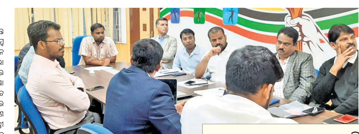
ବୈଠକ ଅବସରରେ କ୍ରୀଡାମନ୍ତ୍ରୀଙ୍କ ସହ ଅନ୍ୟ କର୍ମକର୍ମୀମାନେ।

ପାଖାପାଖି ଖେଳାଳି ଓ ଅତିଥିଆଲ୍ ଏଥିରେ ଅଂଶଗ୍ରହଣ କରିବାର ଆଶା ରହିଛି। ଖେଳାଳି ଓ ଅତିଥିଆଲ୍ମାନଙ୍କୁ ପାଇଁ କିନ୍ତୁ ରହିବାର ବ୍ୟବସ୍ଥା କରାଯାଇଛି।