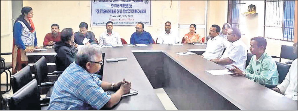
ବୈଠକରେ ଉପସ୍ଥିତ ଅଧିକାରୀ ଓ ଜନପ୍ରତିନିଧି ।