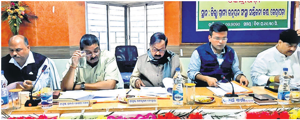
ବୈଠକରେ ଉପସ୍ଥିତ କମିଟିର ସଦସ୍ୟ ଓ ଅଧ୍ୟକ୍ଷମାନେ ।