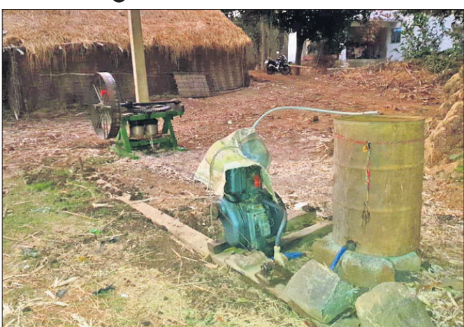
ହରିପୁରଠାରେ ବନ୍ଦ ହୋଇପଡ଼ିଥିବା ଆଖୁଖାଳ।

ଆଖୁ ଛାଡ଼ି ଧାନ ଚାଷ କରି ଆଖୁ ଫସଲ ମୋର ପ୍ରିୟ। ଭଲ