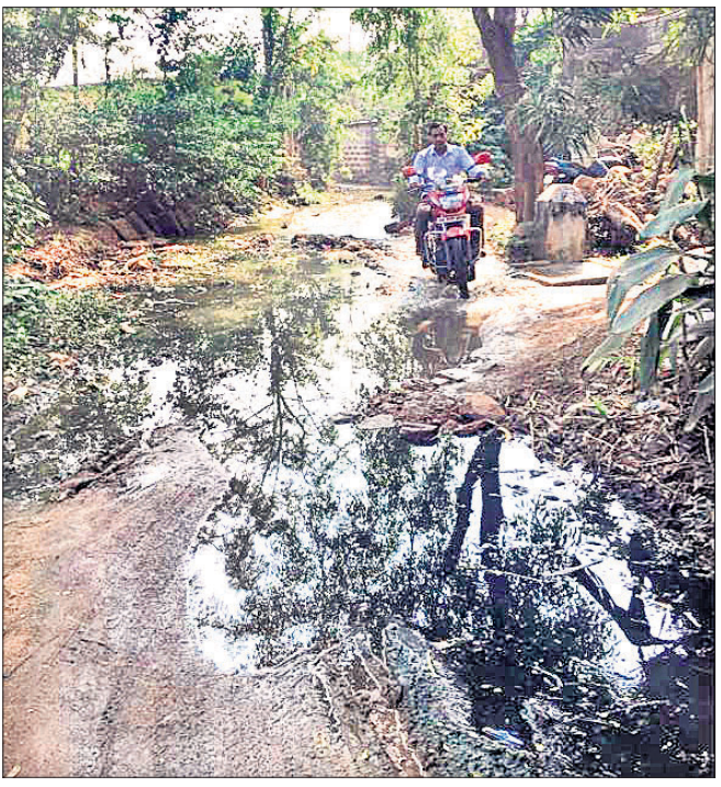
କାର୍ତ୍ତବୀରାଜ ସାହି ବାରିତଳ ରାସ୍ତାରେ କମିରହି ବର୍ଜ୍ୟଜଳ ।

ବୋଲଗଡ଼ ରୁକ୍ମ ବଡ଼କୁମାରୀ ପଞ୍ଚାୟତ କାର୍ତ୍ତବୀରାଜ ସାହି ବାରିତଳ ରାସ୍ତାରେ ବର୍ଜ୍ୟଜଳ କମିରହି ନିର୍ଦ୍ଦମାର ଭ୍ରମ ପୃଷ୍ଠି କରୁଛି । ଫଳରେ ଏହି ରାସ୍ତା ଦେଇ ଯାତାୟାତ କରୁଥିବା ଲୋକେ ଅସୁବିଧାର ସମ୍ମୁଖୀନ ହେଉଛନ୍ତି । ପ୍ରକାଶ ଯେ, ଉକ୍ତ ରାସ୍ତାଟି ରାଜସୁନାଖଳା ଗଣେଶ ବଜାରଠାରୁ ବାହାରି ସାହିର ମଧ୍ୟ ଭାଗରେ ସଂଯୋଗ ହୋଇଛି । ବଜାର ଅଞ୍ଚଳକୁ ଘୁଲାଇ ଲୋକେ ଏହି ରାସ୍ତା ଦେଇ କାର୍ତ୍ତବୀ ପାରଣା ସାହିକୁ ଯାଆନ୍ତି । ବିଶେଷ କରି ରାସ୍ତା ପାର୍ଶ୍ୱରେ ରହୁଥିବା ପରିବାର ଲୋକେ ଏହା ଉପରେ ନିର୍ଭରଶୀଳ । ରାସ୍ତାଟି ସମୟକ୍ରମେ ଖାଲୁଆ ହୋଇଯାଇଛି । ପୁଣି ବର୍ଜ୍ୟଜଳ ନିଷ୍କାସନ ପାଇଁ ଡ୍ରେନେଜ ବ୍ୟବସ୍ଥା ନାହିଁ । ଫଳରେ ରାସ୍ତା ପାର୍ଶ୍ୱରେ ଥିବା ନଳକୂପ ଜଳ ଖାଲୁଆ ଅଞ୍ଚଳରେ କମିରହି ଅସ୍ୱାସ୍ଥ୍ୟକର ପରିବେଶ ସୃଷ୍ଟି କରୁଛି । ଏଥିରେ ଅଳିଆ ଆବର୍ଜନା ପତି ତୁର୍ବନ୍ତ ହେଉଥିବାବେଳେ ମଣା ମାଛିକ ବଂଶ ବୃଦ୍ଧି ପାଉଛି । ଅନ୍ୟପକ୍ଷରେ ବର୍ଜ୍ୟଜଳରେ ଅଳିଆ ଆବର୍ଜନା ସାଥୁ