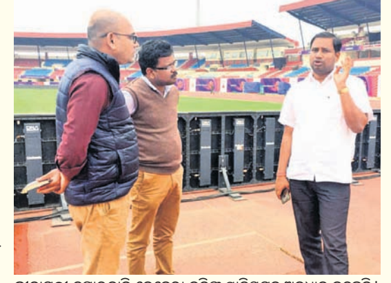
କ୍ରୀଡାମନ୍ତ୍ରୀ ରୁଷାରକାନ୍ତି ବେହେରା କଳିଙ୍ଗ ଷ୍ଟାଡ଼ିୟମ୍ ଅଧିକାରୀଙ୍କୁ ଅନୁଧ୍ୟାନ କରୁଛନ୍ତି।

କଲେକ୍ଟରାଟିକ୍ସ, ଆଇଟି, କ୍ରୀଡା ଓ ଯୁବସେବା ବିଭାଗ ମନ୍ତ୍ରୀ ରୁଷାରକାନ୍ତି ବେହେରା ରୁଧିରାରେ ପହଞ୍ଚିଛନ୍ତି।