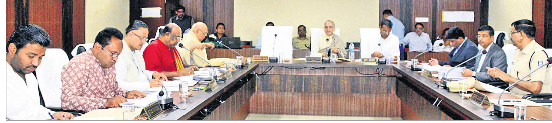
ବୈଠକରେ ଗଜପତି ମହାରାଜା, ଶ୍ରୀମନ୍ଦିର ମୁଖ୍ୟ ପ୍ରଶାସକ କ୍ରମେ ଏବଂ ଅନ୍ୟମାନେ।