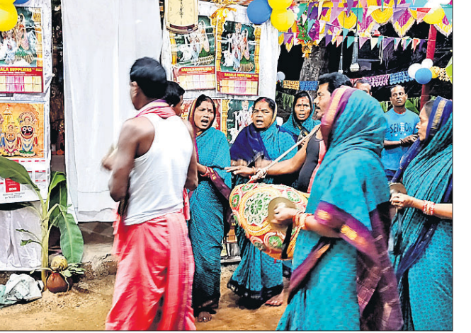
ସଂକାର୍ଚ୍ଚନା ମଞ୍ଚଳା ।

ଭାପୁର ଗ୍ରାମର ଆରାଧ୍ୟ ଦେବତା ବାଲୁକେଶ୍ୱର ଦେବଙ୍କ ପୀଠରେ ଚାଲିଥିବା ଅଷ୍ଟପ୍ରହର ନାମୟଣ ରୁଧିର ଉଦ୍‌ଘାଟନା ହୋଇଛି । ସୋମବାର ମଞ୍ଚଳାକରଣ, କଳସଯାତ୍ରା ଓ ବୃଷଭ ପ୍ରତିଷ୍ଠା ପରେ ମଙ୍ଗଳବାରଠାରୁ ଅଷ୍ଟପ୍ରହର ନାମୟଣ ଆରମ୍ଭ ହୋଇଥିଲା ।