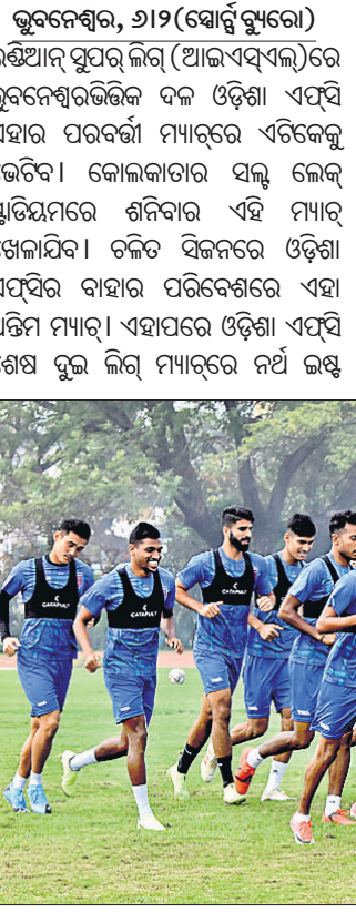
ଗୁରୁବାର କଳିଙ୍ଗ ସ୍ମୃତିୟମରେ ଅଭ୍ୟାସ ଅବସରରେ ଓଡ଼ିଶା ଏଫ୍‌ସି ଦଳ।

ଭୁବନେଶ୍ୱର, ୬-୨ (ସ୍ପୋର୍ଟ୍ସ୍ ବ୍ୟୁରୋ) ଇଣ୍ଡିଆନ୍ ପୁରୁ ଲିଗ୍ (ଆଇଏସ୍‌ଏଲ୍)ରେ ଭୁବନେଶ୍ୱରଭିତ୍ତିକ ଦଳ ଓଡ଼ିଶା ଏଫ୍‌ସି ଏହାର ପରବର୍ତ୍ତୀ ମ୍ୟାଚ୍‌ରେ ଏଟିକେକୁ ଭେଟିବ। କୋଲକାତାର ସଲ୍ ଲେକ୍ ସ୍ମୃତିୟମରେ ଶନିବାର ଏହି ମ୍ୟାଚ୍ ଖେଳାଯିବ। ଚଳିତ ସିଜନରେ ଓଡ଼ିଶା ଏଫ୍‌ସିର ବାହାର ପରିବେଶରେ ଏହା ଅତିମ ମ୍ୟାଚ୍। ଏହାପରେ ଓଡ଼ିଶା ଏଫ୍‌ସି ଶେଷ ବୁଲ ଲିଗ୍ ମ୍ୟାଚ୍‌ରେ ନର୍ଥ ଇଣ୍ଡିଆନ୍ ଟିମ୍‌ରେ (ଫେବୃଆରୀ ୧୪) ଓ କେରଳ ବ୍ଲାଷ୍ଟର୍ସ୍ (ଫେବୃଆରୀ ୨୩)କୁ ଘରୋଇ କଳିଙ୍ଗ ସ୍ମୃତିୟମରେ ଭେଟିବାର କାର୍ଯ୍ୟସୂଚୀ ରହିଛି। ପୂର୍ବରୁ ଗତବର୍ଷ ସେପ୍‌ତେମ୍ବର ୨୪ରେ ଶକ୍ତିଶାଳୀ ଏଟିକେ ବିପକ୍ଷରେ ଅନୁଷ୍ଠିତ ପ୍ରଥମ ଲିଗ୍ ମ୍ୟାଚ୍‌କୁ ଓଡ଼ିଶା ଗୋଲ୍‌କେରୀ ଭାବେ ଡ୍ର ରଖିବାରେ ସଫଳ ହୋଇଥିଲା। ତେଣୁ ଶନିବାର ଏଟିକେ ବିପକ୍ଷରେ ସମ୍ପୂର୍ଣ୍ଣ ପଏଣ୍ଟ୍ ହାସଲ କରି ଓଡ଼ିଶା ପୁନର୍ବାର ଟପ୍