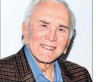
ଡଗ୍ଲାସ୍, ୨୨: ଦୀର୍ଘ ୭ ଦଶନ୍ଧି ଧରି ହଲିଉଡ୍ରେ ଅଭିନୟ କରିଥିବା କିମ୍ବଦନ୍ତୀ ଅଭିନେତା ଡଗ୍ଲାସ୍ ପରଲୋକ ହୋଇଛନ୍ତି। ତାଙ୍କୁ ୧୦୩ ବର୍ଷ ହୋଇଥିଲା। ମଞ୍ଚ ତଥା ଚଳଚ୍ଚିତ୍ର ଜଗତରେ ସେ ବିଭିନ୍ନ ଭୂମିକାରେ ଅଭିନୟ କରି ବେଶ୍ ଲୋକପ୍ରିୟତା ହାସଲ କରିଥିଲେ। ୧୯୬୦ରେ ତାଙ୍କ ଅଭିନୀତ ଖାର୍ଗିକ୍ୟ୍ ଚଳଚ୍ଚିତ୍ରକୁ ୪ଟି ଓସ୍କାର ପୁରସ୍କାର ମିଳିଥିଲା। ୧୯୧୬ରେ ନ୍ୟୁୟାର୍କରେ ଜନ୍ମିତ ତତ୍କାଳୀନ ୧୯୪୯ରେ ଚଳଚ୍ଚିତ୍ର 'ଗାମ୍ଭୀର୍ଯ୍ୟ' ପ୍ରଥମ ଥର ପାଇଁ ଓସ୍କାର ନିମନ୍ତେ ମନୋନିତ ହୋଇଥିଲା। ତାଙ୍କ ପୁଅ ମିଚେଲ ତତ୍କାଳୀନ ମଧ୍ୟ ଜଣେ ଓସ୍କାର ବିଜୟୀ ଅଭିନେତା।