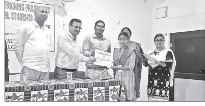
ପ୍ରଶିକ୍ଷଣ ଶିବିରରେ ଅତିଥିମାନେ ଛାତ୍ରୀଙ୍କୁ ପ୍ରମାଣପତ୍ର ପ୍ରଦାନ କରୁଛନ୍ତି।