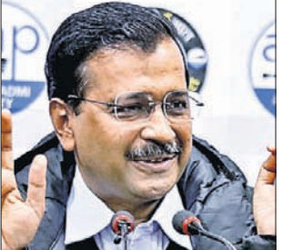
ଖବରତାପା ସମ୍ପର୍କରେ ଦିଲ୍ଲୀ ମୁଖ୍ୟମନ୍ତ୍ରୀ ଅରବିନ୍ଦ କେଜ୍ରିୱାଲ

ବେଆଇନ କଲୋନୀଗୁଡ଼ିକୁ ନେଇ ଭାଜପା ଲୋକଙ୍କୁ ବୋକା ବନାଇଥିଲା। ଏବେ ଆଉ ତାହା ଚଳିବ ନାହିଁ। ପ୍ରକାଶ