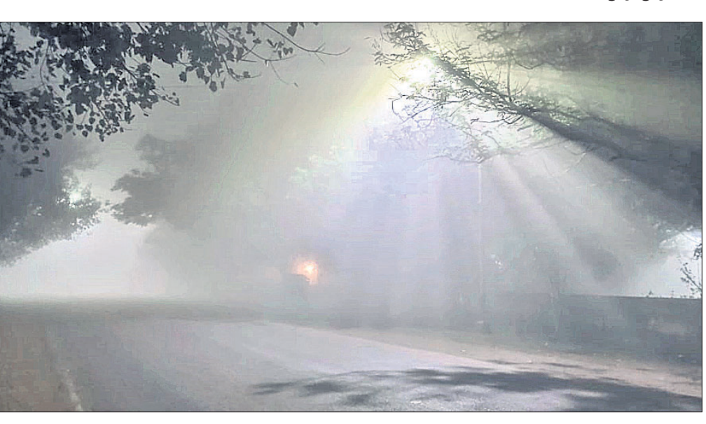
ବୁଧବାର ରାତିରେ ଅନୁଗୋଳ ସହରରେ ଘନ କୁହୁଡ଼ି ଆସୁଅଛି।

ଅନୁଗୋଳ ଅଫିସ, ୨୨: ପାଗରେ ପରିବର୍ତ୍ତନ ଯୋଗୁ ଗତ ଦୁଇଦିନ ଧରି ଅନୁଗୋଳରେ ବର୍ଷା ସହ କୋହଲି ପାଗ ଜନଜୀବନକୁ ଅସୁବିଧା ସୃଷ୍ଟି କରିଦେଇଛି। ମଙ୍ଗଳବାର ରାତିରେ ଜିଲ୍ଲାର ବିଭିନ୍ନ ସ୍ଥାନରେ ବର୍ଷା ହୋଇଥିବା ବେଳେ ବୁଧବାର ମଧ୍ୟ କେତେକ ସ୍ଥାନରେ ବର୍ଷା ହୋଇଥିବା ଜଣାପଡ଼ିଛି। ଏଥିଯୋଗୁ ବୁଧବାର ଦିନ ତମାମ କୋହଲି ପାଗ ରହିଥିଲା। ତେବେ ରାତିରେ ଘନ କୁହୁଡ଼ି ଯାତାୟତରେ ପ୍ରତିବନ୍ଧକ ସାଜିଥିଲା। ସହର ମଧ୍ୟ ଦେଇ ଯାଉଥିବା ୫୫୯ ନଂ. କାଟାୟ ରାଜପଥ ହେଉ କି ଅନ୍ୟାନ୍ୟ ରାସ୍ତାରେ ଗାଡ଼ି ଚଳାଚଳ କଷ୍ଟକର ହୋଇପଡ଼ିଥିଲା। ଏପରିକି ରାସ୍ତାରେ ଶୁଣ୍ଠି ଲାଜର୍ ଲାଗିଥିବା ସତ୍ତ୍ୱେ ଘନ ଅକ୍ଷକାର ଭଳି ଦୃଶ୍ୟମାନ ହେଉଥିଲା। ଗୁରୁବାର ପୂର୍ବାହ୍ନ ପର୍ଯ୍ୟନ୍ତ ଏପରି ଘନ କୁହୁଡ଼ି ଆସୁଅଛି ବୋଲି କୁହାଯାଇଛି। ଏକାକ ୧୦ଟା ପରେ କୁହୁଡ଼ି ହ୍ରାସ ପାଇଥିଲେ ବି କୋହଲି ପାଗରେ ପରିବର୍ତ୍ତନ ଦେଖାଯାଇ ନ ଥିଲା। ଜିଲ୍ଲାପାଳଙ୍କ କାର୍ଯ୍ୟକାଳରେ ଥିବା ପାଣିପାଗ ବିଭାଗ ପକ୍ଷରୁ ମିଳିଥିବା ସୂଚନା ମୁତାବକ ଜିଲ୍ଲାରେ ସର୍ବନିମ୍ନ ତାପମାତ୍ରା ୧୨.୬ ଡିଗ୍ରୀ ଥିବାବେଳେ ସର୍ବାଧିକ ୨୫.୧ ରହିଥିଲା। ଏପରି ପାଗ ଆଉ ଦିନେ ଦୁଇଦିନ ପର୍ଯ୍ୟନ୍ତ ଲାଗି ରହିବ ବୋଲି ପାଣିପାଗ ବିଭାଗ ପକ୍ଷରୁ କୁହାଯାଇଛି।