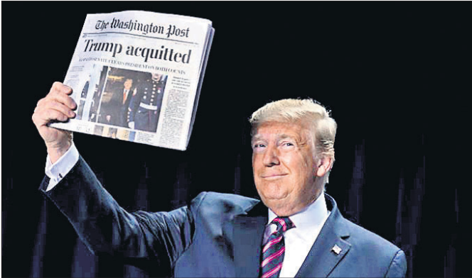
ଆମେରିକା ରାଷ୍ଟ୍ରପତି ଡୋନାଲ୍ଡ ଟ୍ରମ୍ପ ମହାଭିଯୋଗରୁ ବୋଧମୁକ୍ତ ହେବା ସମ୍ପର୍କିତ ଖବର 'ଓଷ୍ଟିନ ପୋଷ୍ଟ'ରେ ପ୍ରକାଶ ପାଇବାପରେ ସେ ଉକ୍ତ ଖବରକାଗଜକୁ ଦେଖାଉଛନ୍ତି।

ସ୍ୱରାଷ୍ଟ୍ରମନ୍ତ୍ରୀ ଅମିତ୍ ଶାହା ଉଭୟ ଏଏପି ଏବଂ କଂଗ୍ରେସକୁ ସମାଲୋଚନା କରିଛନ୍ତି। ଶାହିନବାଗରେ ଚାଲିଥିବା ସିଏଏ ବିରୋଧୀ ବିକ୍ଷୋଭ ଏହି ଦୁଇଦଳର ଜଏଣ୍ଟ ଭେଷ୍ଟର। ନିର୍ବାଚନ ଫଳ ପ୍ରକାଶ ପାଇଲେ 'ରୁକ୍ଷତେ ରୁକ୍ଷତେ ଗ୍ୟାଙ୍ଗ୍'କୁ ଝଟକା ଲାଗିବ ବୋଲି ଶାହା ଏକ ରୋଡ୍ ଶୋ' ବେଳେ ଦୃଢ଼ଭାବେ ପ୍ରକାଶ କରିଛନ୍ତି। କଂଗ୍ରେସ ପୁଖ୍ୟପାତ୍ର ରଣଦୀପ ସିଂ ସୁର୍ଜେଫ୍ରେଣ୍ଡା କହିଛନ୍ତି, ଗତବର୍ଷ ହରିୟାଣା ବିଧାନସଭା ନିର୍ବାଚନରେ ଆମ ପ୍ରଦର୍ଶନରେ ଉନ୍ନତି ଆସିଥିଲା। ଏଥର ଦିଲ୍ଲୀ ନିର୍ବାଚନରେ ମଧ୍ୟ ଆମେ ଭଲ କରିବୁ। କେନ୍ଦ୍ରର ଭାଜପା ଓ ଦିଲ୍ଲୀର ଏଏପି ସରକାର ମିଥ୍ୟାର ସରକାର। ଜାତୀୟ ରାଜଧାନୀରେ ଏଏପି ପୁଣିଥରେ 'ଦଙ୍ଗଲଫୁଲ' ସରକାର' ଆଣିବା ପାଇଁ ଉଦ୍ୟମ ଚଳାଇଥିବାବେଳେ ଭାଜପା 'ଦଙ୍ଗା ସରକାର' ଚାହୁଁଛି। ଆମେ 'ଦିଲ୍ଲୀଫୁଲ' ସରକାର' ଆଣିବୁ ବୋଲି ସୁର୍ଜେଫ୍ରେଣ୍ଡା କହିଛନ୍ତି। ଇତିମଧ୍ୟରେ ନିର୍ବାଚନ କମିଶନ (ଇସି) ଯୁଦ୍ଧ ମୁଖ୍ୟମନ୍ତ୍ରୀଙ୍କୁ କାରଣଦର୍ଶୀ ଅନେତ୍ରୀ ଭାବେ କହିଛନ୍ତି। କେଜ୍ରିୱାଲ ଶାହିନବାଗରେ ଆତଙ୍କବାଦୀଙ୍କୁ ଦିରିୟାନ୍ ଖୁଆଉଛନ୍ତି ବୋଲି ଯୋଗା ଏକ ସଭାରେ ମନ୍ତବ୍ୟ ଦେଇଥିଲେ। ସେ ନିର୍ବାଚନ ଆଚରଣ ବିଧି ଭଙ୍ଗିଥିବା କହିଥିବା ଦର୍ଶାଇ ଇସି ଶୁଣ୍ଠିଦାନ କରିଥିବା ସତ୍ୟକୁ ଉପସ୍ଥାପନ କରିବାକୁ ଆପଣଙ୍କୁ ଅପରାଧୀ ଘୋଷଣା କରିବାରୁ ନିର୍ଦ୍ଦେଶ ଦେଇଛନ୍ତି।