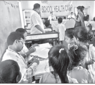
ଛାତ୍ରୀଛାତ୍ରୀଙ୍କ ସ୍ୱାସ୍ଥ୍ୟ ପରୀକ୍ଷା କରାଯାଇଛି।

ଚାଳଚ୍ଚେ, ୬୧୨(ନି.ପ୍ର.) ଏନିପିସି ପରିଚାଳନାଧୀନ ଚାଳଚ୍ଚେର ଅର୍ଥନୀତି ପକ୍ଷରୁ ଚାଳଚ୍ଚେର ବୁକ୍ କରମାଧିପୁର ସ୍ତ୍ରୀମାନଙ୍କୁ ଏକ ସ୍ୱାସ୍ଥ୍ୟ ଶିବିର ଅନୁଷ୍ଠିତ ହୋଇଯାଇଛି। ଜେନେରାଲ ମ୍ୟାନେଜର