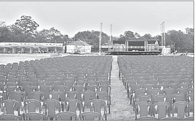
ଅନୁଗୋଳ ଷ୍ଟାଡ଼ିୟମରେ ଜିଲା ମହୋତ୍ସବ ପାଇଁ ପ୍ରସ୍ତୁତି।

ଅନୁଗୋଳ ଜିଲା ମହୋତ୍ସବ ଶୁକ୍ରବାରଠାରୁ ଆରମ୍ଭ ହେବ। ଏଥିପାଇଁ ସମସ୍ତ ପ୍ରସ୍ତୁତି ଶେଷ ହୋଇଥିବା ବେଳେ ଏଥିରେ ସାମିଲ ହେବାକୁ ସହରବାସୀଙ୍କ ମଧ୍ୟରେ ଉତ୍ସାହ ବଢ଼ିଯାଇଛି। ରଞ୍ଜନ ଆଲୋଚନାରେ ଅନୁଗୋଳ ଷ୍ଟାଡ଼ିୟମକୁ ସାଜସଜ୍ଜା କରାଯାଇଛି। ରାଜ୍ୟ ବାହାରର ଲୋକନୃତ୍ୟ ଦଳ ଓ କଳାକାରମାନେ ମଧ୍ୟ ଅନୁଗୋଳରେ ପହଞ୍ଚିଛନ୍ତି। ସନ୍ଧ୍ୟା ସାଢ଼େ ୫ଟାରେ ଉଦ୍‌ଘାଟନା କାର୍ଯ୍ୟକ୍ରମ ପରେ ଜିଲାର ଶ୍ରେଷ୍ଠ କଳାକାରମାନେ ସେମାନଙ୍କ କଳାର ଝଲକ ମଞ୍ଚରେ ଦେଖାଇବେ। ଏହି କାର୍ଯ୍ୟକ୍ରମରେ ଓଲିଉଡର ଅନେକ ତାରକାଙ୍କୁ ଦେଖିବାକୁ ମିଳିବ। ଲୁଚୁନ୍ ରୁଚୁନ୍ ତ୍ୟାନ୍ତ୍ର ଗୁପ୍ତ ମହୋତ୍ସବର ସନ୍ଧ୍ୟାକୁ ମନୁଆଲା କରିବ ବୋଲି ଜିଲା ସଂସ୍କୃତି ପରିଷଦ ପକ୍ଷରୁ କୁହାଯାଇଛି। ଗୁରୁବାର ଜିଲାପାଳଙ୍କ ଅଧ୍ୟକ୍ଷତାରେ ଏ ନେଇ ଏକ ଗୁରୁତ୍ୱପୂର୍ଣ୍ଣ ବୈଠକ ବସି ମହୋତ୍ସବକୁ କିପରି ଶାନ୍ତି