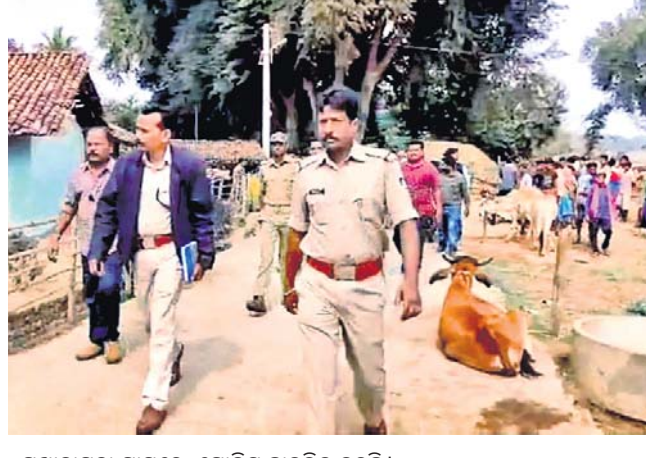
ପଖାନାଗୁଡ଼ା ଗ୍ରାମରେ ପୋଲିସ ଛାନଭିନ କରୁଛି ।