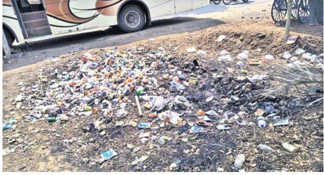
ଆବର୍ଜନାରେ ପଡ଼ିଥିବା ପଲିଥିନ ଓ ପ୍ଲାଷ୍ଟିକ ବୋତଲ ।

ପଲିଥିନର ବ୍ୟାପକ ବ୍ୟବହାର ଯୋଗୁ ପରିବେଶ ପ୍ରଦୂଷିତ ହେବାରେ ଲାଗିଛି । ସହରରେ ଆବର୍ଜନା ଭାବେ ସଂଗୃହିତ ପଲିଥିନରୁ ନିଆଁ ଲଗାଇ ଦିଆଯାଉଛି । ଫଳରେ ଧୂଆଁ ବାହାରି ପରିବେଶ ପ୍ରତି ବିପଦ ସୃଷ୍ଟି କରୁଛି । ପ୍ରକୃତରେ ଠିକ୍ ରାଜ୍ୟ ସରକାର ପଲିଥିନ ଉପରେ କଟକଣା ଲାଗାଇଥିବା ବେଳେ ଅଧିକାରୀଙ୍କ ଦୁଇ ତାରିଖ ବାକି କରୁଛନ୍ତି ଯେଉଁଥିରେ କଟକଣା ଲାଗାଇଥିଲେ ମଧ୍ୟ ଏହା ପରେ ୨୦୦ ଏମଏଚ୍ ପଲିଥିନ ପୁରୁଯାନୀୟ ବୋତଲ, ପାଣି ପାଉଁଟ, ମଦ ପାଉଁଟ ସବୁଠାରୁ ଅଧିକ ସମସ୍ୟା ସୃଷ୍ଟି କରୁଛି । ସବୁଠାରୁ ଗୁରୁତ୍ୱପୂର୍ଣ୍ଣ କଥା ହେଲା ଦିବାହ ଭୋଜିରୁଟିକରେ ଖୁଲମଖୁଲା ଭାବେ ପଲିଥିନ ଆଣି ବିକ୍ରି କରାଯାଉଛି । ଦୋକାନୀଗୁଡ଼ିକରେ ଗ୍ରାହକଙ୍କୁ ପଲିଥିନରେ ସରଦା ଦିଆଯାଉଥିବା ବେଳେ ବନ୍ଧାରେ