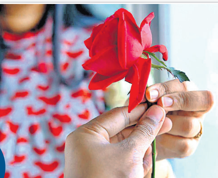
ସହ ସ୍ମରଣଶକ୍ତି ବଢ଼ିଥାଏ। ସାବଧାନ! ଗୋଲାପ ଅଗରବତୀ ଲଗାଇଲେ ସମୟରେ ଏହା ଯେମିତି ସ୍ୱାସ୍ଥ୍ୟ ପ୍ରତି କୁପ୍ରଭାବ ନ ପକାଏ। ଏଥିପାଇଁ ଯତ୍ନବାନ ହେବା ଜରୁରୀ।