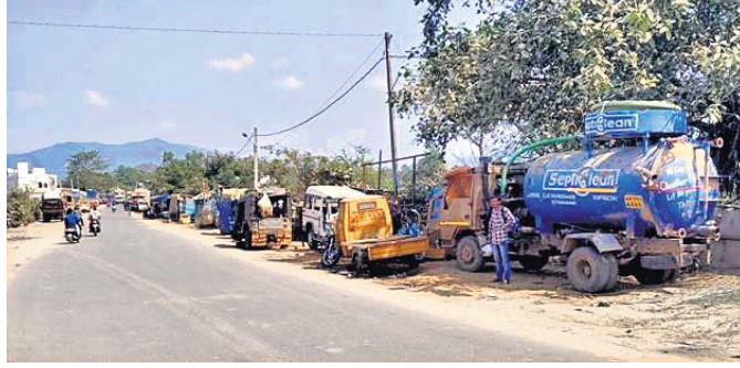
ଜୟପୁର ଗାନ୍ଧୀବଜାର-ପୁରୁଣାଗଡ଼ ରାଜପଥ ପାର୍ଶ୍ଵରେ ଜବରଦସ୍ତୀ

ଜୟପୁର ସହରର ଗାନ୍ଧୀବଜାର ମାଲକାନଗିରିକୁ ସଂଯୋଗ କରୁଥିବା ୩୨୬୨ ନମ୍ବର ଜାତୀୟ ରାଜପଥ କୋଲାବ ଭିତ୍ତିଭିତ୍ତି ବିଭାଗର କେନାଲ ପାର୍ଶ୍ଵ ଜମି ଏବେ ଜବରଦସ୍ତୀରେ ରହିଛି। ମାଫିଆମାନେ ଏହାକୁ ଅଧିକାର କରି ଦୋକାନ, ମନ୍ଦିର ଓ ଗୋଷାଳା ନିର୍ମାଣ କରିଥିବା ଯୋଗୁ ରାଜପଥ ସମ୍ପର୍କ ହେବା ସହ ଯାତାୟତରେ ସମସ୍ୟା ହେଉଛି। କେତେକ ମାଫିଆ ଓ ଗୁଣ୍ଡାଶ୍ରେଣୀର ଲୋକେ ୧୦ ହଜାର ଟଙ୍କାରେ ଉଚ୍ଚ ଜମିକୁ ଦୋକାନୀକୁ ବିକ୍ରି କରୁଛନ୍ତି। କେନାଲ ପ୍ରତି ବିପଦ ଥିବାବେଳେ ଏହା ପାର୍ଶ୍ଵ ସଫେଇ କରିବାରେ ସମସ୍ୟା, ଆବର୍ଜନା ପାଣି କେନାଲରେ ପଶିବା ସହ ଗାଈ ଓ ଲୋକଙ୍କ ଗାଧୁଆ ପାଇଁ ବ୍ୟବହୃତ ପାଣି ବିଷାକ୍ତ ହେବାର ଆଶଙ୍କା ରହିଛି।