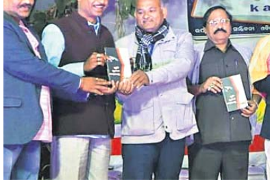
କବିତା ସକଳନକୁ ଅର୍ପଣକରି ଉନ୍ନୋଦନ କରୁଛନ୍ତି ।