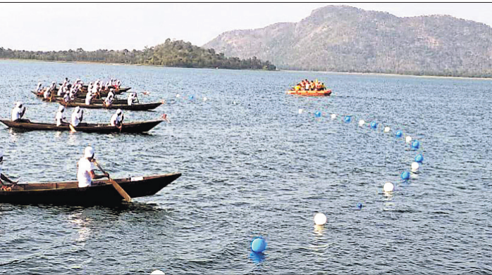
ମାଲକାନଗିରି ଜିଲାର ଲୋକପର୍ବ 'ମାଲ୍ୟବତ' ଅବସରରେ ଗୁରୁବାର ସତ୍ୟଗୁଡ଼ା ତ୍ୟାଗରେ ଆୟୋଜିତ ନୌଚାଳନା ପ୍ରତିଯୋଗିତା ।

ପକ୍ଷରୁ ସ୍ୱସ୍ତ୍ୱ କରାଯାଇଛି। ଏୟାରଲାଇନ୍‌ରୁ ଆହୁରି କହିଲେ ଯେ, ପ୍ରାୟ ୨୮୧.୮୨ କୋଟି ଟଙ୍କା ଆଉ ଆଦାୟ ହେବ ନାହିଁ ବୋଲି ଧରି ନେଇ ଏୟାର ଇଣ୍ଡିଆର ଆକାଉଣ୍ଟ ଖାତାରେ ଉଲ୍ଲେଖ କରାଯାଇଛି। ପ୍ରକାଶ ଯେ, ୨୦୧୯ ଡିସେମ୍ବର ୪ ପୃଷ୍ଠା ଏୟାର ଇଣ୍ଡିଆର ନେଟ୍ ସ୍ଥିତି ପରିମାଣ ୮, ୫୫୬.୩୫ କୋଟି ଟଙ୍କା