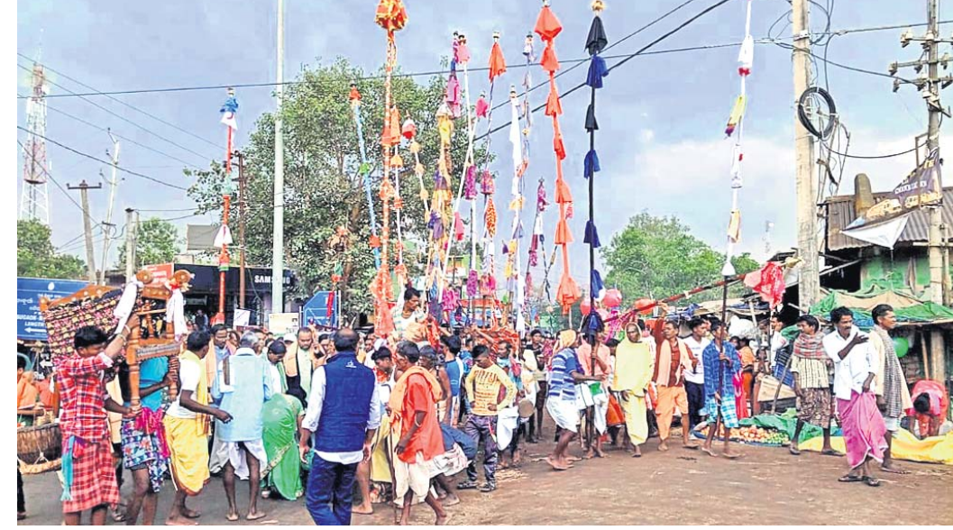
ଲାଠି, କୁର୍ସିକୁ ଶୋଭାଯାତ୍ରାରେ ନଗର ପରିକ୍ରମା କରାଯାଇଛି ।

ନବରଙ୍ଗପୁର ଜିଲ୍ଲା ଡାକୁଗାଁ ବ୍ଲକ ସଦରମହକୁମାଠାରେ ଆଦିବାସୀଙ୍କ ପର୍ବ ମାଘ ମଣ୍ଡେଇ ଗୁରୁବାର ପାଳିତ ହୋଇଯାଇଛି । ତୁରୀ, ବାଦ୍ୟ, ଚାଳକ, ମାଦକ ବାଦ୍ୟର ତାଳେତାଳେ ଶେଷ ହୋଇଛି ଏହି ଉତ୍ସବ । ଏଥିରେ ଡାକୁଗାଁ ବ୍ଲକ ସମେତ ଆଖପାଖ ୧୦୦ ଟି ଗ୍ରାମକୁ ଲାଠି, କୁର୍ସି ଓ ପାଲିକି ଅଣାଯାଇ ଭୈରବ ମନ୍ଦିରରେ ପୂଜାର୍ଚ୍ଚନା ହୋଇଥିଲା । ଅପରାହ୍ନରେ ସମସ୍ତ ଲାଠି, କୁର୍ସି ମା' ଦୁର୍ଗାଙ୍କୁ ନିକଟରେ ଧରିବାରୁ ବାହାରି ନଗର ପରିକ୍ରମା କରି ଭୈରବ ମନ୍ଦିରରେ ଏକତ୍ରିତ ହୋଇଥିଲେ । ପୂଜାରୀ ଶିବାମାନେ ସାକ୍ଷୀ ହୋଇ ଖଣ୍ଡା ଧରି ନୃତ୍ୟ ପରିବେଷଣ କରିଥିଲେ । ଲାଠି, କୁର୍ସି, ଶିରୀ, ଦିଶାରିମାନେ ବାଦ୍ୟର ତାଳେ ତାଳେ ନୃତ୍ୟ କରି ମନ୍ଦିରଠାରେ