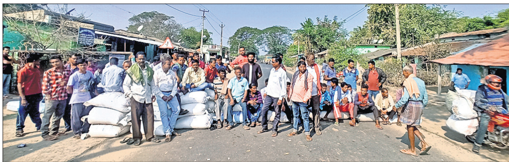
ଚାଷୀମାନେ ଧାନବସ୍ତ୍ରା ରଖି ରାସ୍ତା ଅବରୋଧ କରିଛନ୍ତି।