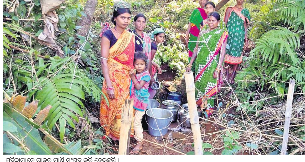
ମହିଳାମାନେ ଗାଡ଼ି ପାଣି ସଂଗ୍ରହ କରି ନେଉଛନ୍ତି।