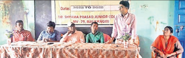
କାର୍ଯ୍ୟକ୍ରମରେ ମଞ୍ଚସାଧନ ଅତିଥି।

ମାଲକାନଗିରି ଜିଲ୍ଲା କାଲିମେଳା ବ୍ଲକ ଅଧୀନ ଏମ୍.ଭି-୭୯ର ଡ଼ା ଶ୍ୟାମା ପ୍ରସାଦ ଉଚ୍ଚ ମାଧ୍ୟମିକ ବିଦ୍ୟାଳୟରେ ଛାତ୍ରୀମାନଙ୍କ ପାଇଁ ଏକ ଆତ୍ମରକ୍ଷା ତାଲିମ ଶିବିର ଉଦ୍‌ଘାଟିତ ହୋଇଛି।