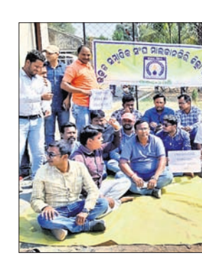
ଧାରଣାରେ ବସିଥିବା ଖବରଦାତାମାନେ।

ମାଲକାନଗିରିରେ ଖବରଦାତାଙ୍କୁ ମାଡ଼ ପ୍ରତିବାଦରେ ଜିଲ୍ଲାରେ କାର୍ଯ୍ୟରତ ଖବରଦାତାମାନେ ଗୁରୁବାର ଏସ୍‌ପି କାର୍ଯ୍ୟାଳୟ ଘେରାଇ କରି ସେଠାରେ ବିଶୋଭ ପ୍ରଦର୍ଶନ କରିଛନ୍ତି।