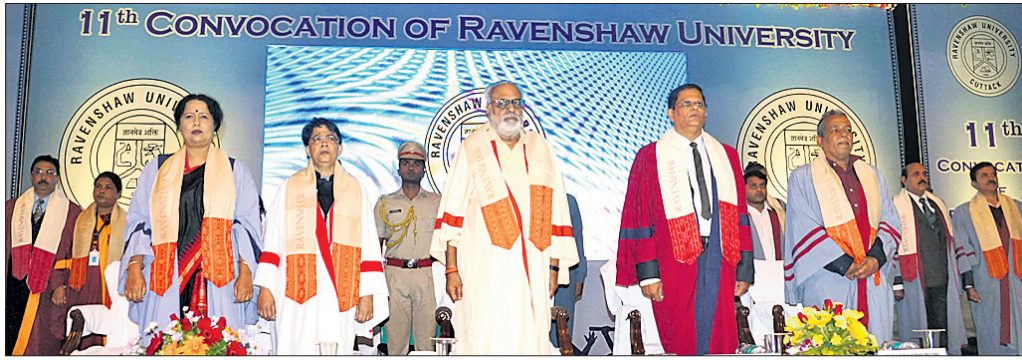
ସମାବର୍ତ୍ତନ ଉତ୍ସବରେ ରାଜ୍ୟପାଳ ପ୍ରଫେସର ଗଣେଶୀ ଲାଲ ଏବଂ ଉପସ୍ଥିତ ଅନ୍ୟ ଅତିଥିମାନେ।