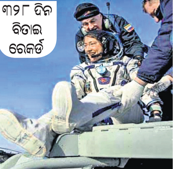
୩୨୮ ଦିନ ବିତାଇ ରେକର୍ଡ

ଓଶିଂଟନ: ମହାକାଶରେ ଅଧିକ ଦିନ ରହି ରେକର୍ଡ କରିଥିବା ଆମେରିକାର ମହାକାଶ ଯାତ୍ରୀ କ୍ରିଷ୍ଟିନା କୋର୍ ପୁଅବାକୁ ଫେରିଛନ୍ତି। ସେ ମହାକାଶରେ ୩୨୮ ଦିନ ବିତାଇ ରେକର୍ଡ କରିଛନ୍ତି। ଏନେଇ ନାସା ପକ୍ଷରୁ ସୂଚନା ଦିଆଯାଇଛି। କ୍ରିଷ୍ଟିନା କୋର୍ଙ୍କ ସହିତ ସୁରୋପାୟା ମହାକାଶ ଏଜେନ୍ସିର ମହାକାଶ ଯାତ୍ରୀ ଲକା ପରମିତାନୋ ଏବଂ ରୁଷିଆର ଆଲେକ୍ସାଣ୍ଡର ସ୍କୋଭରୋଭୋ ମଧ୍ୟ ଫେରିଆସିଛନ୍ତି। ରୁଷିଆର ଭାରତୀୟ ସମୟ ପୂର୍ବାହ୍ନ ୧୧ଟା ୨୦ରେ ସେମାନେ ଫେରିବା ଆରମ୍ଭ କରିଥିଲେ। ୩ ଘଣ୍ଟା ୨୨ ମିନିଟ୍ ପରେ ଅପରାହ୍ନ ୨ଟା ୪୨ରେ କାକାକସ୍ତାନର କେକ୍ସ୍‌କ୍ସ ସହରର ଦକ୍ଷିଣ ପୂର୍ବରେ ଭୂପୃଷ୍ଠରେ ପାଦଦେଇଛନ୍ତି। କ୍ରିଷ୍ଟିନା ୨୦୧୯ ମାର୍ଚ୍ଚ ୧୪ରେ ମହାକାଶ ଯାତ୍ରା କରିଥିଲେ ବୋଲି ନାସା ପକ୍ଷରୁ କୁହାଯାଇଛି।