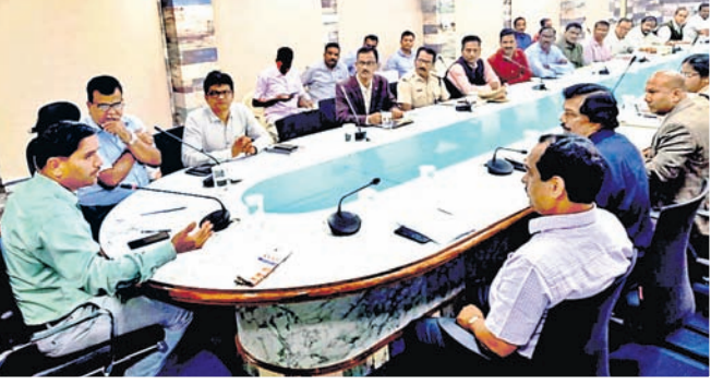
ବୈଠକରେ ଉପସ୍ଥିତ ଜିଲ୍ଲାପାଳ ଓ ଅନ୍ୟମାନେ ।