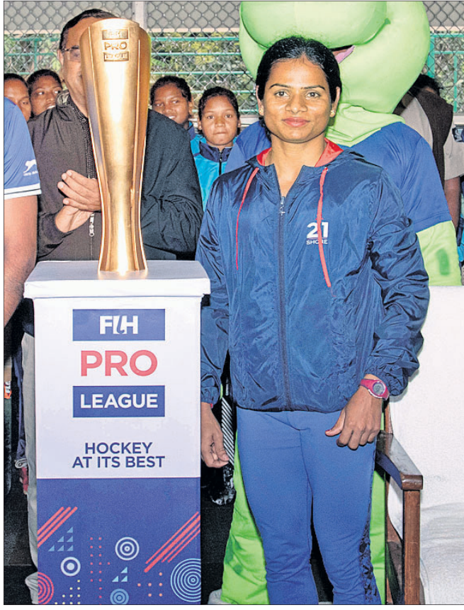
ଏଫଆଇଏଚ୍‌ଏ ହକି ପ୍ରୋ ଲିଗ୍ ଟ୍ରଫି ନିକଟରେ ଭାରତୀୟ ସ୍ତ୍ରୀ କ୍ଲବ୍ ଦୁର୍ଗା ଚାନ୍ଦ।