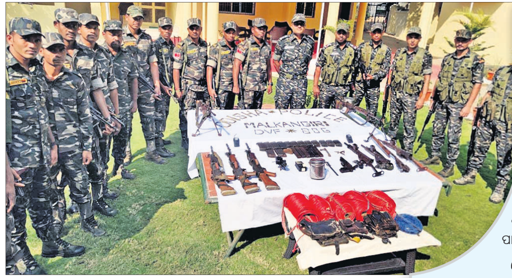
ଜବତ ମାଓବାଦୀ ସାମଗ୍ରୀ ସହ ଯବାନମାନେ ।