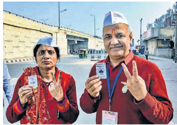
ଭୋଟ ଦେବାପରେ ବିଜୟ ସଂକେତ ଦେଖାଇଛନ୍ତି ଉପମୁଖ୍ୟମନ୍ତ୍ରୀ ମନିଷ୍ ସିଂହପାଣିଆ। ସାଙ୍ଗରେ ସ୍ତ୍ରୀ ସାମା।