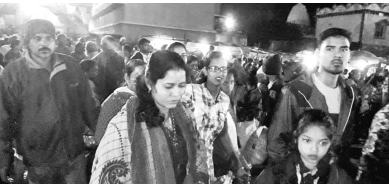
ମାଘ ମେଳାରେ ଶ୍ରଦ୍ଧାଳୁଙ୍କ ଭିଡ଼ ।