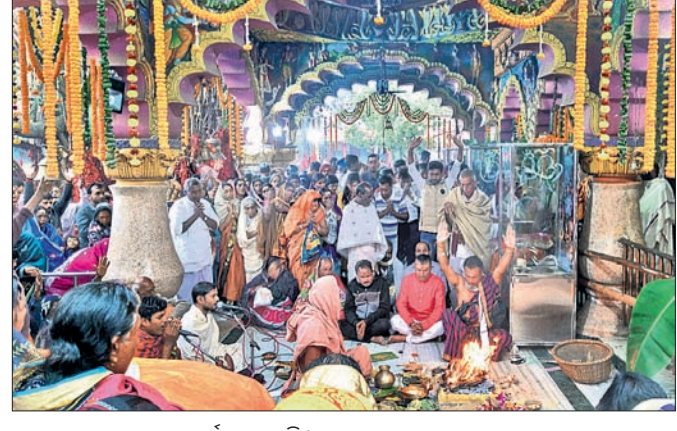
ଗୋରଖନାଥଙ୍କ ଶ୍ରଦ୍ଧାକୁ ଦର୍ଶନ କରୁଛନ୍ତି।

ଜିଲ୍ଲା ଆଇନସେବା ପ୍ରାଧିକରଣ ପକ୍ଷରୁ ରାଷ୍ଟ୍ରୀୟ ଲୋକ ଅଦାଲତ