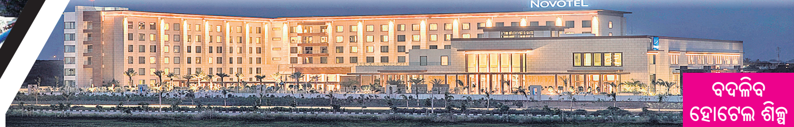
ବଦଲିବ ହୋଟେଲ୍ ଶିଳ୍ପ