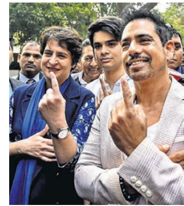
କଂଗ୍ରେସ ନେତା ପ୍ରିୟଙ୍କା ଗାନ୍ଧୀ ଭଦ୍ରା, ପୁଅ ରେହାନ (ନୂଆ ଭୋଟର) ଓ ସ୍ୱାମୀ ରବିଟ୍ ଭଦ୍ରା।