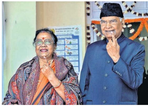
ରାଷ୍ଟ୍ରପତି ରାମନାଥ କୋବିନ୍ଦଙ୍କ ସହ ଧର୍ମପତ୍ନୀ ସବିତା କୋବିନ୍ଦ।