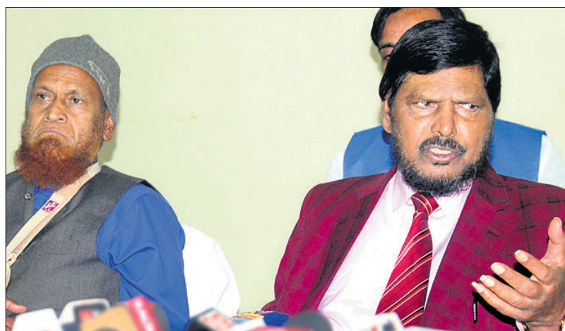
ଖବରବାତା ସମ୍ମିଳନୀରେ କେନ୍ଦ୍ରମନ୍ତ୍ରୀ ରାମଦାସ ଅଠାଝଲେ।

ଆୟୋଜିତ ଏକ ଖବରବାତା ସମ୍ମିଳନୀରେ ସେ କହିଛନ୍ତି ଯେ, ସାମାଜିକ ସମତା ଆଣିବା ପାଇଁ ସର୍ବୋତ୍ତମ ବିବାହକୁ ପ୍ରୋତ୍ସାହନ ଦେବା ଆବଶ୍ୟକ। ଆନ୍ଧ୍ର ଜାତି ବିବାହ ପାଇଁ ରାଜ୍ୟ ସରକାରଙ୍କ ପକ୍ଷରୁ ଅତ୍ୟଧିକ ଲକ୍ଷ ଟଙ୍କାର ସହାୟତା ରାଶି ଯୋଗାଇ ଦିଆଯାଉଥିବା ସ୍ଥଳେ ବିଧିବଦ୍ଧ ଆବେଦନ କରାଗଲେ କେନ୍ଦ୍ର ସାମାଜିକ ନ୍ୟାୟ ଓ ସଶକ୍ତୀକରଣ ମନ୍ତ୍ରାଳୟ ପକ୍ଷରୁ ଅତିରିକ୍ତ ଅତ୍ୟଧିକ ଲକ୍ଷ ଟଙ୍କାର ସହାୟତା ଯୋଗାଇ ଦିଆଯିବ। ସାରା ଦେଶରେ ବାର୍ଷିକ ୧ ଲକ୍ଷରୁ ଅଧିକ ଆନ୍ଧ୍ର ଜାତି ବିବାହ ହେଉଛି ବୋଲି ସେ କହିଛନ୍ତି। ତେବେ କେତେକ କ୍ଷେତ୍ରରେ କେବଳ ଅର୍ଥ ହାସଲ କରିବା ଲାଗି ଆନ୍ଧ୍ର ଜାତି ବିବାହ କରାଯାଉଥିବା ଦେଖିବାକୁ ମିଳିଛି। ଏପରି ମାମଲା ପ୍ରତି ରାଜ୍ୟ ସରକାର ବିଶେଷ ଦୃଷ୍ଟି ଦେବା ଆବଶ୍ୟକ ବୋଲି ମନ୍ତ୍ରୀ କହିଥିଲେ। ଆସନ୍ତା ଜନଗଣନା ବେଳେ ଜାତିଭିତ୍ତିକ ଜନଗଣନା ହେବା ସରକାର । ଓଡ଼ିଶା ମୁଖ୍ୟମନ୍ତ୍ରୀ ନବୀନ ପଟ୍ଟନାୟକ ଯେଉଁ ପ୍ରସ୍ତାବ ଦେଇଛନ୍ତି ତାହାକୁ ମୋର ସମର୍ଥନ ରହିଛି ବୋଲି ମନ୍ତ୍ରୀ କହିଛନ୍ତି। ଓଡ଼ିଶାରେ ୧ଲକ୍ଷ ୩୯ ହଜାରରୁ ଉର୍ଦ୍ଧ୍ୱ ଅନୁସୂଚିତ ଜାତି ଓ ଜନଜାତିର ଛାତ୍ରାଛାତ୍ରୀଙ୍କୁ ପ୍ରାୟ ମାସିକ ଛାତ୍ରବୃତ୍ତି ଦିଆଯାଉଥିବା ବେଳେ ୨ ଲକ୍ଷରୁ ଉର୍ଦ୍ଧ୍ୱ ଛାତ୍ରାଛାତ୍ରୀଙ୍କୁ ମାସିକ ପରବର୍ତ୍ତୀ ଛାତ୍ରବୃତ୍ତି ଯୋଗାଇ ଦିଆଯାଉଛି। ଅନୁସୂଚିତଜାତି ଓ ଜନଜାତିକ କଲ୍ୟାଣ ପାଇଁ ଗତ ଦୁଇଟି ଆର୍ଥିକ ବର୍ଷରେ ୮୩କୋଟି ଟଙ୍କା ଲେଖାଏ ଅନୁଦାନ ଯୋଗାଇ ଦିଆଯାଇଛି। ରାଜ୍ୟରେ ଅନୁସୂଚିତ ଜାତି ଓ ଜନଜାତିର ଛାତ୍ରାଛାତ୍ରୀଙ୍କ ପାଇଁ ୬ ହଜାର ଛାତ୍ରାପାସ ନିର୍ମାଣ କରାଯାଇଛି। କେନ୍ଦ୍ର ସରକାର ବିଦ୍ୟାଳୟ ସଶକ୍ତୀକରଣ ପାଇଁ ପ୍ରତିଷ୍ଠିତବଦ୍ଧ ବୋଲି ଅଠାଝଲେ କହିଛନ୍ତି। ସରକାର ବିଦ୍ୟାଳୟ