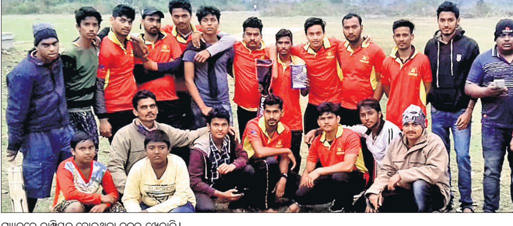
ମ୍ୟାଚ୍ରେ ଚାମ୍ପିୟନ ହୋଇଥିବା ଦଳର ଖେଳାଳି।

ଜଗତସିଂହପୁର ବୁକ୍ ଅନ୍ତର୍ଗତ ଶାଳକଙ୍କ ଅନ୍ତର୍ଗତ ଖେଳ ପଡିଆରେ ଜାନୁୟାରୀ ୨୫ ତାରିଖରୁ ଆରମ୍ଭ ହୋଇଥିବା ଗୋପବନ୍ଧୁ ଫେସ୍ଟିଭାଲ୍ କ୍ରିକେଟ୍ ଟୁର୍ନାମେଣ୍ଟ ଶନିବାର ଉଦ୍‌ଘାଟିତ ହୋଇଯାଇଛି। ଟୁର୍ନାମେଣ୍ଟ ଫାଇନାଲ୍ ମ୍ୟାଚ୍ରେ ରାଇଟ୍ ଷ୍ଟାର ଟୁର୍ନାମେଣ୍ଟ ଆୟୋଜକ ଇଲେଭେନ ଷ୍ଟାର ହେବାର ଚୋରବ ହାସଲ କରିପାରିଛି। ଏହି ଟୁର୍ନାମେଣ୍ଟରେ ଜିଲ୍ଲାର ମୋଟ ୧୨ ଦଳ ଭାଗ ନେଇଥିଲେ। ଶନିବାର ପାଗ ଖରାପ ଥିବାରୁ ଉଭୟ ସଂଖ୍ୟା ୨୦ରୁ ୧୨କୁ କମାଇ ଦିଆଯାଇଥିଲା। ଚନ୍ଦ୍ର ଚିତ୍ ରାଇଟ୍ ଷ୍ଟାର