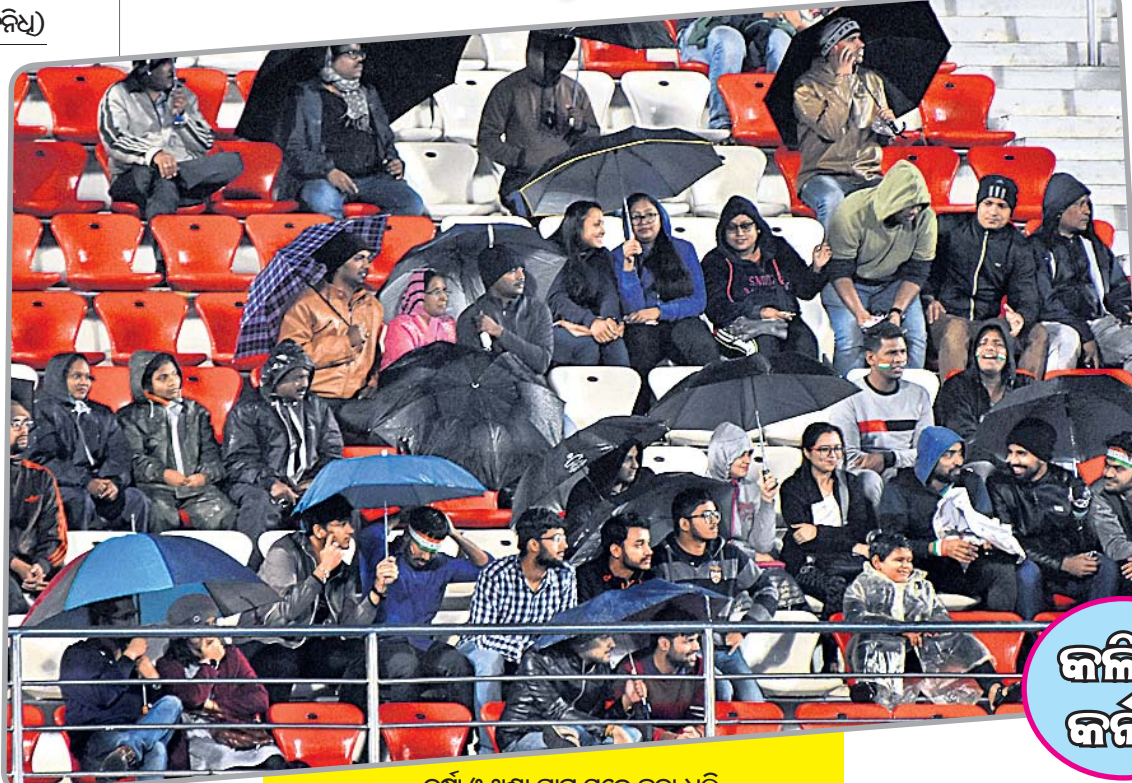
ବର୍ଷା ଓ ଅଣ୍ଡା ପାଗ ସତ୍ତ୍ୱେ ଛଡ଼ା ଧରି ମ୍ୟାଚ ଉପଭୋଗ କରୁଛନ୍ତି ହକି ପ୍ରଶଂସକ।