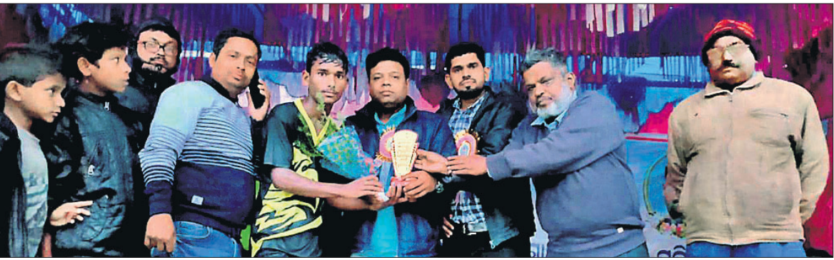
ଅତିଥି ଖେଳାଳିଙ୍କୁ ପୁରସ୍କୃତ କରୁଛନ୍ତି ।