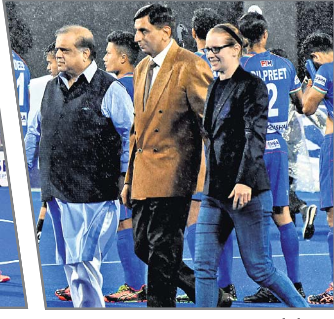
ଅତିଥି ଏଫଆଇଏଚ୍ ସଭାପତି ନରିନ୍ଦର ବାଗ୍ରା ହକି ଇଣ୍ଡିଆର କର୍ମକର୍ତ୍ତାଙ୍କ ସହ।