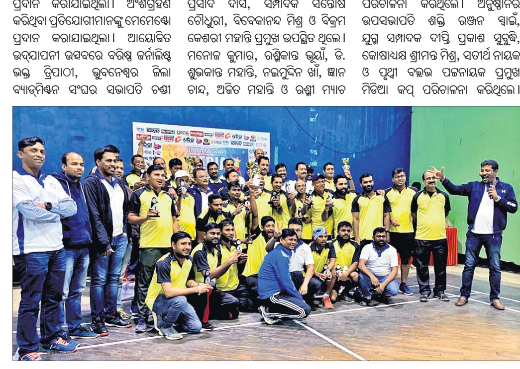
ଅତିଥିଙ୍କ ଗହଣରେ ପ୍ରତିଯୋଗୀ।