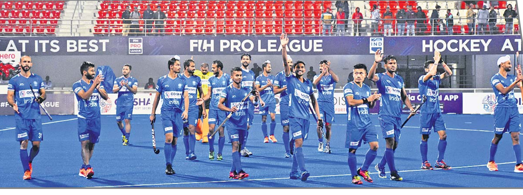
ଏଫଆଇଏଚ୍ ପ୍ରୋ ଲିଗ୍: ବେଲଜିୟମ ବିପକ୍ଷରେ ବିଜୟୀ ଭାରତୀୟ ଦଳ।