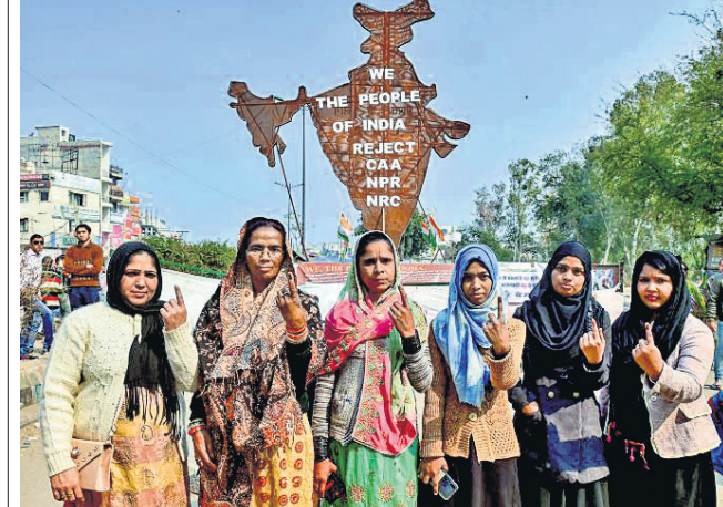
ସିଏଏ ବିରୋଧରେ ବିରୋଧ କରୁଥିବା ମହିଳା ମତଦାନୀମାନେ ଭୋଟ ଦେବା ପରେ ଅଲ୍‌ଜିଜା କାକି ଚିହ୍ନ ଦେଖାଇଛନ୍ତି।