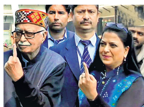
ବରିଷ୍ଠ ଭାଜପା ନେତା ଲାଲକୃଷ୍ଣ ଆଡ଼ଭାନୀଙ୍କ ସହ ଡିଆ ପ୍ରତିଭା।