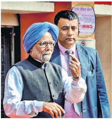
ଦିଲ୍ଲୀରେ ମତଦାନ ପରେ ଅଲ୍‌ଜିଜା କାକି ଚିହ୍ନ ଦେଖାଇଛନ୍ତି ପୂର୍ବତନ ପ୍ରଧାନମନ୍ତ୍ରୀ ମନମୋହନ ସିଂ।