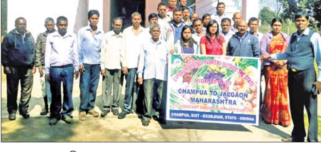
ମହାରାଷ୍ଟ୍ର ଯାତ୍ରା କରିଥିବା ଚାଷୀ।

■ ଘରକୁ ପାଣି ସଂଯୋଗ ବ୍ୟବସ୍ଥା ଆଇ ଆସୁଛି ପାଣି ■ ପାନୀୟଜଳ ଯୋଗାଣ ଯୋଜନା ବିଫଳ