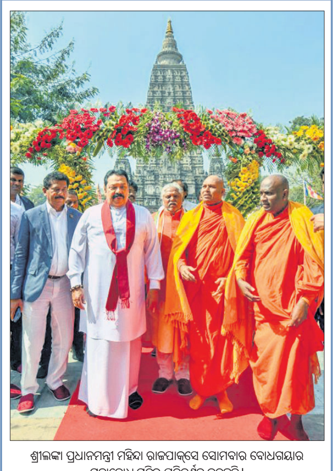
ଶ୍ରୀଲଙ୍କା ପ୍ରଧାନମନ୍ତ୍ରୀ ମହିନ୍ଦା ରାଜପକ୍ଷଙ୍କ ସୋମବାର ବୋଧଗୟାର ମହାବୋଧି ମନ୍ଦିର ପରିଦର୍ଶନ କରୁଛନ୍ତି।