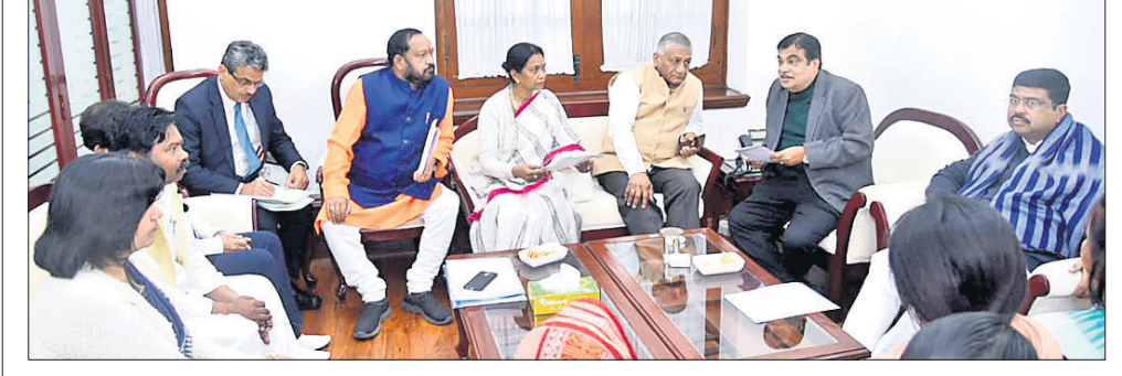
ରାଜ୍ୟ ସଭା ସଦସ୍ୟା ସରୋଜିନୀ ହେମ୍ବ କେନ୍ଦ୍ରମନ୍ତ୍ରୀଙ୍କ ସହ ଆଲୋଚନା କରୁଛନ୍ତି ।