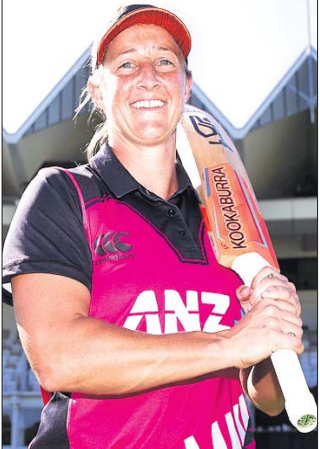
ସୋଫିଙ୍କ ଶତକ ଯୋଗୁଁ ଲୁକିଲାଣ୍ଡ ୨ ଉଇକେଟ୍ ହରାଇ ୧୭୧ ରନ୍ କରିଥିଲା। ଜବାବରେ ଦକ୍ଷିଣ ଆଫ୍ରିକା ୧୦୨ ରନ୍ରେ ଅଲଆଉଟ୍ ହୋଇଯାଇଥିଲା। ଫଳରେ ଘରୋଇ ଲୁକିଲାଣ୍ଡ ୬୯ ରନ୍ରେ ମ୍ୟାଚ୍ ଜିତି ନେଇଛି।

ଫ୍ଲୋରିନ, ୧୦/୧୨: ଲୁକିଲାଣ୍ଡ ମହିଳା କ୍ରିକେଟ୍ ଦଳର ଅଧିନାୟିକା ସୋଫି ଡେଭିନ ଯୋମାବାର ବିଶ୍ୱ ରେକର୍ଡର ଅଧିକାରୀ ହୋଇଛନ୍ତି। ସେ ବିଶ୍ୱର ପ୍ରଥମ ମହିଳା କ୍ରିକେଟର ଭାବେ କ୍ରମାଗତ ୫ ଟି ୨୦ ମ୍ୟାଚ୍ରେ ଅତିକମ୍ରେ ୫୦ କିମ୍ପା ଚା'ଠାରୁ ଅଧିକ ରନ୍ କରିଛନ୍ତି। ଦକ୍ଷିଣ ଆଫ୍ରିକା ବିପକ୍ଷରେ ଖେଳାଯାଇଥିବା ମ୍ୟାଚ୍ରେ ସେ ୧୦୫ ରନ୍ରେ ଶତକୀୟ ଇନିଂସ ଖେଳିଛନ୍ତି। ପୂର୍ବରୁ ସେ ଭାରତ ବିପକ୍ଷ ସିରିଜରେ ୬୨ ରନ୍ କରିଥିଲେ। ଏହାପରେ ଦକ୍ଷିଣ ଆଫ୍ରିକା ବିପକ୍ଷ ୩ ମ୍ୟାଚ୍ରେ ଯଥାକ୍ରମେ ୫୪*, ୬୧ ଓ ୭୭ ରନ୍ରେ ଇନିଂସ ଖେଳିଥିଲେ। ଭାରତୀୟ ବ୍ୟାଟ୍ସମ୍ୟାନ ମିଥାଲି ରାଜ, ପୂର୍ବତନ ଲୁକିଲାଣ୍ଡ ପୁରୁଷ ଦଳର ଅଧିନାୟକ ଟ୍ରେଣ୍ଡନ ମ୍ୟାକ୍‌ଲୁଲିଫ ଓ ଫ୍ରେଜ୍‌ଭେଣ୍ଡିକ ଓପନର କ୍ରମ୍ ରେଲ୍ ଅଧିକାରୀୟ ଟି୨୦ରେ କ୍ରମାଗତ ୪ ଥର ୫୦ରୁ ଊର୍ଦ୍ଧ୍ୱ ରନ୍ କରିଥିଲେ। ଉଲ୍ଲେଖଯୋଗ୍ୟ,