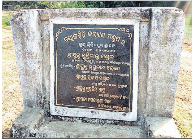
ବୟାଜଡ଼ିଆ ପଞ୍ଚାୟତ କଲ୍ୟାଣ ମଣ୍ଡପର ଶିଳାମାଧ୍ୟ ପତ୍ର।