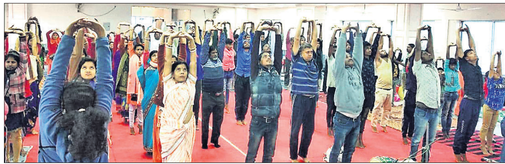
ଆୟୋଜିତ ଯୋଗ ଶିବିର।