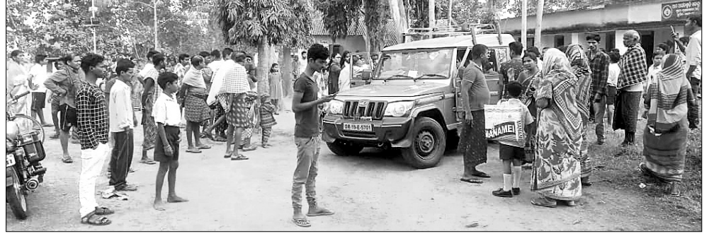
ଅସୁସ୍ଥ ପିଲାମାନଙ୍କୁ ସ୍କୁଲରୁ ଆହୁଲ୍ୟାକୃତରେ ନିଆଯାଇଛି।

ଅନୁରୋଧ ସହ, ୧୦୧୨ ଅନୁରୋଧ ଜିଲ୍ଲା ବତକା ଥାନା ବଡ଼କଳକୁଳ ପଞ୍ଚାୟତ ନୂଆକ୍ଷେତ୍ରା ପ୍ରାଥମିକ ଓଡ଼ଜାତ ପ୍ରାଥମିକ ବିଦ୍ୟାଳୟରେ ଯୋଗଦାନ ପାଇଲେଥିଲା ଓ କୃମିନାଶକ ବଟିକା ଖାଇ ୩୬ ଛାତ୍ରଛାତ୍ରୀ ଅସୁସ୍ଥ ହୋଇଛନ୍ତି।