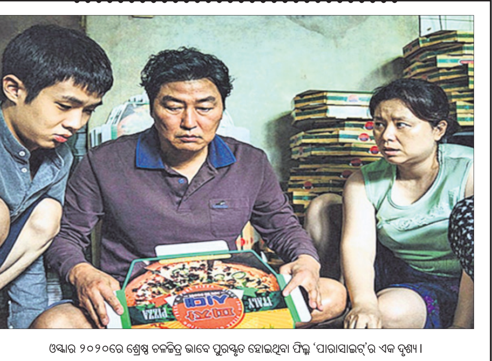
ଓଷାର ୨୦୨୦ରେ ଶ୍ରେଷ୍ଠ ଚଳଚ୍ଚିତ୍ର ଭାବେ ପୁରସ୍କୃତ ହୋଇଥିବା ଫିଲ୍ମ 'ପାରାସାଇଟ୍'ର ଏକ ଦୃଶ୍ୟ।