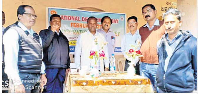
ବିଧାୟକ ଜଗନ୍ନାଥ ନାଏକ କୃମିନାଶକ କାର୍ଯ୍ୟକ୍ରମର ଶୁଭାରମ୍ଭ କରୁଛନ୍ତି।