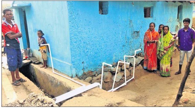
ରାସ୍ତା କଡ଼ରେ ଥିବା ପାଣି ପାଇପ୍।

ପ୍ରତ୍ୟେକ ଘରକୁ ମିଳିବ ପାଇପ୍ ପାଣି। ଏହି ବ୍ୟବସ୍ଥାରେ ପ୍ରତ୍ୟେକ ଘରକୁ ପାଣି ପାଇବ ବିକ୍ଷା ଯାଉଛି। ଡେବେ ଘରକୁ ପାଇପ୍ ସଂଯୋଗ ଠିକ ଭାବରେ ହେଉ ନ ଥିବା ଓ ରାସ୍ତା କଡ଼ରେ ପାଇପ୍ ଓ ଟ୍ୟାପ ଝୁଲାଇ ଛାଡ଼ି ଦିଆଯାଉଥିବାରୁ ଏହି ପାନୀୟଜଳ ଯୋଗାଣ କାର୍ଯ୍ୟକ୍ରମର ସଫଳତାକୁ ନେଇ ଆଶଙ୍କା ଦେଖାଦେଇଛି।