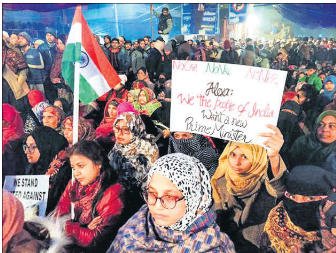
ଶାହିନବାଗରେ ସିଏଏ ବିରୋଧୀ ବିଶୋଭ।