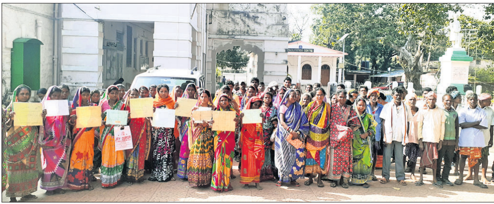
ଜିଲ୍ଲାପାଳଙ୍କ ନିକଟକୁ ଅଭିଯୋଗ କରିବାକୁ ଆସିଥିବା ଗ୍ରାମବାସୀ ।

ଏହି ସମୟରେ ଗ୍ରାମର କିଛି ଯୁବକ ଗଞ୍ଜାମ କର ଜମି ମାପ କରାଇ ଦେଇ ନ ଥିଲେ । ପରେ ଏ ନେଇ ୧୯ ଡିସେମ୍ବର, ଗ୍ରାମରେ ବୈଠକ କରାଯାଇ ଯେଉଁମାନେ ଜମି ମାପ କାର୍ଯ୍ୟକୁ ବିରୋଧ କରି ଗଞ୍ଜାମ କର କରିଥିଲେ ସେମାନଙ୍କୁ ଜାଗା ଦିଆଯିବ ନାହିଁ ବୋଲି ନିଷ୍ପତ୍ତି ହୋଇଥିଲା । ଏହିଭଳି ବିଭିନ୍ନ ସମୟରେ ତହସିଲଦାର