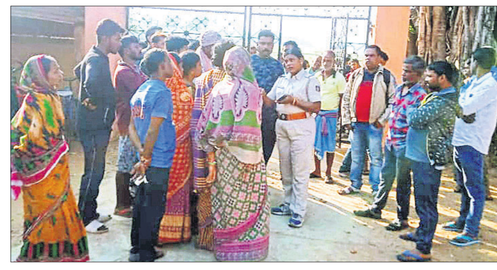
କୃଷି ଉତ୍ସବ ବିଦ୍ୟାଳୟ ସାମ୍ନାରେ ଅଭିଭାବକମାନଙ୍କୁ ପୋଲିସ୍ ବୁଝାଖୁଣା କରୁଛି।

ଭଦ୍ରକ ଜିଲ୍ଲା ଭଦ୍ରକ ଅଫିସର ଶିଶୁ ବିଦ୍ୟାଳୟରେ ୨୦ତମ ବାର୍ଷିକ ଉତ୍ସବ ଅନୁଷ୍ଠିତ ହୋଇଥିଲା। ବିଦ୍ୟାଳୟର ଶିକ୍ଷକ ଅଭାବ ସମସ୍ୟା ସହ ମଧ୍ୟାହ୍ନ ଭୋଜନରେ ସ୍ୱଳ୍ପ ଓ ନିମ୍ନମାନର ଖାଦ୍ୟ ପିଲାଙ୍କୁ ଦିଆଯାଉଥିବା କାର୍ଯ୍ୟରେ ଅଭିଭାବକମାନେ କହିଥିଲେ। ଏହାଛଡ଼ା ସ୍କୁଲ ପରିସରରେ ବିଶୁଦ୍ଧିକରଣ କାର୍ଯ୍ୟ ହେଉଥିବା ଏବଂ ପିଲାମାନେ ନାଟିକା ପାଇବା ପରିବର୍ତ୍ତେ ଦିନକୁ ଦିନ ଅବାଚରୁ ଯାଉଥିବା ଅଭିଭାବକମାନେ କହିଥିଲେ। ଅଭିଭାବକମାନେ ମଧ୍ୟାହ୍ନରେ ସ୍କୁଲ ପାଠକରେ ତାଳା ପକାଇଥିଲେ। ବିଦ୍ୟାଳୟରେ ପାଠପଢ଼ା ଠିକ୍ ଭାବେ ଚାଲି ନ ଥିବାବେଳେ ବାର୍ଷିକ ପରୀକ୍ଷା ଆଉ ଅଳ୍ପ ଦିନ ବାକି ରହିଥିଲେ ମଧ୍ୟ ସମସ୍ତ ବିଷୟରେ ପାଠପଢ଼ା ହୋଇନାହିଁ। କେତେକ ବିଷୟରେ ଆସି ପଢ଼ା ଆରମ୍ଭ ହୋଇନାହିଁ। ଅର୍ଦ୍ଧବାର୍ଷିକ ପରୀକ୍ଷାରେ ଫଳାଫଳ ଅଭିଭାବକଙ୍କୁ