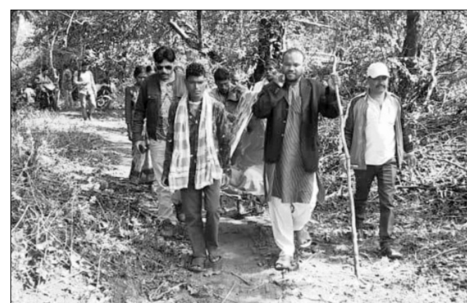
ଖଟିଆକୁ ବିଧାୟକ କାନ୍ଧରେ ବୋହି ନେଉଛନ୍ତି।

ଆଲୁମିନା ପରିବହନରେ ସୁବିଧା ହେବାସହ ୧୫୦ କିମି ଦୂରତା କମିବ।