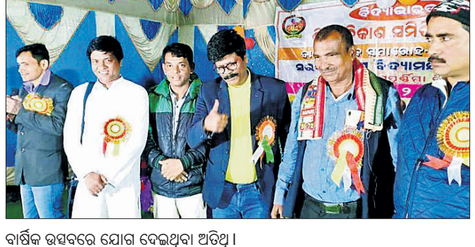
ବାର୍ଷିକ ଉତ୍ସବରେ ଯୋଗ ଦେଇଥିବା ଅତିଥି।

ବିଦ୍ୟାଳୟରେ ପଢ଼ା ଅଭିଭାବକଙ୍କ ସହ ଆଲୋଚନା କରିଥିଲେ। ଦୁଇଦିନ ଭିତରେ ବିଦ୍ୟାଳୟ ପରିଚାଳନା କମିଟି, ଅଭିଭାବକ ଓ ଶିକ୍ଷୟିତ୍ରୀ ଶିକ୍ଷକ ଏକ ବୈଠକରେ ଏକତ୍ର ହୋଇ ସ୍କୁଲର ବିଭିନ୍ନ ସମସ୍ୟା ସମ୍ପର୍କରେ ଆଲୋଚନା କରିବାକୁ ସ୍ଥିର ହୋଇଥିଲା। ଏହାପରେ ପରିସ୍ଥିତି ଶାନ୍ତ ପଡ଼ିଥିଲା।