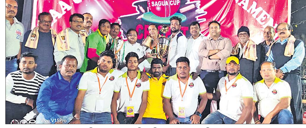
ଅଧିକାରୀଙ୍କ ଗହଣରେ ଚାମ୍ପିୟନ ଫ୍ରେଣ୍ଡ୍‌ସ୍ ୨ ଦଳର ଖେଳାଳିମାନେ।

କଟକର ଫ୍ରେଣ୍ଡ୍‌ସ୍ ୨ ଚଳିତ ବର୍ଷର ମା' ଉତ୍କଳୀୟ କ୍ରିକେଟ୍ ଟୁର୍ନାମେଣ୍ଟ ସାଗୁଆ କପ୍ ଚାଳକର ହାସଲ କରିଛି। ହରିଦିଆ ପ୍ରସ୍ତର ଓଭରରେ ଶେଷ ହୋଇଥିବା ଫାଇନାଲରେ କଟକର ଫ୍ରେଣ୍ଡ୍‌ସ୍ ୨ ଲକ୍ଷ୍ମଣ ଲକ୍ଷ୍ମଣଙ୍କୁ ୨ ରନରେ ପରାସ୍ତ କରିଛି ଫ୍ରେଣ୍ଡ୍‌ସ୍ ୨। ପ୍ରଥମେ ବ୍ୟାଟିଂ କରିଥିବା ଫ୍ରେଣ୍ଡ୍‌ସ୍ ୨ କୋଣସି ଉଇକେଟ୍ ନ ହରାଇ ୨୪ ରନ କରିଥିବାବେଳେ ପକ୍ଷୀନ ୨୨ ରନ କରିବାକୁ ସକ୍ଷମ ହୋଇଥିଲା। ପୂର୍ବରୁ ନିୟମ ଅନୁସାରେ ୧୦ ଓଭର ବିଶିଷ୍ଟ ୨ଟି ମ୍ୟାଚ୍ ଅନୁଷ୍ଠିତ ହୋଇଥିଲା। ପ୍ରଥମ ମ୍ୟାଚରେ ପକ୍ଷୀନ ୫ ରନରେ ଫ୍ରେଣ୍ଡ୍‌ସ୍ ୨କୁ ପରାସ୍ତ କରିଥିଲା। ପକ୍ଷୀନ ୫ ଉଇକେଟ୍ ହରାଇ ୧୫୨ ରନ କରିଥିବାବେଳେ ଫ୍ରେଣ୍ଡ୍‌ସ୍ ୨ ସାତ ଉଇକେଟ୍ ହରାଇ ୧୪୭ ରନ କରିଥିଲା। ଦ୍ୱିତୀୟ ମ୍ୟାଚରେ ଫ୍ରେଣ୍ଡ୍‌ସ୍ ୨ ତିନି ଉଇକେଟ୍ରେ ପକ୍ଷୀନକୁ ହରାଇ