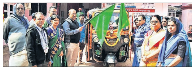
ପ୍ରଚାର ଗାଡ଼ି ଉଦ୍‌ଯୋଗ କରାଯାଇଛି।

ଜନ୍ମରୁ ୨ ବର୍ଷ ପିଲା, ଗର୍ଭବତୀ ଯେଉଁମାନେ ଟିକା ନେଇ ନ ଥିବେ ସେମାନଙ୍କୁ ପ୍ରତ୍ୟେକ ଗ୍ରାମରେ ଥିବା ଅଙ୍ଗନୱାଡ଼ି କେନ୍ଦ୍ରରେ ମଙ୍ଗଳବାରଠାରୁ ଟିକା ଦିଆଯିବ। ଆସନ୍ତା ୨୬ ତାରିଖ ପର୍ଯ୍ୟନ୍ତ ଏହି ଟିକାକରଣ କାର୍ଯ୍ୟକ୍ରମ ଚାଲିବ। ଏ ନେଇ ଯୋଗବାନ ଭଦ୍ରକ ଅଫିସର ଗୋଷ୍ଠୀ ସ୍ୱାସ୍ଥ୍ୟକେନ୍ଦ୍ର ପରିସରରେ ଏକ ପ୍ରଚାର ଗାଡ଼ି ଉଦ୍‌ଯୋଗ କରାଯାଇଛି। ଏହି ପ୍ରଚାର ଗାଡ଼ି କୁଳର ସମସ୍ତ ଗ୍ରାମକୁ ଯାଇ ବାର୍ତ୍ତା ଦେବ। ଯେଉଁମାନେ ଟିକା ନେଇ ନ ଥିବେ