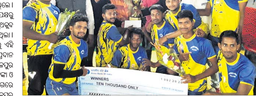
ଚାମ୍ପିୟନ କଟକ ଦଳର ଖେଳାଳିମାନେ ଅତିଥିଙ୍କଠାରୁ ଟ୍ରଫି ଗ୍ରହଣ କରୁଛନ୍ତି।

ଯାକପୁର ଗଞ୍ଜ, ୧୦୧୨ (ବିଏନଏ): ଯାକପୁର ବାଲକ୍ରମ ପଡ଼ିଆରେ ବିରଜା ଯୁଥ୍ କ୍ଲବ୍ ପକ୍ଷରୁ ହେଉଥିବା ରାଜ୍ୟସ୍ତରୀୟ ଅଶୋକ ଦାସ ମେମୋରିଆଲ ଦିବାରାତ୍ର କବାଡ଼ି ପ୍ରତିଯୋଗିତା ଯୋଗ୍ୟତା ଉନ୍ନତୀପତି ହୋଇଯାଇଛି। ଏହି ଟୁର୍ନାମେଣ୍ଟରେ ୧୪ଟି ଦଳ ଭାଗ ନେଇଥିଲା। ଫାଇନାଲ ମ୍ୟାଚ୍‌ରେ ପୁରୁଷ ବିଭାଗ ପକ୍ଷରୁ କବାଡ଼ି କ୍ଲବ୍ କଟକ ଓ ମା' ବିରଜା ଯୁଥ୍ କ୍ଲବ୍ ଯାକପୁର ମଧ୍ୟରେ ଅନୁଷ୍ଠିତ ହୋଇଥିଲା। କବାଡ଼ି କ୍ଲବ୍ କଟକ ଚାମ୍ପିୟନ ହୋଇଥିବାରୁ ଏହି ଟିମ୍‌କୁ ନଗଦ ୧୦ହଜାର ଟଙ୍କା ଓ ଟ୍ରଫି ପ୍ରଦାନ କରାଯାଇଥିଲା। ମା' ବିରଜା ଯୁଥ୍ କ୍ଲବ୍ ଯାକପୁର ରନର୍ସ ଅପ୍ ହୋଇଥିବାରୁ ନଗଦ ୨ହଜାର ଟଙ୍କା ଓ ଟ୍ରଫି ପ୍ରଦାନ କରାଯାଇଥିଲା। ମଝିଲା ବିଭାଗରେ ଯାକପୁର କବାଡ଼ି ଆସୋସିଏଶନ୍ ଓ ଯାକପୁର ଖଣ୍ଡିତର କବାଡ଼ି ଆସୋସିଏଶନ୍ ମଧ୍ୟରେ ଫାଇନାଲ ମ୍ୟାଚ୍ ଅନୁଷ୍ଠିତ ହୋଇଥିଲା। ଏଥିରେ ଯାକପୁର ଖଣ୍ଡିତର କବାଡ଼ି ଆସୋସିଏଶନ୍ ଚାମ୍ପିୟନ ହୋଇଥିବାରୁ ଟିମ୍‌କୁ ନଗଦ ୧୦ହଜାର ଟଙ୍କା ଓ ଟ୍ରଫି ପ୍ରଦାନ କରାଯାଇଥିଲା। ରନର୍ସ ଅପ୍ ହୋଇଥିବା ଯାକପୁର କବାଡ଼ି ଆସୋସିଏଶନ୍‌କୁ ନଗଦ ୨ହଜାର ଟଙ୍କା ଓ ଟ୍ରଫି ପ୍ରଦାନ କରାଯାଇଥିଲା। ପୁଣ୍ୟଅତିଥିଭାବେ ଜିଲାପାଳ