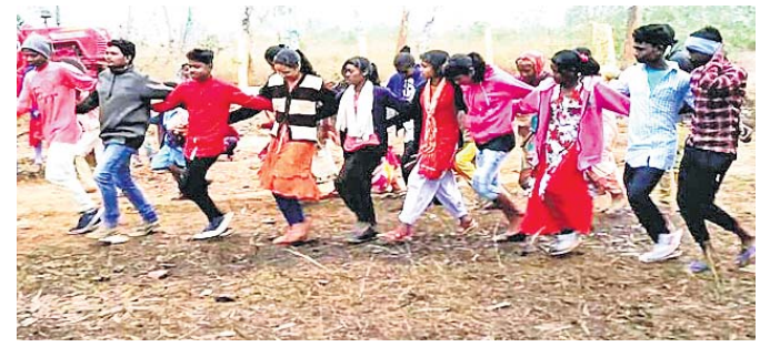
ମାଗେ ପରବରେ ଅଧିବାସୀ ମୁଦତା ମୁଦକ ନୃତ୍ୟ କରୁଛନ୍ତି।