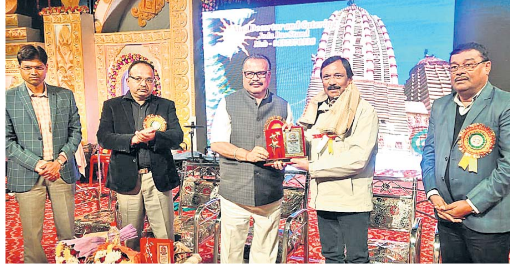
ଯୋଡା ମହୋତ୍ସବରେ ଯୋଗ ଦେଇଥିବା ଅତିଥି।