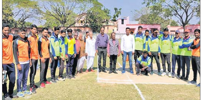
ଉଦଘାଟନା ଅବସରରେ ଅତିଥିଙ୍କ ସହ ଖେଳାଳି।