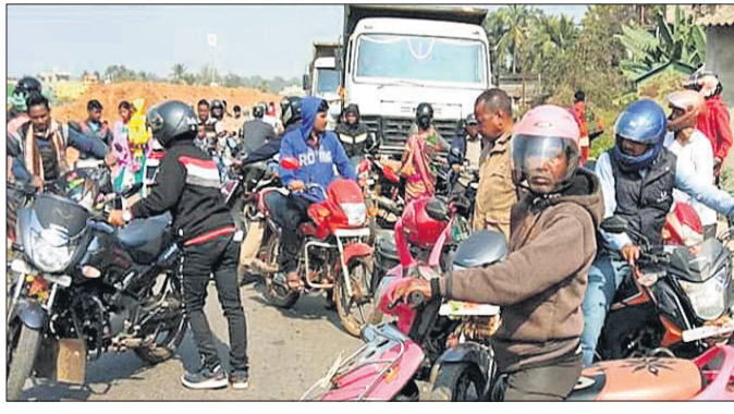
ଅବରୋଧ ଯୋଗୁ ରାତ୍ରି କାମ୍ ହୋଇଛି ।