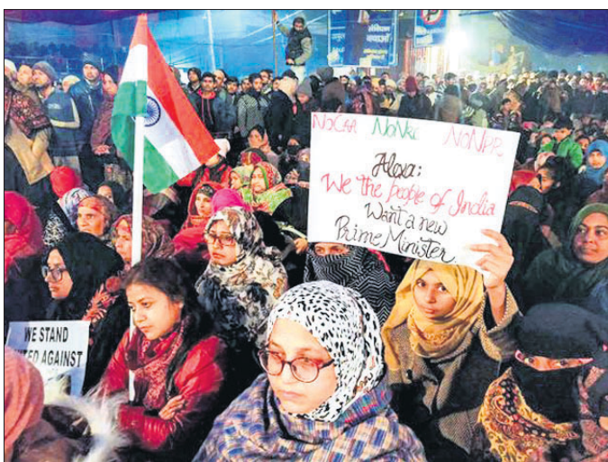
ଶାହିନବାଗରେ ସିଏଏ ବିରୋଧୀ ବିଶୋଭ।

ଦିଲ୍ଲୀ ବିଧାନସଭା ନିର୍ବାଚନର ଭୋଟଗଣତି ମଙ୍ଗଳବାର ହେବାକୁ ଥିବାବେଳେ ଏଥିପାଇଁ ରାଜଧାନୀରେ କଡ଼ା ସୁରକ୍ଷା ବ୍ୟବସ୍ଥା ଗ୍ରହଣ କରାଯାଇଛି। ୧୦ ଆସନ ବିଶିଷ୍ଟ ଦିଲ୍ଲୀ ବିଧାନସଭା ନିର୍ବାଚନ ଫଳାଫଳ ଜାଣିବା ପାଇଁ ଲୋକଙ୍କ ମଧ୍ୟରେ ଉତ୍ସାହ ଦେଖାଦେଇଛି। ଭୋଟ ପରେ ବିଜିତ ଗଣମାଧ୍ୟମ ପକ୍ଷରୁ ରୂପରେଖ ଜନମତ ସର୍ବେକ୍ଷଣ (ଏକ୍ସିଟ ପୋଲ୍) ଫଳାଫଳ ପ୍ରକାଶ ପାଇଥିଲା, ଯେଉଁଥିରେ ଆମ୍ ଆର୍ପିଏ ପାର୍ଟି (ଏଏପି) ସଂଖ୍ୟାଗରିଷ୍ଠତାର ସହ ପୁଣିଥରେ କ୍ଷମତା ଦଖଲ କରିବେ ବୋଲି ପୂର୍ବାନୁମାନ କରାଯାଇଥିଲା। ଭାଜପା ବିତୀୟ ଗୁଳନରେ ରହିବ ଓ କଂଗ୍ରେସ ଖାତା ଖୋଲିଯାଉ ନାହିଁ ବୋଲି ଅଧିକାଂଶ ଗଣମାଧ୍ୟମ ପୂର୍ବାନୁମାନ କରିଥିଲେ। ଏକ୍ସିଟ ପୋଲର ଅନୁମାନକୁ ଭାଜପା ଓ କଂଗ୍ରେସ ଅଗ୍ରାହ୍ୟ କରିଛନ୍ତି। ଏକ୍ସିଟ ପୋଲ୍ ଏକ୍ସିଟ ପୋଲ୍ ନୁହେଁ ବୋଲି ଭାଜପା କହିଥିବାବେଳେ ଫଳାଫଳ ସମସ୍ତଙ୍କୁ ଚମକାଇ ଦେବ ବୋଲି କଂଗ୍ରେସ କହିଛି। ନିର୍ବାଚନ କମିଶନ ବିକ୍ରମରେ ଚୁଡ଼ାତ ଭୋଟଦାନ ହାର ପ୍ରକାଶ କରିବା ଘଟଣାକୁ ଏଏପି ପକ୍ଷରୁ ସମାଲୋଚନା କରାଯାଇଥିଲା। ଏଥର ଭୋଟଦାନ ହାର ୬୨.୫୯ ରହିଛି, ଯାହାକି ୨୦୧୫ ଚଳନରେ ୫ ପ୍ରତିଶତ କମ୍। ଏହି ନିର୍ବାଚନରେ ମୁଖ୍ୟତଃ ଶାସକ ଏଏପି ଏବଂ ଭାଜପା ମଧ୍ୟରେ ଜୋରଦାର ଲଢ଼େଇ ହୋଇଥିଲା। ଭାଜପା ପାଇଁ ପ୍ରଧାନମନ୍ତ୍ରୀ ନରେନ୍ଦ୍ର ମୋଦିଙ୍କଠାରୁ ଆରମ୍ଭ କରି ବହୁ ମନ୍ତ୍ରୀ ଓ ବିଶିଷ୍ଟ କେନ୍ଦ୍ରୀୟ ନେତା ନିର୍ବାଚନ ପ୍ରଚାର କରିଥିଲେ। ୨୯ଟି ସ୍ଥାନରେ ଥିବା ମତଗଣନା କେନ୍ଦ୍ରରେ ପର୍ଯ୍ୟାପ୍ତ ବ୍ୟବସ୍ଥା ଗ୍ରହଣ କରାଯାଇଛି। ଏଥିପାଇଁ ୩୩ ଜଣଙ୍କୁ ପର୍ଯ୍ୟବେକ୍ଷକ ରଖାଯାଇଛି। ଭିତ୍ତିତମ୍ଭାବେ ରଖାଯାଇଥିବା ସୁରକ୍ଷାମୁକ୍ତିକୁ କଡ଼ା ସୁରକ୍ଷା ବନ୍ଦ ମଧ୍ୟରେ ରଖାଯାଇଛି।