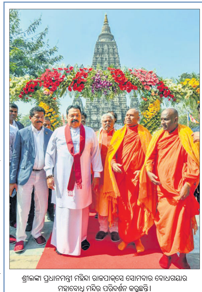
ଶ୍ରୀଲଙ୍କା ପ୍ରଧାନମନ୍ତ୍ରୀ ମହିନ୍ଦା ରାଜପକ୍ଷେ ସୋମବାର ବୋଧଗୟାରେ ମହାବୋଧି ମନ୍ଦିର ପରିଦର୍ଶନ କରୁଛନ୍ତି।

ନୋଟିସ ଜାରି କରିଛନ୍ତି। ଆନ୍ଦୋଳନରେ ୪ ମାସର ଶିଶୁ ଭାଗନେଇପାରିବ କି ବୋଲି ସୁପ୍ରିମକୋର୍ଟ ପ୍ରଶ୍ନ କରିବା ସହ କେତେକ ମହିଳା ଆଇନଜୀବୀଙ୍କୁ ଚେତାବନା ଦେଇଛନ୍ତି। ସିଏଏ ବିରୋଧୀ ଆନ୍ଦୋଳନରେ ଭାଗ ନେଇଥିବା