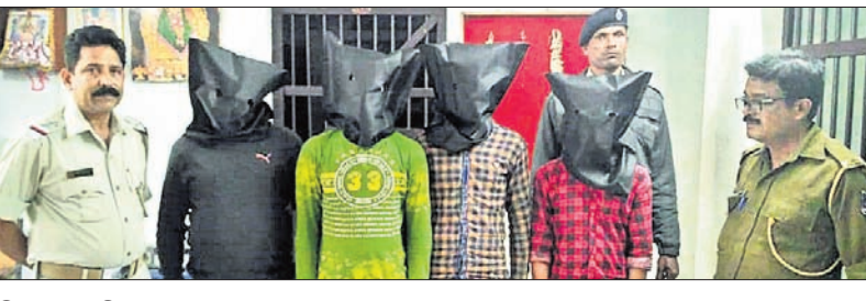
ଗିରଫ ୪ ଅଭିଯୁକ୍ତ। ଗୋଟିଏ ବନ୍ଧୁକ, ଗୋଟିଏ ଆପାଟି ବାଇକ୍, ୫ ମୋବାଇଲ୍, ଲୁହାରତ୍ ସହ ମାରଣାସ୍ତ୍ର ବେଳେ ଡକାୟତି ଯୋଜନା କରୁଥିବା ଜଣି

ସୋର, ୧୦୧୧(ଡି.ଏନ.ଏ.) ସୋର ମୁନିସିପାଲିଟି ଅନ୍ତର୍ଗତ ଷ୍ଟେଶନ ନିକଟ ରାସ୍ତାରେ ରବିବାର ରାତିରେ ଡକାୟତି ଯୋଜନା କରୁଥିବା ବେଳେ ୪ ଡକାୟତ ଅପରାଧୀଙ୍କୁ ପୋଲିସ୍ କାର୍ଯ୍ୟକାରୀ ଭାବେ ଘଟଣାସ୍ଥଳରେ ଗିରଫ କରାଯାଇଛି। ଡକାୟତ ଯୋଜନାରେ ଯୋଗଦାନ କରିଥିବା ବନ୍ଧୁକ ଜବତ କରାଯାଇଛି। ଡକାୟତ ଯୋଜନା କରୁଥିବା ବେଳେ ଧରାପଡିଛନ୍ତି। ରାତି ଅନ୍ଧାରର ସୁଯୋଗରେ ଜଣେ ଡକାୟତ ଯୋଜନାରେ ଯୋଗଦାନ କରିଥିବା ବେଳେ ଗିରଫ କରାଯାଇଛି।