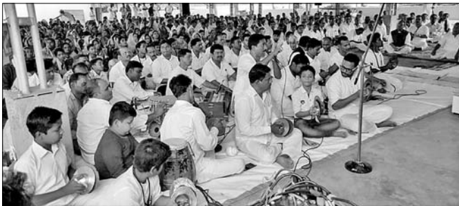
ଉପସ୍ଥିତ ଭକ୍ତବୃନ୍ଦ ।