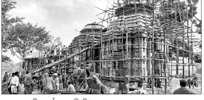
ଗ୍ରାମବାସୀ ମନ୍ଦିର କାର୍ଯ୍ୟରେ ଲାଗିଛନ୍ତି।

ବାରିଜାବାଡ଼ି/ବ୍ରାହ୍ମଣୀଗାଁ, ୧୨୨୧ (ଡି.ଏନ.ଏ.)