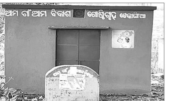
ଚେକାଳିଆ ଆମ ଗାଁ ଆମ ବିକାଶ ଯୋଜନାରେ କରାଯାଇଥିବା ସଭାଗୃହ।

ବାରିଜାବାଡ଼ି ବ୍ଲକ ଦାସିବାଡ଼ି ପଞ୍ଚାୟତର ଚେକାଳିଆ ଗ୍ରାମରେ ଆମ ଗାଁ ଆମ ବିକାଶ ଯୋଜନାରେ କରାଯାଇଥିବା ଗୋଷ୍ଠୀ ସଭାଗୃହ ନିର୍ମାଣ କାର୍ଯ୍ୟ ଶେଷ ହୋଇଛି। ଯେଉଁ ଯୁବକ ଉକ୍ତ କାର୍ଯ୍ୟ ଯତ୍ନାତ୍ମକ କରିଆରେ କରିଥିଲେ ତାଙ୍କୁ ମାତ୍ର ୧ଲକ୍ଷ ଟଙ୍କା ବିଲ୍ ମିଳିଛି। ବକଳା ୧ଲକ୍ଷ ଟଙ୍କା ଦିଆଯାଇନାହିଁ। ସେ ବାରମ୍ବାର ବ୍ଲକ କାର୍ଯ୍ୟାଳୟକୁ ଦାସିବାଡ଼ି ସହ ଯତ୍ନାତ୍ମକ ଠାରୁ ଆରମ୍ଭ କରି ଗ୍ଲାନାୟ ପ୍ରଶାସନ ଏବଂ ଗ୍ଲାନାୟ ଲୋକପ୍ରତିନିଧୀମାନଙ୍କୁ ଗୁହାରି କରି ନୟାଡ଼ି ହେଲେଣି, ହେଲେ ଯୁବକ ମିଳୁନି। ଏବେ ମରୁତୀ ପାଇଁ ତାଙ୍କ ଗୁଆରେ ଲୋକେ ବସୁଛନ୍ତି ବୋଲି ଠିକା କାର୍ଯ୍ୟ କରିଥିବା ଅଧିକାରୀ