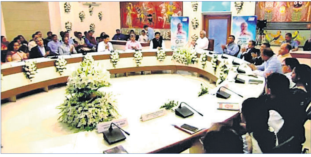
ମୋ ସରକାର କାର୍ଯ୍ୟକ୍ରମରେ ମୁଖ୍ୟମନ୍ତ୍ରୀ ନବୀନ ପଟ୍ଟନାୟକ ଓ ଅନ୍ୟମାନେ ।