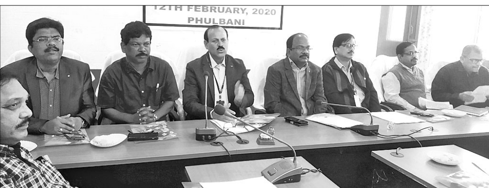
ଖବରଦାତା ସମ୍ମିଳନୀରେ ଉପସ୍ଥିତ ଅଧିକାରୀ।

ସରକାର କୃଷକମାନଙ୍କ ପାଇଁ କିଷାନ କ୍ରେଡିଟ କାର୍ଡ ବ୍ୟବସ୍ଥା କରିଛନ୍ତି। ଚାଷ ପାଇଁ ଏହାର ସମସ୍ତ ସୁବିଧା ଯେପରି ସମସ୍ତ କୃଷକ ନେବେ ଏବଂ ଏଥିରୁ କେହି ବଞ୍ଚିତ ନ ହେବେ ସେ ନେଇ ଏକ ଖବରଦାତା ସମ୍ମିଳନୀ ଶୁକ୍ରବାର ଘାନ୍ତାୟ ସମର୍ପିତ ଆଦିବାସୀ ଉଚ୍ଚମଧ୍ୟ ସଂସ୍ଥା ସମ୍ମିଳନୀ କକ୍ଷରେ ଅନୁଷ୍ଠିତ ହୋଇଯାଇଛି। ଏଥିରେ ନାବାଜି ଏଲିଏମ୍ ଶ୍ରୀକନ୍ଧ ଲାଞ୍ଜନ ଦାସ ଯୋଗଦେଇ କହିଥିଲେ, ଯେଉଁମାନେ ଏହି କାର୍ଡ ପାଇଛନ୍ତି ସେମାନେ ସରକାରଙ୍କ ଦ୍ୱାରା ଦିଆଯାଉଥିବା ବିଭିନ୍ନ ଲାଭ ନେଇପାରିବେ। ଯେଉଁମାନେ କାର୍ଡ ପାଇ ନାହାନ୍ତି ସେମାନେ ନିକଟସ୍ଥ ବ୍ୟାଙ୍କକୁ ଯାଇ ନିର୍ଦ୍ଧାରିତ ଫର୍ମ ପୂରଣ କରି କାର୍ଡ ନେଇପାରିବେ। ଫେବୃଆରୀ ୮ରୁ ୧୫ ଦିନ ପର୍ଯ୍ୟନ୍ତ ଏହି ଫର୍ମ ପୂରଣ କରିବାକୁ କୃଷକ ଏହାର ଫାଇଦା ନେବାକୁ କହିଥିଲେ। କିଷାନ କ୍ରେଡିଟ କାର୍ଡ (କେସିସି)