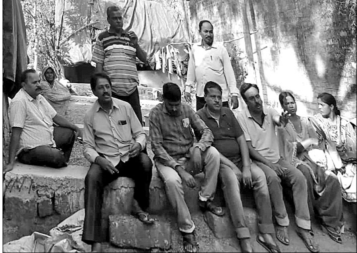
ପିଇଓମାନଙ୍କ ଧାରଣା ।