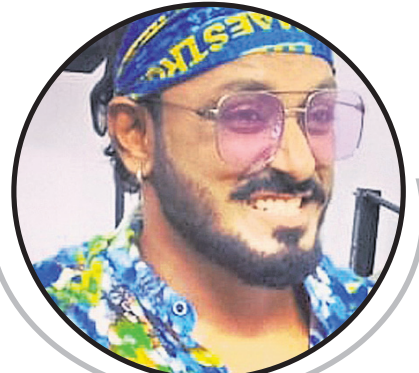
ନୂଆ ସିନେମା ବିଶ୍ୱରୂପ

ପୂଜା ହେରେଡ୍ ଯାହା ଚାହୁଁଥିଲେ ତାହା ପୁରଣ ହୋଇଛି । 'ହାଇସ୍କୁଲ-୪' ପରେ ସାବିତ୍ରୀ ନାଦିଓଦ୍ୱାରା ପରବର୍ତ୍ତୀ ଫିଲ୍ମରେ ସେ ଅଭିନୟ କରିବାକୁ ଯାଉଛନ୍ତି । କଥା କ'ଣ କି, ସାବିତ୍ରୀ ଫିଲ୍ମ 'କଭି ଇନ୍ କଭି ଦିଓଲି' ପାଇଁ ତାଙ୍କୁ ସାଜନ୍ କରାଯାଇଛି । ସୂଚନାଯୋଗ୍ୟ, ୨୦୧୬ରେ ରିଲିଜ୍ ହୋଇଥିବା ଆଶୁତୋଷ ଗୋପାଳିକରଙ୍କ ନିର୍ଦ୍ଦେଶିତ 'ମହେଞ୍ଜୋଦାରୋ'ରେ ହିତେକ ରୋଶନଙ୍କ ଅପୋଜିଟରେ ତାଙ୍କୁ ବ୍ରେକ୍ ମିଳିଥିଲା । ଦୀର୍ଘ ୪ ବର୍ଷ ଗ୍ୟାପ୍ ପରେ ସେ ଆଉ ଏକ ହିନ୍ଦୀ ସିନେମାରେ ଅଭିନୟ କରିବାକୁ ଯାଉଛନ୍ତି । ଅସଲ କଥା ହେଲା, ସଲମାନଙ୍କ ସହ ସ୍ଟିଭ୍ ଶେୟାର କରିବା ତାଙ୍କର ଆଉ ଏକ ଆଶା ଥିଲା ବୋଲି ସେ କହିଛନ୍ତି । ଫିଲ୍ମଟିର ନିର୍ଦ୍ଦେଶନା ଦେବେ ଫରହଦ୍ ସାମଜି । 'କଭି ଇନ୍ କଭି ଦିଓଲି'ରେ ପୂଜା ଏକ ଛୋଟ ସହରରେ ରହୁଥିବା ଯୁବତୀ ଭୂମିକାରେ ଅଭିନୟ କରିବେ । ଖାସ୍ କଥା ହେଲା, ସଲମାନଙ୍କୁ ଏଥିରେ ନୂଆ ଅବତାରରେ ଦେଖିବାକୁ ମିଳିବ । ଫିଲ୍ମଟି ଆସନ୍ତା ବର୍ଷ ଇନ୍‌ରେ ପରଦା ଉପରକୁ ଆସିବ ।