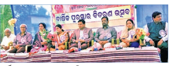
ବାର୍ଷିକ ଉତ୍ସବରେ ମଞ୍ଚାସୀନ ଅତିଥିମାନେ।