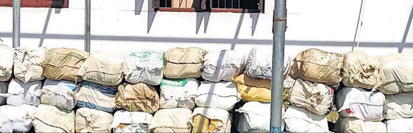
ଜବତ ହୋଇଥିବା ଗଞ୍ଜେଇ ବସ୍ତା ।