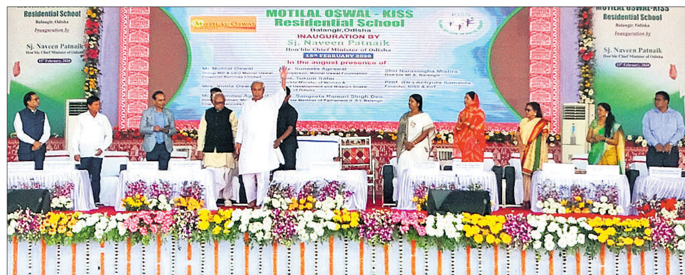
ବିଲାଙ୍ଗୀର କିଏ ଆବାସିକ ସ୍କୁଲ ଉଦ୍ଘାଟନ ଅବସରରେ ମୁଖ୍ୟମନ୍ତ୍ରୀ ନବୀନ ପଟ୍ଟନାୟକ ଓ ଅନ୍ୟ ଅତିଥିମାନେ।

ବିଲାଙ୍ଗୀର ଅପ୍ରେଲ, ୧୫।୨ ଭୁବନେଶ୍ୱରରୁ କଲିଙ୍ଗ ଇନ୍‌ଷ୍ଟିଚ୍ୟୁଟ୍ ଅଫ୍ ସୋସିଆଲ ସାଇନ୍‌ସେସ୍ (କିଏ)ର ବିଲାଙ୍ଗୀର ଶାଖା ମୋତିଲାଲ ଓଷାଲ-କିଏ ଜନଜାତି ଆବାସିକ ବିଦ୍ୟାଳୟକୁ ମୁଖ୍ୟମନ୍ତ୍ରୀ ନବୀନ ପଟ୍ଟନାୟକ ଶନିବାର ଉଦ୍ଘାଟନ କରିଛନ୍ତି।