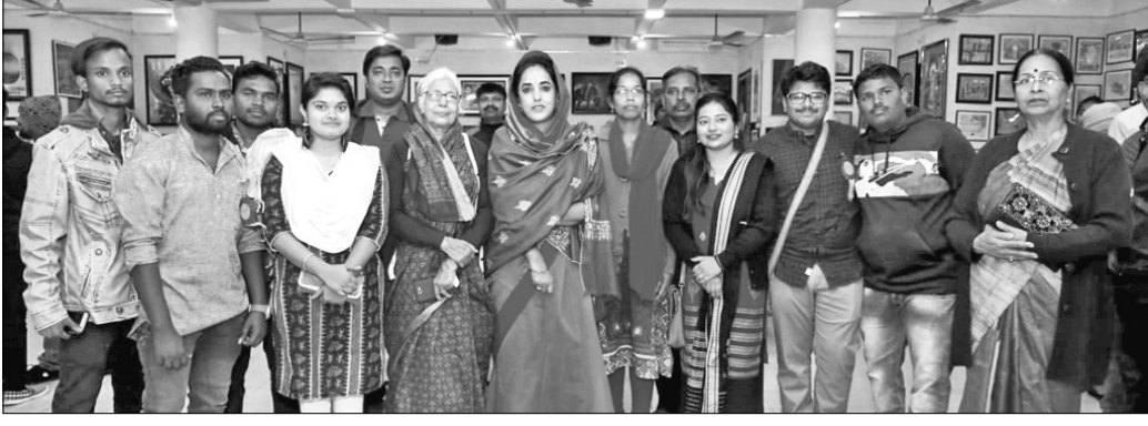
ଅଭିଯାନର ଗହଣରେ ସ୍କୁଲ ଅଫ ଆର୍ଟ ଆଣ୍ଡ ଗ୍ରାଫିକ୍ସର ଛାତ୍ରାଛାତ୍ରୀ

ବାଲେଶ୍ୱର, ୧୫୨ (ଡି.ଏନ.ଏ.): ବାଲେଶ୍ୱରର ଗ୍ରାମାଞ୍ଚଳ ଆନା ଅନ୍ତର୍ଗତ ବଡ଼ତାଳିଆ ଗ୍ରାମରେ ଶନିବାର ଜଣେ ମହିଳା ତାଙ୍କ ୩ ବର୍ଷର ଶିଶୁପୁତ୍ରକୁ ଧରି ପୋଖରୀରେ ସାଧାରଣ ବେଳେ ଶିଶୁପୁତ୍ର ପାଣିରେ ପକାଇଥିଲେ।