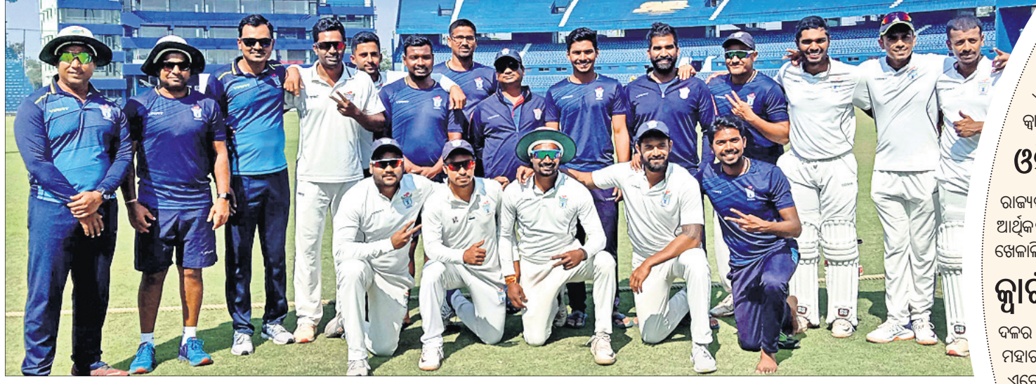
କ୍ୱାର୍ଟର ଫାଇନାଲରେ ପ୍ରବେଶ କରିଥିବା ଓଡ଼ିଶା ରଣଜୀ ଦଳର ଖେଳାଳି ଓ ସପୋର୍ଟ ସ୍କ୍ୱାଡ୍।