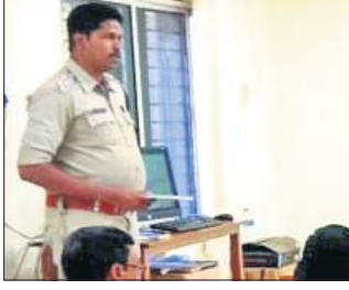
ସାଇବର ଆଇନ ସଚେତନତା କାର୍ଯ୍ୟକ୍ରମରେ ଉପସ୍ଥିତ ଅତିଥି

ପୂଜକ ଚାକ୍ତ ପ୍ରାପ୍ତ ହୋଇଛି। ଏନେଇ ସେ ତଳକୁ ଯାଇ ବେଆଇନ ଭାବେ ପାର୍ଟି ଆଦାୟ ହେଉଥିବା ଦେଖି ବିରୋଧ କରିବାରୁ ଆଦାୟ କରୁଥିବା କେତେକ ଯୁବକ ଚାକ୍ତ ଗାଳିଗୁଳି କରାଯିବା ସ୍ଥାନୀୟ ଲୋକ କହିଛନ୍ତି।