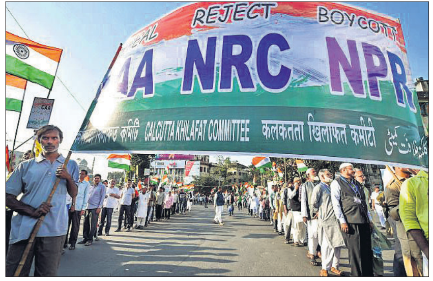
କୋଲକାତାରେ ବିଏସ୍‌ଏଫ୍, ଏନ୍‌ଆର୍‌ସି ଏବଂ ଏନ୍‌ପିଆର୍ ବିରୋଧରେ ବିଶାଳ ଶୋଭାଯାତ୍ରା।