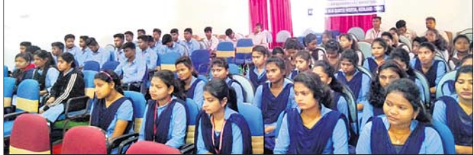
ଶିବିରରେ ଉପସ୍ଥିତ କଲେଜର ଛାତ୍ରଛାତ୍ରୀ

କେନ୍ଦୁଝର, ୧୫୧୨(ଡି.ଏନ.ଏ.)- କେନ୍ଦୁଝର ସ୍କୁଲ ଅଫ ଇଞ୍ଜିନିୟରିଂ ଓ ପାର୍ଟିସିପା କଲେଜଠାରେ ଏକ ସ୍ୱାସ୍ଥ୍ୟ ସଚେତନତା ଶିବିର ଅନୁଷ୍ଠିତ ହୋଇଯାଇଛି।