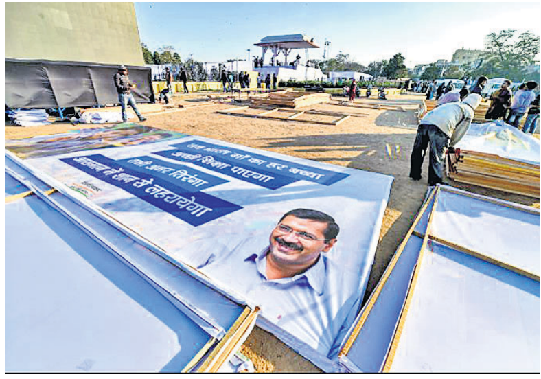
ରବିବାର ଅରବିନ୍ଦ କେର୍କିଆଲ ଦିଲ୍ଲୀ ମୁଖ୍ୟମନ୍ତ୍ରୀତାଙ୍କ ଶପଥ ନେବେ। ଏଥିପାଇଁ ରାମଲୀଳା ମଜଦାନରେ ପ୍ରସ୍ତୁତି ଜୋରଦାର ତାଲିକା।