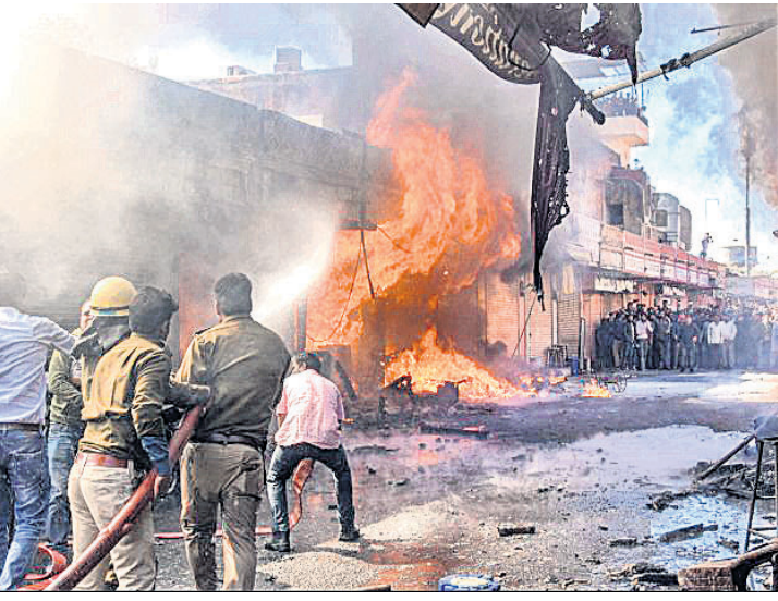
ଜୟପୁରର ଏକ ବାଣ ଦୋକାନରେ ନିଆଁ ଲାଗିଯାଇଥିବା ବେଳେ ଅଗ୍ନିଶମ କର୍ମଚାରୀ ଏହାକୁ ଲିଭାଇଛନ୍ତି।