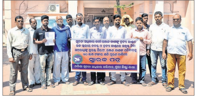
ପୁରୀ ଜିଲ୍ଲାପାଳଙ୍କ କାର୍ଯ୍ୟାଳୟ ଆଗରେ ସୂଚନା ଅଧିକାରୀ କର୍ମୀମାନେ ।