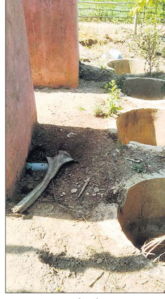
ପୋକସୁଜାରେ ଅର୍ଦ୍ଧ ନିର୍ମିତ ପାଇଖାନା।

ଖବରକାଗଜରେ ପ୍ରକାଶ ପାଇବା ପରେ ଠିକାଦାର ଓ ବିଭାଗୀୟ କର୍ମଚାରୀଙ୍କ ଭିତରେ ଛଳକା ପଡିଥିଲା। ତେଣୁ ଲେଖା ଯାଇଥିବା ନାମକୁ