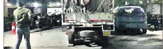
ଷଷ୍ଠ ଚାଲାଣ ହେଉଥିବାବେଳେ ଧରାପଡିଥିବା ଗାଡ଼ି।

ନୟାଗଡ଼ ଚାରଣ ଥାନା ରତନପୁରରୁ ଷଷ୍ଠ ଚାଲାଣ ବେଳେ ଧରା ପଡିଛି। ପୋଲିସ୍ ଷଷ୍ଠ ଚାଲାଣକାରୀ ଦେଖାଇଥିଲେ।