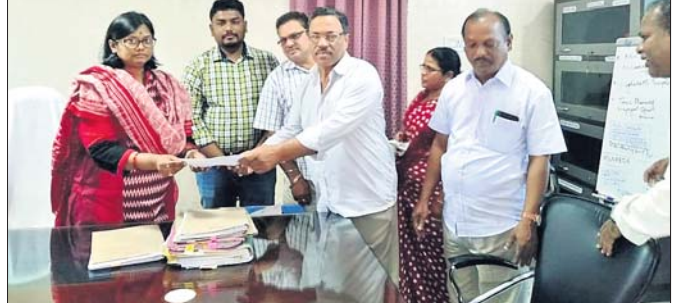
ଜିଲାପାଳଙ୍କୁ ସ୍ମାରକ ପତ୍ର ଦିଆଯାଇଛି।