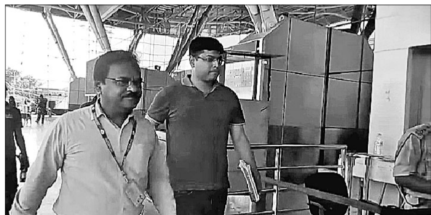
ବିପାନ ବନ୍ଦରରେ ଛତିଶଗଡ଼ ପୋଲିସ ଟିମ୍ ଦେଖିବାକୁ