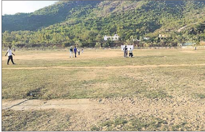
ଘାସ ନ ଥିବା ଷ୍ଟାଡ଼ିୟମ।

ହଲ ନିର୍ମାଣକୁ ଜ୍ରାତାପ୍ରେମୀ ଓ ବୁଦ୍ଧିଜୀବୀ ନାପସନ୍ଦ କରୁଛନ୍ତି। ଜ୍ରାତାପ୍ରେମୀଙ୍କ ଅଭିଯୋଗ ଅନୁସାରେ ୧୦ ଏକର କମି ଉପରେ ଗଡ଼ି ଉଠିଛି ନୟାଗଡ଼ ଷ୍ଟାଡ଼ିୟମ। ଇନ୍ଡୋର ହଲ ନିର୍ମାଣ ହେଲେ ୨୧ ଡେସିମିଲ (.୨୧ ଏକର) ଚାଲିଯିବ।