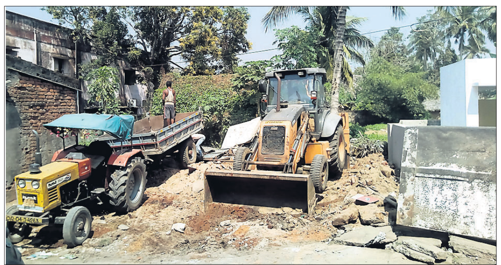
ଜବରଦଖଲ ଉଚ୍ଛେଦ କରାଯାଇଛି । ଉପରେ ବହୁ ଲୋକ ନିର୍ଭର କରିଥାନ୍ତି । ଏହି ବନ୍ଦାର ନିକଟରେ କଲେଜ, ତହସିଲ ଅଧିକାରୀ, ସବ୍‌ଜେକ୍ସ ଅଧିକାରୀ ଆଦି ରହିଛନ୍ତି ।

ପୁରାତନ ମାଣିଘାଲ ହାଟର ଆଧୁନିକୀକରଣ କାର୍ଯ୍ୟରେ ବାଧା ସୃଷ୍ଟି କରୁଥିବା ଜନେକ ବ୍ୟବସାୟୀଙ୍କୁ ବେଆଇନ ବଖାଇ ଛାଡିବା ପାଇଁ ନିର୍ଦ୍ଦେଶ ଦିଆଯାଇଥିଲା ।