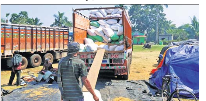
ମିଳକୁ ପଠାଯିବା ପାଇଁ ଧାନକିଣା ଟ୍ରକରେ ଲୋଡ଼ି କରାଯାଇଛି।

ପଦ୍ମପୁର, ୧୯/୨ (ଡି.ଏନ.ଏ.): ଭଦ୍ରକ ଜିଲା ସଦର ବ୍ଲକ ଅଧୀନ ସାବରଜଠାରେ ମହିଳା ମହାସଂଘ ପକ୍ଷରୁ ଗୋରାମାଟି ଓ ସାବରଜ ପଞ୍ଚାୟତର ଗାଷ୍ଟାଠାରୁ ଧାନ କିଣା ଯାଉଛି। ପ୍ରଥମରୁ ଖେତ ଅଖାରେ ଗାଷ୍ଟାମାନଙ୍କଠାରୁ ଧାନ କିଣାଯାଇ ମିଳକୁ ପଠାଯାଉଥିଲା। ଏବେ ସଂଘ ତରଫରୁ ଜରି ବସ୍ତାରେ ଧାନ କିଣାଯିବାକୁ ନେଇ ବିବାଦ ସୃଷ୍ଟି ହୋଇଛି। ମଙ୍ଗଳବାର ସନ୍ଧ୍ୟାରେ ଦୁଇଟି ଟ୍ରକ ଯୋଗେ ସମଲପୁରକୁ ଜରି ବସ୍ତାରେ ଧାନ ପଠାଯିବା ପାଇଁ ବୋହେଇ କରାଯାଉଥିବାବେଳେ ଗାଷ୍ଟାମାନେ ଏହାକୁ ବିରୋଧ କରିଥିଲେ। ଫଳରେ ଧାନ ଟ୍ରକରେ ବୋହେଇ ହୋଇ ନ ପାରି ପଞ୍ଚାୟତ କାର୍ଯ୍ୟାଳୟ ସମ୍ମୁଖରେ ରଖାଯାଇଥିଲା। ରାତିତମାମ ଅଧୀନକୁ ଗାଷ୍ଟା ଜରିବସ୍ତା ବେଳେ ରୂପବାର ସୁଖା ଉପାୟ ପାରିବାଣି ଗାଷ୍ଟାମାନେ ଅପରାହ୍ନରେ ଜିଲା ଯୋଗାଣ ଅଧିକାରୀ, ଜିଲା ଆରକ୍ଷା ଅଧୀକାରୀ ଓ ଗ୍ରାମାଞ୍ଚଳ ଆନାୟକଙ୍କୁ