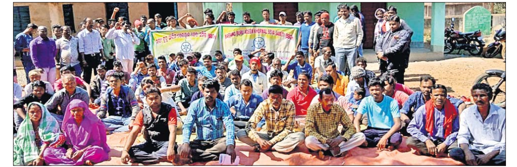
ବୈଠକରେ ଉପସ୍ଥିତ ମାରାଂଗୁରୁ ଅଦିମ ଖେରଫାଳ ସେବା ସମିତିର କର୍ମକର୍ତ୍ତା।

ବାଇରଙ୍ଗପୁର, ୧୯/୨ (ଡି.ଏନ.ଏ.): ମୟୂରଭଞ୍ଜ ଜିଲା ବାଇରଙ୍ଗପୁର ସର୍ବତ୍ତ୍ୱିକନ ଗୋରୁମହିଷାଣୀ ଲୁହାଖଣି ଅଞ୍ଚଳବାସୀଙ୍କ ବିକାଶ ଓ ଖଣିରେ କୁଶଳୀ ଏବଂ ଅଶକ୍ତମାନ ଶିକ୍ଷିତ ବେକାର ଯୁବତୀଯୁବକଙ୍କୁ ନିୟୁକ୍ତି ଦାବି ନେଇ ମଙ୍ଗଳବାର ମାରାଂଗୁରୁ ଆଦିମ ଖେରଫାଳ ସେବା ସମିତି ସଂଗଠନ ପକ୍ଷରୁ ଏକ ବୈଠକ ଅନୁଷ୍ଠିତ ହୋଇଯାଇଛି। ଗୋରୁମହିଷାଣୀର ସମ୍ପୂର୍ଣ୍ଣ ଖଣି ଲିଜ୍‌ଧାରୀ ସ୍ଥାନୀୟ ଶିକ୍ଷିତ ଯୁବତୀଯୁବକଙ୍କ ସମେତ ଅଶକ୍ତମାନ ଓ କୁଶଳୀ ଲୋକଙ୍କୁ ବିଭିନ୍ନ କାର୍ଯ୍ୟରେ ନିୟୁକ୍ତି ପ୍ରଦାନ କ୍ଷେତ୍ରରେ ଅବହେଳା କରୁଥିବା ନେଇ ବୈଠକରେ ଅଭିଯୋଗ ଉଠିଥିଲା। କାମଧରା ନ ପାଇ ଶିକ୍ଷିତ ବେକାର ଯୁବତୀଯୁବକମାନେ ଅନ୍ୟ ରାଜ୍ୟକୁ ଚାଲି ଯାଉଥିବା ନେଇ ସଂଗଠନର କର୍ମକର୍ତ୍ତାଙ୍କ ପକ୍ଷରୁ