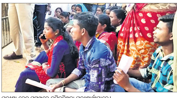
ପରୀକ୍ଷା କେନ୍ଦ୍ର ସମ୍ମୁଖରେ ବସିରହିଥିବା ପରୀକ୍ଷାର୍ଥୀମାନେ ।

ପ୍ରଶ୍ନପତ୍ର ପଢ଼ିବା ପରେ ଛାତ୍ରୀଛାତ୍ରମାନଙ୍କୁ ଛାତ୍ରାଳୟକୁ ଡାକି କେନ୍ଦ୍ରରେ ୨୩୮ ପରୀକ୍ଷାର୍ଥୀ ପରୀକ୍ଷା ଦେବାକୁ ଥିବା ବେଳେ ୨୫ ଛାତ୍ରୀ ପରୀକ୍ଷା ଦେଇ ପାରି ନ ଥିଲେ । ଛାତ୍ରାଳୟରେ ପଢ଼ିଆ ପ୍ରଶ୍ନପତ୍ର ବାହାରିବାକୁ ସେମାନେ ପରୀକ୍ଷା ଦେବାକୁ ବଞ୍ଚିତ ହୋଇଥିଲେ । ଉଲ୍ଲେଖଯୋଗ୍ୟ ଯେ, ରେଗୁଲାର ଓ ଏକ୍ସଟ୍ରା ପରୀକ୍ଷା ପାଇଁ ପରୀକ୍ଷା ଦେବାକୁ ଉପସ୍ଥିତ ଥିବା ୨୫ ଛାତ୍ରୀ ପରୀକ୍ଷା ଦେବାକୁ ବଞ୍ଚିତ ହୋଇଥିଲେ । ଏ ନେଇ ରାଜ୍ୟ ପୂଜ୍ୟ ବିଦ୍ୟାଳୟ ସାହିତ୍ୟିକଙ୍କ ପିଲାମାନଙ୍କର ଛାତ୍ରାଳୟ ବିଷୟ ପରୀକ୍ଷା ଥିଲା । ଅପରାହ୍ଣ ୧୫୩୦ରେ ଏମାନଙ୍କ ପରୀକ୍ଷା ଆରମ୍ଭ ହୋଇଥିଲା । ଗୋଟିଏ ଶ୍ରେଣୀରେ ବସିଥିବା ପରୀକ୍ଷାର୍ଥୀଙ୍କ