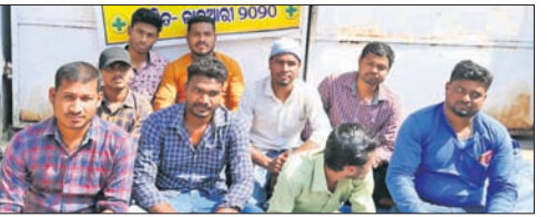
ସିଡିଏମ୍‌ଏସ୍ ଅଫିସ୍ ଆଗରେ ଧାରଣା ଦିଆଯାଇଛି ।

ବେକାରୀ ଫାର୍ମାସିଷ୍ଟମାନଙ୍କୁ ଉପେକ୍ଷା କରାଯାଇଥିବା ପ୍ରତିବାଦରେ ରାଜ୍ୟ ଫାର୍ମାସିଷ୍ଟ ସଂଘର ଧାରଣା ଦିଆଯାଇଛି । ଫାର୍ମାସିଷ୍ଟମାନଙ୍କୁ ଉପେକ୍ଷା କରାଯାଇଥିବା ପ୍ରତିବାଦରେ ରାଜ୍ୟ ଫାର୍ମାସିଷ୍ଟ ସଂଘର ଧାରଣା ଦିଆଯାଇଛି । ଫାର୍ମାସିଷ୍ଟମାନଙ୍କୁ ଉପେକ୍ଷା କରାଯାଇଥିବା ପ୍ରତିବାଦରେ ରାଜ୍ୟ ଫାର୍ମାସିଷ୍ଟ ସଂଘର ଧାରଣା ଦିଆଯାଇଛି ।