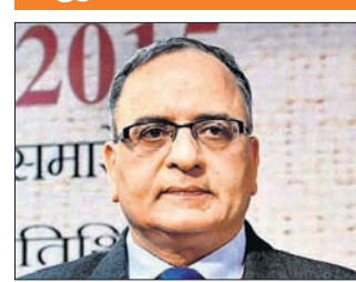
ନୂଆଦିଲ୍ଲୀ, ୧୯୧୭ (ପି.ଟି.)