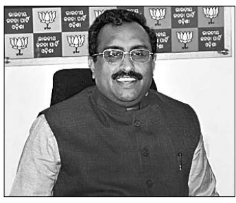
ଖବରଦାତା ସମ୍ମିଳନୀରେ ରାମ ମାଧବ।

ଭୁବନେଶ୍ୱର, ୧୯.୧୨ (ବୁଧବେଳା) - ଭୁବନେଶ୍ୱର କେନ୍ଦ୍ର ସରକାରଙ୍କ ସାଧାରଣ ବଚ୍ଚତ ଦ୍ୱାରା ଭାରତବର୍ଷର କୃଷକ, ମହିଳା, ଯୁବକ, ଜନକାଳି, ଦଳିତ ଓ ପଞ୍ଚୁଆ ବର୍ଗର ଲୋକମାନେ ଅଧିକ ଲାଭାନ୍ୱିତ ହେବେ। ବିଶେଷତାରେ ଓଡ଼ିଶା ଭଳି ରାଜ୍ୟରେ ଜନକାଳି, ଦଳିତ ଓ ପଞ୍ଚୁଆ ବର୍ଗର ଲୋକମାନେ ଏହି ବଚ୍ଚତରୁ ସବୁଠୁ ବେଶି ଲାଭ ପାଇପାରିବେ। ପ୍ରତି କ୍ଷେତ୍ରରେ ଭଲ ପ୍ରଦର୍ଶନ କରିଥିବା ରାଜ୍ୟଗୁଡ଼ିକ ପାଇଁ କେନ୍ଦ୍ର ସରକାରଙ୍କ ବଚ୍ଚତ ବରଦାନ ସବୁଠାରୁ ପ୍ରଥମ ରାଜ୍ୟ ସରକାର ଏହି ଦିନରେ କାର୍ଯ୍ୟକାରୀ କେନ୍ଦ୍ର ବଚ୍ଚତର ଲାଭ ଉଠାଇ ପାରିବେ। ଓଡ଼ିଶା ସରକାର କେନ୍ଦ୍ରୀୟ ଯୋଜନାରେ ସାମିଲ ହେବା ପାଇଁ କେନ୍ଦ୍ର ସରକାର ପ୍ରସ୍ତାବ ପଠାଇ ନ ଥିବାବେଳେ ମିଳୁଥିବା ଅନୁଦାନ ଠିକ୍ ଖର୍ଚ୍ଚ କରିପାରୁ ନାହିଁ ବୋଲି ଭାବପା ରାଷ୍ଟ୍ରୀୟ ସାଧାରଣ ସମ୍ପାଦକ ରାମ ମାଧବ ଅଭିଯୋଗ କରିଛନ୍ତି।