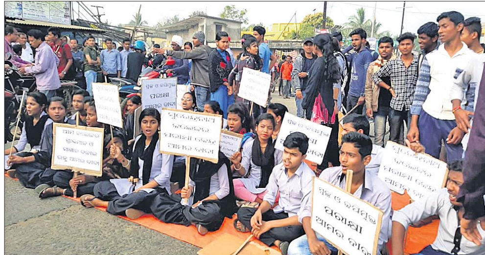
କମର୍ସ ଡାକବଙ୍ଗଳାଠାରେ ଛାତ୍ରଛାତ୍ରୀଙ୍କ ରାଜରାସ୍ତା ଅବରୋଧ।