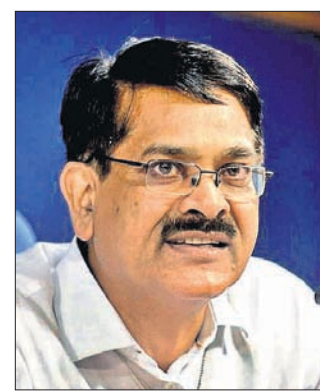
ନୂଆଦିଲ୍ଲୀ, ୧୯୧୭ (ପି.ଟି.)