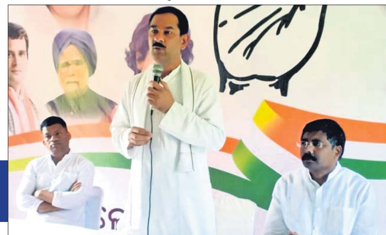
ଜିଲା କଂଗ୍ରେସ କାର୍ଯ୍ୟାଳୟରେ ସମୀକ୍ଷା କରାଯାଇଛି।