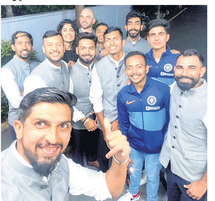
ହାଇ କମିଶନରଙ୍କୁ ଭେଟିବାକୁ ଯାଇଥିବା ଭାରତୀୟ ଖେଳାଳିମାନେ ।

ଫ୍ରେଲିଂଗର, ୧୯୧୨ ଲୁକ୍‌ମାନ୍ ଗପ୍ତରେ ଥିବା ଭାରତୀୟ କ୍ରିକେଟ୍ ଦଳ ଶୁଭକାରୀଠାରୁ ଘରୋଇ ଦଳ ବିପକ୍ଷରେ ୨ ମ୍ୟାଚ୍‌ସିରିଜ୍ ଟେଷ୍ଟ ସିରିଜ୍ ଖେଳିବ । ଏଥିପୂର୍ବରୁ ବିରାଟ କୋହଲିଙ୍କ ନେତୃତ୍ୱାଧୀନ ଭାରତୀୟ ଦଳ ବୁଧବାର ଫ୍ରେଲିଂଗରରେ ଅବସ୍ଥାପିତ ଭାରତୀୟ ହାଇକମିଶନରଙ୍କୁ ସୌଜନ୍ୟମୂଳକ ସାକ୍ଷାତ୍ କରିଛନ୍ତି । ଭାରତୀୟ ଦଳ ସହ ସପୋର୍ଟ୍ ଷ୍ଟାଫ୍ ଯାଇଥିଲେ । ‘ମୁଁ ଏଠାକୁ ଆସି ବହୁତ ସମ୍ମାନିତ ମନେକରୁଛି । ଆମର ସମସ୍ତ ଗପ୍ତରେ ହାଇକମିଶନରଙ୍କୁ ସାକ୍ଷାତ୍ କରିଥାଏ । ଏହା ବହୁତ ସ୍ୱତନ୍ତ୍ର ସମ୍ପାଦା ଥାଏ, କାରଣ ଆମେ ଭାରତୀୟ ଲୋକଙ୍କ ସହ ସମୟ ଅତିବାହିତ କରିଥାଉ । ପ୍ରକାଶଯୋଗ୍ୟ, ୩ ମ୍ୟାଚ୍‌ସିରିଜ୍ ଟି୨୦ ସିରିଜ୍ ଭାରତ ୩-୦ରେ ଲୁକ୍‌ପୁଲ୍‌ପ୍ କରିବା ପରେ ଦିନିକିଆ ସିରିଜ୍ରେ ନୈରାଶ୍ୟଜନକ ପ୍ରଦର୍ଶନ କରିଥିଲା । ଦିନିକିଆ ସିରିଜ୍‌କୁ ଲୁକ୍‌ମାନ୍ ୩-୦ରେ ଜିତି ଟି୨୦ ପରାଜୟର ମଧୁର ପ୍ରତିଶୋଧ ନେଇଥିଲା ।