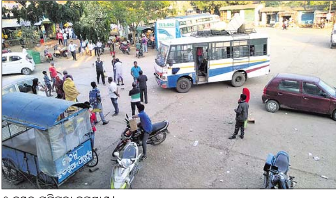
୧ ନମ୍ବର ଘସିପୁରା ବସଷ୍ଟାଣ୍ଡ।

ଆନନ୍ଦପୁରର ଲାଇଫ୍‌ଲାଇନ୍ ଭାବେ ପରିଚିତ ଓ ଏକ ନମ୍ବର ଘସିପୁରା ବସଷ୍ଟାଣ୍ଡ। ରାଜ୍ୟର କୋଣ ଅନୁକୋଣକୁ ଯିବା ପାଇଁ ସମଗ୍ର ଆନନ୍ଦପୁର ଉପଖଣ୍ଡର ଯାତ୍ରୀ ମାନେ ପୁଖ୍ୟତଃ ଏହି ବସଷ୍ଟାଣ୍ଡ ଉପରେ ନିର୍ଭର କରିଥାନ୍ତି। ଦୈନିକ ହଜାର ହଜାର ଯାତ୍ରୀ ଏହି ବସଷ୍ଟାଣ୍ଡ ଦେଇ ବିଭିନ୍ନ ଗ୍ରାମକୁ ଯାତ୍ରା କରୁଛନ୍ତି। କିନ୍ତୁ କେତେକ ଘରୋଇ ବସ୍ ମନମୁଖୀ କାର୍ଯ୍ୟ ପାଇଁ ଏହି ବସଷ୍ଟାଣ୍ଡ ଉପରେ ନିର୍ଭରଶୀଳ ଯାତ୍ରୀ ଏବେ ହଇରାଣ ହେଉଛନ୍ତି। ବସ ଗୁଡ଼ିକର ରୁଟ ଅନୁମତି ଏହି ବସଷ୍ଟାଣ୍ଡ ଦେଇ ଯିବା ପାଇଁ ଧାର୍ଯ୍ୟ ହୋଇଥିଲେ ମଧ୍ୟ ନିୟମ ଉଲ୍ଲଙ୍ଘନ କରି ରାତ୍ରିକାଳୀନ ବସ ଗୁଡ଼ିକ ଏହି ବସଷ୍ଟାଣ୍ଡକୁ ନ ଆସି ବାଲକପାସ ଏହିସବୁ ବସ ସିଧାସଳଖ ଯାତାୟାତ କରୁଛନ୍ତି। ଏହି ବସ ଗୁଡ଼ିକ ମଧ୍ୟରୁ ପ୍ରାୟ ୧୦ରୁ ଅଧିକ ବସ ରାତ୍ରିକାଳୀନ ଅର୍ଥାତ ରାତି ପ୍ରାୟ ୧୦ଟା ରୁ ଭୋର ବେଳେ ଖୁବଶୀଘ୍ର ଗ୍ରାମୀୟ ସ୍ୱେଚ୍ଛାସେବୀ ଅନୁଷ୍ଠାନ ଗୁଡ଼ିକ ଏହାର ପ୍ରତିବାଦ କରିବାକୁ ସଜବାଜ ହେଉଛନ୍ତି। ମିଳିଥିବା ସୂଚନାକୁ ପ୍ରାୟ ୧୨ ନମ୍ବର ଘସିପୁରା ବସଷ୍ଟାଣ୍ଡ ଦୈନିକ