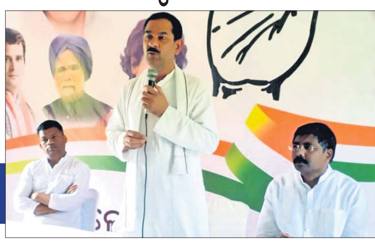
ଜିଲା କଂଗ୍ରେସ କାର୍ଯ୍ୟାଳୟରେ ସମୀକ୍ଷା କରାଯାଇଛି।