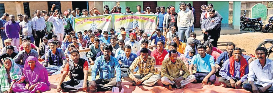
ବୈଠକରେ ଉପସ୍ଥିତ ମାରାଂଗୁରୁ ଅଦିମ ଖେରଫାଳ ସେବା ସମିତିର କର୍ମକର୍ତ୍ତା।

ମୟୂରଭଞ୍ଜ ଜିଲା ବାଇରଙ୍ଗପୁର ସବ୍‌ଡିଭିଜନ ଗୋରୁମହିଷାଣୀ ଲୁହାଖଣି ଅଞ୍ଚଳବାସୀଙ୍କ ବିକାଶ ଓ ଖଣିରେ କୁଶଳୀ ଏବଂ ଅଶକ୍ତମାନ ଶିକ୍ଷିତ ବେକାର ମୁବତୀମୁବକଙ୍କୁ ନିମୁକ୍ତି ଦାବି ନେଇ ମଙ୍ଗଳବାର ମାରାଂଗୁରୁ ଆଦିମ ଖେରଫାଳ ସେବା ସମିତି ସଂଗଠନ ପକ୍ଷରୁ ଏକ ବୈଠକ ଅନୁଷ୍ଠିତ ହୋଇଯାଇଛି। ଗୋରୁମହିଷାଣୀର ସମ୍ପୂର୍ଣ୍ଣ ଖଣି ଲିଜ୍‌ଧାରୀ ସ୍ଥାନୀୟ ଶିକ୍ଷିତ ମୁବତୀମୁବକଙ୍କ ସମେତ ଅଶକ୍ତମାନ ଓ କୁଶଳୀ ଲୋକଙ୍କୁ ବିଭିନ୍ନ କାର୍ଯ୍ୟରେ ନିମୁକ୍ତି ପ୍ରଦାନ କ୍ଷେତ୍ରରେ ଅବହେଳା କରୁଥିବା ନେଇ ବୈଠକରେ ଅଭିଯୋଗ ଉଠିଥିଲା। କାମଧରା ନ ପାଇ ଶିକ୍ଷିତ ବେକାର ମୁବତୀମୁବକମାନେ ଅନ୍ୟ ରାଜ୍ୟକୁ ଚାଲି ଯାଉଥିବା ନେଇ ସଂଗଠନର କର୍ମକର୍ତ୍ତାଙ୍କ ପକ୍ଷରୁ