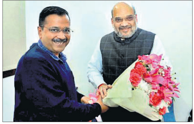
ଗ୍ୟାଭେରିଂ ସମ୍ପର୍କରେ ଆଲୋଚନା କରିଥିଲେ। ଏହାର କାର୍ଯ୍ୟକାରୀତା ଲାଗି ଯୋଜନା ପ୍ରସ୍ତୁତ କରିବାକୁ ସେ ମନ୍ତ୍ରୀ ଓ ଅଧିକାରୀମାନଙ୍କୁ କହିଥିଲେ।

ଦିଲ୍ଲୀ ବିଧାନସଭା ନିର୍ବାଚନ ପରେ ପୁଖ୍ୟମନ୍ତ୍ରୀ ଅରବିନ୍ଦ କେଜ୍ରିଓଲଙ୍କୁ କୁସ୍ତରୀ ପ୍ରଥମ ଥର ପାଇଁ ସ୍ୱରାଷ୍ଟ୍ରମନ୍ତ୍ରୀ ଅମିତ୍ ଶାହାଙ୍କୁ ଭେଟି ୨୦ ମିନିଟ୍ ଆଲୋଚନା କରିଛନ୍ତି। ଶାହାଙ୍କ ବାସଭବନରେ ଉଭୟେ ଦିଲ୍ଲୀ ସମ୍ପର୍କିତ ବିଭିନ୍ନ ପ୍ରସଙ୍ଗରେ କଥା ହୋଇଥିଲେ। ଦିଲ୍ଲୀର ବିକାଶ ପାଇଁ ଏକାଠି କାର୍ଯ୍ୟ କରିବାକୁ ସେମାନେ ରାଜି ହୋଇଥିବା କେଜ୍ରିଓଲଙ୍କୁ ରୁଚ୍ଛ କରିଛନ୍ତି। ଅନ୍ୟପକ୍ଷରେ କେଜ୍ରିଓଲ କୁସ୍ତରୀ ଚାକ୍ କ୍ୟାବିନେଟ ସହକର୍ମୀମାନଙ୍କ ସହ ଏକ ବୈଠକରେ ଜନସାଧାରଣଙ୍କୁ ଦିଆଯାଇଥିବା ୧୦