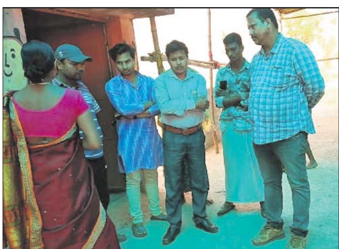
ଏକ ଅଙ୍ଗନୱାଡ଼ି କେନ୍ଦ୍ରରେ ବ୍ଲକ ଅଧ୍ୟକ୍ଷ ଓ ଏସିଡ଼ି ତଦନ୍ତ କରୁଛନ୍ତି।

ଭୁବନେଶ୍ୱର, ୧୯/୨ (ଡି.ଏନ.ଏ.): ବାଲେଶ୍ୱର ସଦର ବ୍ଲକ ଶ୍ରୀରାମପୁର ପଞ୍ଚାୟତ ଅନ୍ତର୍ଗତ ନିମା, ଶିବଂ ଓ ବୁଢ଼ୁରିପଦା ଅଙ୍ଗନୱାଡ଼ି କେନ୍ଦ୍ରରେ ମଙ୍ଗଳକାରୀ ତଦନ୍ତ ଆରମ୍ଭ ହୋଇଛି। ଏହି ଅଙ୍ଗନୱାଡ଼ି କେନ୍ଦ୍ରଗୁଡ଼ିକରେ