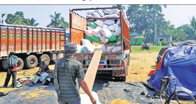
ମିଳକୁ ପଠାଯିବା ପାଇଁ ଧାନକିଣା ଟ୍ରକରେ ଲୋଡ଼ି କରାଯାଇଛି।

ପଦ୍ମପୁର, ୧୯/୨ (ଡି.ଏନ.ଏ.): ଭଦ୍ରକ ଜିଲା ସଦର ବ୍ଲକ ଅଧୀନ ସାବରଜାଠାରେ ମହିଳା ମହାସଂଘ ପକ୍ଷରୁ ଗୋରାମାଟି ଓ ସାବରଜା ପଞ୍ଚାୟତର ଗାଷ୍ଟାଠାରୁ ଧାନ କିଣା ଯାଉଛି। ପ୍ରଥମରୁ ଖେତ ଅଖାରେ ଗାଷ୍ଟାମାନଙ୍କଠାରୁ ଧାନ କିଣାଯାଇ ମିଳକୁ ପଠାଯାଉଥିଲା। ଏବେ ସଂଘ ତରଫରୁ ଜରି ବସ୍ତାରେ ଧାନ କିଣାଯିବାକୁ ନେଇ ବିବାଦ ବୃଦ୍ଧି ହୋଇଛି। ମଙ୍ଗଳବାର ସନ୍ଧ୍ୟାରେ ଦୁଇଟି ଟ୍ରକ ଯୋଗେ ସମଲପୁରକୁ ଜରି ବସ୍ତାରେ ଧାନ ପଠାଯିବା ପାଇଁ ବୋହେଇ କରାଯାଉଥିବାବେଳେ ଗାଷ୍ଟାମାନେ ଏହାକୁ ବିରୋଧ କରିଥିଲେ। ଫଳରେ ଧାନ ଟ୍ରକରେ ବୋହେଇ ହୋଇ ନ ପାରି ପଞ୍ଚାୟତ କାର୍ଯ୍ୟାଳୟ ସମ୍ମୁଖରେ ରଖାଯାଇଥିଲା। ରାତିତମାମ ଅଧୀନ ଗାଷ୍ଟା ଜରିବସ୍ତା ବେଳେ କୁସାବାର ସୁଖା ଉପାୟ ପାରିବାଣି ଗାଷ୍ଟାମାନେ ଅପରାହ୍ନରେ ଜିଲା ଯୋଗାଣ ଅଧିକାରୀ, ଜିଲା ଆରକ୍ଷା ଅଧୀକାରୀ ଓ ଗ୍ରାମାଞ୍ଚଳ ଆନାୟକଙ୍କୁ