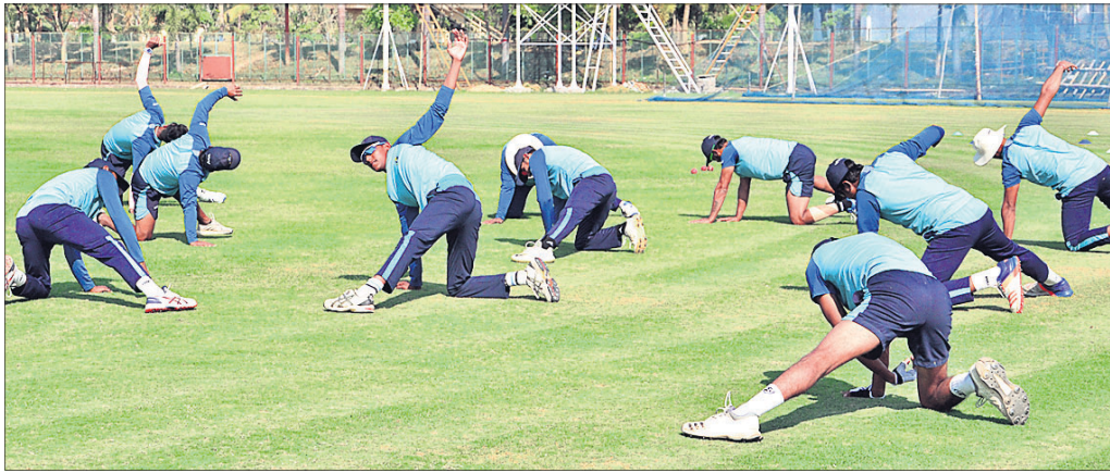
ଟ୍ରିପୁ ଗ୍ରାଉଣ୍ଡରେ ଅଭ୍ୟାସରତ ବେଙ୍ଗଲ କ୍ରିକେଟ୍ ଦଳ ।

ଓଡ଼ିଶା ଓ ବେଙ୍ଗଲ ଗତ ୨୦୧୫-୧୬ ରଣଜୀ ସିଜନରେ ଶେଷ ଥର ପାଇଁ ସାମ୍ନାସାମ୍ନି ହୋଇଥିଲେ । ବେଙ୍ଗଲ କ୍ରିକେଟ୍ ଏକାଡେମୀ ଗ୍ରାଉଣ୍ଡରେ ଏହି ମ୍ୟାଚ ଖେଳାଯାଇଥିଲା । ଏକ ଲୋ-ସ୍କୋରିଂ ମ୍ୟାଚ୍ରେ ବେଙ୍ଗଲଠାରୁ ୧୩୩ ରନରେ ଓଡ଼ିଶା ହାରିଥିଲା । ପ୍ରଥମେ ବ୍ୟାଟିଂ କରିଥିବା ବେଙ୍ଗଲ ୧୪୨ ରନରେ ଅଲଆଉଟ୍ ହେବା ପରେ ଓଡ଼ିଶାର ପ୍ରଥମ ଇନିଂସ ୧୦୬ ରନରେ ସୀମିତ ରହିଥିଲା । ବେଙ୍ଗଲ ବିପକ୍ଷରେ ୧୩୫