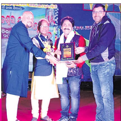
ଜଣେ କଳାକାରଙ୍କୁ ସମର୍ପିତ କରାଯାଇଛି।