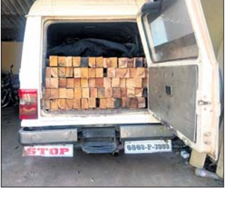
ଜବତ ହୋଇଥିବା କାଠ ସହିତ ଗାଡ଼ି।