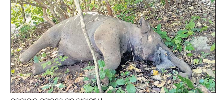
ତରମାକାଡ଼ କଙ୍ଗଲରେ ମୃତ ହାତୀଛୁଆ।