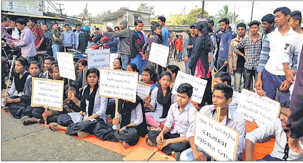
କମର୍ସ ଡାକବଙ୍ଗଳାଠାରେ ଛାତ୍ରଛାତ୍ରୀଙ୍କ ରାଜରାସ୍ତା ଅବରୋଧ।

ଭୋଗରାଇ, ୧୯/୨ (ଡି.ଏନ.ଏ.): ବାଲେଶ୍ୱର ଜିଲା ଭୋଗରାଇ ବ୍ଲକ ଅଧୀନ କମର୍ସ ପୁରୋହିତ ନାଥ ଉଚ୍ଚ ବିଦ୍ୟାଳୟ ବିଦ୍ୟାଳୟର ଶତାଧିକ ଛାତ୍ରଛାତ୍ରୀ ନିଜ କଲେଜରେ ମୂଳ ୨ ବାର୍ଷିକ ପରୀକ୍ଷା ଦାବିକରି ରାସ୍ତା ଅବରୋଧ କରିଥିଲେ। ଏହି ଦାବି ସମ୍ପର୍କରେ ଶିକ୍ଷା ବିଭାଗକୁ ଜଣାଇବାର ପ୍ରତିଶ୍ରୁତି ଦେବା ପରେ ରାସ୍ତା ଅବରୋଧ ହଟିଥିଲା। ଏହି କଲେଜରେ ଦୀର୍ଘବର୍ଷ ଧରି ମୂଳ ୨ ପରୀକ୍ଷାକେନ୍ଦ୍ର ହୋଇ ଆସୁଥିବା ବେଳେ ଗତବର୍ଷ ବାର୍ଷିକ ପରୀକ୍ଷାର ସ୍ଥଳକୁ ନେଇ କେତେକ ପରୀକ୍ଷାର୍ଥୀ ଓ ଅବକର୍ତ୍ତରଙ୍କ ସହିତ କଥା କଟାକଟି ଓ ଗାଡ଼ି ଅଟକ ଭଳି ଅଭିଯୋଗ ହୋଇଥିଲା। ଚଳିତବର୍ଷ ଏହି କଲେଜରେ ମୂଳ ୨ ପରୀକ୍ଷା କେନ୍ଦ୍ରକୁ ବାଟିଲି କରି ଏଠାରୁ ୧୫ କି.ମି. ଦୂର ଜଳେଶ୍ୱର ଦାନକୃଷ୍ଣ ମହାବିଦ୍ୟାଳୟରେ ପରୀକ୍ଷା କେନ୍ଦ୍ର ହୋଇ ଥିବାରୁ ଛାତ୍ରଛାତ୍ରୀମାନେ ଆନ୍ଦୋଳନକୁ ଓହ୍ଲାଇଛନ୍ତି।