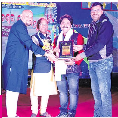
ଜଣେ କଳାକାରଙ୍କୁ ସମର୍ପିତ କରାଯାଇଛି।