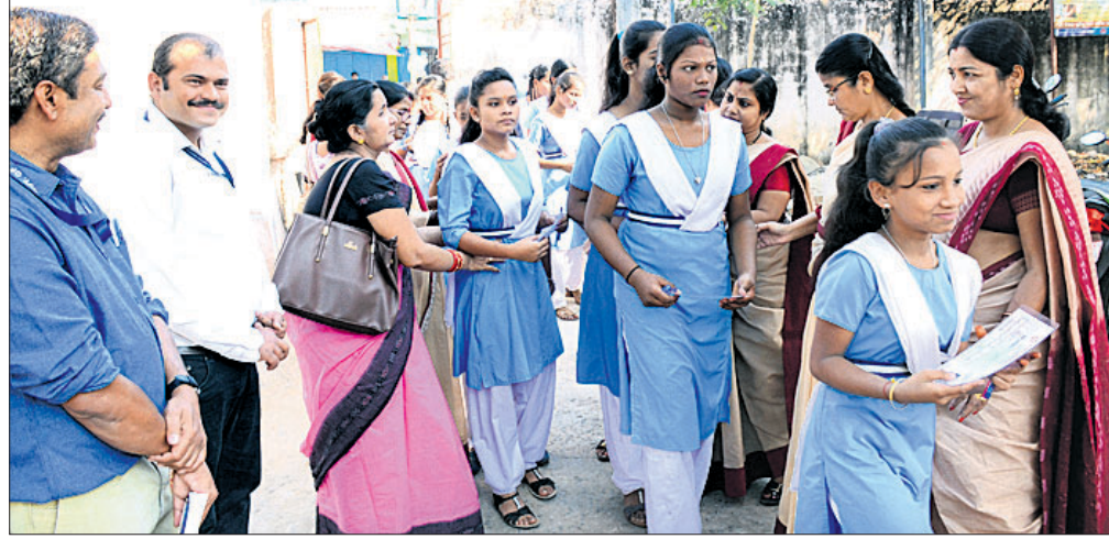
ଛାତ୍ରୀମାନେ ପରୀକ୍ଷା କେନ୍ଦ୍ରକୁ ଯିବା ପୂର୍ବରୁ ଯାଞ୍ଚ କରାଯାଉଛି।

ଚଳିତବର୍ଷର ମାଟ୍ରିକ ପରୀକ୍ଷା ବ୍ୟବସାୟ ଆରମ୍ଭ ହୋଇଛି। ପ୍ରଥମ ଦିନରେ ଅନୁଷ୍ଠିତ ମାତୃଭାଷା ପରୀକ୍ଷା ଶାନ୍ତିଶୃଙ୍ଖଳାରେ ସହ ଶେଷ ହୋଇଛି। ପ୍ରଥମ ଦିନରେ କୌଣସି ମାଲପ୍ରାକ୍ଟିକ୍ ହୋଇ ନ ଥିବା ଜିଲ୍ଲା ଶିକ୍ଷାଧିକାରୀଙ୍କ କାର୍ଯ୍ୟାଳୟ ପକ୍ଷରୁ ସୂଚନା ମିଳିଛି। କଟା ପୁରୀ ମଧ୍ୟରେ ପରୀକ୍ଷା ଆରମ୍ଭ ହୋଇଛି। ସକାଳ ୬ ଘଣ୍ଟାରେ ଜିଲ୍ଲାର ୧୬ ନୋଡାଲ ସେକ୍ଟରରୁ ପ୍ରଶ୍ନପତ୍ର ନିର୍ଦ୍ଧାରିତ ସମୟରେ ୨୧୬ ପରୀକ୍ଷା କେନ୍ଦ୍ରରେ ପହଞ୍ଚିଥିଲା। ପ୍ରଥମ ଦିନରେ ମାତୃଭାଷା ପରୀକ୍ଷା କରାଯାଇଥିଲା। ଜିଲ୍ଲାର ୨୧୬ କେନ୍ଦ୍ରରେ ୪୮ ହଜାର ୯୭୯ ଛାତ୍ରାଛାତ୍ରୀ ପରୀକ୍ଷା ଦେଇଛନ୍ତି। ବ୍ରହ୍ମପୁର ଭିତ୍ତିଗତ ବାଳିକା ଉଚ୍ଚ ବିଦ୍ୟାଳୟ କେନ୍ଦ୍ରରେ ଜିଲ୍ଲା ଶିକ୍ଷାଧିକାରୀ (ଡିଭିଓ) ଅନୁଲ୍ୟ କୁମାର ପ୍ରଧାନ, ଛତ୍ରପୁର ବ୍ଲକ ଶିକ୍ଷାଧିକାରୀ ଅଦିନୀଶ ଶତପଥୀ ଉପସ୍ଥିତ ରହି ପରୀକ୍ଷା ପରିଚାଳନା ଅନୁଧ୍ୟାନ କରିଥିଲେ। ପ୍ରଥମ ଦିନରେ କୌଣସି କେନ୍ଦ୍ରରେ ମାଲପ୍ରାକ୍ଟିକ୍ ସମ୍ପର୍କିତ