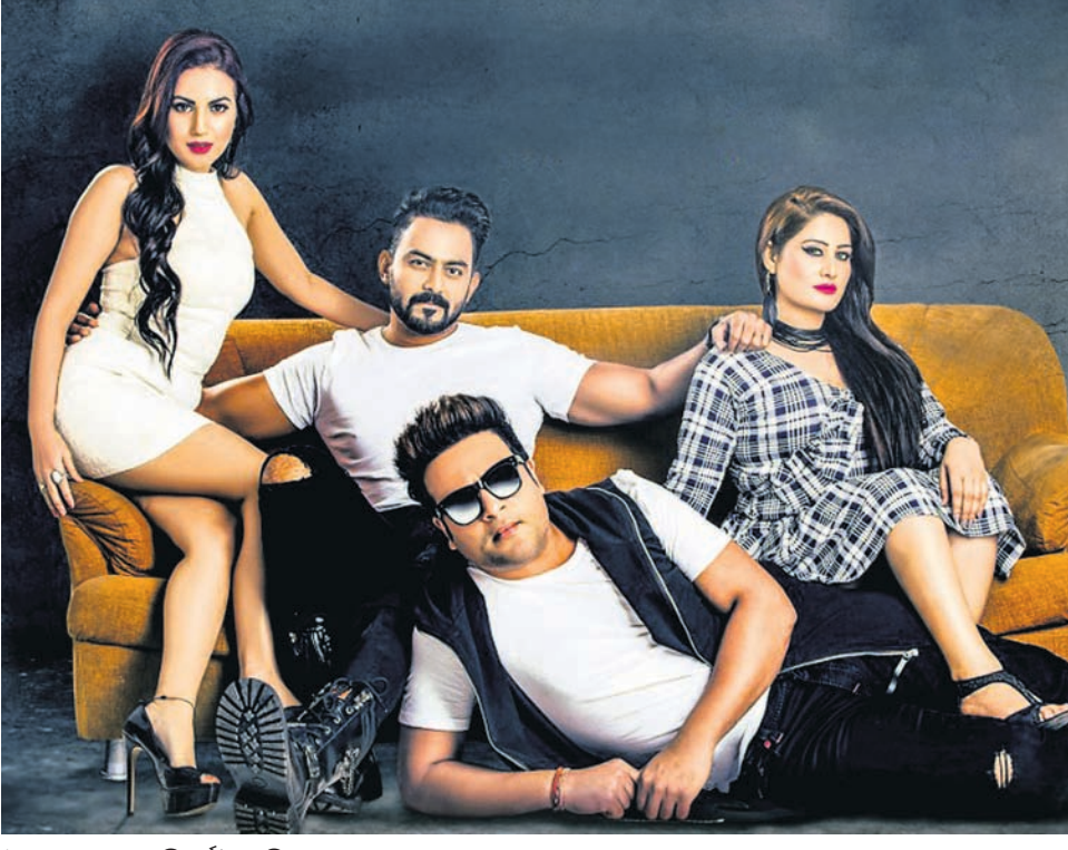
'ପୁଷ୍ପା ଆଇ ହେର୍ ଟିୟର୍ସ' ଚଳଚ୍ଚିତ୍ରର ଏକ ଦୃଶ୍ୟ।