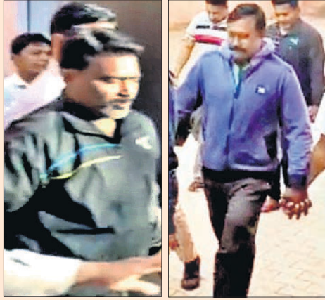
କୋର୍ଟ ପରିସରରେ ଡ୍ରାଇଭର ବଦ୍ଧି ଓ ଅନୁପ ସାଥୀ