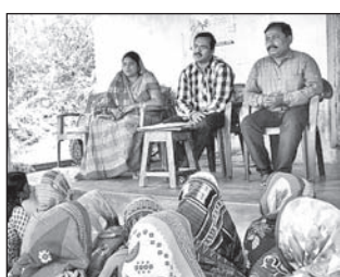
ଡେକାନାଲ ଅଫିସ, ୧୯୧୨: ଗର୍ଭିଣା କୁଳ ଦିନମ୍ବରପୁର ପଞ୍ଚାୟତ ଅଧୀନ ବୃନ୍ଦାବନପୁର ଗ୍ରାମ କୋଠରୀ ପରିସରରେ ୪୦ଜଣ ମହିଳା ଶ୍ରମଜୀବୀଙ୍କୁ ନେଇ ରୁଧିର ପ୍ରଶିକ୍ଷଣ ଶିବିର ଅନୁଷ୍ଠିତ ହୋଇଯାଇଛି।