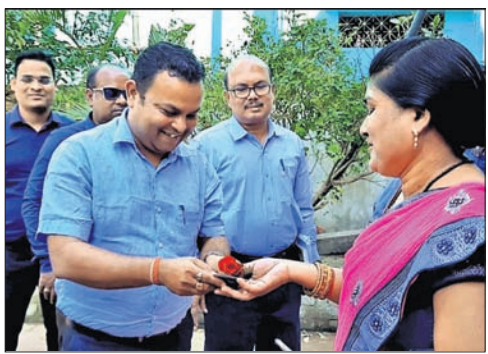
ବିଦ୍ୟୁତ୍ ବିଭାଗର ଅଧିକାରୀ ଜଣେ ସଚେତନ ମହିଳା ବିଦ୍ୟୁତ୍ ଉପଭୋକ୍ତାଙ୍କୁ ଥ୍ୟାଙ୍କ ୟୁ କାର୍ଡ ପ୍ରଦାନ କରୁଛନ୍ତି।