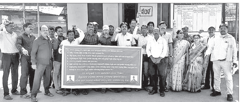
ଜିଲ୍ଲା କାର୍ଯ୍ୟାଳୟ ଆଗରେ ସରକାରୀ କର୍ମଚାରୀମାନେ ପ୍ରତିବାଦ କରୁଛନ୍ତି।