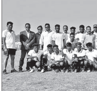
ଅତିଥିକ ସହ ଉଭୟ ଦଳର ଖେଳାଳିମାନେ।

ଭୁବନ ବାଜି ରାଉତ କଲେଜରେ ରୁଧିର କଲେଜପ୍ରତ୍ୟାୟ ବନ୍ଧୁତ୍ୱପୂର୍ଣ୍ଣ ପୁଠାବଳ ମ୍ୟାଚ୍ ଅନୁଷ୍ଠିତ ହୋଇଯାଇଛି। ବାଲୁକେସ୍ତର କଲେଜକୁ ୩-୧ ଗୋଲରେ ହରାଇ ଭୁବନ ବାଜି ରାଉତ କଲେଜ ବିଜୟୀ ହୋଇଛି।