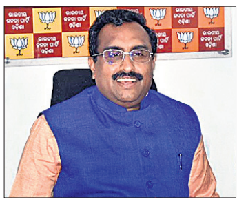
ଖବରଦାତା ସମ୍ପର୍କରେ ରାମ ମାଧବ।

ଭୁବନେଶ୍ୱର, ୧୯.୧୨ (ବୁଧବେଳା) - କେନ୍ଦ୍ର ଅନୁଦାନ ଖର୍ଚ୍ଚ କରିପାରୁନି ରାଜ୍ୟ ରାମ ମାଧବ।