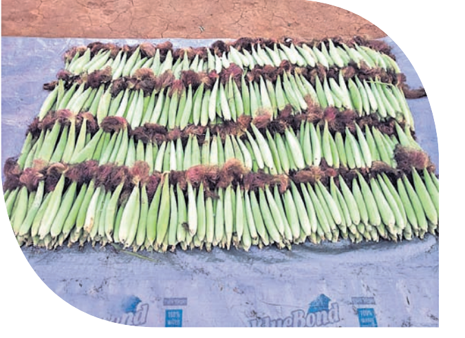
ବିଭୁଙ୍କ ଚାଷ ଜମିରୁ ଅମଳ ହୋଇଥିବା ବେବିକର୍ଣ୍ଣ।

ହୋଇଥିଲେ। ପାଠ ସରିବା ପରେ ସେ ପ୍ରଥମେ ଏକ ବିଜ୍ଞାପନ ଏଜେଣ୍ଟି ଖୋଲି ୬ ବର୍ଷ ଚଳାଇଥିଲେ। ପରେ ଆଇସିଆଇସିଆଇ ବ୍ୟାଙ୍କର ଅନୁଗୋଳ ଶାଖାରେ ବାମା ମ୍ୟାନେଜର ଭାବେ ନିଯୁକ୍ତି ପାଇଥିଲେ। ସେଠାରେ ୫ ବର୍ଷ ଧରି କାମ କରିଥିଲେ ମଧ୍ୟ ଚାକିରିର ମୋହ ତାଙ୍କୁ ରୋକିପାରି ନ ଥିଲା। କୃଷିକ୍ଷେତ୍ର ପ୍ରତି ମନରେ ଆଗ୍ରହ ଦେଖାଦେବାକୁ ସେ ଚାକିରି ଛାଡ଼ି ପ୍ରଥମେ ଭୁବନେଶ୍ୱରରେ ଥିବା ନିଜର ୧୧ ଏକର ଜମିରେ