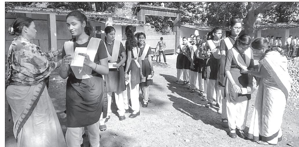
ପରୀକ୍ଷା କେନ୍ଦ୍ରରେ ଛାତ୍ରୀଙ୍କୁ ଯାଞ୍ଚ କରାଯାଇଛି।