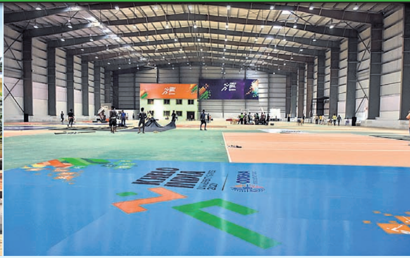
କିରରେ ଅଭିମ ପର୍ଯ୍ୟାୟରେ ପ୍ରସ୍ତୁତି ।