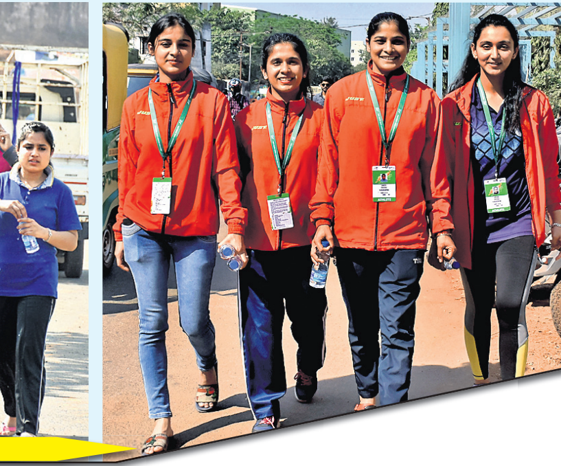
ଭୁବନେଶ୍ୱରରେ ପହଞ୍ଚିଥିବା ବିଭିନ୍ନ ବିଶ୍ୱବିଦ୍ୟାଳୟର ଖେଳାଳିମାନେ ।

ଭାରତରେ ହେବ ୨୦୨୨ ଏଏଫ୍ସି ମହିଳା ଏସିଆନ୍ କପ ଛୁଆଲାଇଣ୍ଡର, ୧୯୮୨(ପି.ଟି.)