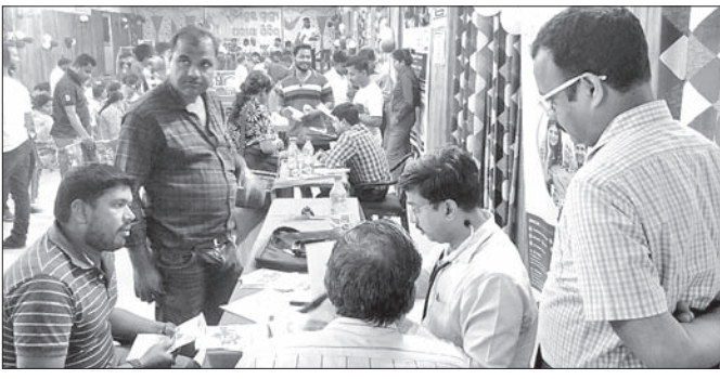
ଶିବିରକୁ ଆସିଥିବା ଜଣେ ବ୍ୟକ୍ତିଙ୍କୁ ଡାକ୍ତର ପରୀକ୍ଷା ଦେଉଛନ୍ତି।