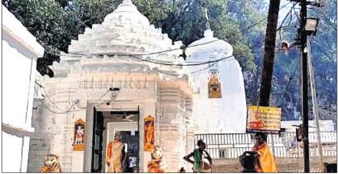
ଜାଗରଯାତ୍ରା ପୂର୍ବକୁ ଖେଳୁଛି ପୀଠ।