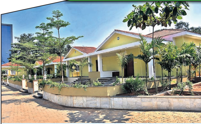
ଖେଳାଳିଙ୍କ ଅପେକ୍ଷାରେ କ୍ରୀଡ଼ାଗ୍ରାମ ।