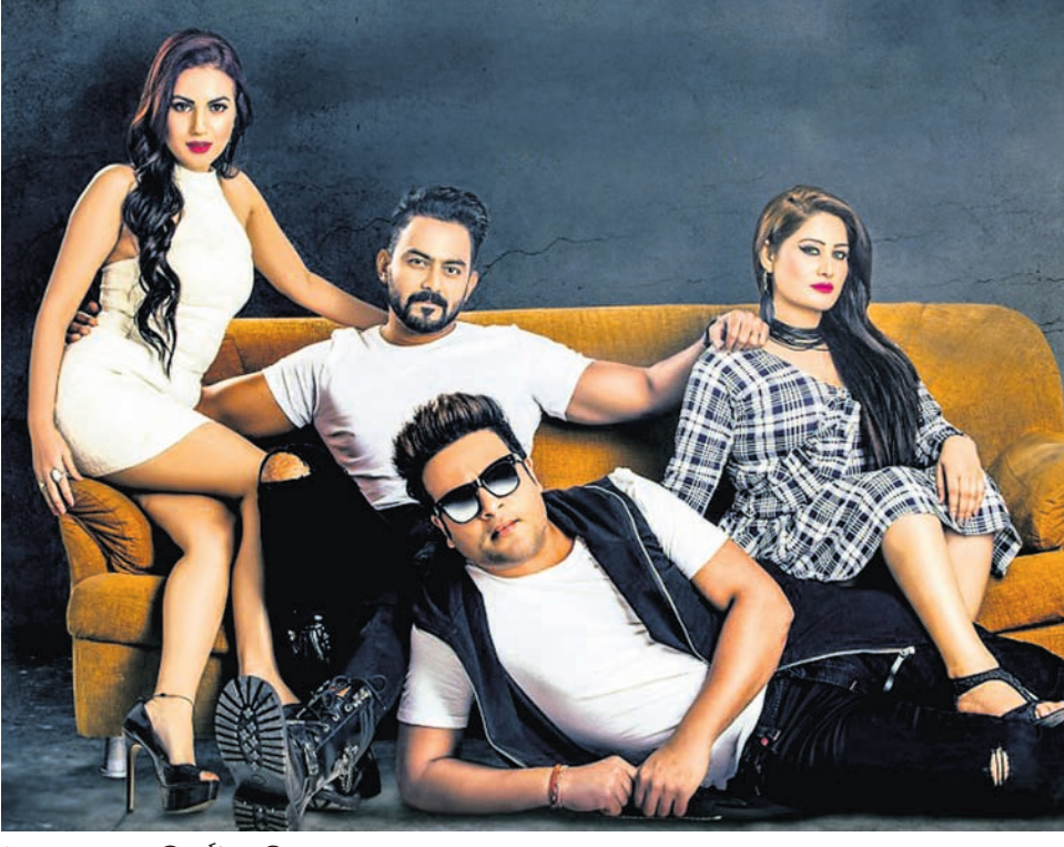
'ପୁଷ୍ପା ଆଇ ହେର୍ ଟିୟର୍ସ' ଚଳଚ୍ଚିତ୍ରର ଏକ ଦୃଶ୍ୟ।