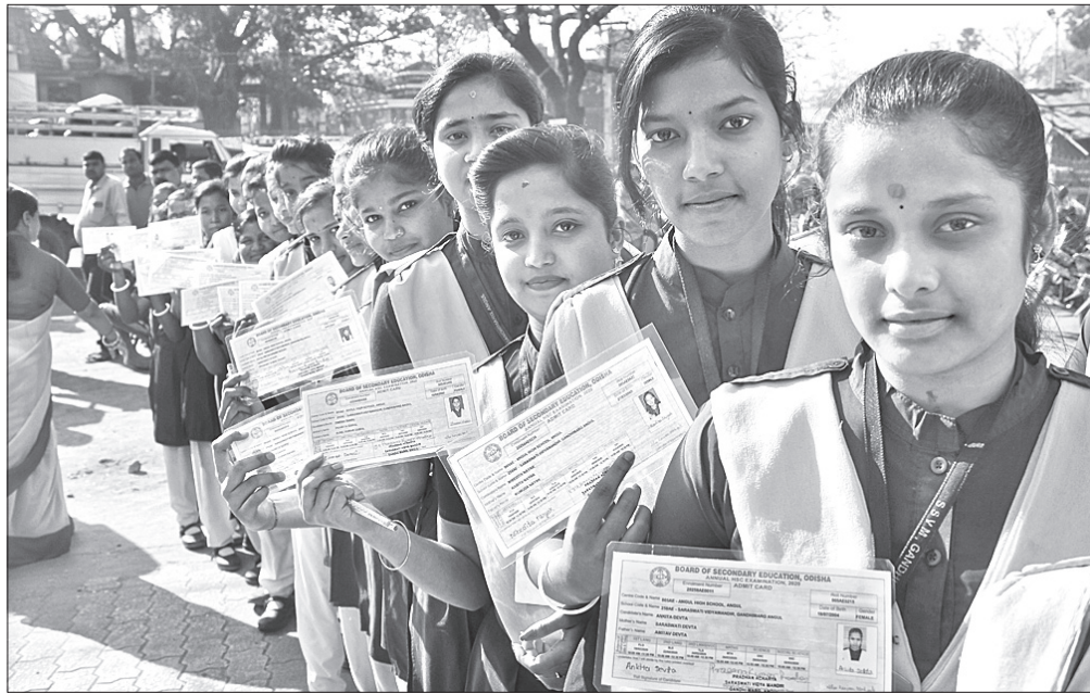
ଅନୁଗୋଳ ଉଚ୍ଚ ବିଦ୍ୟାଳୟ ପରୀକ୍ଷାକେନ୍ଦ୍ର ମଧ୍ୟକୁ ଛାତ୍ରୀମାନେ ପ୍ରବେଶ କରୁଛନ୍ତି।

ମାଧ୍ୟମିକ ଶିକ୍ଷା ପରିଷଦ (ବୋର୍ଡ) ଦ୍ୱାରା ରୁପବାର ଠାରୁ ଆରମ୍ଭ ହୋଇଥିବା ମାଟ୍ରିକ୍ ପରୀକ୍ଷାର ପ୍ରଥମ ଦିନରେ ସାହିତ୍ୟ ପରୀକ୍ଷା ଅନୁଗୋଳ ଜିଲ୍ଲାରେ ଶୁଖିଲାର ସହ ଶେଷ ହୋଇଛି।