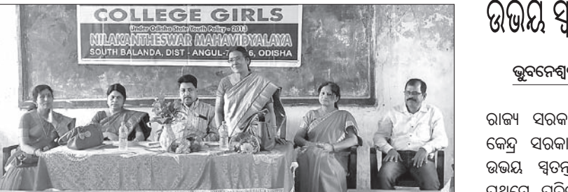
ତାଳଚେର, ୧୯୧୨ (ଡି.ପ୍ର.)

ତାଳଚେର ବ୍ଲକ ସାଉଥ୍‌ସାଇଡ୍‌ରେ ନାଳକଣ୍ଠେଶ୍ୱର ଉଚ୍ଚ ମାଧ୍ୟମିକ ବିଦ୍ୟାଳୟରେ ଆତ୍ମରକ୍ଷା ପ୍ରଶିକ୍ଷଣ ତାଲିମ ଶିବିର ଉଦ୍‌ଘାଟିତ ହୋଇଯାଇଛି।