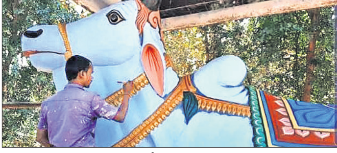
ମନ୍ଦିର ମୁଖଶାଳାରେ ଥିବା ବୃକ୍ଷର ପ୍ରତିମୂର୍ତ୍ତିରେ ରଙ୍ଗ ଦିଆଯାଇଛି।

କାମାକ୍ଷାନଗର, ୧୯୧୨(ଡି.ଏନ.ଏ.): ଢେଙ୍କାନାଳ ଜିଲ୍ଲା କାମାକ୍ଷାନଗର ଥାନା କାନପୁର ପଞ୍ଚାୟତ ଅଧୀନ ଶରଧାପୁର ଗ୍ରାମର ଜଣେ ବ୍ୟକ୍ତି ତାଙ୍କ ଖାଙ୍କ ଉପରେ ଗରମ ପାଣି ଫିଟିଥିବା ଅଭିଯୋଗ ହୋଇଛି। ଗୁରୁତର ଅବସ୍ଥାରେ ମହିଳା ଜଣକ କାମାକ୍ଷାନଗର ଉପଖଣ୍ଡ ଚିକିତ୍ସାଳୟରେ ଭର୍ତ୍ତି ହୋଇଛନ୍ତି। ଗଣମାଧ୍ୟମକୁ ସୂଚନା ଦେଇ ସେ କହିଛନ୍ତି, ସ୍ତ୍ରୀମାନେ ସବୁବେଳେ ତାଙ୍କୁ ନିର୍ଯାତନା ଦେଉଛନ୍ତି। ଏଥିରୁ ସେ ମୂକ୍ତି ଚାହୁଁଛନ୍ତି। ଏଥି ଲାଗି ତାଙ୍କୁ ସହାୟତା ଯୋଗାଇଦେବାକୁ ସେ ନିବେଦନ କରିଛନ୍ତି। ରିପୋର୍ଟ ଲେଖାଯିବା ସୁଦ୍ଧା ଏ ନେଇ ଥାନାରେ କୌଣସି ଅଭିଯୋଗ ହୋଇନାହିଁ।