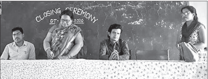
କାର୍ଯ୍ୟକ୍ରମରେ ଉପସ୍ଥିତ ଅଭିଯୋଗୀ।