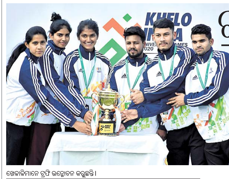
ଖେଳାଳିମାନେ ଟ୍ରଫି ଉନ୍ମୋଚନ କରୁଛନ୍ତି।

୨୮ ଉଲକେଟ ନେଇଛନ୍ତି। ପ୍ରାୟ ୩୦୦୦ ଟି ଚୋହାନ ୮୦ ଦଶକ ପ୍ରାରମ୍ଭରେ ଓଡ଼ିଶା ପକ୍ଷରୁ ୨୮ ପ୍ରଥମଶ୍ରେଣୀ କ୍ରିକେଟ ମ୍ୟାଚ ଖେଳିଛନ୍ତି। ଓଡ଼ିଶା କ୍ରିକେଟରେ ଦ୍ୱିତୀୟ ପିତାପୁତ୍ର ଭାବେ ଗୁରୁଜିତ-ପ୍ରାୟ ଓଡ଼ିଶା ପକ୍ଷରୁ ପ୍ରତିନିଧିତ୍ୱ କରିଛନ୍ତି। ପୂର୍ବରୁ ମଦନ ମୋହନ ମହାନ୍ତି ଓ ଯଶପାଲ ମହାନ୍ତି ଏହି କ୍ଲବର ସଦସ୍ୟ ଥିଲେ।