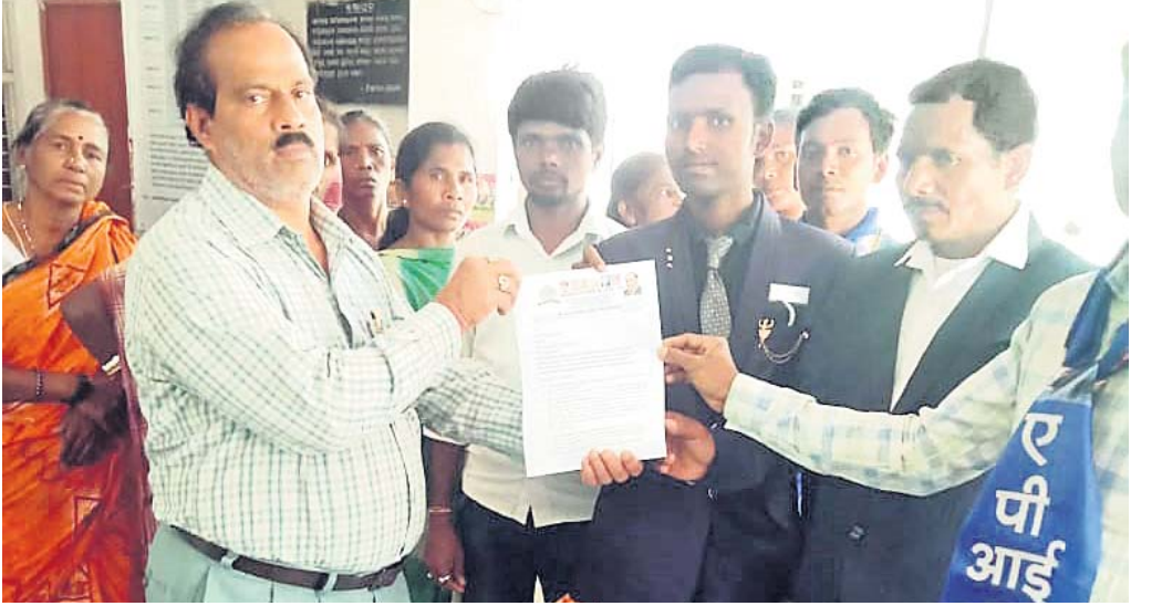
ଡେପୁଟି ଜିଲ୍ଲାପାଳ ଦାବିପତ୍ର ଗ୍ରହଣ କରୁଛନ୍ତି।