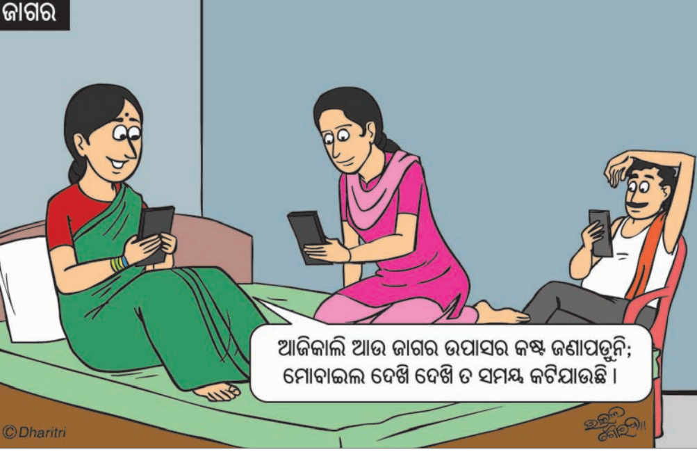
ଆଜିକାଲି ଆଉ ଜାଗର ଉପାସର ଜଣେ ଜଣାପଡ଼ୁନି; ମୋବାଇଲ ଦେଖି ଦେଖି ତ ସମୟ କଟିଯାଉଛି ।