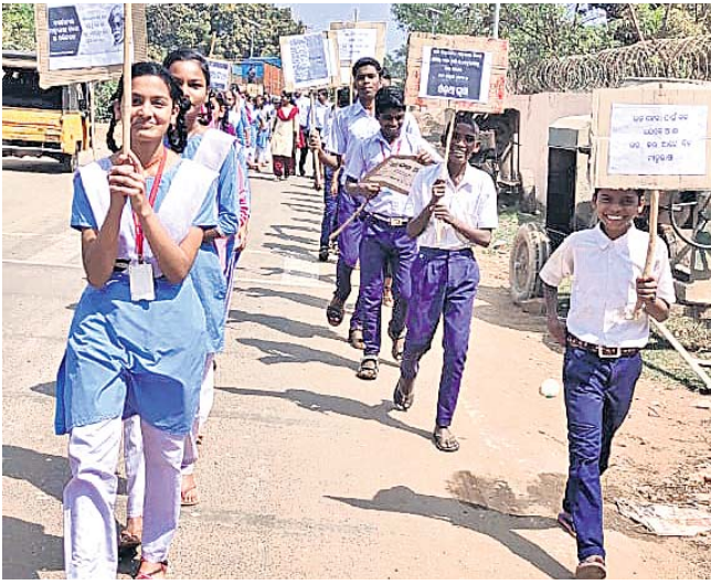
ଛାତ୍ରୀଛାତ୍ର ଶୋଭାଯାତ୍ରାରେ ସହର ପରିକ୍ରମା କରୁଛନ୍ତି।