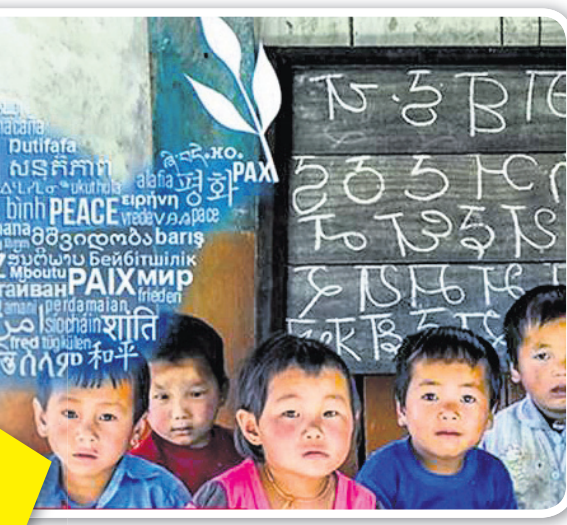
'ଭାଷା ବିକଳତା: ବିପଦରେ ଶାହଜାଦ ଭାଷା'। ନିକଟରେ କରାଯାଇଥିବା ଏକ ଅନୁଧ୍ୟାନରୁ ଜଣାପଡ଼ିଛି ଯେ, ବିଶ୍ୱରେ ଏବେ ୬୦୦୦ରୁ ଊର୍ଦ୍ଧ୍ୱ କଥିତ ଭାଷା ମଧ୍ୟରୁ ୪୫ ପ୍ରତିଶତ ବିପଦରେ ଏହି ଭାଷାଗୁଡ଼ିକ ମଧ୍ୟରୁ ମାତ୍ର କେତେ ଶହ ଭାଷାକୁ

ଏବେ ଶିକ୍ଷା କ୍ଷେତ୍ରରେ ସ୍ଥାନ ଦିଆଯାଇଛି ଓ ଶିକ୍ଷକ କମ୍ ଭାଷା ଡିକ୍ଟିନାରୀ ଖୋଲିବାକୁ ବ୍ୟବହାର କରାଯାଉଛି। ଭାଷା ଆମ ସଂସ୍କୃତିର ରକ୍ଷକ। ଭାଷା ଦିବସ ପାଳନ କରାଯିବା ଦ୍ୱାରା ଭାଷାଗତ ବିକଳତା ଓ ବହୁ ଭାଷା ଶିକ୍ଷାକୁ ସମ୍ମାନ ଦେବା ସହ ଭାଷାଗତ ତଥା ସାଂସ୍କୃତିକ ପରମ୍ପରା ପ୍ରତି ସଚେତନତା ସୃଷ୍ଟି କରାଯାଇପାରେ। ବିଶ୍ୱରେ ଏହି ଦିବସ ବାଂଲାଦେଶରେ ନିଆଁର ଢଙ୍ଗରେ ପାଳନ କରାଯାଏ। ଏହି ଦିବସରେ ଭାଷା ଆନ୍ଦୋଳନରେ ଶହାଡ଼ ହୋଇଥିବା ଶହାଡ଼ ସ୍ମାରକରେ ପୂଜା ଅର୍ପଣ କରାଯିବା ସହ ଏହିଦିନକୁ ଛୁଟି ଘୋଷଣା କରାଯାଇଥାଏ। ପ୍ୟାରିସ ସୁନେଲେ ମୃତ୍ୟୁମୁଖରେ ମଧ୍ୟ ପାଳନ କରାଯାଏ। ସ୍କୁଲ ବୃତ୍ତିକରେ ପିଲାମାନଙ୍କୁ ମାତୃଭାଷାରେ କହିବା ଓ ଲେଖିବାକୁ କୁହାଯାଏ। 'ବିକଳତା ମଧ୍ୟରେ ଏକତା' ବିକାଶକୁ ନେଇ ଭାରତ ବିଶ୍ୱରେ ଏକ ସ୍ୱତନ୍ତ୍ର ପରିଚୟ ସୃଷ୍ଟି କରିଛି। ଏହାର ସମ୍ପୂର୍ଣ୍ଣ ସାଂସ୍କୃତିକ ପରିବେଶ କ୍ଷେତ୍ରରେ ଭାଷାର ଭୂମିକା ରହିଛି। ଏହି ଭାରତରେ ଏହି ଦିବସ ପାଳନ କରାଯିବାର ଢେର ଚୁରୁଡ଼ୁ ଅଛି। ଭାଷାର କୌଣସି ସୀମା ନାହିଁ। ମାତୃଭାଷାର ସୁରକ୍ଷା କରି ଏହାକୁ ସମ୍ପୂର୍ଣ୍ଣ କରାଯାଇପାରିବ। ବିଶ୍ୱରେ ଶାନ୍ତି, ବିକାଶ ଓ ଏକତା ସହଜରେ ପ୍ରତିଷ୍ଠା ହୋଇପାରିବ।