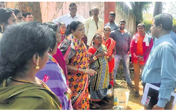
ପ୍ରଶାସନିକ ଅଧିକାରୀ ବିଶେଷକାରୀଙ୍କ ସହ ଆଲୋଚନା କରୁଛନ୍ତି।

ଖୁଣ୍ଟିଆ ସାହି ମହିଳା ମଣ୍ଡଳ ପଞ୍ଚାୟତ କାର୍ଯ୍ୟାଳୟ, ପାନୀୟ ଜଳ ଯୋଗାଣ ଓ ପରିମଳ ବିଭାଗ କାର୍ଯ୍ୟାଳୟରେ ତାଲା ପକାଇ ମହିଳାମାନେ ମାଠିଆ ରଖି ରାସ୍ତା ଅବରୋଧ କରିଛନ୍ତି। ଫଳରେ ଘ୍ନାନାୟ କଲେଜ ପଡ଼ିଆରେ ଚାଲିଥିବା ଏକ ସମ୍ମିଳନୀରେ ଯୋଗ ଦେବାକୁ ହେଲାପରେ ରାସ୍ତା ଅବରୋଧ ହଟିବ