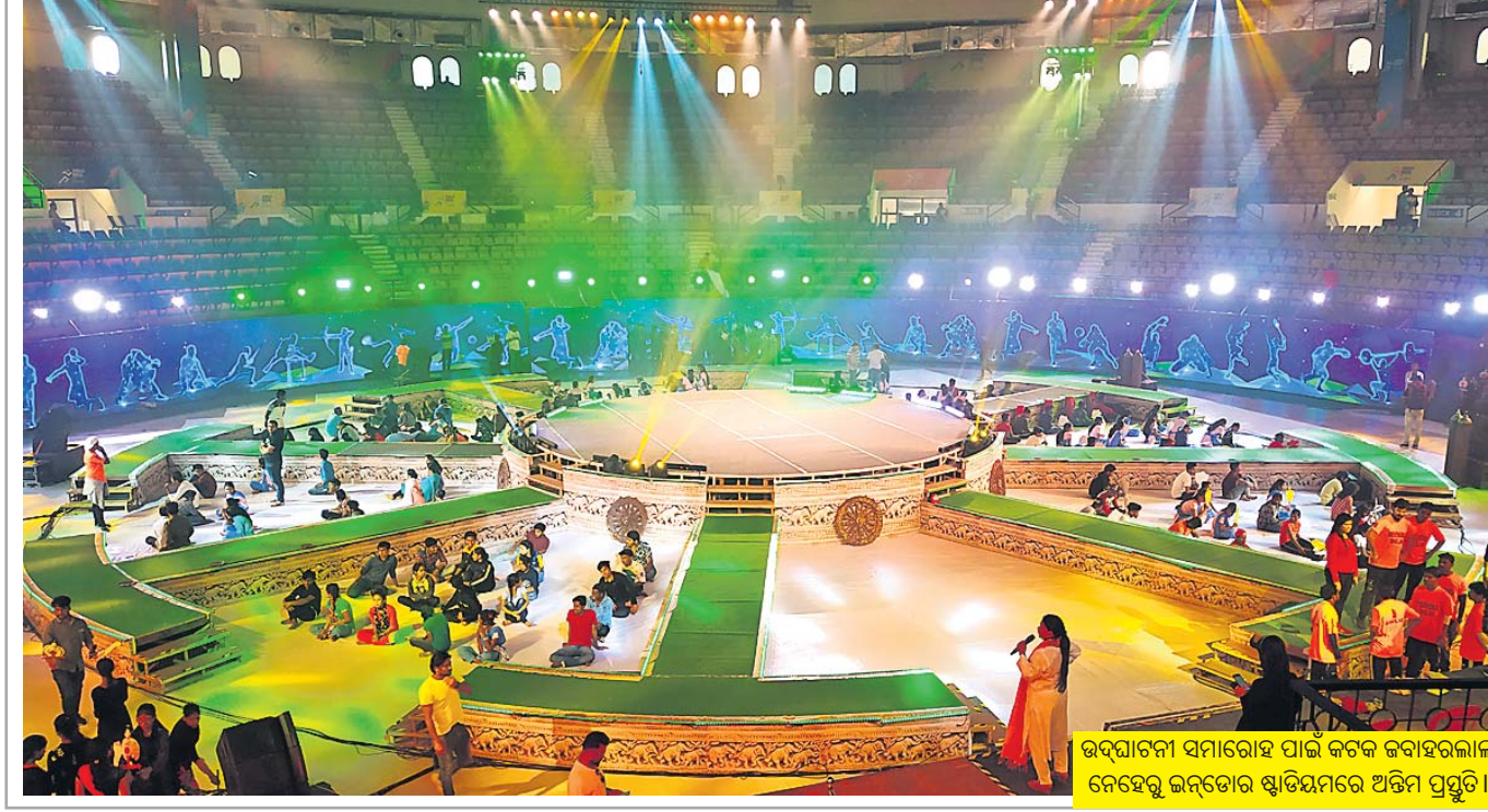
ଉଦ୍ଘାଟନା ସମାରୋହ ପାଇଁ କଟକ ଜବାହରଲାଲ ନେହେରୁ ଇନ୍ଦ୍ରପୋର ଷ୍ଟାଡିୟମରେ ଅତିନ ପ୍ରସ୍ତୁତି।

୩୮ ବର୍ଷୀୟ ଖେଳାଳି କହିଛନ୍ତି, ସେ ଦୁଇଘଣ୍ଟାରେ ହେବାକୁ ଥିବା ସର୍ବିସ ଟୁର୍ନାମେଣ୍ଟ, ଇଣ୍ଡିଆନ୍ ଫ୍ରେସ୍, ଦୁର୍ଗାମେଫ୍ ଫ୍ରେସ୍ ଓପନରେ ଖେଳିବେ ନାହିଁ। କିଛି ଦିନ ହେଲା ତାହା ସିନିୟର ପ୍ରାୟ ଲୋ କୋର୍ଟ ଇଭେଣ୍ଟରୁ ସେ ବାଡ଼ି ପଡ଼ିଛନ୍ତି। ଗୁଜୁରାଟରେ ତାଙ୍କ ଆଣ୍ଡରେ ଅସ୍ତ୍ରୋପଚାର କରାଯାଇଛି। ପୁରୁଷ ବର୍ଷରେ ସର୍ବାଧିକ ୨୦ ଗ୍ରାଣ୍ଡସ୍ଲାମ୍ ଟାଉଣ୍ଟଲ ଅଧିକାରୀ ଅଷ୍ଟ୍ରେଲିଆନ୍ ଓପନରେ ଆହତ ସମସ୍ୟା ସତ୍ତ୍ୱେ ସଂଘର୍ଷ କରିଥିଲେ। ଇଭେଣ୍ଟର ସେନିଫାଇନାଲରେ ଫେଡରରକୁ ସର୍ବିଆର ନୋଭାକ ଜୋକୋଭିଚ୍ ହରାଇଥିଲେ। ସେହି ମ୍ୟାଚ୍ରେ ଫେଡରର କୋର୍ଟକୁ ଓହ୍ଲାଇ ନାହାନ୍ତି।