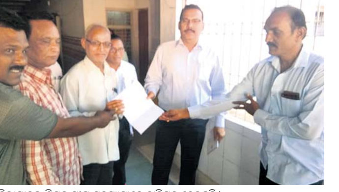
ଜିଲ୍ଲାପାଳଙ୍କୁ ଶିକ୍ଷକ ସଂଘ ସଦସ୍ୟମାନେ ଦାବିପତ୍ର ଦେଇଛନ୍ତି।