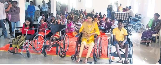
ହିରାଧିକାରୀଙ୍କୁ ମିଳିଥିବା ହୁଇଲ୍ ଚେୟାର।

କୋଲନରା ପଞ୍ଚାୟତ ସଦରସ୍ଥିତ କଲ୍ୟାଣମଣ୍ଡପରେ ଗୁରୁବାର ପଞ୍ଚାୟତସ୍ତରୀୟ ଭାଗଭୋଜ ଭିକ୍ଷଣ ସାମର୍ଥ୍ୟ ଶିବିର ଅନୁଷ୍ଠିତ ହୋଇଛି। ରାୟଗଡ଼ା ଡିଆରଟିଏ ପି.ଡି. ଅଧିକାରୀଙ୍କୁ ପ୍ରସାଦ ପ୍ରଦାନ କରି କାର୍ଯ୍ୟକ୍ରମ ଶୁଭାରମ୍ଭ କରିଥିଲେ। କୋଲନରା, ବଡ଼ଖୁଲାପଦର ଓ ସୁରା ପଞ୍ଚାୟତରୁ ୧୦୨ ଜଣ ଦିବ୍ୟାଙ୍ଗ ଶିବିରରେ ନାମ ପଞ୍ଜୀକରଣ କରିଥିଲେ। ୨ ଜଣଙ୍କୁ ଆଶାବାଡ଼ି, ୫ ଜଣଙ୍କୁ ଖୁଲ୍ ଷ୍ଟିଲ୍, ୫ଜଣଙ୍କୁ ହୁଇଲ୍ ଚେୟାର, ୩ ଜଣଙ୍କୁ ଶ୍ରବଣ ଯନ୍ତ୍ର ପ୍ରଦାନ