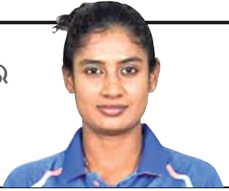
-ମିଥାଲି ରାଜ, ଭାରତୀୟ ମହିଳା କ୍ରିକେଟର

ଆଭସିସି ମହିଳା ଟି୨୦ ବିଶ୍ୱକପ୍ ଭାରତ ବିପକ୍ଷ ଓପିନିଂ ମ୍ୟାଚରେ ଅଷ୍ଟ୍ରେଲିଆ ଫେଡେରାଲଟ୍, କିନ୍ତୁ ଜିତିବା ସହଜ ହେବନାହିଁ।