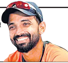
-ଅଜିତ୍ୟ ରାହାନେ, ଭାରତୀୟ କ୍ରିକେଟ ଦଳର ଉପଅଧିନାୟକ

ବିଷୟ ପତ୍ର ବର୍ତ୍ତମାନ ଖରାପ ସମୟ ଦେଇ ଗତି କରୁଥିବାରୁ ପ୍ରଦର୍ଶନରେ ଉନ୍ନତ ଆଶିବା ଉପରେ ଧ୍ୟାନ ଦିଅନ୍ତୁ।