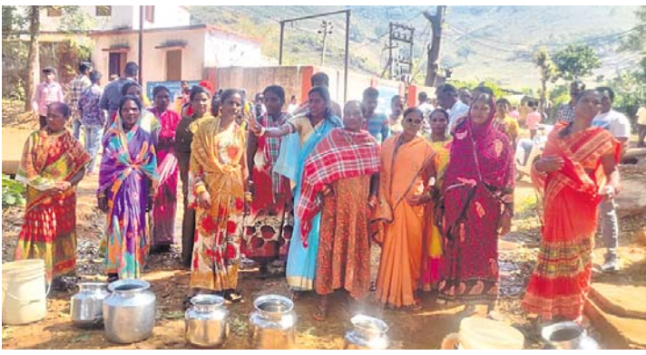
ମହିଳାମାନେ ରାସ୍ତା ଅବରୋଧ କରିଛନ୍ତି।