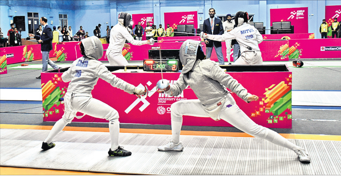
ଖେଳୋ ଇଣ୍ଡିଆ ବିଶ୍ୱବିଦ୍ୟାଳୟ ଦ୍ୱାରା ଅନୁଷ୍ଠିତ ଭୁବନେଶ୍ୱର ଶହୀଦ ନଗର ଇନ୍ଦ୍ରୋର ହଲରେ ଶୁକ୍ରବାର ଅନୁଷ୍ଠିତ ଫେନ୍ସିଂ ପ୍ରତିଯୋଗିତା।

ରାଜ୍ୟ ସରକାର ପୂର୍ବରୁ ଓଡ଼ିଶା ସବୁଜ ଶକ୍ତି ଉନ୍ନୟନ ନିଗମ (ଜେଡ଼କଲ) ନାମରେ ଏକ ସଂସ୍ଥା ଗଠନ କରିଛନ୍ତି। ଏହି ସଂସ୍ଥାଦ୍ୱାରା ଓଡ଼ିଶାରେ ୧୭ ସହରରେ ଯଥା-ବୁଲାର, ହାରାକ୍ରୁଦ, ରାଉରକେଲା, ପୁରୀ, ଖୋର୍ଦ୍ଧା, ବ୍ରହ୍ମପୁର, କୋରାପୁଟ, ନବରଙ୍ଗପୁର, ସୁନାବେଡ଼ା, ବାଲେଶ୍ୱର, ଭଦ୍ରକ, ବାରିପଦା, ଭୁବନେଶ୍ୱର ଏବଂ ବଲାଙ୍ଗୀରଠାରେ ୬୧୨ ସରକାରୀ କୋଠା ଉପରେ ଅନ୍ୟତମ ୧୯ ମେଗାଓାଟ୍ଟ କ୍ଷମତା ସମ୍ପନ୍ନ ରୁଫ୍ଟପ ଯୋଗ ପ୍ରକଳ୍ପ ଗ୍ଲାସନ କରିବା ପାଇଁ ନିଷ୍ପତ୍ତି ନିଆଯାଇଛି। ଏ ନେଇ ସମ୍ପୂର୍ଣ୍ଣ ପ୍ରକଳ୍ପ ରିପୋର୍ଟ