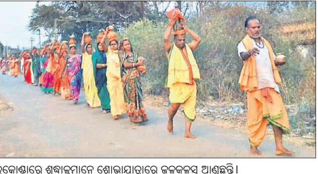
ଚିତ୍ରକୋଣ୍ଡାରେ ଶ୍ରଦ୍ଧାଳୁମାନେ ଶୋଭାଯାତ୍ରାରେ ଜନକଳସ ଆଣୁଛନ୍ତି ।

ଚିତ୍ରକୋଣ୍ଡା ସହରରେ ଅବସ୍ଥିତ ଆଖଣ୍ଡଳମଣି ଓ ନାଳକଣ୍ଠେଶ୍ୱର ମନ୍ଦିରରେ ମହା ଶିବରାତ୍ରି ପାଳିତ ହୋଇଛି । ଏହି ଅବସରରେ ବହୁ ଶ୍ରଦ୍ଧାଳୁଙ୍କ ସମାଗମ ହୋଇଥିଲା । ସ୍ୱାଭିମାନ ଅଞ୍ଚଳର ଛିଲେଟ୍ଟି, ଚନେଳ କ୍ୟାମ୍ପ, ଡାକ-ଝାମ, ଅପରେଟ କଲୋନା ଶିବ ମନ୍ଦିରରେ ମଧ୍ୟ ଭିତ ଦେଖିବାକୁ ମିଳିଥିଲା । ଶ୍ରଦ୍ଧାଳୁମାନେ ଭଜନଗର ରହି ଜାଗର କାଳିଥିଲେ ।