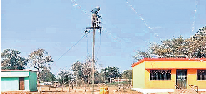
ସ୍କୁଲ ପରିସରରୁ ବିଦ୍ୟୁତ୍ ତାର ହଟାଯାଇଛି ।