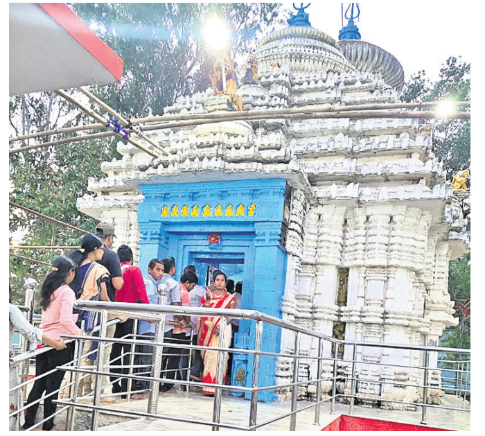
ମହାଶିବରାତ୍ରି ଉପଲକ୍ଷେ ରାଜସର, ତାବୁଗାଁ, ପାପଡ଼ାହାଣ୍ଡିଠାରେ ଶ୍ରଦ୍ଧାଳୁଙ୍କ ଲୟା ଯାତ୍ରା ।