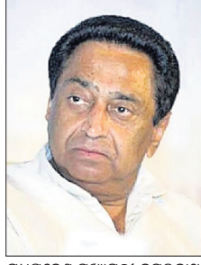
ମଧ୍ୟପ୍ରଦେଶ ମୁଖ୍ୟମନ୍ତ୍ରୀ କମଳନାଥ