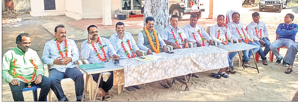
ନବ ନିର୍ବାଚିତ ହୋଇଥିବା ଜିଲ୍ଲା ଓ କୁଳ ସଭାପତିମାନେ ।

ଉପେକ୍ଷା କରି ପିଲାଙ୍କୁ ନିମ୍ନମାନର ଖାଦ୍ୟ ଦେବା ଏବଂ ଅସାମାଜିକ ପରିବେଶରେ ପିଲାଙ୍କୁ ରଖିବା ନେଇ ତାଙ୍କ ବିରୋଧରେ ଅଭିଯୋଗ ହୋଇଥିଲା । ଏହାର ତଦନ୍ତ କରି ରିପୋର୍ଟ ଦେବାକୁ ଜିଲ୍ଲା ପ୍ରଶାସନ ଖଇରପୁଟ ବିଭାଗକୁ ନିର୍ଦ୍ଦେଶ ଦେଇଥିଲା । ତଦନ୍ତ ପରେ ଜିଲ୍ଲା ଶିକ୍ଷା ଅଧିକାରୀଙ୍କ ଠିକ୍ ୯.୪୯୭/୨୦୨୦ ଆଧାରରେ ତାଙ୍କୁ ନିଲମ୍ବିତ କରାଯାଇଛି । ଏଥିସହ ତାଙ୍କୁ ନିଲମ୍ବନ ସମୟ ସାମା ମଧ୍ୟରେ ରୋଷ୍ଟା ଶିକ୍ଷା ଅଧିକାରୀଙ୍କ କାର୍ଯ୍ୟାଳୟରେ ଉପସ୍ଥିତ ରହିବା, ବିଭାଗୀୟ ନିୟମରେ ପୂର୍ଣ୍ଣ କାର୍ଯ୍ୟାଳୟ ନ ଛାଡ଼ିବାକୁ ଠିକ୍ରେ କୁହାଯାଇଛି । ସୂଚନାଯୋଗ୍ୟ ଯେ, ଜିଲ୍ଲା ଦଳ ଚଳେ କାଲିମେଳା କୁଳ କାଳୁକୋଣ୍ଡାସ୍ଥିତ କସ୍ତୁରବା ଗାନ୍ଧୀ ବାଲିକା ବିଦ୍ୟାଳୟର ପ୍ରଧାନ ଶିକ୍ଷୟିତ୍ରୀଙ୍କୁ କାର୍ଯ୍ୟରେ ଅବହେଳା ଯୋଗୁ ଅନ୍ୟତ୍ର ବଦଳି କରାଯାଇଥିଲା ।