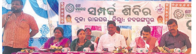
କାର୍ଯ୍ୟକ୍ରମରେ ଉଲ୍ଲସିତ ଅତିଥିମାନେ ।