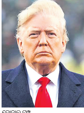
ଡୋନାଲ୍ ଟ୍ରମ୍ପ ଡ଼ିପ୍ଟିକୁ ସ୍ୱାଗତ କରାଯିବ। ପରେ ପ୍ରଧାନମନ୍ତ୍ରୀ ମୋଦି ଓ ରାଷ୍ଟ୍ରପତି ଟ୍ରମ୍ପ ମୁମ୍ବାଇରେ ହାତ୍ତାକ୍ରମଣ କରିବେ। ଏକାଧିକ ରୁଜୁରେ ସ୍ୱାକ୍ଷର କରି ମିଳିତ ଭାବେ ଖବରଦାତା ସମ୍ପର୍କକୁ ସମ୍ପୋଧନ କରିବାର କାର୍ଯ୍ୟକ୍ରମ ରହିଛି। ମଙ୍ଗଳବାର ରାତି ୧୦ଟାରେ ଟ୍ରମ୍ପ ଆମେରିକା ପ୍ରତ୍ୟାବର୍ତ୍ତନ କରିବେ। ୧୦ଟାରେ ରାଷ୍ଟ୍ରପତି ଭବନରେ ଟ୍ରମ୍ପ ଚିତ୍ରଟ ରିପୋର୍ଟ ପୃଷ୍ଠା: ୨

ଆମେରିକା ରାଷ୍ଟ୍ରପତି ତୋନାଲ୍ ଟ୍ରମ୍ପ ଯୋଗବାର ରୁଜୁଦିନିଆ ଭାରତ ଗସ୍ତରେ ଆସୁଛନ୍ତି। ତାଙ୍କ ସହ ଫାଷ୍ଟ ଲେଡି ମାଲେନିଆ, ଡିଏ ଲଭାକା ଟ୍ରମ୍ପ ଓ କାର୍ଲ ଡାରେଡ୍ କୁଶନର ମଧ୍ୟ ଆସିବେ। ଟ୍ରମ୍ପଙ୍କ ପ୍ରଥମ ଗସ୍ତ ଲାଗି ଅନୁମୋଦନ ଦିଆଯାଇଛି। ଡିଏ ଲଭାକା ଟ୍ରମ୍ପଙ୍କୁ ପରିବାରକୁ ସ୍ୱାଗତ କରିବା ଲାଗି କେବଳ ରୁଜୁରାଚରେ ଭବ୍ୟ ଆୟୋଜନ କରାଯାଇଛି। ରାଷ୍ଟ୍ରପତି ଟ୍ରମ୍ପ ଯୋଗବାର ଏକ ସ୍ୱତନ୍ତ୍ର ବିମାନରେ ଆସି ପୂର୍ବାହ୍ନ ୧୧ଟା ୪୦ ମିନିଟରେ ଅନୁମୋଦନପୂର୍ଣ୍ଣ ସ୍ୱାଗତ କରିବା ପାଇଁ ଶକ୍ତିଶାଳୀ ଆୟୋଜନ କରାଯାଇଛି। ଆୟୋଜନ କରାଯାଇଛି। ରାଷ୍ଟ୍ରପତି ଟ୍ରମ୍ପ ଯୋଗବାର ଏକ ସ୍ୱତନ୍ତ୍ର ବିମାନରେ ଆସି ପୂର୍ବାହ୍ନ ୧୧ଟା ୪୦ ମିନିଟରେ ଅନୁମୋଦନପୂର୍ଣ୍ଣ ସ୍ୱାଗତ କରିବା ପାଇଁ ଶକ୍ତିଶାଳୀ ଆୟୋଜନ କରାଯାଇଛି। ଆୟୋଜନ କରାଯାଇଛି।