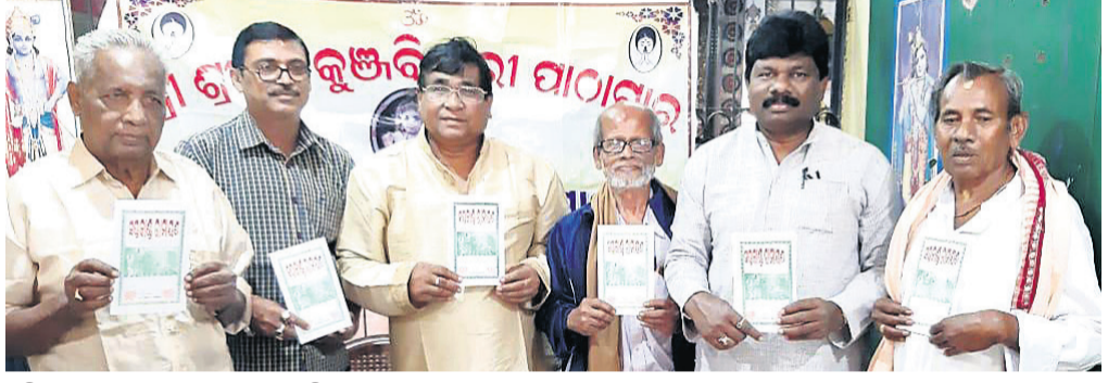
ଅତିଥିମାନେ ପୁସ୍ତକ ଉନ୍ମୋଚନ କରୁଛନ୍ତି ।