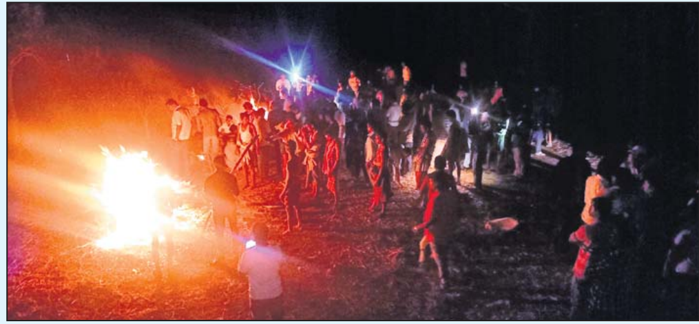
ଗଞ୍ଜାମ ଜିଲା ଖଇରଚଟା ଗାଁରେ ରବିବାର ୪ ଜଣ ପିଲାଙ୍କର ମୃତ୍ୟୁ ହେବା ପରେ ଶୋକାଳୁଳ ପରିବେଶରେ ମୃତଦେହ ସଂସ୍କାର କରାଯାଇଛି । ନିକଟରେ ଗ୍ରାମବାସୀ ଉପସ୍ଥିତ ଅଛନ୍ତି ।