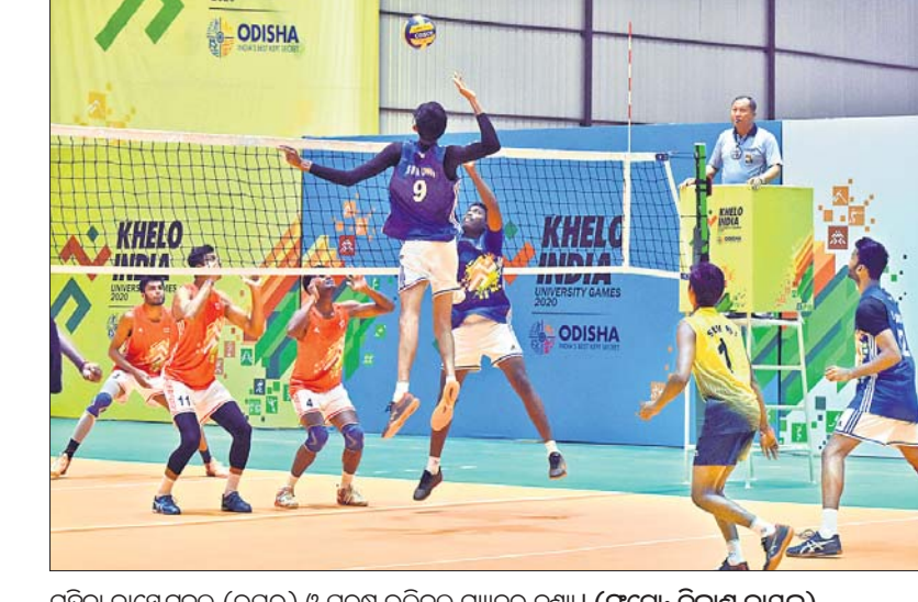
ମହିଳା ବାସ୍ତବ୍ୟରେ (ଉପର) ଓ ପୁରୁଷ ଭଲିବଲ୍ ମ୍ୟାଚର ଦୃଶ୍ୟ ।