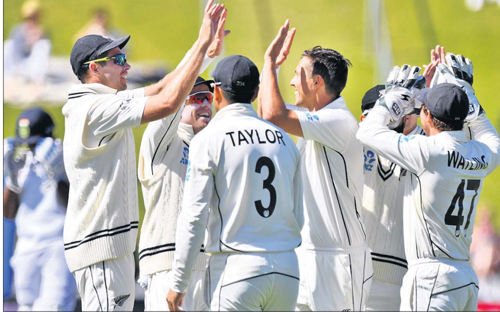
ଭଲକେଟ ହାସଲ ପରେ ନ୍ୟୁଜିଲ୍ୟାଣ୍ଡ ଖେଳାଳି ଖୁସି ମନାଉଛନ୍ତି ।

ଧାର୍ଯ୍ୟ ହୋଇଥିଲା । ଯାହାକୁ ଘରୋଇ ଦଳ କୌଣସି ଭଲକେଟ ନ ହରାଇ ହାସଲ କରି ନେଇଥିଲା । ଫଳରେ ୫ ଦିନ ଦୂରର କଥା ୪ର୍ଥ ଦିବସର ଅଧାରୁ ମ୍ୟାଚ ଶେଷ ହୋଇ ଯାଇଥିଲା । ପ୍ରଥମ ଲିନିଂସରେ ୪ ଓ ଦ୍ୱିତୀୟ ଲିନିଂସରେ ୫ ଭଲକେଟ ନେଇଥିବା ଟିମ୍ ସୋଦା ମ୍ୟାଚ ଅଫ ଦି ମ୍ୟାଚ ବିବେଚିତ ହୋଇଥିଲେ । ଭାରତ ପୂର୍ବରୁ ୨୦୧୮-