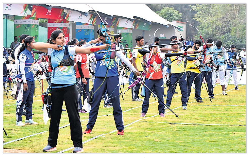
ତୀରଯାତ୍ରୀ ଇଭେଣ୍ଟ ଅବସରରେ ପ୍ରତିଯୋଗୀମାନେ ।