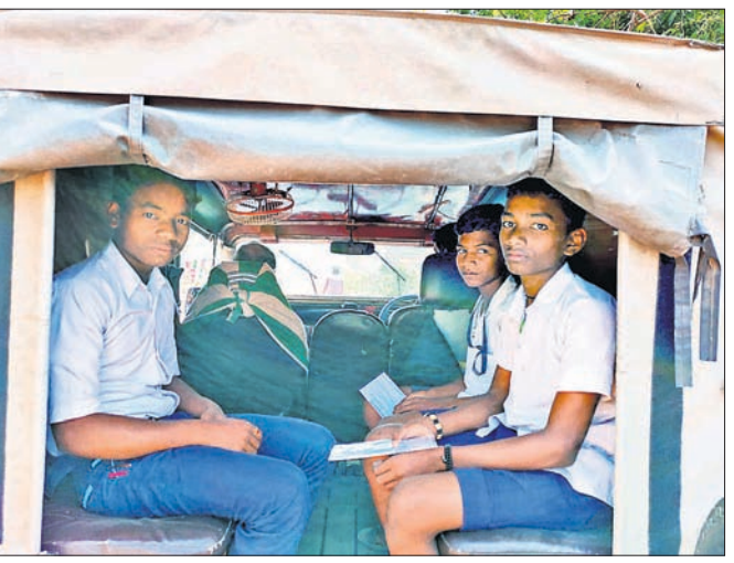
ତହସିଲ ଜିପରେ ଘରକୁ ଫେରୁଛନ୍ତି ପରୀକ୍ଷାର୍ଥୀ। ସହ ପରୀକ୍ଷା ପାଇଁ କଠିନ ପରିସ୍ଥିତି ଅଭିଭାବକଙ୍କୁ ଡକାଇ ପରୀକ୍ଷା କେନ୍ଦ୍ରକୁ କରିବାକୁ କହିଥିଲେ। ପରେ ସେମାନଙ୍କ ପିଲାଙ୍କୁ ନେବାଆଣିବା ନିମନ୍ତେ

ଦିଗପହଣ୍ଡି ତହସିଲଦାର ଅନୁଷ୍ଠିତ କୁମାର ସ୍କୁଲ ସୋମବାର ମଧ୍ୟାହ୍ନରେ ଫାଣ୍ଡିଗୁଡ଼ା ଗ୍ରାମ ହାଇସ୍କୁଲ ପରୀକ୍ଷା କେନ୍ଦ୍ର ପରିଦର୍ଶନ କରି ଫେରୁଥିବା ବେଳେ ଭୀଷ୍ମଗିରି-ନିମଖଣ୍ଡି ପେଣ୍ଠ ମୁଖ୍ୟ ରାସ୍ତାରେ ମାଟ୍ରିକ ପରୀକ୍ଷାର୍ଥୀମାନେ ୨ଟି ଅଟୋରେ ବିପଦସଙ୍କୁଳ ଅବସ୍ଥାରେ ଘରକୁ ଫେରୁଥିବା ଦେଖିଥିଲେ। ରାସ୍ତାରେ ଅଟୋ ଦୁଇଟିକୁ ଅଟକାଇ ଅଟୋ ଚାଳକଙ୍କୁ ଚାରିଦି କରାଯାଇ ସହ ପରୀକ୍ଷାର୍ଥୀଙ୍କୁ ଖାମୋସିଆ ପଞ୍ଚାୟତ ଶଙ୍କର ଖାଜିଗାଁ ଏବଂ ନିମଖଣ୍ଡି ପେଣ୍ଠ ଗାଁ ଛାଡ଼ି ପରୀକ୍ଷାର୍ଥୀଙ୍କୁ ଘରେ ଛାଡ଼ିଥିଲେ। ପରୀକ୍ଷାର୍ଥୀଙ୍କୁ ତହସିଲଦାର ବିଭିନ୍ନ ବିଷୟରେ ପ୍ରଶ୍ନ ପଚାରି ଉତ୍ତର ଦେବା