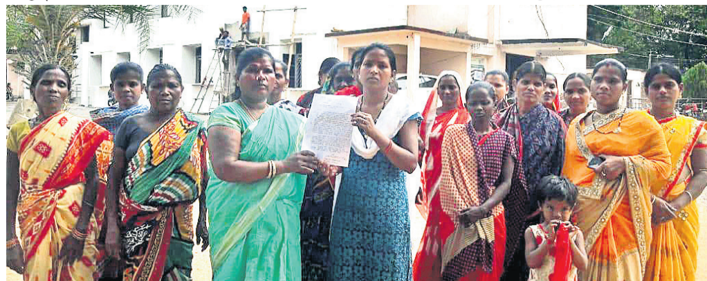
ଜିଲାପାଳଙ୍କୁ ଅଭିଯୋଗ କରିବାକୁ ଆସିଥିବା ମହିଳାମାନେ ।