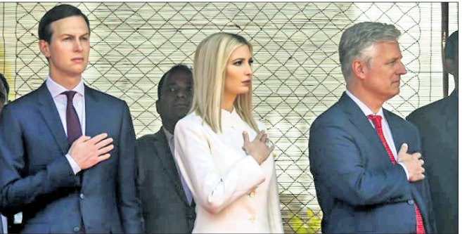
ରାଷ୍ଟ୍ରପତି ଭବନରେ ଟ୍ରମ୍ପଙ୍କୁ ସ୍ୱାଗତ କରାଯାଉଥିବାବେଳେ ଡୋନାଲ୍ଡ ଟ୍ରମ୍ପ, ମେଲାନିଆ ଟ୍ରମ୍ପ, ପ୍ରଧାନମନ୍ତ୍ରୀ ନରେନ୍ଦ୍ର ମୋଦି, ଡୋନାଲ୍ଡ ଟ୍ରମ୍ପ ଏବଂ ଆମେରିକାର କାଗଜ ନିରାପତ୍ତା ପରାମର୍ଶଦାତା (ଏନ୍ଏସଏ) ରବର୍ଟ ଓ'ବ୍ରାୟନ୍।

ଓ ଚୈସିଲାବାଦ ଏବଂ ଭାରତର ଦିଲ୍ଲୀସହର। ଭାରତର ଅନ୍ୟ ପ୍ରଦୂଷିତ ସହରଗୁଡ଼ିକ ମଧ୍ୟରେ ରହିଛି ନୋଏଡା, ଗୁରୁଗ୍ରାମ୍, ଗ୍ରେଡର ନୋଏଡା, ବାହାଡ଼ା, ଲକ୍ଷ୍ନୋ, ବୁଲନ୍ଦସହର, ମୁଜାଫରନଗର, ବାସ୍ତପୁର, ଜିଣ୍ଡ, ପରିବାଦା, କୋରବ, ଜିଣ୍ଡି ପାଟନା, ପଲ୍ଲୀପାଲ, ମୁଜାଫରପୁର, ହିସାର, ଯୋଧପୁର ଓ ମୋରାଦାବାଦ। ବିଶ୍ୱର ପଞ୍ଚମ ପ୍ରଦୂଷିତ ଦେଶ ଭାବେ ଭାରତ ସ୍ଥାନ ପାଇଥିବା ବେଳେ ବାଂଲାଦେଶ, ପାକିସ୍ତାନ, ମଙ୍ଗୋଲିଆ ଓ ଆଫଗାନିସ୍ତାନ ପଛରୁ ରହିଛି।