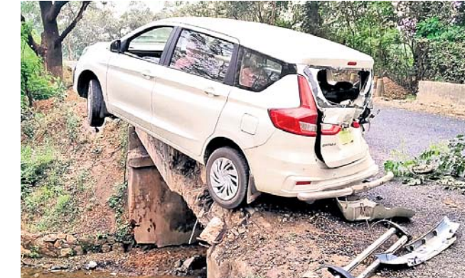
ରାୟଗଡ଼ା ଜିଲା ଲାଞ୍ଜାଠାରେ ଏକ ଟ୍ରକ କାରକୁ ଧକ୍କା ଦେବାରୁ କାରଟି ପୋଲରେ ଝୁଲିକି ରହିଛି ।