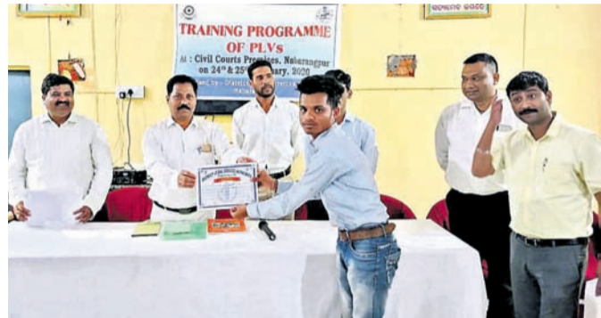
ପାରାଲିଗାଲ ସ୍ୱେଚ୍ଛାସେବୀଙ୍କୁ ମାନପତ୍ର ପ୍ରଦାନ କରାଯାଇଛି ।

ବିଜୁ ପ୍ରକାଶ କରାଯାଇଛି, ଏହା କେବଳ କାରଣରୁ କରାଯାଇଛି, ସେଥିରେ କଣ ରହସ୍ୟ ରହିଛି ବୋଲି ସେମାନେ ପ୍ରଶ୍ନ ଉଠାଇଛନ୍ତି ।