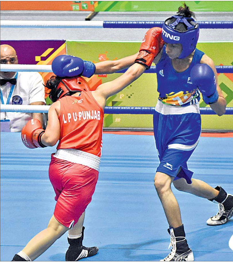
ମହିଳା ବକ୍ସିଂର ଏକ ରୋମାଞ୍ଚକ ମୁହୂର୍ତ୍ତ।