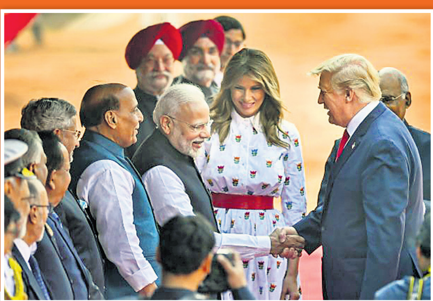
ରାଷ୍ଟ୍ରପତି ଭବନରେ ଟ୍ରମ୍ପ ଓ ପ୍ରଧାନମନ୍ତ୍ରୀ ମୋଦି କରମର୍ଦନ କରୁଛନ୍ତି। ନିକଟରେ ଅଛନ୍ତି ପ୍ରତିରକ୍ଷାମନ୍ତ୍ରୀ ରାଜନାଥ ସିଂଘ ଓ ଆମେରିକାର ପାଞ୍ଚ ଲେଡି ମାଲେନିଆ ଟ୍ରମ୍ପ।