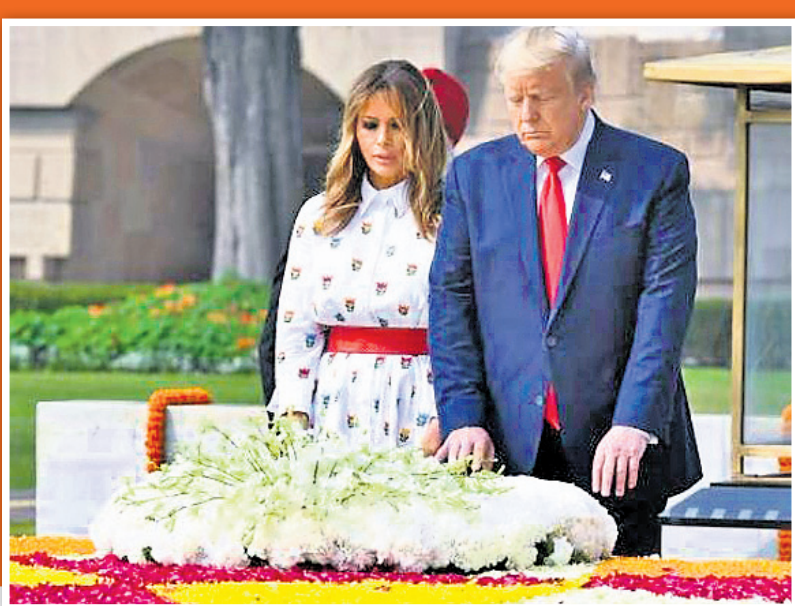
ରାଜସ୍ୱପତି ମହାତ୍ମା ଗାନ୍ଧୀଙ୍କ ସମାଧିରେ ଶ୍ରଦ୍ଧାଞ୍ଜଳି ଦେଉଛନ୍ତି ଟ୍ରମ୍ପ ଦମ୍ପତି।