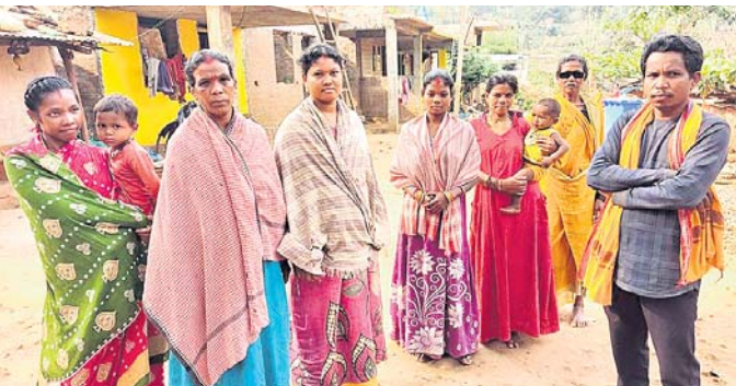
ଓଝା ଗ୍ରାମବାସୀ ଗ୍ରାମର ସମସ୍ୟା ଜଣାଉଛନ୍ତି।

ଏମାନେ ସଂଗ୍ରହ କରି ପାନୀୟଜଳଭାବେ ବ୍ୟବହାର କରିଥାନ୍ତି। ଏହା ଦୂଷିତ ଜଳ ହୋଇଥିବାବେଳେ ସେଥିରେ ପୋକ ଏବଂ ଆବର୍ଜନା ମଧ୍ୟ ପଡ଼ୁଛି। ଯଦ୍ୱାରା