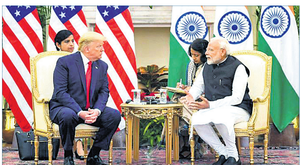
ନ୍ୟୁଆଦିଲ୍ଲୀର ହାଇଡ୍ରାବାଦ ହାଉସରେ ପ୍ରଧାନମନ୍ତ୍ରୀ ନରେନ୍ଦ୍ର ମୋଦି ଓ ଆମେରିକା ରାଷ୍ଟ୍ରପତି ଡୋନାଲ୍ଡ ଟ୍ରମ୍ପ।

ଭାରତ ଓ ଆମେରିକା ମଧ୍ୟରେ ମଙ୍ଗଳବାର ୩ ବିଲିୟନ ଡଲାରର ବୁକ୍ସ ପ୍ରତିରକ୍ଷା ବୁକ୍ସ ସାମଗ୍ରୀ ହୋଇଛି। ଆମେରିକା ରାଷ୍ଟ୍ରପତି ଡୋନାଲ୍ଡ ଟ୍ରମ୍ପଙ୍କ ଏହି ବୁକ୍ସଦାନ ଆର୍ଥିକାତ୍ମକ ଗ୍ରନ୍ଥ ବୁକ୍ସର ସମ୍ପର୍କକୁ ଆହୁରି ମଜବୁତ କରିବା ସହ ବିଶ୍ୱପ୍ରମାଣକୁ ନେଇଯିବ ବୋଲି ପ୍ରଧାନମନ୍ତ୍ରୀ ନରେନ୍ଦ୍ର ମୋଦି ଆଶାବ୍ୟକ୍ତ କରିଛନ୍ତି। ଏହି ସମ୍ପର୍କ କେବଳ ଦୁଇ ଦେଶର ସରକାରଙ୍କ ମଧ୍ୟରେ ସୁନାମ ନ ରହି ଲୋକାଭିମୁଖୀ ହେବ ବୋଲି ପ୍ରଧାନମନ୍ତ୍ରୀ କହିଛନ୍ତି। ସେହିପରି ଟ୍ରମ୍ପ ମଧ୍ୟ ବାଣିଜ୍ୟଠାରୁ ନେଇ କଣ୍ଠାର ପର୍ଯ୍ୟନ୍ତ ବିଭିନ୍ନ ପ୍ରସଙ୍ଗରେ ନିଜ ମତ ରଖିଛନ୍ତି। ତେବେ କେନ୍ଦ୍ର ସରକାରଙ୍କ ନାଗରିକତ୍ୱ ସଂଶୋଧନ ଆଇନ (ସିଏଏ) ବିରୋଧୀ ହିଂସାକୁ ନେଇ ସେ