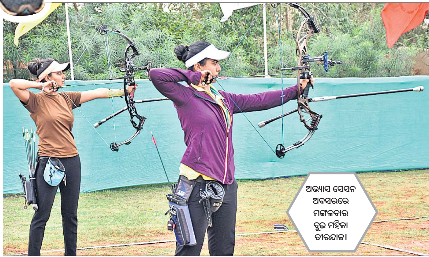
ଅଭ୍ୟାସ ସେସନ ଅବସରରେ ମଙ୍ଗଳବାର ବୁଲ ମହିଳା ଡୀରସାଜ।