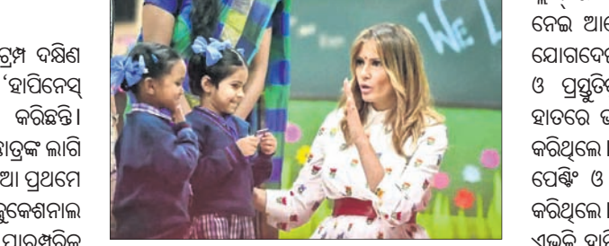
ବଂଶୀବାଦନ କରି ତାଙ୍କୁ ସ୍ୱାଗତ କରିଥିଲେ। ପରେ ମେଲାନିଆ ସ୍କୁଲର କ୍ଲବରୁମକୁ ଯାଇଥିଲେ। ଯୋଗ

ଆମେରିକାର ପ୍ରଥମ ମହିଳା ମେଲାନିଆ ଟ୍ରମ୍ପ ଦକ୍ଷିଣ ଦିଲ୍ଲୀ ସରକାରୀ ସ୍କୁଲରେ ମଙ୍ଗଳବାର 'ହାପିନେସ୍ କ୍ଲବ୍'ରେ ଯୋଗଦେଇ ଖୁସି ପ୍ରକଟ କରିଛନ୍ତି। ପାଠ୍ୟକ୍ରମ ନେଇ ସେ କହିଛନ୍ତି, ଏହା ଛାତ୍ରାଛାତ୍ରୀଙ୍କୁ ଲାଗି ସକାରାତ୍ମକ ଭାବରେ ପାଳିତ କରିବା ପ୍ରଥମେ ମୋତିବାଗିଚି ସର୍ବୋଦୟ କୋ-ଏକ୍ସକେମ୍ପନାଲ ସିନିୟର ସେକେଣ୍ଡାରୀ ସ୍କୁଲକୁ ଯାଇ ପାରମ୍ପରିକ ବେଶଭୂଷାରେ ସୁସଜ୍ଜିତ ଛାତ୍ରାଛାତ୍ରୀଙ୍କୁ ଭେଟିଥିଲେ। ପୂର୍ବରୁ ସ୍କୁଲକୁ ପୁଲରେ ସଜାଯାଇଥିଲା। ଛାତ୍ରାଛାତ୍ରୀମାନେ