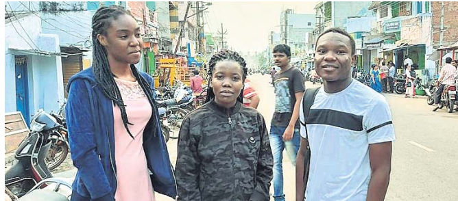
ପର୍ଯ୍ୟଟନସ୍ଥଳୀ ବୁଲିବାକୁ ଆସିଥିବା ବିଦେଶୀ ପର୍ଯ୍ୟଟକ ।