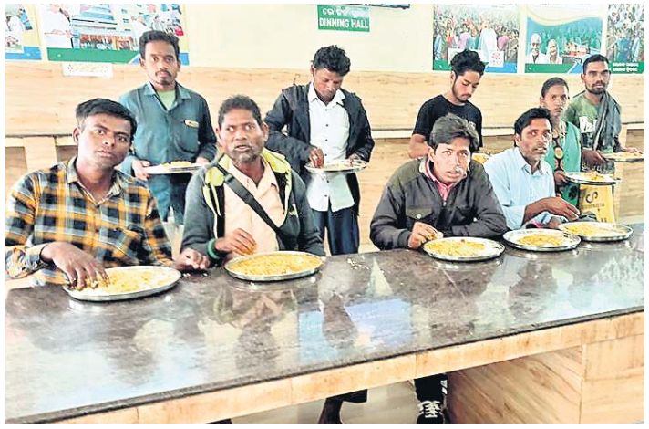
ଆହାର କେନ୍ଦ୍ରରେ ଲୋକମାନେ ଖାଉଛନ୍ତି।

ବିଭିନ୍ନ ରୋଗ ହେବା ଆଶଙ୍କା ରହିଛି। ହେଲେ ପାନୀୟଜଳର ଅନ୍ୟ କୌଣସି ଭଣ୍ଡା ନ ଥିବା ଯୋଗୁ ଏହା ହିଁ ଏକମାତ୍ର ସାହାଯ୍ୟ ହୋଇଥିବା ଓଡ଼ିଶା ସରକାରଙ୍କୁ ଜଣାଇ ଦିଆଯାଇଛି। ବିଶେଷ କରି ପାନୀୟଜଳ ବ୍ୟବହାର ଓ ରୋଗ ନିରାକରଣ ପାଇଁ ସ୍ୱାସ୍ଥ୍ୟ ବିଭାଗ ପକ୍ଷରୁ ଅନେକ ସଚେତନତା କାର୍ଯ୍ୟକ୍ରମ କରାଯାଇଛି। ହେଲେ ଏଠାରେ ବିଶ୍ୱାସ ପାନୀୟଜଳ ଯୋଗାଣ ପାଇଁ ପଦକ୍ଷେପ ନିଆଯାଇପାରୁନା। ଆଗକୁ ଗ୍ରାମରୁ ଆସୁଥିବାବେଳେ ଏହା ପୂର୍ବରୁ ପ୍ରଶାସନ ପକ୍ଷରୁ ପଦକ୍ଷେପ ନେବା ପାଇଁ ଗ୍ରାମବାସୀଙ୍କ ପକ୍ଷରୁ ଗୋବର୍ଦ୍ଧନ ଭୂୟାଁ, ଶିବ ଭୂୟାଁ, ବାସୁଦେବ ଭୂୟାଁ, ପୁନିଆ ଶବର, ପୂର୍ବତନ ସରପଞ୍ଚ ପାର୍ବତୀ ଭୂୟାଁ ଦାବି ଜଣାଇଛନ୍ତି।