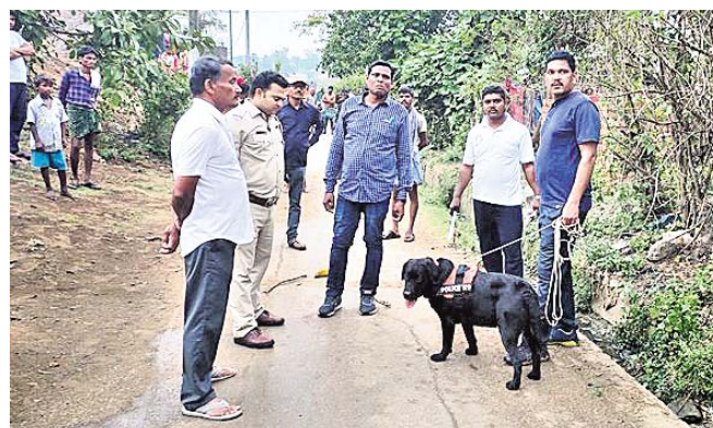
ସନ୍ଧାନୀ କୁକୁର ଡଦନ୍ତ କରୁଛି ।