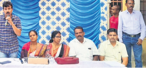
ଶିବିର ସମ୍ପର୍କରେ ସୂଚନା ଦେଇଛନ୍ତି ଅତିଥି ।

କୋରକୋଣ୍ଡା, ୨୫୨ (ଡି.ଏନ୍.ଏ.) ମାଲକାନଗିରି ଜିଲା କୋରକୋଣ୍ଡା କୂଳ କାର୍ଯ୍ୟକ୍ରମ ପରିସରରେ ମହାତ୍ମାଗାନ୍ଧୀ କାଟାୟ ଗ୍ରାମାଣି ନିଷ୍ଠିତ କର୍ମନିମ୍ବୁଡ଼ି ଯୋଜନା ଓ କାଟାୟ ସାମାଜିକ ସହାୟତା କାର୍ଯ୍ୟକ୍ରମ ପକ୍ଷରୁ କୁଳସଭାରେ ଜନ ଶୁଣାଣି ଶିବିର ମାଲକାନଗିରି ଅନୁଷ୍ଠିତ ହୋଇଯାଇଛି । ୨୦୧୯- ୨୦ ଆର୍ଥିକ ବର୍ଷର ଏପ୍ରିଲ ୧୬ ଶୁଣାଣି ସମ୍ମୁଖରେ ୨୦୧୯ ପର୍ଯ୍ୟନ୍ତ କୋରକୋଣ୍ଡା କୂଳ ଅଞ୍ଚଳରେ ୧୨ଟି ପଞ୍ଚାୟତରେ ଏହି ଯୋଜନାରେ ହୋଇଥିବା ସମସ୍ତ କାର୍ଯ୍ୟ ସମାପ୍ତ କରାଯାଇଥିଲା । ସମ୍ପୂର୍ଣ୍ଣ ବିବରଣୀ ଜନସାଧାରଣଙ୍କ ନିକଟରେ ପ୍ରକାଶ କରାଯାଇଥିଲା । ଏହି ଯୋଜନାରେ ଚିତ୍ତ ଥିବା ମୋଟ ପରିବାର ସଂଖ୍ୟା, ସଦସ୍ୟ ସଂଖ୍ୟା, ଜବକାତ୍ ପାଇଥିବା ସଦସ୍ୟ ସଂଖ୍ୟା, ଧାର୍ଯ୍ୟଲକ୍ଷ୍ୟ ଥିବା କାର୍ଯ୍ୟକାରୀତା ଦିବସ, ଶହେ ଦିନ ପୂରଣ କରିଥିବା କାର୍ଯ୍ୟସଂଖ୍ୟା, ବିଭିନ୍ନ କାର୍ଯ୍ୟରେ ଖର୍ଚ୍ଚ ହୋଇଥିବା ଅର୍ଥର ପରିମାଣ ଆଦି ଜନସାଧାରଣଙ୍କ ନିକଟରେ ଉପସ୍ଥାପନ କରାଯାଇଥିଲା । ଏଥିସହ ସମାପ୍ତ ରିପୋର୍ଟରେ ହୋଇଥିବା ତ୍ରୁଟିଗୁଡ଼ିକ ସମ୍ପର୍କରେ ମଧ୍ୟ ଜନସାଧାରଣଙ୍କୁ ଅବଗତ କରାଯାଇଥିଲା ।