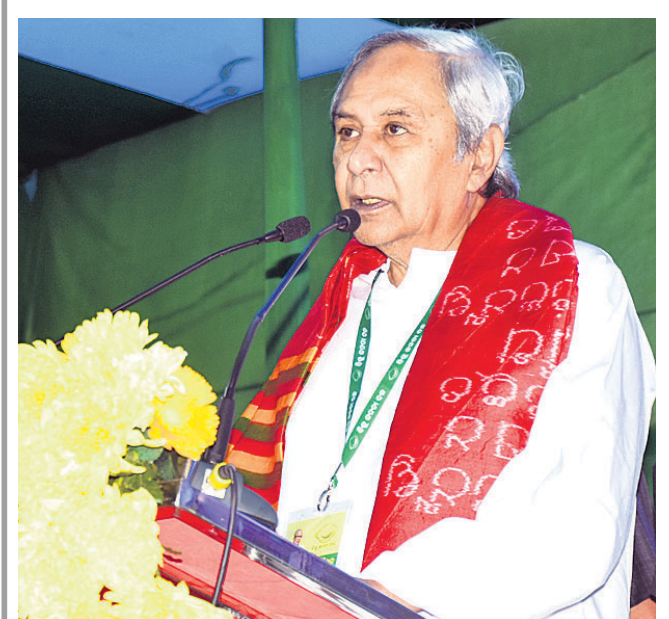
ଅଷ୍ଟମ ଥର ପାଇଁ ବିଜେଡି ସଭାପତି ଭାବେ ଦାୟିତ୍ୱ ନେବା ପରେ ଦଳୀୟ ରାଜ୍ୟ କାର୍ଯ୍ୟାଳୟରେ ଉଦ୍‌ବୋଧନ ଦେଉଛନ୍ତି ମୁଖ୍ୟମନ୍ତ୍ରୀ ନବୀନ ପଟ୍ଟନାୟକ।