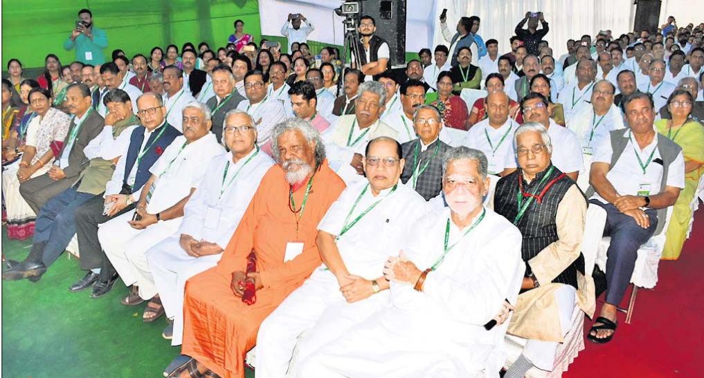
ବିଜେଡି ରାଜ୍ୟ ପରିଷଦ ବୈଠକରେ ଉପସ୍ଥିତ ବରିଷ୍ଠ ନେତୃମଣ୍ଡଳ।

ମୁଖ୍ୟମନ୍ତ୍ରୀ ନବୀନ ପଟ୍ଟନାୟକ ଲଗାତର ୮ମ ଥର ପାଇଁ ବିଜେଡି ସଭାପତି ଦାୟିତ୍ୱ ନେଇଛନ୍ତି। ଦଳର ମୁଖ୍ୟ ଭାବେ ରୁଧିରାଠାକୁ ତାଙ୍କୁ ଅଧିକାର ଦେଇ ଦଳ ଆରମ୍ଭ ହୋଇଛି। ସଭାପତିଭାବେ ତାଙ୍କ ନାମ ଆନୁଷ୍ଠାନିକ ଘୋଷଣା ହେବା ସହ ୮୦ ଜଣିଆ କାର୍ଯ୍ୟକାରୀ ତାଲିକା ମଧ୍ୟ ଘୋଷଣା କରାଯାଇଛି।