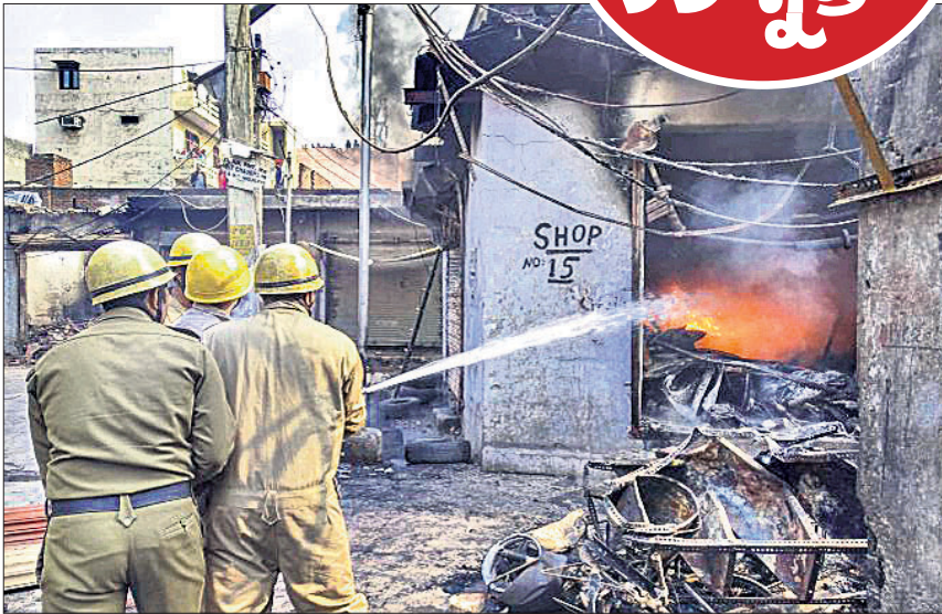
ଦଙ୍ଗା ପ୍ରଭାବିତ ଗୋକୁଳପୁରୀ ଅଞ୍ଚଳରେ ଏକ ଜଳୁଥିବା ଦୋକାନର ନିଆଁକୁ ଲିଭାଇଛନ୍ତି ଦିଲ୍ଲୀ ପୋଲିସର କର୍ମଚାରୀ।