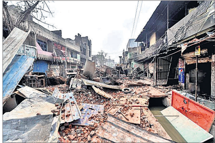
ଭଉର-ପୂର୍ବ ଦିଲ୍ଲୀର ଭାଗରାଥି ବିହାର ଅଞ୍ଚଳରେ ଲୋକଙ୍କ ଘରଦ୍ୱାର ଭାଙ୍ଗିଦେଇଛନ୍ତି ଦଙ୍ଗାକାରୀ।