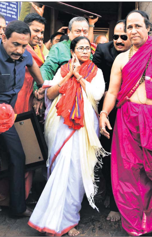
ମହାପ୍ରଭୁଙ୍କୁ ଦର୍ଶନ କରି ଫେରିଛନ୍ତି ପଶ୍ଚିମବଙ୍ଗ ମୁଖ୍ୟମନ୍ତ୍ରୀ ମମତା ବାନାର୍ଜୀ।

ସଂଶୋଧିତ ନାଗରିକଙ୍କୁ ଆଇନ (ସିଏଏ)କୁ ନେଇ ଦିଲ୍ଲୀ ବର୍ତ୍ତମାନ ଅଶାନ୍ତ ହୋଇପଡ଼ିଛି। ବିରୋଧୀ ଏବଂ ସମର୍ଥକଙ୍କ ମଧ୍ୟରେ ସଂଘର୍ଷ ଯୋଗୁ ଅନେକଙ୍କ ଜୀବନ ଯାଇଛି।