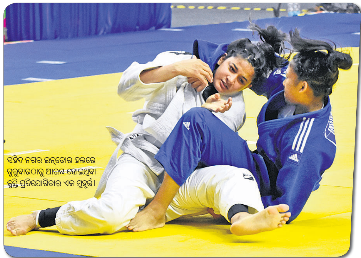
ସହିଦ ନଗର ଇନ୍‌ଡୋର ହାଲରେ ଗୁରୁବାରଠାରୁ ଆରମ୍ଭ ହୋଇଥିବା କୁସ୍ତି ପ୍ରତିଯୋଗିତାର ଏକ ମୁହୂର୍ତ୍ତ।