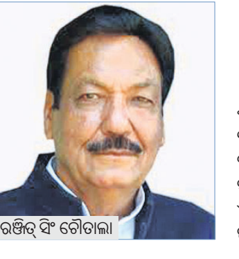
ରଞ୍ଜିତ୍ ସିଂ ଚୌତାଲା

ଦିଲ୍ଲୀରେ ସିଏସ ବିରୋଧୀ ହିଂସାରେ ୩୭ ଜଣ ପ୍ରାଣ ହରାଇଲେଣି। ଏହାକୁ ନେଇ ସାରା ଦେଶରେ ଆଲୋଚନା ସୃଷ୍ଟି ହୋଇଥିବାବେଳେ ହରିୟାଣାର ଜଣେ ମନ୍ତ୍ରୀ ଦଳୀକୁ ଜୀବନର ଏକ ଅଂଶ ବୋଲି କହି ବିବାଦ ଘେରକୁ ଆସିଛନ୍ତି। ଏହା ପ୍ରଥମ ଦଳୀ ରୁହେଁ। ଏଭଳି ଦଳୀ ପୂର୍ବରୁ ଅନେକ ଥର ଘଟିଛି ବୋଲି ହରିୟାଣା