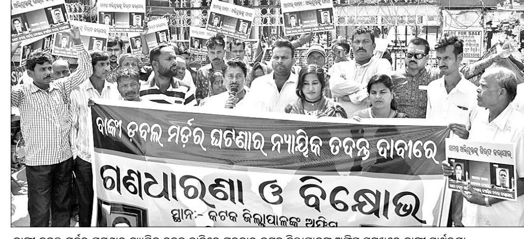
ବାଙ୍କୀ ଚକ୍ର ମର୍ଡର ଘଟଣାର ନ୍ୟାୟିକ ଚରଣ ଦାବିରେ ଗୁରୁବାର କଟକ ଜିଲାପାଳଙ୍କ ଅଫିସ ସମ୍ମୁଖରେ ବାଙ୍କୀ ସାଥରଣ ସମିତି ପକ୍ଷରୁ ବିକ୍ଷୋଭ ପ୍ରଦର୍ଶନ ।

ଚୌଦ୍ୱାର ପୌରପାଳିକା ଅଧୀନ କପାଳେଶ୍ୱର ଅଞ୍ଚଳରେ ଥିବା ଆଇଆଇଆଇଏଆଇ ବ୍ୟାଙ୍କ ପରିସରରେ ଗୁରୁବାର ବରିଷ୍ଠ ନାଗରିକଙ୍କ ଏକ ବୈଠକ ଅନୁଷ୍ଠିତ ହୋଇଯାଇଛି ।