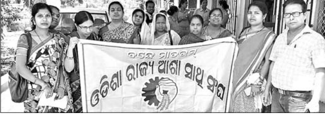
ସିଡିଏମ୍‌ଓଙ୍କୁ ଦାବିପତ୍ର ଦେବା ପାଇଁ ଆସିଥିବା ଆଶା ସାଥୀମାନେ ।