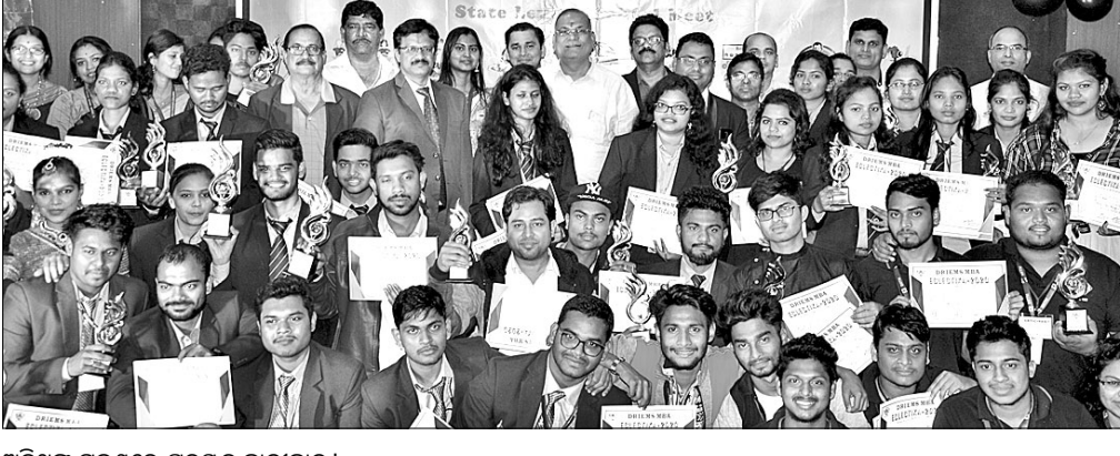
ଅତିଥିଙ୍କ ଗହଣରେ ପୁରୁଷ ଛାତ୍ରାଛାତ୍ରୀ ।

କଟକ ଅଫିସ, ୨୭/୧: ଇମର୍ଜେନ୍ସି ଦେବା ମହିଳା କଲେଜରେ ତ୍ରିମ୍ବସ ବିଭାଗ ପକ୍ଷରୁ ବାର୍ଷିକ ପାଠ୍ୟପୁସ୍ତକ ଆଲୋଚନା ଅନୁଷ୍ଠିତ ହୋଇଯାଇଛି ।