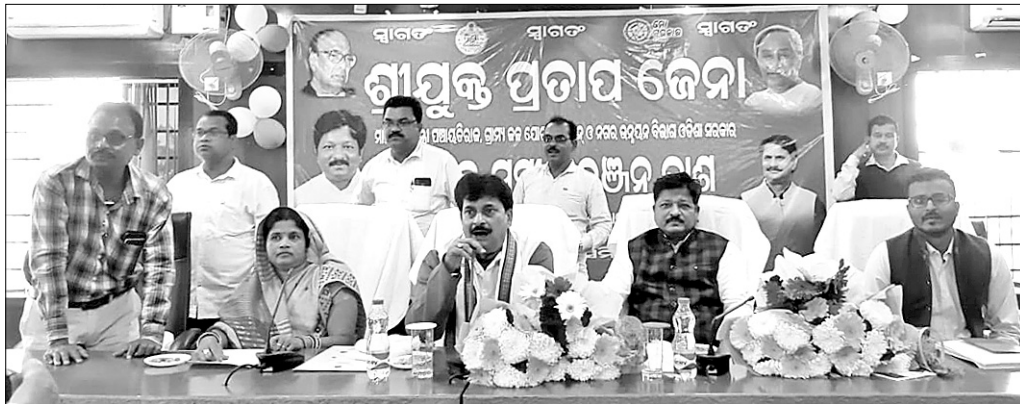
ସମାକ୍ଷା ବୈଠକରେ ମନ୍ତ୍ରୀ ପ୍ରତାପ ଜେନା ଏବଂ ସମୀର ରଞ୍ଜନ ଦାଶ ଏବଂ ଅନ୍ୟ ଅଧିକାରୀମାନେ ।

ଆସନ୍ତା ମାର୍ଚ୍ଚ ୩୧ ତାରିଖ ସୁଦ୍ଧା ସହରାଞ୍ଚଳର ପ୍ରତ୍ୟେକ ଘରକୁ ଟ୍ୟାପ୍ ଯୋଗେ ପାନୀୟକର ଯୋଗାଇ ଦିଆଯିବ ବୋଲି ଗୁରୁବାର ନଗର ଉନ୍ନୟନ ମନ୍ତ୍ରୀ ପ୍ରତାପ ଜେନା କହିଛନ୍ତି।