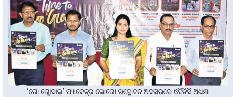
'ଗୋ ଗ୍ଲୋବାଲ' ପ୍ୟାକେଜର ଲୋଗୋ ଉଦ୍ଘାଟନ ଅବସରରେ ଓଡିଶା ଆରମ୍ଭ କଲା 'ଗୋ ଗ୍ଲୋବାଲ' ।

ରାଜ୍ୟ ପର୍ଯ୍ୟଟନକୁ ଆଗ୍ରା ଦେଇ ଆଗକୁ ନେବା ପଦକ୍ଷେପ ନେଇ ଓଡ଼ିଶା ପର୍ଯ୍ୟଟନ ଉନ୍ନୟନ ନିଗମ(ଓଡିଟିସି) । ଓଡ଼ିଶାରେ ପର୍ଯ୍ୟଟନ ଉନ୍ନୟନ ନିଗମ(ଓଡିଟିସି) । ଓଡ଼ିଶାରେ ପର୍ଯ୍ୟଟନ ଉନ୍ନୟନ ନିଗମ(ଓଡିଟିସି) ।