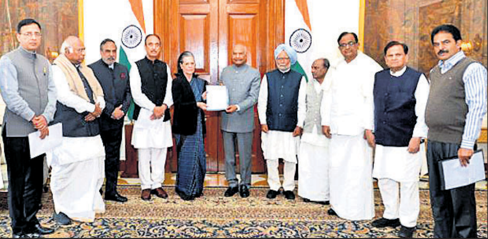
ରାଷ୍ଟ୍ରପତି ଭବନରେ ରାଷ୍ଟ୍ରପତି ରାମନାଥ କୋବିନ୍ଦଙ୍କୁ ଭେଟି ସ୍ମାରକପତ୍ର ଦେଉଛନ୍ତି କର୍ମଚାରୀ ସୋନିଆ ଗାନ୍ଧୀ। ନିକଟରେ ଅଛନ୍ତି ପୂର୍ବତନ ପ୍ରଧାନମନ୍ତ୍ରୀ ମନମୋହନ ସିଂ, ରାଜ୍ୟ ସଭାରେ ବିରୋଧୀ ଦଳ ନେତା ସୁଲୀମାନବା ଆଜାଡ଼, ପୂର୍ବତନ କେନ୍ଦ୍ରମନ୍ତ୍ରୀ ପି. ଚିତାଭରଣ, ବିଶିଷ୍ଟ କର୍ମଚାରୀ ଆନନ୍ଦ ଶର୍ମା, ମହିଳାଙ୍କୁ ଖାର୍ଚ୍ଚ, ଏ.କେ. ଆକ୍ଷୟ ଏବଂ ଦଳର ନେତୃତ୍ୱ।