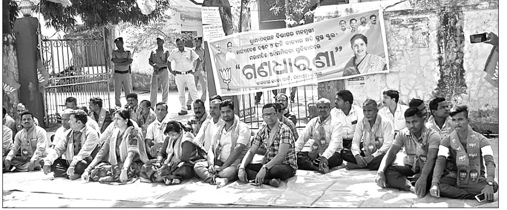
ନିମାପଡ଼ା ଗ୍ରାମ୍ୟ ଉନ୍ନୟନ ଡିଭିଜନ ଅଫିସ ଆଗରେ ଭାଜପା କର୍ମୀମାନେ ଗଣଧାରଣା ଦେଇଛନ୍ତି ।

ଗଲେ ଭାଜପା ଅପାଳତର ସ୍ୱାରସ୍ଥ ହେବ ବୋଲି ପରିତା କହିଛନ୍ତି। ଫର୍ମା ବାଟ୍ୟାରେ କ୍ଷତିଗ୍ରସ୍ତ ସ୍କୁଲ ମରାମତିରେ ବ୍ୟାପକ ଅନିୟମିତତା ପ୍ରତିବାଦରେ ଏହି ଗଣଧାରଣା ଦିଆଯାଇଥିଲା।