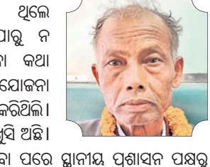
ଶ୍ରୀମତୀ ବାଗ, ନବରଙ୍ଗପୁର

କି ଅର୍ଥ ଅଭାବରୁ ଯାଇ ପାରୁ ନ ଥିଲା। ଚଳିତଥର ଲକ୍ଷ୍ମୀ ଯିବା କଥା କେବେ ଭାବି ନ ଥିଲା। ଗାଁରେ ଏହି ଯୋଜନା ବିଷୟରେ ଶୁଣି ବହୁତ ଆବେଦନ କରିଥିଲା।