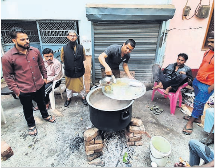
ମୁସାଫା ଅଞ୍ଚଳରେ ଦଙ୍ଗା ପ୍ରଭାବିତଙ୍କ ପାଇଁ ଚା' ଚିଆରି କରୁଛନ୍ତି ସେଲ୍ଲାସେବା।