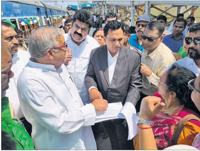
ଏମପି, ବିଧାୟକ ଚାଲିକା ଯାତ୍ରା କରୁଛନ୍ତି।

ପୂର୍ବତନ କର୍ଯ୍ୟାଳୟରେ ଓ ଜନପ୍ରତିନିଧି ଏମପି ଓ ଲିମ୍ପାପାଳଙ୍କୁ ଜଣାଇଥିଲେ। ପୁଣି ଯାତ୍ରା ହେବାକୁ ପର୍ଯ୍ୟଟନ ବିଭାଗ ଓ ବିଏମପି କର୍ଯ୍ୟାଳୟର ସମନ୍ୱୟ ଅଭାବକୁ କିଛି ଯାତ୍ରୀଙ୍କ ନାମ ଚାଲିକାରେ ନ ଥିବା ଜଣାପଡିଥିଲା।