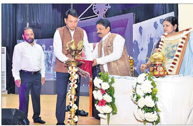
କାର୍ଯ୍ୟକ୍ରମକୁ ଶକ୍ତି ଓ ଏମ୍ପ୍ୱାଆଇ ମନ୍ତ୍ରୀ କ୍ୟାପଟେନ୍ ଦିବ୍ୟଶଙ୍କର ମିଶ୍ର ଉଦଘାଟନ କରୁଛନ୍ତି।

ଭୁବନେଶ୍ୱରରେ ଖବି ପ୍ରତି ଆକର୍ଷିତ କରିବାକୁ ଏକ ଅଭିନବ ପଦକ୍ଷେପ ଗ୍ରହଣ କରିଛନ୍ତି ଓଡ଼ିଶା ଖବି ଓ ଗ୍ରାମୋଦ୍ୟୋଗ ବୋର୍ଡ଼। ସପ୍ତାହରେ ଅନ୍ତତଃ ଗୋଟିଏ ଦିନ ଖବି ପରିଧାନ କରିବା ପାଇଁ ବୋର୍ଡ଼ ପକ୍ଷରୁ ମୁଦବର୍ତ୍ତକ ନିବେଦନ କରାଯାଇଛି। ଏନେଇ 'ସପ୍ତାହରେ ଦିନଟିଏ ଖବି' ଖାର୍ଯ୍ୟକ୍ରମ ରାଜ୍ୟସ୍ତରୀୟ ଖବି ଓ ଗ୍ରାମୋଦ୍ୟୋଗ ବୋର୍ଡ଼ର ଅଭିନବ ପ୍ରୟାସ