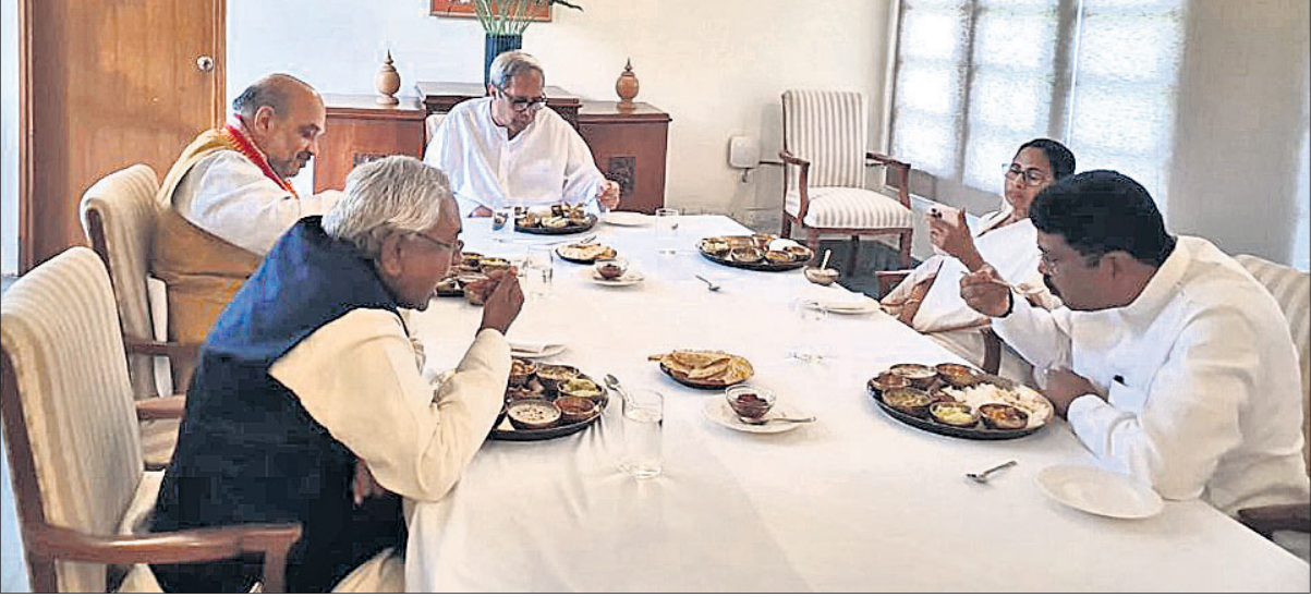
ଭବ୍ୟ ଲୋକନ: ନବୀନ ନିବାସରେ ଶୁକ୍ରବାର ସ୍ୱାସ୍ଥ୍ୟ ମନ୍ତ୍ରୀ ଅମିତ ଶାହା, ବିହାର ମୁଖ୍ୟମନ୍ତ୍ରୀ ନୀତୀଶ କୁମାର, ପଶ୍ଚିମବଙ୍ଗ ମୁଖ୍ୟମନ୍ତ୍ରୀ ମମତା ବାନାର୍ଜୀ ଓ କେନ୍ଦ୍ରମନ୍ତ୍ରୀ ଧର୍ମେନ୍ଦ୍ର ପ୍ରଧାନଙ୍କୁ ଓଡ଼ିଆ ସୁସ୍ୱାଦୁ ଖାଦ୍ୟ ଦେଇ ଆପ୍ୟାୟିତ କରୁଛନ୍ତି ମୁଖ୍ୟମନ୍ତ୍ରୀ ନବୀନ ପଟ୍ଟନାୟକ ।