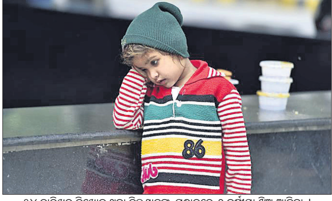
୨୪ ତାରିଖରୁ ନିଖୋଜ ଥିବା ଦିଲ୍ଲୀବାସୀଙ୍କ ସମାଜରେ ଏ ବର୍ଷାୟା ତିଆରି ଅଧିକ।

ପାଞ୍ଚଦିନ ପରେ ଦିଲ୍ଲୀବାସୀଙ୍କୁ ମିଳିଛି ସାମାନ୍ୟ ଆଶ୍ୱସ୍ତି। ସାମ୍ପ୍ରଦାୟିକ ଦଙ୍ଗାରେ ୪୩ ଜଣଙ୍କ ଜୀବନ ଚାଲିଯିବା ଉଦ୍ଧାର କେତେକ ଅଞ୍ଚଳରେ ଧୀରେ ଧୀରେ ଶାନ୍ତି ଫେରୁଥିବା ପରିଲକ୍ଷିତ ହୋଇଛି। ସମୟ ଗଢ଼ିତାଲିବା ସହ ଗ୍ରାକ୍ସୁ ଫେରୁଛି ଜାତୀୟ ରାଜଧାନୀ। ଲୋକେ ନିଜ ନିଜ କର୍ମସୈନ୍ଦ୍ରକୁ ବାହାରିବା ପାଇଁ ପ୍ରସ୍ତୁତ ହେଉଥିବାବେଳେ ଗ୍ରାସ୍ଥାୟୀରେ ଦେଖିବାକୁ ମିଳୁଛି ଧ୍ୱଂସର ବିଶାଳତା। ଦଙ୍ଗାକାରୀମାନେ କେଉଁଠି ଘର, ସ୍କୁଲ ଓ ଯାନବାହାନ ଆଦି ଫୋଡ଼ି ଦେଇଥିବାବେଳେ ଆଉ କେଉଁଠି ସ୍ଥାନରେ ଦଙ୍ଗାରେ ବ୍ୟବହାର ପାଇଁ ରଖାଯାଇଥିବା ଟେକାପଥର, ପେଟ୍ରୋଲ ବୋମା ଓ ଅନ୍ୟ ମାରଣାସ୍ତ୍ର ଦେଖିବାକୁ ମିଳିଛି। ସିଏଚିଡି ଓ ଟ୍ରୋପି କ୍ୟାମ୍ପେରାକୁ ସଂଗୃହୀତ ଦୁଷ୍ଟଙ୍କର ପୁଟେକକୁ ଛାନଭିନ କରାଯାଉଛି। ଦଙ୍ଗା ପ୍ରତିରୋଧରେ କାମି କାମି ନିଜ ନିଜ ଦୁଷ୍ଟଙ୍କର କାହାଣୀ ବଖାଣୁଥିବାବେଳେ ବିଗତ ୬୦ ଘଣ୍ଟା ମଧ୍ୟରେ କେଉଁଠି ବି ହିଂସା ଘଟି ନ ଥିବା ଦାବି କରିଛନ୍ତି ଦିଲ୍ଲୀ ପୋଲିସ୍। ବର୍ତ୍ତମାନ ଦିଲ୍ଲୀକୁ ପୂର୍ବ ଭଳି ଶାନ୍ତ କରିବା ଓ ଦଙ୍ଗା ପ୍ରଭାବିତ ଲୋକଙ୍କ ପୁନର୍ବାସ ଓ ଅଭିଧାନ ପୋଲିସ୍ ପ୍ରଶାସନ ପାଇଁ ପାଲଟିଛି ସବୁଠୁ ବଡ଼ ଚ୍ୟାଲେଞ୍ଜ।