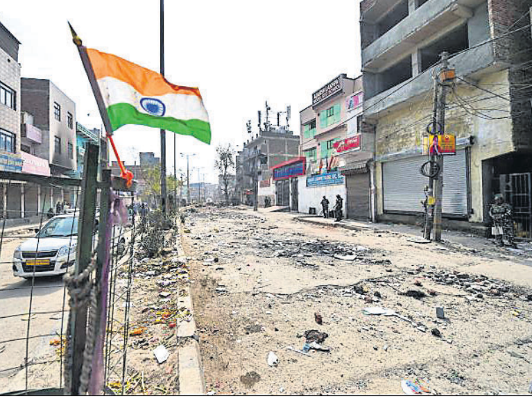
ଏକ ମାର୍କେଟ ଏରିଆ କନକ୍ସନ୍ସ ହୋଇଯାଇଥିବାବେଳେ ସେଠାରେ ଜାତୀୟ ପତାକା ଉଡୁଛି।