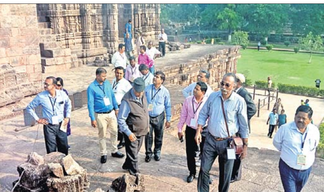
ମନ୍ଦିର ବୁଲି ଘୁଟି ଅନୁଧ୍ୟାନ କରୁଛନ୍ତି ବରିଷ୍ଠ ଅଧିକାରୀ ଓ ବିଶେଷଜ୍ଞମାନେ।