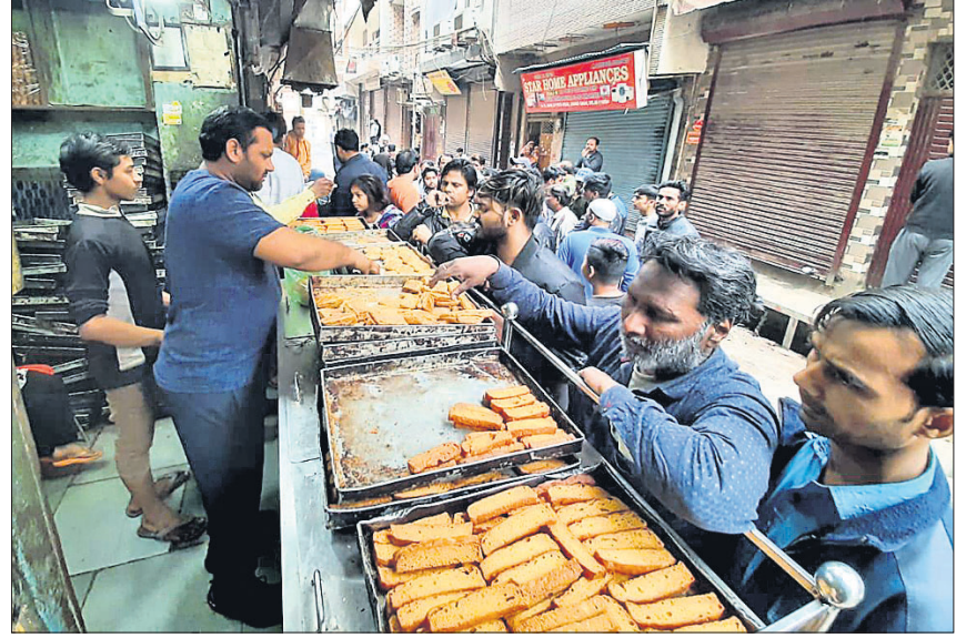
ଦିଲ୍ଲୀର ଚାନ୍ଦବାଗରେ ସ୍ୱାଭାବିକ ହେଉଛି ଜୀବନଯାତ୍ରା।

ବାଇନ ପରେ ଭରାଣ କରୋଗୀ ଭୃତ୍ୟାଣୁ ଦ୍ୱାରା ସର୍ବାଧିକ ସଂକ୍ରମିତ ହୋଇଛି। ଗୁରୁତାର ସେଠାରେ ୧୦୭ ଜଣା ରୋଗୀ ଚିକିତ୍ସିତ ହେବା ଯୋଗୁଁ ମୋଟ ସଂକ୍ରମଣଙ୍କ ସଂଖ୍ୟା ୨୪୪ରେ ପହଞ୍ଚିଛି। ଭରାଣ ଉପରାସ୍ତ୍ରପତି ମାସୁମେ ଏବେକାର ମଧ୍ୟ କରୋଗୀରେ ସଂକ୍ରମିତ ହୋଇଥିବା ଜଣାପଡ଼ିଛି। ଭଦ୍ରପଥରେ ସେଠାରେ କରୋଗୀ ସଂକ୍ରମଣକଳିତ ମୃତ୍ୟୁସଂଖ୍ୟା ୨୬ରେ ପହଞ୍ଚିଛି।