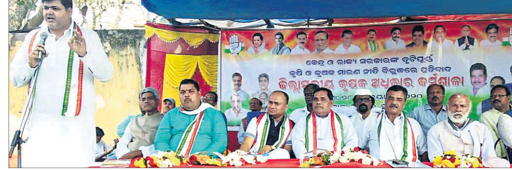
କର୍ମଶାଳାରେ ମହାସଭା ନେତାମାନେ।

ଗଣାମ କିଷାନ କଂଗ୍ରେସର ଜିଲ୍ଲାସ୍ତରୀୟ କୃଷକ ଅଧିକାର କର୍ମଶାଳା ବ୍ରହ୍ମପୁରସ୍ଥିତ ଦଳାୟ କାର୍ଯ୍ୟାଳୟ ବାବୁଲୀ ଆଶ୍ରମରେ ଶୁକ୍ରବାର ଆରମ୍ଭ ହୋଇଯାଇଛି।