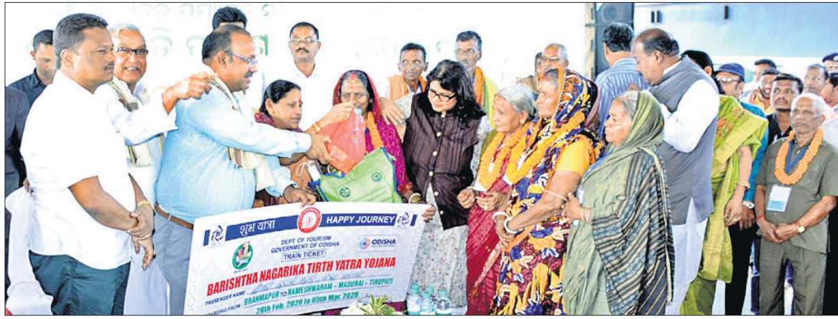
ପର୍ଯ୍ୟଟନ ମନ୍ତ୍ରୀ ଜ୍ୟୋତିପ୍ରକାଶ ପାଣିଗ୍ରାହୀ ତୀର୍ଥଯାତ୍ରାକୁ ଚିକେଟ ଓ କିଟ୍ ପ୍ରଦାନ କରୁଛନ୍ତି ।

କୃଷ୍ଣପୁରରୁ ଯାତ୍ରା ଆରମ୍ଭ କଲେ ସ୍ୱତନ୍ତ୍ର ଟ୍ରେନ ଆଧ୍ୟାତ୍ମିକ ଚେତନା ସୃଷ୍ଟି କରିଛି ଯୋଜନା: ପର୍ଯ୍ୟଟନ ମନ୍ତ୍ରୀ