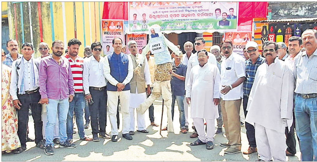
କଂଗ୍ରେସ ପକ୍ଷରୁ କୁଶପୁରୁଷିକା ପୋଡ଼ିଯାଇଛି।