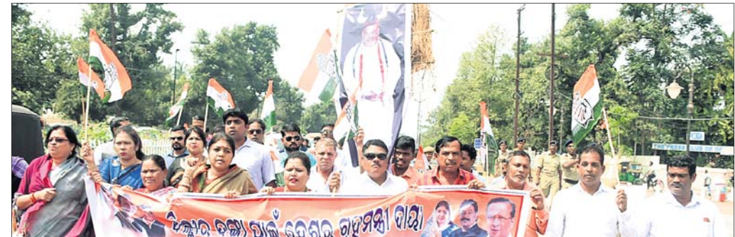
ଭୁବନେଶ୍ୱର ଜିଲା କଂଗ୍ରେସ କମିଟି ପକ୍ଷରୁ ମାଷ୍ଟରକ୍ୟାଣ୍ଟିନ୍ ଛକରେ ବିକ୍ଷୋଭ ପ୍ରଦର୍ଶନ କରାଯାଇଛି।