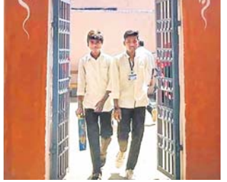
କ୍ୟାଣ୍ଟିନ ନେଇ ଉଚ୍ଚ ସମ୍ବନ୍ଧରେ ଚେଷ୍ଟା ପ୍ରକ୍ରିୟା କରାଯାଇଥିଲା । କିନ୍ତୁ ଦୀର୍ଘ ୨ ମାସ ପରେ କ୍ୟାଣ୍ଟିନ ଉଦ୍ଘାଟିତ ହୋଇପାରିଛି । ବିଦ୍ୟାଳୟର ଅଧ୍ୟକ୍ଷ, ଅଧ୍ୟାପିକା ଓ ଅଧ୍ୟାପକ ଦ୍ୱାରା ଉଦ୍ଘାଟନା କରାଯାଇଥିଲା । ଏବଂ ଛାତ୍ରାଛାତ୍ରୀଙ୍କ ଉପସ୍ଥିତିରେ ଦାବି ନେଇ ଧାରଣା ଦେଇଥିଲେ ।

କୋରାପୁଟ ଜିଲ୍ଲା ଜୟପୁର ବିକ୍ରମଦେବ ସ୍ୱୟଂଶାସିତ ମହାବିଦ୍ୟାଳୟ ପରିସରରେ କ୍ୟାଣ୍ଟିନ ଉଦ୍ଘାଟିତ ହୋଇଛି । ଦୀର୍ଘ ବର୍ଷ ଧରି ଛାତ୍ରାଛାତ୍ରୀମାନେ ଦାବି କରୁଥିଲେ ସ୍ୱାସ୍ଥ୍ୟ ମହାବିଦ୍ୟାଳୟ କର୍ତ୍ତୃପକ୍ଷ ଏଥିପ୍ରତି ଆଶାଦେଖା କରୁଥିଲେ । ଏହିପରି ଗତ ଡିସେମ୍ବର ୧୭ରେ ଜିଲ୍ଲା ସ୍ୱଚ୍ଛତା ସଂଗଠନ ପକ୍ଷରୁ ଉପଜିଲ୍ଲାପାଳଙ୍କ କାର୍ଯ୍ୟାଳୟ ସମ୍ମୁଖରେ କ୍ୟାଣ୍ଟିନ ପୁରାତନ ଏବଂ ନୂତନ ଭବନକୁ ସଂଯୋଗ ନିମନ୍ତେ ଜାତୀୟ ରାଜପଥ ଉପରେ ଏକ ଦୁଇଓଭର ବ୍ରିଜ୍ ତିଆରି ନିମନ୍ତେ ଦାବି ନେଇ ଧାରଣା ଦେଇଥିଲେ ।