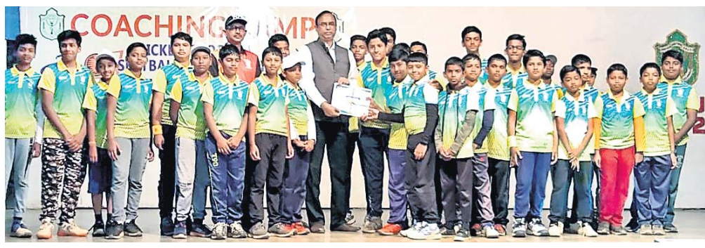
ଦାମନଯୋଡ଼ିର ଡିପିଏସ୍ରେ ପ୍ରଶିକ୍ଷଣ ଶିବିରରେ ଭାଗନେଇଥିବା ଛାତ୍ରମାନେ ।