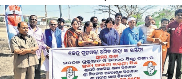
କଂଗ୍ରେସ କର୍ମୀମାନେ ବିକ୍ଷୋଭ ପ୍ରଦର୍ଶନ କରୁଛନ୍ତି।