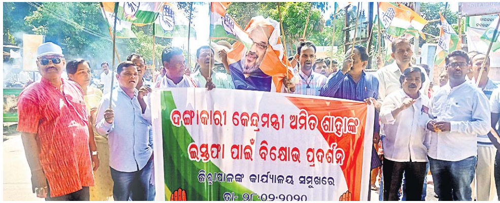
କଂଗ୍ରେସ କର୍ମୀମାନେ ବିକ୍ଷୋଭ ପ୍ରଦର୍ଶନ କରୁଛନ୍ତି ।

କରାଯିବ। ସହ ଅଧିକ ଶାହାକ କୁଣ୍ଡପୁରକିକା ଦାହ କରାଯାଇଥିଲା । ବିକ୍ଷୋଭ ପ୍ରଦର୍ଶନ ବେଳେ ପିସିସି