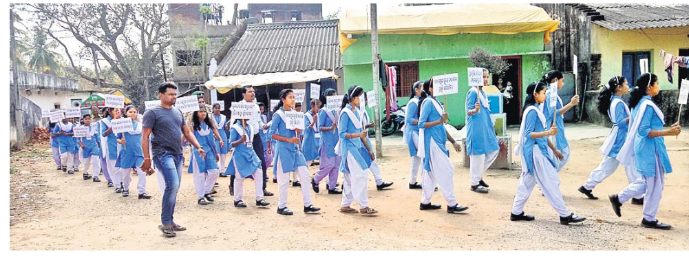
ଜଙ୍ଗଲ ସୁରକ୍ଷା ନେଇ ଛାତ୍ରୀଛାତ୍ର ଗାଁ ପରିକ୍ରମା କରୁଛନ୍ତି ।