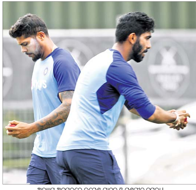
ଅଭ୍ୟାସ ଅବସରରେ ଉତ୍ତମ ଯାଦବ ଓ ଯଶପ୍ରୀତ କୁମାର।

ପ୍ରଥମ ମ୍ୟାଚରେ ଭାରତ ମାତ୍ର ୩ ଦିନ ମଧ୍ୟରେ ପରାସ୍ତ ହୋଇଥିଲା। ଭାରତୀୟ ବ୍ୟାଟ୍ସମ୍ୟାନ କୋର୍ଟ ରବି ଶାସ୍ତ୍ରୀ ସ୍ୱାକ୍ଷର କରିଥିଲେ। ଏହା ଅବଶ୍ୟକ ଭଳି କଥା। ଖ୍ରୀଷ୍ଟଚର୍ଚ୍ଚର ପୂର୍ବରୁ ଇଣ୍ଡିଆନ୍ ବୋଲର ଶନିବାର ଅଧିନାୟକ ବିରାଟ କୋହଲି, ଚେତେଶ୍ୱର ପୂଜାରା ଓ ଅଜିତ୍ ରାହାନା ପରାସ୍ତର ସମ୍ପୂର୍ଣ୍ଣ ହେବେ। ଏହି ଗ୍ରାଉଣ୍ଡରେ ଟ୍ୟୁନିଂ ଟ୍ରୁଟିରେ ବେଶ୍ ଉଚ୍ଚକୋଟୀର ରହିଛି। ତ୍ରୁଟି ବୋଲର ଟିମ୍ ସୌଦି, ଟ୍ରେଣ୍ଡ ବୋଲର ଓ କାମଲ କେନିଂଗ୍ ସହ ବୋଲିଂ ବିଭାଗରେ ଏବେ ନିଜ ଖ୍ୟାତିର ଯୋଗଦେବେ। ଫଳରେ