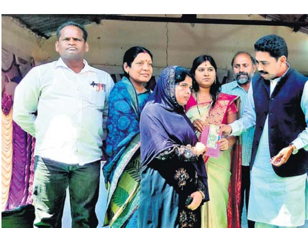
କୋରାପୁଟ ବିଧାୟକ ଜଣେ ହିତାଧିକାରୀଙ୍କୁ ଭଜା ପ୍ରଦାନ କରୁଛନ୍ତି ।