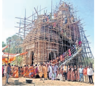
ତାକୁରୀ, ୨୮୧ (ଡି.ଏନ୍.ଏ.)

ମା' ଦତ୍ତେଶ୍ୱରୀ ଭୈରବ ମନ୍ଦିରର ରତ୍ନମୁଦ ସ୍ଥାପନ