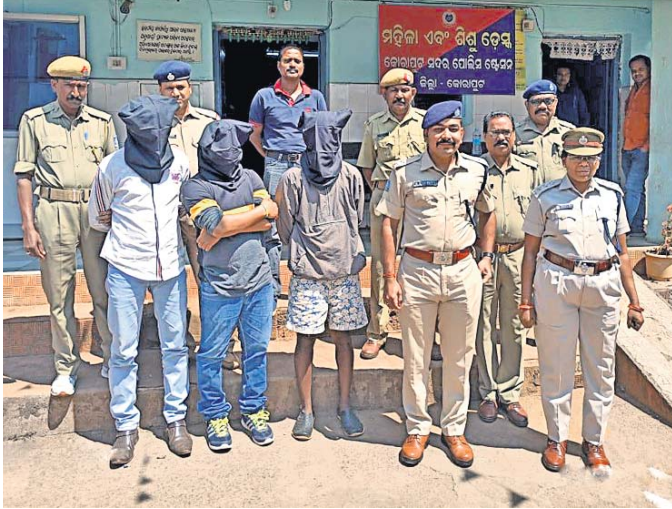
ଗିରଫ ହୋଇଥିବା କୁଆଡ଼ିମାନେ ।

କୋରାପୁଟ ସଦରଥାନା ପକ୍ଷରୁ ଶୁକ୍ରବାର ପୂର୍ବାହ୍ନରେ ଏକ କୁଆ ଆଞ୍ଚା ଉପରେ ଚଢ଼ାଉ କରାଯାଇ ୩ ଜଣ କୁଆଡ଼ିକୁ ଗିରଫ କରାଯାଇଛି । ଚଳା, କାର ଓ ୬ଟି ବାଉଁଶ କବଚ ହୋଇଥିଲା । ୫ରୁ ଅଧିକ କୁଆଡ଼ି ଘଟଣାସ୍ଥଳକୁ ଚମ୍ପଟ ୬ଟି ବାଉଁଶ କବଚ ହୋଇଛି । ପୁରୁଣା ଅନୁଯାୟୀ ସ୍ଥାନୀୟ ଖେତିରୁଟା ନିକଟସ୍ଥ ଏକ ଜଙ୍ଗଲରେ ଚାଲିଥିବା ଏହି କୁଆଆଞ୍ଚା ସମ୍ପର୍କରେ ଖବର ପାଇ ତାଳିମପ୍ରାସ୍ତ