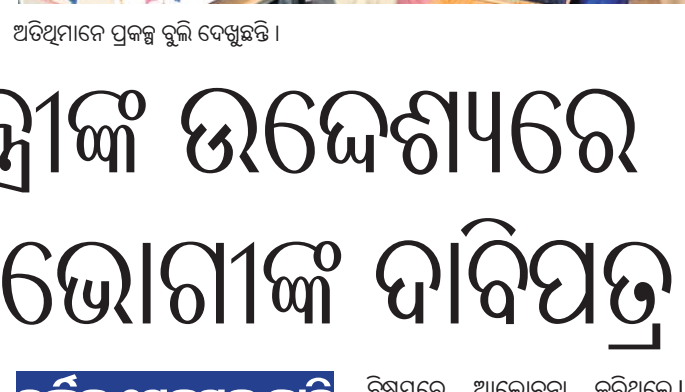
ଅତିଥିମାନେ ପ୍ରକଳ୍ପ ବୁଲି ଦେଖୁଛନ୍ତି ।

ପ୍ରଦର୍ଶନୀକୁ ଉଦ୍ଘାଟନ କରିଥିଲେ । ୧ ମରୁ ୮ ଶ୍ରେଣୀ ପର୍ଯ୍ୟନ୍ତ ମୋଟ ୨୧ ଜଣ ଅଂଶ ଗ୍ରହଣ କରିଥିଲେ । ଏଥିରେ ମୋଟ ୫୯ଟି ପ୍ରକଳ୍ପ ପ୍ରଦର୍ଶିତ ହୋଇଥିଲା ।