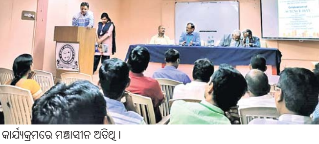
କାର୍ଯ୍ୟକ୍ରମରେ ମଞ୍ଚାସୀନ ଅତିଥି ।

ରୁଣପୁରର ବିଭିନ୍ନ ସ୍ଥାନରେ ଜାତୀୟ ବିଜ୍ଞାନ ଦିବସ ଶୁକ୍ରବାର ପାଳିତ ହୋଇଯାଇଛି । ଏହି ଅବସରରେ ବିଭିନ୍ନ କାର୍ଯ୍ୟକ୍ରମ ଅନୁଷ୍ଠିତ ହୋଇଥିଲା ।