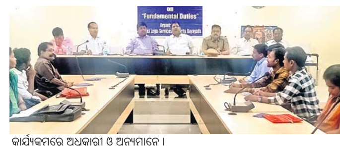
କାର୍ଯ୍ୟକ୍ରମରେ ଅଧିକାରୀ ଓ ଅନ୍ୟମାନେ ।