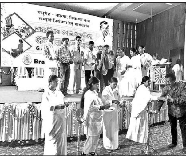
ବେଳପାହାଡ଼ ରତ୍ନପାପିତ ଆୟୋଜିତ କାର୍ଯ୍ୟକ୍ରମକୁ ଅଭିଭାବନା ଦାପ ପ୍ରକଳ୍ପ କରି ରତ୍ନପାପିତ କରୁଛନ୍ତି।