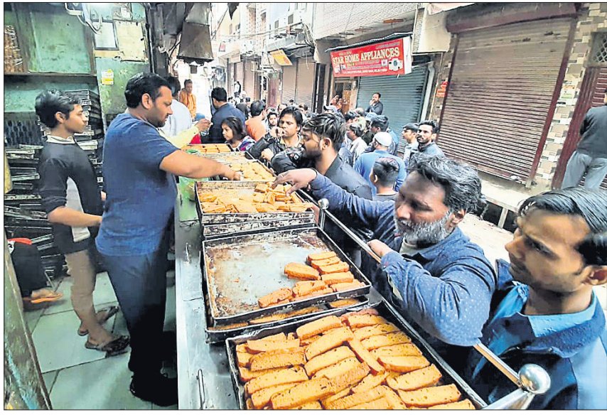
ଦିଲ୍ଲୀର ଚାନ୍ଦିନୀଗଡ଼ରେ ସାତାଦିକ ହେଉଛି ଜୀବନଯାତ୍ରା।

ଗାନ୍ଧୀ ପରେ ଭାରତ କରୋନା ଭୁତାଣୁ ଦ୍ୱାରା ସର୍ବମୁଖ୍ୟ ସଂକ୍ରମିତ ହୋଇଛି। ଗୁରୁବାର ସେଠାରେ ୧୦୬ ନୂଆ ରୋଗୀ ଚିହ୍ନଟ ହେବା ସହିତ ମୋଟ ସଂକ୍ରମଣଙ୍କ ସଂଖ୍ୟା ୨୪୫ରେ ପହଞ୍ଚିଛି। ଭାରତ ଉପରାଷ୍ଟ୍ରପତି ମାୟୁମେ ଏବେକାର ମଧ୍ୟ କରୋନାରେ ସଂକ୍ରମିତ ହୋଇଥିବା ଜଣାପଡିଛି। ଭିତ୍ତିମଧ୍ୟରେ ସେଠାରେ କରୋନା ସଂକ୍ରମଣକ୍ରମିତ ମୃତ୍ୟୁସଂଖ୍ୟା ୨୬ରେ ପହଞ୍ଚିଛି।