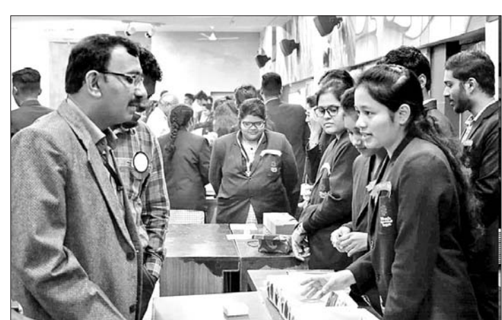
ଅତିଥିମାନେ ପ୍ରକଳ୍ପ ଗୁଡ଼ିକୁ ପରିଦର୍ଶନ କରୁଛନ୍ତି ।