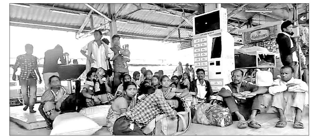
ଫେରିବା ବାଟରେ ନାଗପୁର ରେକର୍ଡ଼ଖଣ୍ଡରେ ଦାଦନ ଶ୍ରମିକ ।

ଡେଲେଜାଣା ରାଜ୍ୟ ପଞ୍ଜାବରୁ ଜିଲ୍ଲା ରାମଗିରି ଥାନା ଅନ୍ତର୍ଗତ ପାଣ୍ଡୁଲୀପାଲୀର ଦାଦନ ଶ୍ରମିକଙ୍କୁ ଯାଇ ସେଠାରେ ବନ୍ଧା ପଡ଼ିଥିବା ବରଗଡ଼ ଜିଲ୍ଲାର ଶ୍ରମିକମାନେ ଇଟାଭାଟି ମାଲିକଙ୍କ କବଳରୁ ମୁକ୍ତ ହେବା ପରେ ନିଜ ଘର ଅଭିମୁଖେ ବାହାରିଛନ୍ତି । ଖବର ଲେଖାହେବା ପୂର୍ବକା (ଭାଦ୍ର ୧୦)ରେ ସେମାନେ ରାୟପୁର ରେକର୍ଡ଼ଖଣ୍ଡରେ ପହଞ୍ଚି ସାରିଥିବା ଜଣାପଡ଼ିଛି । ସେଠାରୁ ଟ୍ରେନରେ ଖରିଦାଧି ଆସିବେ ଏବଂ ବସ୍ କିମ୍ପା ଅନ୍ୟ କୌଣସି ଯାତ୍ରାବାହୀ ଗାଡ଼ି ଯୋଗେ ସଡ଼କପଥରେ ଶ୍ରମିକମାନେ ଶନିବାର ନିଜ ଘରକୁ ପହଞ୍ଚିବେ ବୋଲି ସୂଚନା ମିଳିଛି । ତେବେ ନିଜ ପିଲାଛୁଆଙ୍କ ସମେତ ୩୩ଜଣ ଘରକୁ ଫେରୁଥିବାବେଳେ ଏବେ ମଧ୍ୟ ଅନ୍ୟ ୨୫ଜଣ ନୂଆପଡ଼ାର କଲକତ୍ତର ଏବଂ ପାଇକପାଳ ରୁକ୍ଷ ଝିଲ୍ଲିକା ପଞ୍ଚାୟତ ପଥରେ ଗ୍ରାମର