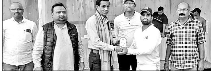
କୃତୀ ଖେଳାଳିଙ୍କୁ ପୁରସ୍କୃତ କରାଯାଇଛି।

ଝାରସୁଗୁଡ଼ା ସହର ବିଦ୍ୟୁତ୍ ପଡ଼ିଆରେ ଜିଲ୍ଲା ଆନ୍ତର୍ଜାତୀୟ ସିନିୟର କ୍ରିକେଟ୍ ଲିଗ୍ ପ୍ରତିଯୋଗିତାର ୬ଷ୍ଠ ମ୍ୟାଚ ଟାଇଗର କ୍ରିକେଟ୍ କ୍ଲବ୍ ଓ ଲୁକ୍ ଡାକ୍ତର କ୍ଲବ୍ ମଧ୍ୟରେ ଅନୁଷ୍ଠିତ ହୋଇଯାଇଛି। ଟାଇଗର କ୍ଲବ୍ ଜିତି ପ୍ରଥମେ ବ୍ୟାଟିଂ କରିଥିଲା। ଦଳ ୪୮.୨ ଓଭର ମଧ୍ୟରେ ୧୦ଟି ଉଇକେଟ ହରାଇ ୨୫୭ ରନ୍ କରିଥିଲା। ପ୍ରତିବନ୍ଧକରେ ଲୁକ୍ ଡାକ୍ତର ୧୦ ଉଇକେଟ ହରାଇ ୫୦ ଓଭରରେ ୨୫୪ ରନ୍ କରିବାକୁ ସମର୍ଥ ହୋଇ ଥିଲା। ପନ୍ଦର ଟାଇଗର କ୍ରିକେଟ୍ କ୍ଲବ୍ ୩ ରନ୍ରେ ବିଜୟୀ ହୋଇଥିଲା।