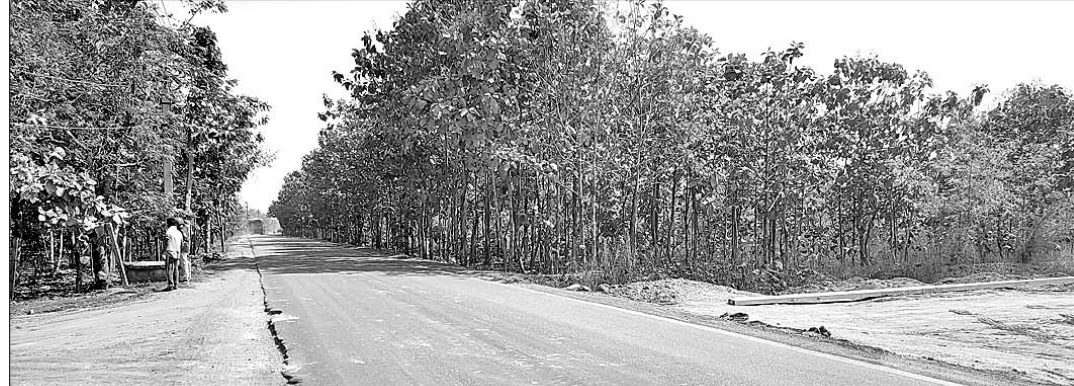
ନିର୍ମାଣାଧୀନ ରାସ୍ତା କଡରେ ଥିବା ଶାଗୁଆନ ଗଛ।

ବନାକରଣ ଅଧୀନ ବାଲିୟୁରା ଗ୍ରାମ୍ୟ ଜଙ୍ଗଲରେ ୧୨ ହକ୍ଟାର ୫୦୦ ଶାଗୁଆନ ଚାଟା ଲଗାଯାଇଥିଲା। ସେଦିନର ସେହି ଚାଟା ଆଜି ବଡ଼ ବଡ଼ ଗଛରେ ପରିଣତ ହୋଇଛି। ହେଲେ ଏହି ଗଛକୁ କାଟିବା ପରେ ବନାକରଣ କାର୍ଯ୍ୟ ପାଇଁ କିଛି ପୂର୍ଣ୍ଣ ବିଭାଗ କୋଟା କରିନାହିଁ।