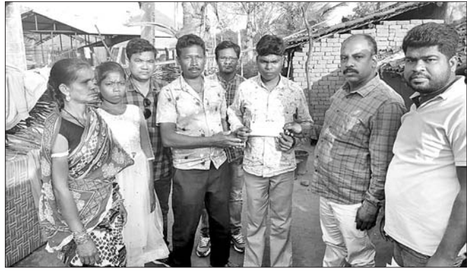
ବିଦ୍ୟୁତ୍ ଆଘାତରେ ମୃତ୍ୟୁ ଘଟିଥିବା ମହିଳାଙ୍କ ପରିବାରକୁ କ୍ଷତିପୂରଣ ଦିଆଯାଇଛି।