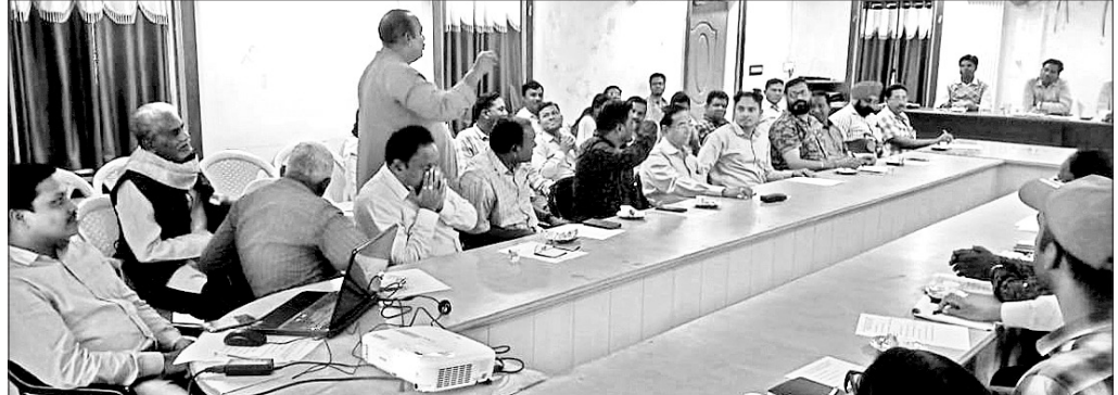
ବରଗଡ଼ ଜିଲ୍ଲା ଗ୍ରାମ୍ୟ ଉନ୍ନୟନ ସଂସ୍ଥା ସମ୍ମିଳନୀ କକ୍ଷରେ ଅନୁଷ୍ଠିତ ଜିଲ୍ଲା ସଡ଼କ ସୁରକ୍ଷା ବୈଠକରେ ଉପସ୍ଥିତ ବିଭିନ୍ନ ବିଭାଗର ଅଧିକାରୀ ।