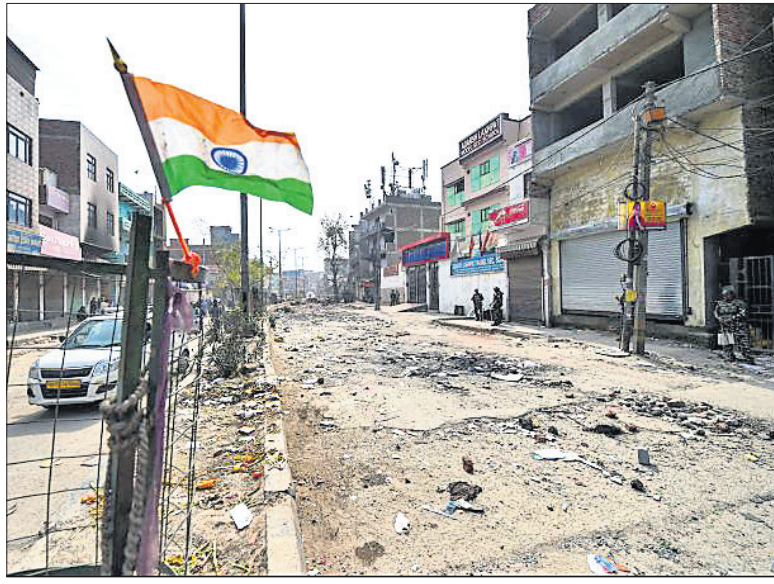
ଏକ ମାର୍କେଟ ଏରିଆ ଜନଶୂନ୍ୟ ହୋଇଯାଇଥିବାବେଳେ ସେଠାରେ ଜାତୀୟ ପତାକା ଉଡୁଛି।