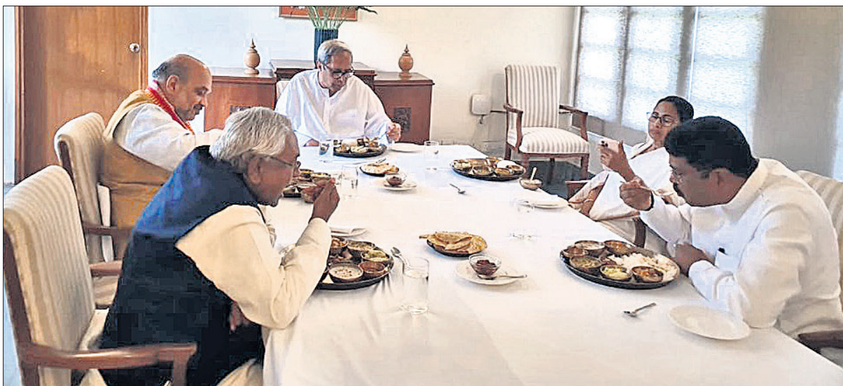
ଭବ୍ୟ ଭୋଜନ: ନବୀନ ନିବାସରେ ଶୁକ୍ରବାର ସରାସ୍ତ୍ର ମନ୍ତ୍ରୀ ଅମିତ୍ ଶାହା, ବିହାର ମୁଖ୍ୟମନ୍ତ୍ରୀ ନୀତୀଶ କୁମାର, ପଶ୍ଚିମବଙ୍ଗ ମୁଖ୍ୟମନ୍ତ୍ରୀ ମମତା ବାନାର୍ଜୀ ଓ କେନ୍ଦ୍ରମନ୍ତ୍ରୀ ଧର୍ମେନ୍ଦ୍ର ପ୍ରଧାନଙ୍କୁ ସୁସ୍ୱାଦୁ ଓଡ଼ିଆ ଖାଦ୍ୟ ବେଳ ଆପାୟିତ କରୁଛନ୍ତି ମୁଖ୍ୟମନ୍ତ୍ରୀ ନବୀନ ପଟ୍ଟନାୟକ। (ରିପୋର୍ଟ: ପୁଷ୍ପା-୫)