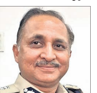
ନୂଆଦିଲ୍ଲୀ, ୨୮୨ (ପି.ଟି.)

ଦିଲ୍ଲୀ ପୋଲିସରେ ସ୍ୱତନ୍ତ୍ର ପୋଲିସ୍ କମିଶନର(ଆଇନ ଶୁଖିଳା) ଭାବେ ଗତ ସପ୍ତାହରେ ନିଯୁକ୍ତି ପାଇଥିବା