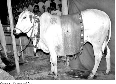
ନନ୍ଦୀ ଏବଂ ନନ୍ଦିନୀ (ପୁରୁଣି)।