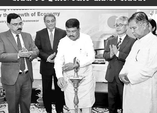
କଳୋଦ୍ଦିଷ୍ଟ ପ୍ରସ୍ତୁତ କରି ଏହି ଶିଳ୍ପକୁ ବଜାଜିବା ସେ ଆହ୍ୱାନ ଜଣାଇଛନ୍ତି ।

କେନ୍ଦ୍ର ସରକାର ମାଲତୀ ଆଣ୍ଡ ମିନେରାଲ ଡେଭଲପମେଣ୍ଟ ରେଗୁଲେଶନ ଆକ୍ଟ (ଏମ୍.ଏମ୍.ଡି.ଆର୍) ନିୟମରେ ପରିବର୍ତ୍ତନ କରିଥିବାରୁ ଓଡ଼ିଶା ବାର୍ଷିକ ପ୍ରାୟ ୨୦ ହଜାର କୋଟି ଟଙ୍କା ପାଇବ ବୋଲି କେନ୍ଦ୍ର ପେଟ୍ରୋଲିୟମ ମନ୍ତ୍ରୀ ଧର୍ମେନ୍ଦ୍ର ପ୍ରଧାନ ଶୁକ୍ରବାର ପୂର୍ତ୍ତା ଯୋଗଦେଇଛନ୍ତି । ଲକ୍ଷ୍ୟାତ ମନୁଷ୍ୟକର୍ମ ଏବଂ ଜାପାନ ଏମ୍.ଏମ୍.ଡି.ଆର୍ ପକ୍ଷରୁ ସ୍ଥାନୀୟ ଏକ ହୋଟେଲରେ ଆୟୋଜିତ ଏକ କର୍ମଶାଳାରେ ପ୍ରଧାନ କହିଛନ୍ତି ଯେ, ପୂର୍ବରୁ ଓଡ଼ିଶା କେବଳ ରଥାଲତି ଏବଂ ସେଲସ୍ ଟାଙ୍କି ଲାଭ କରୁଥିଲା । ନିୟମରେ ପରିବର୍ତ୍ତନ ହେବା ଯୋଗୁଁ ଏହା ଦ୍ୱାରା ରାଜ୍ୟ ଅଧିକ ପରିମାଣର ରାଜସ୍ୱ ଲାଭ କରିପାରିବ । ଦେଶର ୮୦% ଖଣି କେବଳ ପୂର୍ବାଞ୍ଚଳରେ ରହିଛି । ରାଜ୍ୟରେ ଲକ୍ଷ୍ୟାତ ଶିଳ୍ପ ବିକାଶ ଲାଗି ବିଭିନ୍ନ ବିଭାଗ ଚାକିରିରେ ରହିବେ ଦେବା ଲାଗି ପ୍ରଧାନ ରାଜ୍ୟ ସରକାରଙ୍କୁ ପରାମର୍ଶ ଦେଇଛନ୍ତି । ରାଜ୍ୟରେ ପ୍ରଚୁର ପରିମାଣର କୋଇଲା ରହିଥିବା ଯୋଗୁଁ ଲକ୍ଷ୍ୟାତ ଉତ୍ପାଦନ କ୍ଷେତ୍ରରେ ଏକ