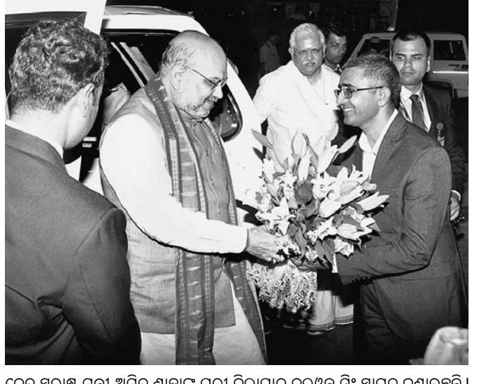
କେନ୍ଦ୍ର ସ୍ୱରାଷ୍ଟ୍ର ମନ୍ତ୍ରୀ ଅମିତ ଶାହାଙ୍କୁ ପୁରୀ ଜିଲାପାଳ ବଲ୍ଲଭ୍‌ବି ସିଂ ସ୍ୱାଗତ ଜଣାଉଛନ୍ତି।

ଗ୍ରାମମିତ ପୁରୁଣା ଜୋନରେ ଚାଲିଛି ଉଚ୍ଛେଦ ଅଭିଯାନ। ପ୍ରଶାସନ ପକ୍ଷରୁ ଗ୍ରାମମିତ ନେପାଳ ଯାତ୍ରାନିବାସ ପାଟଣା ପାଟଣା ୨୫ ନିକଟ ପରିଧି ମଧ୍ୟରେ ଥିବା ନିର୍ମାଣ ଭଙ୍ଗାଯାଇଛି। ଏହିକ୍ରମରେ ଶୁକ୍ରବାର ପଶ୍ଚିମବଙ୍ଗ ନିକଟରେ ଥିବା ନେପାଳ ଯାତ୍ରାନିବାସ ଉଚ୍ଛେଦ କରାଯାଇଛି। ୧ ପୁରୁଣ ପୋଲିସ ଫୋର୍ସ ଓ ଏକକିଲୁଗ୍ରିଟି ମାଲିକଙ୍କୁ ଉପସ୍ଥିତରେ ଏହାକୁ ଉଚ୍ଛେଦ କରାଯାଇଛି। ଶନିବାର ମଧ୍ୟ ଏହି ଯାତ୍ରାନିବାସର ଅଧା ଥିବା ୨୫ ନିକଟ ପରିଧି ମଧ୍ୟରେ ଥିବା ନିର୍ମାଣ ଭଙ୍ଗାଯାଇଛି। ଏହିକ୍ରମରେ ଶୁକ୍ରବାର ପଶ୍ଚିମବଙ୍ଗ ନିକଟରେ ଥିବା ନେପାଳ ଯାତ୍ରାନିବାସ ଉଚ୍ଛେଦ କରାଯାଇଛି।