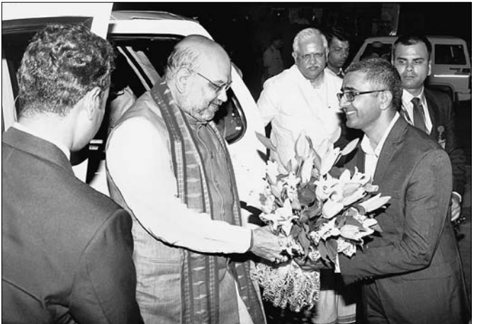
ଜିଲ୍ଲାପାଳ ବଳାଫୁଟ ସିଂ ସ୍ୱରାଷ୍ଟ୍ର ମନ୍ତ୍ରୀ ଅନିତ ଶାହାଙ୍କୁ ସ୍ୱାଗତ କରୁଛନ୍ତି ।