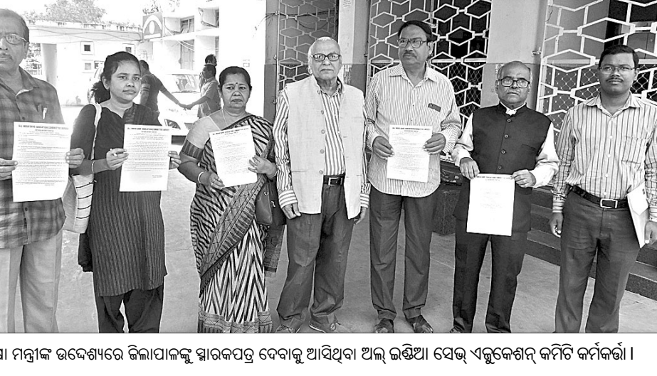
ଗଣଶିକ୍ଷା ମନ୍ତ୍ରୀଙ୍କ ଉଦ୍ଦେଶ୍ୟରେ ଜିଲ୍ଲାପାଳଙ୍କୁ ସ୍ମାରକପତ୍ର ଦେବାକୁ ଆସିଥିବା ଅଲ୍ ଇଣ୍ଡିଆ ସେକ୍ ଏକ୍ସକେକ୍ସ କମିଟି କର୍ମକର୍ତ୍ତା।