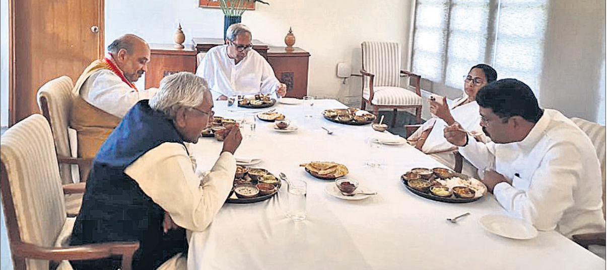
ଭବ୍ୟ ଭୋଜନ: ନବୀନ ନିବାସରେ ଶୁକ୍ରବାର ସ୍ୱରାଷ୍ଟ୍ର ମନ୍ତ୍ରୀ ଅମିତ୍ ଶାହା, ବିହାର ମୁଖ୍ୟମନ୍ତ୍ରୀ ନୀତୀଶ କୁମାର, ପଶ୍ଚିମବଙ୍ଗ ମୁଖ୍ୟମନ୍ତ୍ରୀ ମମତା ବାନାର୍ଜୀ ଓ କେନ୍ଦ୍ରମନ୍ତ୍ରୀ ଧର୍ମେନ୍ଦ୍ର ପ୍ରଧାନଙ୍କୁ ଓଡ଼ିଆ ସୁସ୍ୱାଦୁ ଖାଦ୍ୟ ଦେଇ ଆପ୍ୟାୟିତ କରୁଛନ୍ତି ମୁଖ୍ୟମନ୍ତ୍ରୀ ନବୀନ ପଟ୍ଟନାୟକ ।