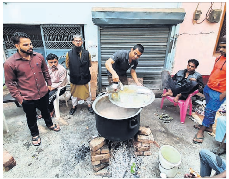
ମୁସାଫୀ ଅଞ୍ଚଳରେ ଦଙ୍ଗା ପ୍ରଭାବିତଙ୍କ ପାଇଁ ତା' ଚାଟାରି କରୁଛନ୍ତି ସେଇାସେବା।