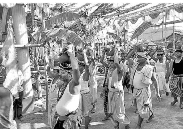
ଶ୍ରଦ୍ଧାଳୁମାନେ କଳସ ଶୋଭାଯାତ୍ରାରେ ଯଜ୍ଞପତ୍ରକୁ ଆସୁଛନ୍ତି ।

ବୈଦେଶ୍ୱର ଥାନା ଅଧୀନ କଳାପଥର ଗ୍ରାମସ୍ଥିତ ରାଧାମୋହନଦେବଙ୍କ ପୀଠ ପରିସରରେ ବୁଦ୍ଧଦିନ ହେଲା ପ୍ରାଥମିକ ପରିବେଶ ବେଖା ଦେଇଥିଲା। ଏ ନେଇ ମନ୍ଦିର ପରିସରରେ ଥିବା ବଜରଙ୍ଗବାଲିକ