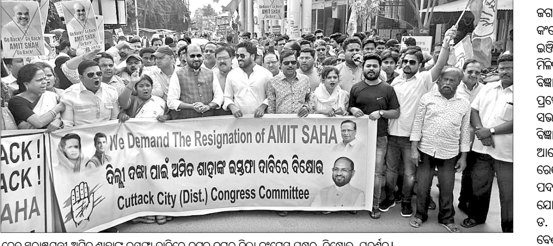
କେନ୍ଦ୍ର ସ୍ୱରାଷ୍ଟ୍ରମନ୍ତ୍ରୀ ଅମିତ୍ ଶାହାଙ୍କ ଇସ୍ତଫା ଦାବିରେ କଟକ ନଗର ଜିଲ୍ଲା କଂଗ୍ରେସ ପକ୍ଷରୁ ବିକ୍ଷୋଭ ପ୍ରଦର୍ଶନ।