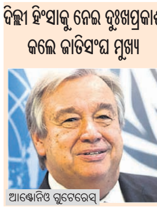
ଦିଲ୍ଲୀ ହିଂସାରୁ ନେଇ ଦୁଃଖପ୍ରକାଶ କଲେ କାଟିସଂଘ ମୁଖ୍ୟ ଆହ୍ୱାନିତ ଗୁଡ଼ିରେ ସ୍ୱତନ୍ତ୍ର

କାଟିସଂଘ ୨୮/୨ (ପି.ଟି.) ଦିଲ୍ଲୀ ଦଙ୍ଗା ଘଟଣାରେ କାଟିସଂଘ ମହାସଭା ଆହ୍ୱାନିତ ଗୁଡ଼ିରେ ସ୍ୱତନ୍ତ୍ର ସାମ୍ପ୍ରଦାୟିକ ସଭାବ ଫେରାଇ ଆଣିବାରେ ମହାତ୍ମା ଗାନ୍ଧୀଙ୍କ ବିଚାରଧାରା ଅଧିକ ଆବଶ୍ୟକତା ରହିଛି ବୋଲି ସେ ମତ ଦେଇଛନ୍ତି। ହିଂସାରୁ ଦୂରେଇ ରହିବା ଲାଗି ସର୍ବାଧିକ ଯୈର୍ଯ୍ୟ ରଖିବା ଲାଗି ଗୁଡ଼ିରେ ସ୍ୱତନ୍ତ୍ର ଦିଲ୍ଲୀବାସୀଙ୍କୁ ଆହ୍ୱାନ ଦେଇଛନ୍ତି।