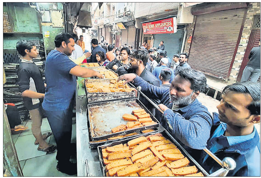
ଦିଲ୍ଲୀର ଚାନ୍ଦବାଗରେ ସ୍ୱାଭାବିକ ହେଉଛି ଜୀବନଯାତ୍ରା।