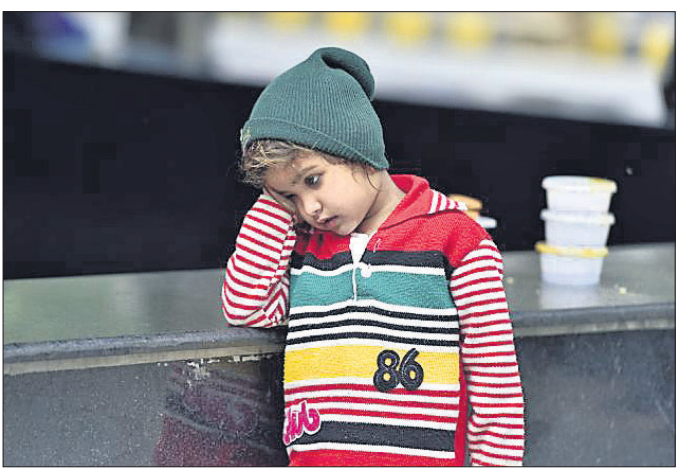
୨୪ ଚାରିଖରୁ ନିଖୋଜ ଥିବା ଦିଲ୍ଲୀବାସୀଙ୍କ ସହାନରେ ୬ ବର୍ଷୀୟା ଝିଅ ଆସିବା।

ବିଗତ ୬୦ ଘଣ୍ଟା ମଧ୍ୟରେ କେଉଁଠି ବି ହିଂସା ଘଟି ନ ଥିବା ଦାବି କରିଛି ଦିଲ୍ଲୀ ପୋଲିସ୍। ବର୍ତ୍ତମାନ ଦିଲ୍ଲୀକୁ ପୂର୍ବ ଭଳି ଶାନ୍ତ କରିବା ଓ ଦଙ୍ଗା ପ୍ରଭାବିତ ଲୋକଙ୍କ ପୁନର୍ବାସ ଓ ଅଭିଆନ ପୋଲିସ୍ ପ୍ରଶାସନ ପାଇଁ ପାଲଟିଛି ସବୁଠୁ ବଡ଼ ଚ୍ୟାଲେଞ୍ଜ। ରାଜଧାନୀ ଦିଲ୍ଲୀରେ ଏପରି ଦଙ୍ଗା ୩ ଦଶନ୍ଧି ମଧ୍ୟରେ ଦେଖିବାକୁ ମିଳି ନ ଥିଲା। ଦୁଇ ସମ୍ପ୍ରଦାୟ ମଧ୍ୟରେ ଘଟିଥିବା ସଂଘର୍ଷ, ହିଂସା ଓ ଜଳାପୋଡ଼ାରେ କେତେ କ୍ଷୟକ୍ଷତି ହୋଇଛି ତା' ଉପରୁ ଜ୍ରମଣ ଧୂଆଁର ବାଦଳ ଉଠୁଛି। ଜାତୀୟ ସୁରକ୍ଷା ପରାମର୍ଶଦାତା (ଏସ୍ଏସ୍ଏସ୍) ଅଧିକ ତୋଡ଼ାଲକ୍ ନିର୍ଦ୍ଦେଶକ୍ରମେ ପୋଲିସ୍ ଅଧିକାରୀମାନେ ବିଭିନ୍ନ ଅଞ୍ଚଳ ବୁଲି ମସ୍ଜିଦ୍ଗୁଡ଼ିକର ଲତ୍ତାମା ଓ ମୌଳିକାମାନଙ୍କୁ ଭେଙ୍ଗୁଛନ୍ତି। ଶୁକ୍ରବାର ମସ୍ଜିଦ୍ଗୁଡ଼ିକରେ ପ୍ରାର୍ଥନା ଅବସରରେ କଡ଼ା ନଜର ରଖାଯାଇଛି। ସେମାନେ ଖୁବ୍ଶୀଘ୍ର ଶାନ୍ତି ଫେରାଇ ଆଣିବାର ପ୍ରତିଶ୍ରୁତି ମଧ୍ୟ ଦେଇଛନ୍ତି। ଭଟ୍ଟିମଧ୍ୟରେ ପ୍ରାୟ ୧୫୦ ମାମଲା ରୁଜୁ