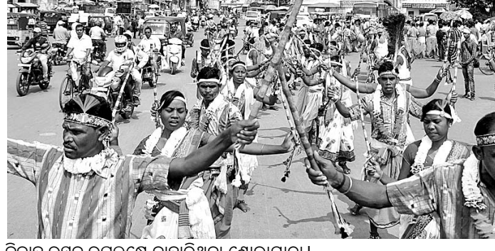
ବିବାହ ଉତ୍ସବ ଉପଲକ୍ଷେ ବାହାରିଥିବା ଶୋଭାଯାତ୍ରା।