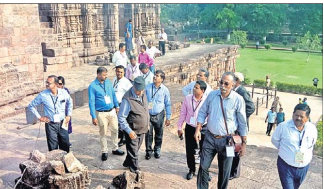
ମନ୍ଦିର ବୁଲି ଛୁଟି ଅନୁଧ୍ୟାନ କରୁଛନ୍ତି ବରିଷ୍ଠ ଅଧିକାରୀ ଓ ବିଶେଷଜ୍ଞମାନେ।