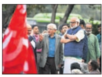
ଯତ୍ନମତ୍ତରେ ବିଶୋଭ ବାଲିଧୁବାବେଳେ ସିପିଆଇଏମ୍ ସାଧାରଣ ସମ୍ମାନ ଯାତ୍ରାରେ ଯେତୁରା ଓ ଅନ୍ୟମାନେ ଉପସ୍ଥିତ।