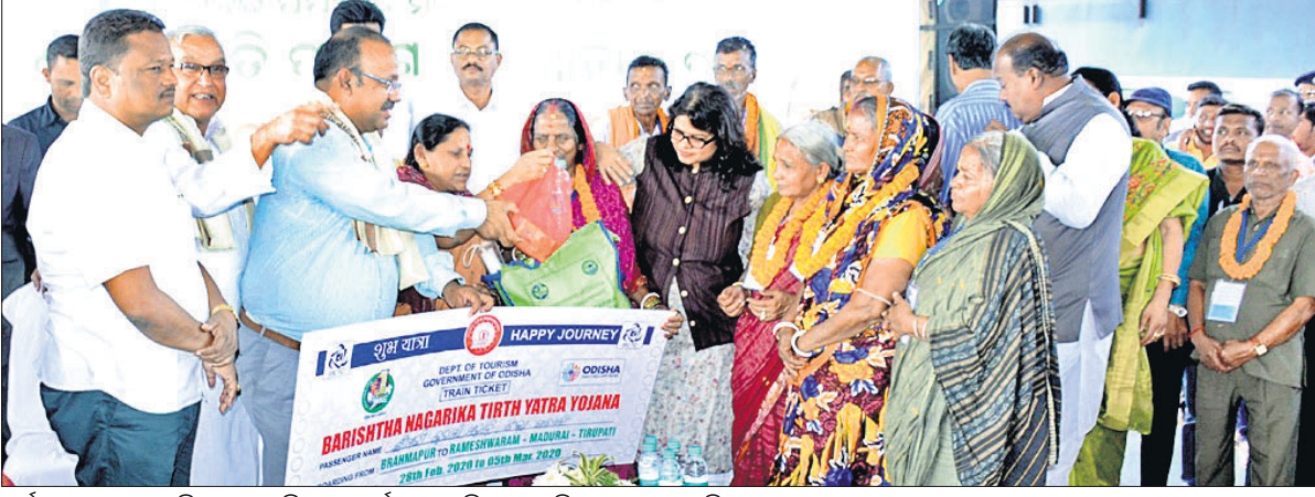
ପର୍ଯ୍ୟଟନ ମନ୍ତ୍ରୀ ଜ୍ୟୋତିପ୍ରକାଶ ପାଣିଗ୍ରାହୀ ତୀର୍ଥଯାତ୍ରାକୁ ଚିକେଟ ଏବଂ କର୍ମ ପ୍ରଦାନ କରୁଛନ୍ତି।

ବ୍ରହ୍ମପୁରରୁ ଯାତ୍ରା ଆରମ୍ଭ କଲା ସ୍ୱଚ୍ଛ ଟ୍ରେନ ଆଧ୍ୟାତ୍ମିକ ଚେତନା ସୃଷ୍ଟି କରିଛି ଯୋଜନା: ପର୍ଯ୍ୟଟନ ମନ୍ତ୍ରୀ