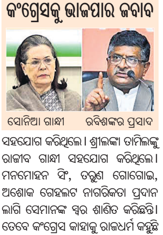
କଂଗ୍ରେସକୁ ଭାଜପାର ଜବାବ ସୋନିଆ ଗାନ୍ଧୀ ରବିଶଙ୍କର ପ୍ରସାଦ ସହଯୋଗ କରିଥିଲେ। ଶ୍ରୀଲଙ୍କା ଚାମିଲଙ୍କୁ ରାଜ୍ୟ ଗାନ୍ଧୀ ସହଯୋଗ କରିଥିଲେ। ମନମୋହନ ସିଂ, ଚରୁଣ ଗୋରୋଇ, ଅଶୋକ ଗେହଲଟ ନାଗରିକତା ପ୍ରଦାନ ଲାଗି ସେମାନଙ୍କ ସ୍ୱର ଶାନ୍ତି କରିଛନ୍ତି। ତେବେ କଂଗ୍ରେସ୍ କାହାକୁ ରାଜଧର୍ମ କହୁଛି

ନୂଆଦିଲ୍ଲୀ, ୨୮/୨ ଦିଲ୍ଲୀ ହିଂସାରୁ ନେଇ ଭାଜପା ରାଜଧର୍ମ ପାଠକ କରୁ ବୋଲି କଂଗ୍ରେସ୍ କହିବା ପରେ ଏହାର ଜବାବ ଦେଇଛି ଶାସକ ଦଳ। ଆମକୁ ରାଜଧର୍ମ ପାଠ ପଢ଼ାଅନି ବୋଲି ଭାଜପା ନେତା ତଥା କେନ୍ଦ୍ରମନ୍ତ୍ରୀ ରବିଶଙ୍କର ପ୍ରସାଦ ଶୁକ୍ରବାର କଂଗ୍ରେସ୍ ଅଧ୍ୟକ୍ଷା ସୋନିଆ ଗାନ୍ଧୀଙ୍କୁ ଚାରେଟ କରି କହିଛନ୍ତି। କଂଗ୍ରେସ୍ ପ୍ରତିନିଧିଦଳ ରାଷ୍ଟ୍ରପତି ରାମନାଥ କୋବିନ୍ଦଙ୍କୁ ଭେଟି ରାଜଧର୍ମ ପାଠକ କରିବାକୁ ସରକାରଙ୍କୁ ପରାମର୍ଶ ଦେବାକୁ କହିଥିଲେ। ଇନ୍ଦିରା ଗାନ୍ଧୀ ଉଦ୍‌ଘୋଷଣା ଆସିଥିବା ଲୋକଙ୍କୁ