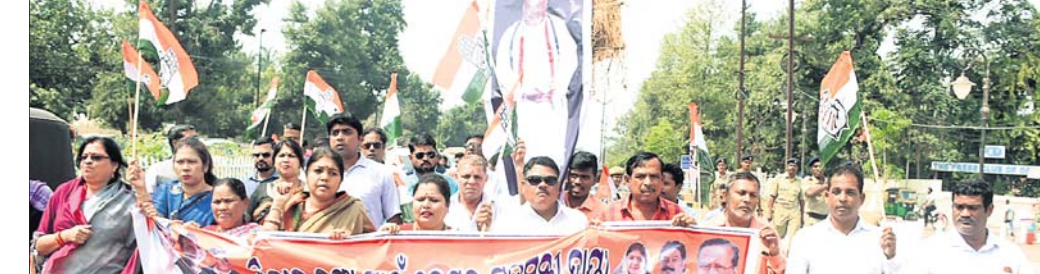
ଭୁବନେଶ୍ୱର ଜିଲ୍ଲା କଂଗ୍ରେସ କମିଟି ପକ୍ଷରୁ ମାଷ୍ଟରକ୍ୟାଣ୍ଡିଡ୍ ଛକରେ ବିକ୍ଷୋଭ ପ୍ରଦର୍ଶନ କରାଯାଇଛି।