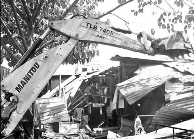
କେସିବି ଦ୍ୱାରା ଦୋକାନୀକୁ ଉଚ୍ଛେଦ କରାଯାଇଛି ।