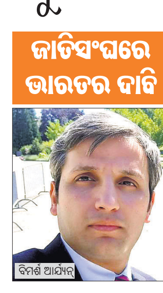
କାଟିସଂଘରେ ଭାରତର ଦାବି ବିମର୍ଶ ଆର୍ଯ୍ୟନ୍

କେନେଭା, ୨୮/୨ (ପି.ଟି.) ଆତଙ୍କବାଦୀ ସଂଗଠନଗୁଡ଼ିକୁ ପାକିସ୍ତାନ ପାଣ୍ଠି ଯୋଗାଣ ବନ୍ଦ କରୁ। ଏଥିସହିତ ସେଠାରୁ କାର୍ଯ୍ୟ କରୁଥିବା ଆତଙ୍କବାଦୀ ଶିବିରଗୁଡ଼ିକୁ ଧ୍ୱଂସ କରିବା ପାଇଁ କାଟିସଂଘରେ ପାକିସ୍ତାନର ଶାନ୍ତି ନେତୃତ୍ୱ ଭାରତ ପରାମର୍ଶ ଦେଇଛି। ଆତଙ୍କବାଦୀଙ୍କୁ ପାଣ୍ଠି ଯୋଗାଣ ବନ୍ଦ ଦିଗରେ ଉପଯୁକ୍ତ ପଦକ୍ଷେପ ଗ୍ରହଣ କରିବାରେ ବିଫଳ ହୋଇଥିବା ଭଦ୍ରାକାମାବାଦକୁ ଗତ ସମ୍ପ୍ରଦାୟ ଫାଇନାଲିଆଲ ଆକ୍ସନ ଗାନ୍ଧିପୋର୍ସ (ଏସ୍ଏସ୍ଏସ୍) ଧୂସର ଚାଲିକାରେ ରଖିବା ସହ ୪ ମାସ