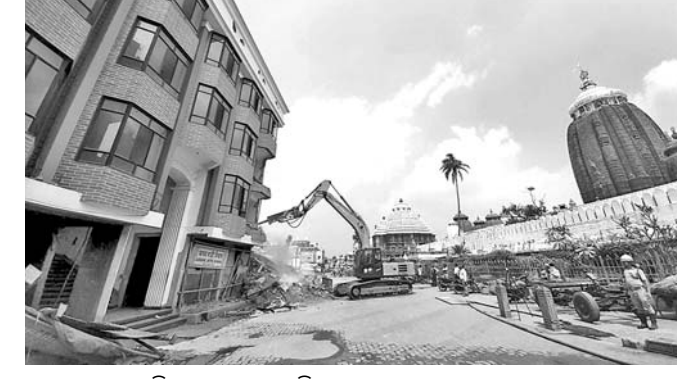
ନେପାଳ ଯାତ୍ରାନିବାସ ଭଙ୍ଗାଯାଇଛି।

ଗ୍ରାମମିତ ପୁରୁଣା ଜୋନରେ ଚାଲିଛି ଉଚ୍ଛେଦ ଅଭିଯାନ। ପ୍ରଶାସନ ପକ୍ଷରୁ ଗ୍ରାମମିତ ନେପାଳ ଯାତ୍ରାନିବାସ ପାଟଣା ପାଟଣା ୨୫ ନିକଟ ପରିଧି ମଧ୍ୟରେ ଥିବା ନିର୍ମାଣ ଭଙ୍ଗାଯାଇଛି। ଏହିକ୍ରମରେ ଶୁକ୍ରବାର ପଶ୍ଚିମବଙ୍ଗ ନିକଟରେ ଥିବା ନେପାଳ ଯାତ୍ରାନିବାସ ଉଚ୍ଛେଦ କରାଯାଇଛି। ୧ ପୁରୁଣ ପୋଲିସ ଫୋର୍ସ ଓ ଏକକିଲୁଗ୍ରିଟି ମାଲିକଙ୍କୁ ଉପସ୍ଥିତରେ ଏହାକୁ ଉଚ୍ଛେଦ କରାଯାଇଛି। ଶନିବାର ମଧ୍ୟ ଏହି ଯାତ୍ରାନିବାସର ଅଧା ଥିବା ୨୫ ନିକଟ ପରିଧି ମଧ୍ୟରେ ଥିବା ନିର୍ମାଣ ଭଙ୍ଗାଯାଇଛି। ଏହିକ୍ରମରେ ଶୁକ୍ରବାର ପଶ୍ଚିମବଙ୍ଗ ନିକଟରେ ଥିବା ନେପାଳ ଯାତ୍ରାନିବାସ ଉଚ୍ଛେଦ କରାଯାଇଛି।