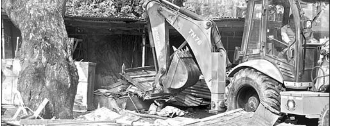
ଡୋଜରରେ ଜବରଦଖଲ ଉଚ୍ଛେଦ କରାଯାଇଛି।

ହୋଇଥିଲେ। ପରେ ହାଇକୋର୍ଟ ଏହି ମାର୍କେଟକୁ ଉଚ୍ଛେଦ ପାଇଁ ନିର୍ଦ୍ଦେଶ ଦେଇଥିଲେ। ଏଥିସହ ସିଟି ହକ୍ସିଗଲକୁ ସଂଯୋଗ କରୁଥିବା ରାସ୍ତାକୁ ଅବରୋଧ କରୁଥିବା ଗୃହ ଓ ଦୋକାନ ଉଚ୍ଛେଦ ପାଇଁ ନିର୍ଦ୍ଦେଶ ଦେଇଥିଲେ। ଫଳରେ ଶୁକ୍ରବାର ୫୦ରୁ ଊର୍ଦ୍ଧ୍ୱ ଦୋକାନ ଓ ଗୃହ ଉଚ୍ଛେଦ ହୋଇଥିଲା। ବ୍ୟୋଧନ ଭାବେ ରାସ୍ତା ଉପରେ ବାଲିଗୋଡ଼ି କମା କରିଥିବା ଲୋକଙ୍କଠାରୁ ୧୧,୫୦୦ ଟଙ୍କା ଜମିନାମା ମଧ୍ୟ ଆଦାୟ କରାଯାଇଥିଲା। ଏହି କାର୍ଯ୍ୟକ୍ରମରେ ଜୋନ୍ ଏସିପି ଏନ୍. ଥିବାବେଳେ ଅନେକ ସମୟରେ ଆତ୍ମହତ୍ୟାକ୍ରମକୁ ରୋଗୀ ନେବା ଆଶିବାର ଅଧିକାରୀ ହୋଇଥାଏ। ଯାହାକୁ ନେଇ ଜିଲ୍ଲା ସାଧ୍ୟ ଅଧିକାରୀ ହାଇକୋର୍ଟରେ ବ୍ଲାର୍ଡ