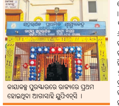
କାୟାକଳ୍ପ ପୁରସ୍କାରରେ ରାଜ୍ୟରେ ପ୍ରଥମ ହୋଇଥିବା ଆଗାସାହି ମୁପିଏର୍‌ସି ।

୨୦୧୯-୨୦ ବର୍ଷ ପାଇଁ ରାଜ୍ୟ ସ୍ତରୀୟ ଓ ପରିବାର କଲ୍ୟାଣ ବିଭାଗ ପକ୍ଷରୁ କାୟାକଳ୍ପ ପୁରସ୍କାର ମଞ୍ଜୁରୀଦେଇ ଘୋଷଣା କରାଯାଇଛି । ଚଳିତ ବର୍ଷ ଏହି ପୁରସ୍କାରରେ ପୁଣି ବାଲି ମାରିଛି ବ୍ରହ୍ମପୁର ମହାନଗର ନିଗମ(ବିଏମ୍‌ସି) ସହରାଞ୍ଚଳ ପ୍ରାଥମିକ ସ୍ତରୀୟ କେନ୍ଦ୍ର(ମୁପିଏର୍‌ସି) । ଏହି ପୁରସ୍କାରରେ ସହରର ୮ ମୁପିଏର୍‌ସି ମଧ୍ୟରୁ ଆଗାସାହି ଓଡିଶାରେ ପ୍ରଥମସ୍ଥାନ ହାସଲ କରିଛି । ଆୟାରୋଡ ଓ ବୈକୁଣ୍ଠନଗର ମୁପିଏର୍‌ସି ଦ୍ୱିତୀୟ ସ୍ଥାନ ହାସଲ କରିଛି । ଏହାବ୍ୟତୀତ ଅନ୍ୟ ୪ ମୁପିଏର୍‌ସି ରାଜ୍ୟର ଶ୍ରେଷ୍ଠ ୧୫ ମଧ୍ୟରେ ରହିଛି । ସେମାନଙ୍କ ମଧ୍ୟରେ ଆମପୁଆ ୬୫୩, ଖୋଦାସିଳି ୧୧୦୯, ଉତ୍ତରାପୁଷା ୧୪୦୯, ଗୁଡସ୍‌ଗେଜ୍ ରୋଡ୍ ମୁପିଏର୍‌ସି ୧୫୦୯ ସ୍ଥାନରେ ରହିଥିବା ନେଇ ବିଏମ୍‌ସି କାର୍ଯ୍ୟାଳୟ ପକ୍ଷରୁ ସୂଚନା ମିଳିଛି । ସୂଚନାଯୋଗ୍ୟ, ୨୦୧୯ ଫେବୃଆରୀରେ ୨୦୧୮-୧୯ ପାଇଁ ଘୋଷିତ କାୟାକଳ୍ପ ପୁରସ୍କାର ବ୍ରହ୍ମପୁରର ୬ ମୁପିଏର୍‌ସି ଶ୍ରେଷ୍ଠ ୨୫ ମଧ୍ୟରେ ସ୍ଥାନ ପାଇଥିଲା । ସେଥିମଧ୍ୟରୁ ପ୍ରଥମ ଶ୍ରେଷ୍ଠ ୧୦ ସ୍ୱାକ୍ଷ୍ୟକେନ୍ଦ୍ର ମଧ୍ୟରେ ବ୍ରହ୍ମପୁରର ୫ ମୁପିଏର୍‌ସି ରହିଥିଲା ।