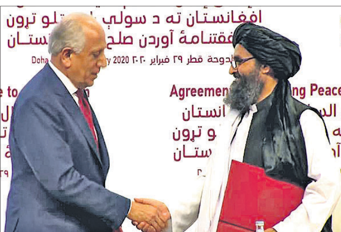
ଆଫଗାନିସ୍ତାନ ଶାନ୍ତି ପାଇଁ ଆଫଗାନିସ୍ତାନର ସ୍ୱତନ୍ତ୍ର ପ୍ରତିନିଧି କମିଟିର ଖାଲିଜାଡ୍ (ବାମ) ଓ ତାଲିବାନ୍ ସହପ୍ରତିଷ୍ଠାତା ମୁଲ୍ଲା ଅବଦୁଲ ରଜି ବରାଦର ଚୁକ୍ତି ସ୍ୱାକ୍ଷର କରିବା ପରେ କରମର୍ଦନ କରୁଛନ୍ତି ।