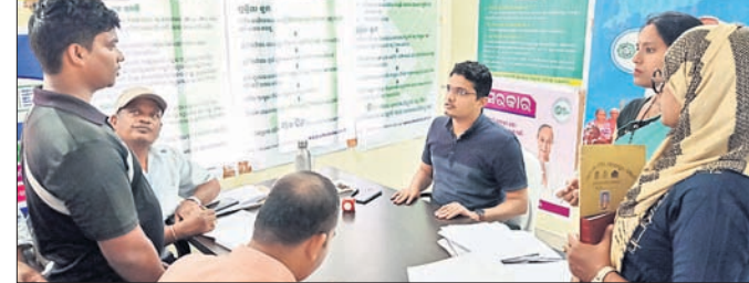
ଅଭିଯୋଗ ଶୁଣାଣି ଉପକଳାପାଳ।

ଗୋପାଳପୁର, ୨୯୩୨ ଗୋପାଳପୁର ଏନ୍‌ଏସି କାର୍ଯ୍ୟାଳୟରେ ଶନିବାର ଅଭିଯୋଗ ଶୁଣାଣି ଅନୁଷ୍ଠିତ ହୋଇଯାଇଛି।