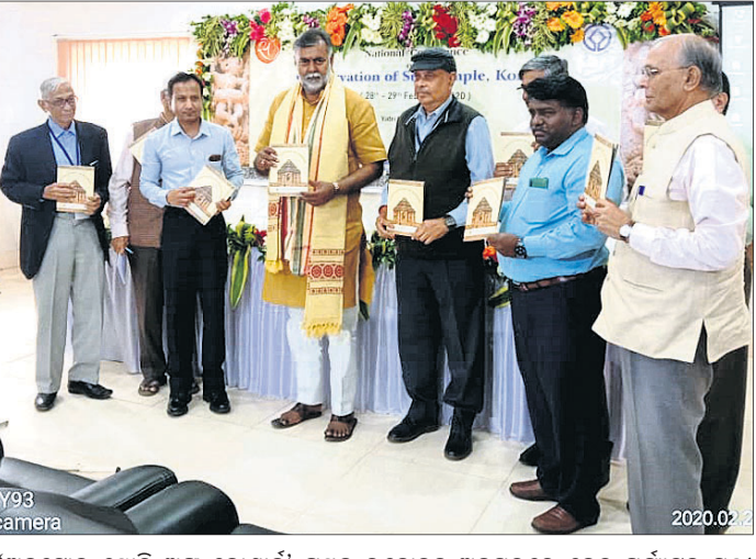
'ଅନନ୍ତେନ୍ଦ୍ର ଶ୍ୱେରୀ ଅଫ୍ କୋଣାର୍କ' ପୁସ୍ତକ ଉଦ୍ଘୋଷଣ ଅବସରରେ କେନ୍ଦ୍ର ପର୍ଯ୍ୟଟନ ମନ୍ତ୍ରୀ ପ୍ରହଲ୍ଲାଦ ସିଂ ପଟ୍ଟେଲ ଓ ଅନ୍ୟ ଅତିଥିମାନେ ।