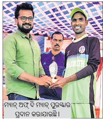
ମ୍ୟାଚ୍ ଅଫ୍ ଦି ମ୍ୟାଚ୍ ପୁରସ୍କାର ପ୍ରଦାନ କରାଯାଇଛି।

ଭଞ୍ଜନଗର କବିସମ୍ରାଟ ଉପେନ୍ଦ୍ର ଭଞ୍ଜ ମହାବିଦ୍ୟାଳୟ ଖେଳ ପରିଷଦର ବାଲିପୁରୀ ବିଜୟନନ୍ଦ ପଞ୍ଚନାୟକ ସ୍ମାରକୀ କ୍ରିକେଟ ଟୁର୍ନାମେଣ୍ଟର ବିଜୟୀ ଯେମି ଫାଇନାଲ ମ୍ୟାଚ୍ ଶନିବାର ହୋଇଥିଲା।