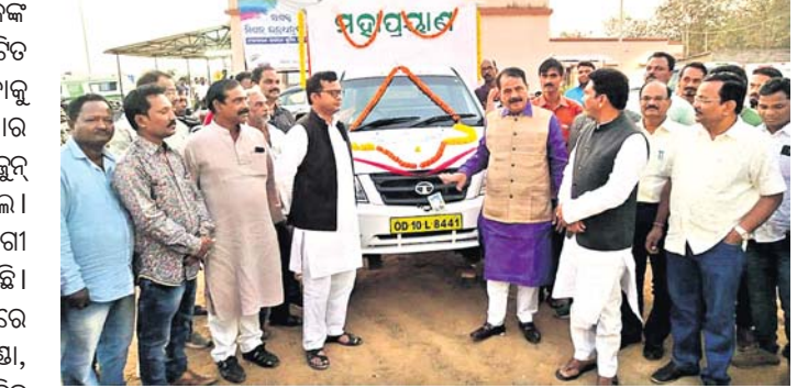
କନ୍ଧପୁର ବିଧାୟକ ଓ କୋରାପୁଟ ଏମ୍‌ପି ମହାପ୍ରୟାଣ ଗାଡ଼ିର ଶୁଭାରମ୍ଭ କରୁଛନ୍ତି। ଡର୍ମିଟୋରିରେ ଶହେ ଜଣ ରହିପାରିବେ। ହଲ୍‌ରେ ଶୌଚ ପାଇଁ ୧୨ଟି ପାଇଖାନା ବଡ଼ ବଡ଼ ୨ଟି ହଲ୍ କରାଯାଇଛି। ଓ ବାଥରୁମ୍ କରାଯାଇଛି। ୬୦ଟି ଖଟ

ରୋଗୀଙ୍କ ସମ୍ପର୍କୀୟଙ୍କ ପାଇଁ ଜିଲ୍ଲା ହସ୍ପିଟାଲରେ ରୋଗୀ ସହାୟକକ ବିଶ୍ୱାମାଗାର ଓ ମହାପ୍ରୟାଣ ଗାଡ଼ି ଉଦ୍‌ଘାଟିତ ହୋଇଛି। ରୋଗୀଙ୍କ ସମ୍ପର୍କୀୟମାନେ ରହିବାକୁ ଅନୁବିଧା ହେଉଥିବାରୁ ଏହି ସମସ୍ୟାର ସମାଧାନ କରିବା ପାଇଁ ବିଧାୟକ ଗତ ୨୪ ଜୁନ ୨୦୧୯ରେ ଏହାର ଶିଳାନିଧାସ କରିଥିଲେ। ୪୮ ଲକ୍ଷ ଟଙ୍କା ବିନିଯମରେ ରୋଗୀ ସହାୟକକ ବିଶ୍ୱାମାଗାର ନିର୍ମାଣ କରାଯାଇଛି। ପୂର୍ବରୁ ରୋଗୀଙ୍କ ସମ୍ପର୍କୀୟମାନେ ବାରଣ୍ଡାରେ ଶୋଭାପୁଟୁଲେ। ନଚେତ୍ ବୋକାଳ ପିଣ୍ଡା, ତିହାଘର କିମ୍ପା ଲକ୍ଷରେ ରହୁଥିଲେ। କିନ୍ତୁ ବର୍ତ୍ତମାନ ଏହି ବିଶ୍ୱାମାଗାର ଉଦ୍‌ଘାଟନ ହେବା ପରେ ରୋଗୀଙ୍କ ସମ୍ପର୍କୀୟମାନେ ଏହି ଡର୍ମିଟୋରିରେ ମାଗଣାରେ ରହିବେ। ଏହି