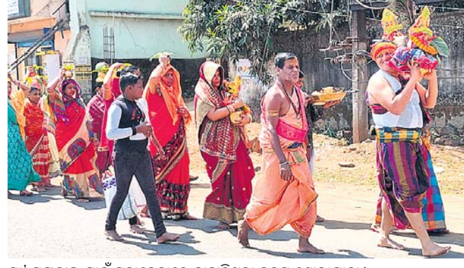
ମା' ମଙ୍ଗଳାକ ପାଇଁ ସୁନାବେଡ଼ାରେ ବାହାରିଥିବା କଳସ ଶୋଭାଯାତ୍ରା।