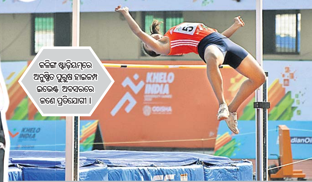
କଳିଙ୍ଗ ଷ୍ଟାଡ଼ିୟମରେ ଅନୁଷ୍ଠିତ ପୁରୁଷ ହାଇଜମ୍‌ ଇଭେଣ୍ଟ ଅବସରରେ ଜଣେ ପ୍ରତିଯୋଗୀ।