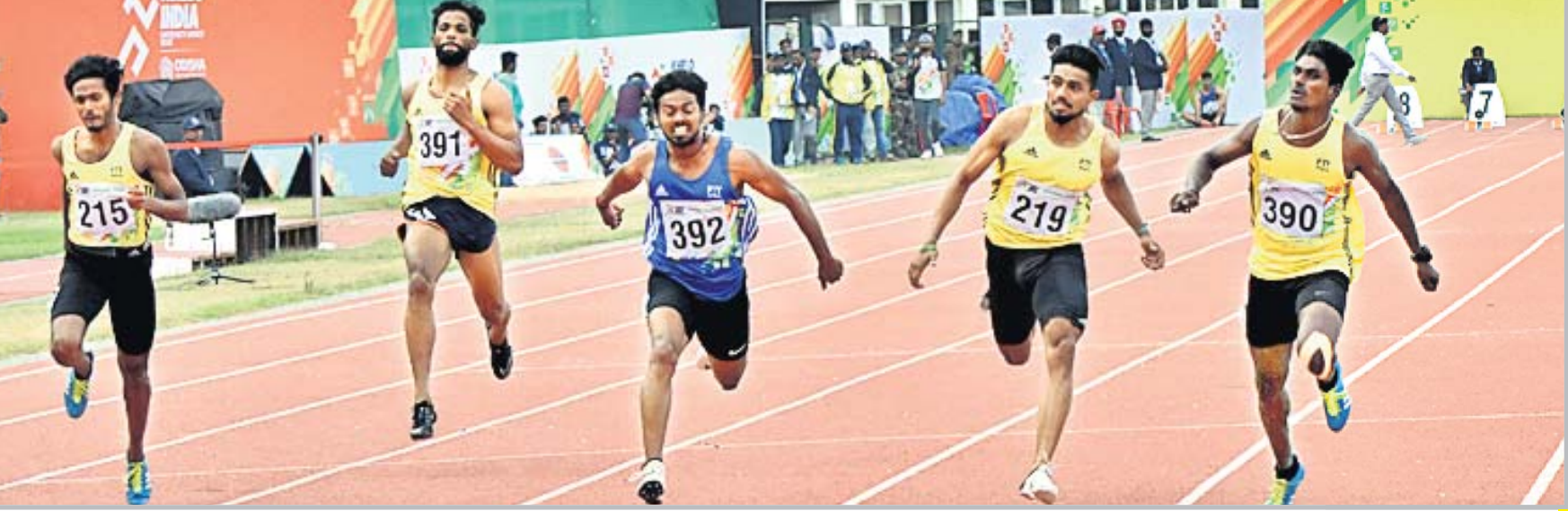
ପୁରୁଷ ୧୦୦ ମିଟର ରେସର ଏକ ଉତ୍ସାହପୂର୍ଣ୍ଣ ମୁହୂର୍ତ୍ତ।