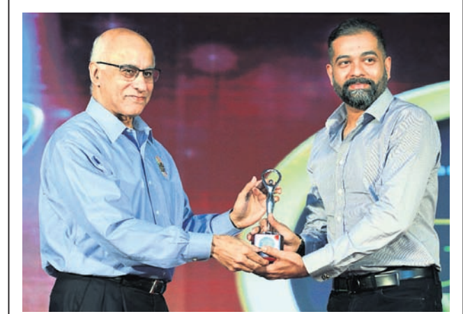
ନିକଟରେ ଅନୁଷ୍ଠିତ ଚାନ୍ଦିନୀ ବିକଳେପ ଆଡ଼ାରେ ୨୦୨୦ ଉତ୍ସବରେ ଖୁମ୍ବୀ ଗୁପ୍ତ ଅଗୋପୋବାଲ ଡିଭିଜନର ଡିଭିଜନ 'କୁମ୍ଭୀରୀ ଲକ୍ଷ୍ମରନେତ' ଦୁଇ ଚଳିଆ ଯାନ ବର୍ଷରେ ବେଷ୍ଟ ଅଗୋପୋବାଲ ଶୋ'ରୁ ମାନ୍ୟତା ହୋଇଛି। ଏହି ଅବସରରେ ଅନୁଷ୍ଠିତ କାର୍ଯ୍ୟକ୍ରମରେ ଗୁପ୍ତ ପକ୍ଷରୁ ଖୁମ୍ବୀ ଖୁମ୍ବୀ(ତାହାଣ), ମାଲକ୍ଷ୍ମିର ସହ ପ୍ରତିଷ୍ଠାତା ଗୁପ୍ତ ବାଗଚୀକାଠାରୁ ଆଡ଼ାରେ ଗ୍ରହଣ କରାଯାଇଛି।

ରହିଛି। କରୋନା ଭାଇରସ ବିଶ୍ୱର ବିକାଶ ସର୍ବବୃଦ୍ଧ ଅର୍ଥ ବ୍ୟବସ୍ଥାର କାର୍ଯ୍ୟକଳାପକୁ ଠିକ୍ କରି ରଖି ଦେଇଛି। ଏହାର ପ୍ରଭାବ ପ୍ରମୁଖ ଉଦ୍ୟୋଗ କ୍ଷେତ୍ରଗୁଡ଼ିକରେ ଦେଖାଯାଇଛି। କରୋନା ଯୋଗୁ ବିଶ୍ୱ ଅର୍ଥବ୍ୟବସ୍ଥାରେ ମାନ୍ୟତା ଆସିପାରେ ବୋଲି ଆର୍ଥିକ ସହଯୋଗ ଏବଂ ବିକାଶ ସଙ୍ଗଠନ(ଓଡ଼ିଏସି) ପକ୍ଷରୁ କୁହାଯାଇଛି। ଏହାବାଦ କରୋନା ଭାଇରସ ପେଡ଼ୋଲିୟମ ଉଦ୍ୟୋଗ ପକ୍ଷରୁ ଆମେରିକାରେ ହେବାକୁ ଥିବା ବିଶ୍ୱପ୍ରତ୍ୟାୟ ସମ୍ପର୍କିତ କାର୍ଯ୍ୟକଳାପ ବାଟିଲ କରାଯାଇଛି।