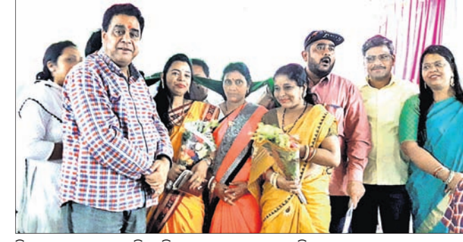
ବିଧାୟକ ଗହଣରେ ବିଜେଡିରେ ଯୋଗଦେଇଥିବା ମହିଳାମାନେ।