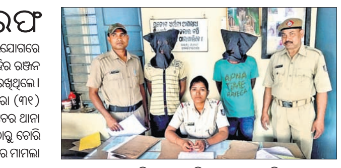
ଦୁଇ ଅଭିଯୁକ୍ତଙ୍କୁ ପୋଲିସ ହାଜର କରାଇଛି।