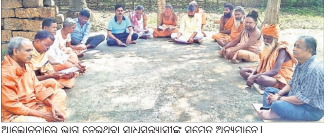
ଆଲୋଚନାରେ ଭାଗ ନେଉଥିବା ସାଧୁସନ୍ନ୍ୟାସୀଙ୍କ ସମେତ ଅନ୍ୟମାନେ।

ମହିମା ଧର୍ମର ନିଗୂଢ଼ ରହସ୍ୟକୁ ଓଡ଼ାପଡ଼ା, ରୁଡ଼ିଆକାଟେଣା ଛକ, କାର୍ଯ୍ୟକ୍ରମ ପରିଚାଳନା କରିବାକୁ ଥିବା ବିଭିନ୍ନ ମହିମା ରୁଜ୍ଜି ଗସ୍ତ କରି ଆଲୋଚନା କରିଛନ୍ତି।