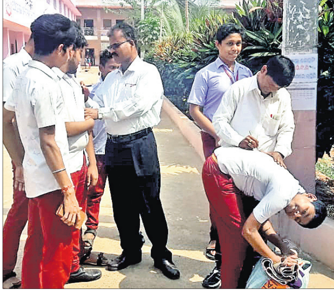
ମାଟ୍ରିକ୍ ପରୀକ୍ଷା ଶେଷଦିନରେ କାମାକ୍ଷାନଗର ବ୍ଲକ୍ କାନପୁରା ପଞ୍ଚାୟତରାଜ ହାଇସ୍କୁଲର କେତେଜଣ ଛାତ୍ର ସେମାନଙ୍କ ମୁନିଟିଂରେ ଶିକ୍ଷକଙ୍କ ସ୍ୱଖଣ୍ଡିତ ନେଉଛନ୍ତି।

ଡେକାନାଲ ଅଫିସ/କାମାକ୍ଷାନଗର, (ଡି.ଏନ.ଏ.), ୨୩