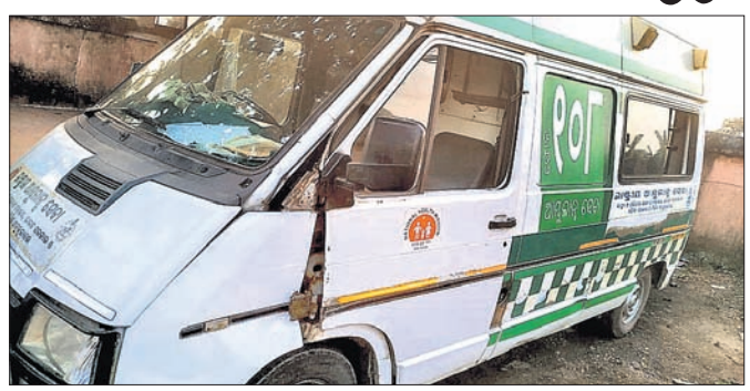
ଅଚଳ ହୋଇପଡ଼ିଥିବା ୧୦୮ ଆମ୍ବୁଲାନ୍ସ।

ଜରୁରୀ ସ୍ୱାସ୍ଥ୍ୟସେବାର ଏକ ପ୍ରସ୍ତୁତ ଅଙ୍ଗ ପାଲଟିଥିବା ୧୦୮ ଆମ୍ବୁଲାନ୍ସ ଡୋରରେ ଭିଡ଼ାଯାଇଛି ଦଉଡ଼ି। ଗାଡ଼ିର ସାଇଡ୍ ଓ ପଛ ଡୋର ଭାଙ୍ଗି ଯାଇଥିବା ବେଳେ ଏସି କି ଅକ୍ସିଜେନ ସିଲିଣ୍ଡର ମଧ୍ୟ କାମ କରୁନା। ଏପରି ଅବସ୍ଥାରେ କେତେଦିନ