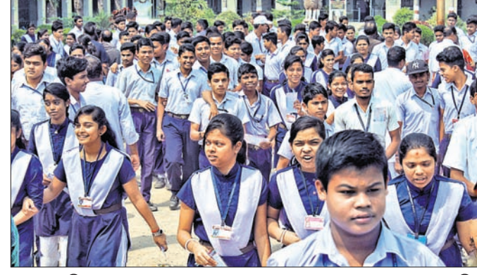
ପରୀକ୍ଷା ସରିବା ପରେ ଅନୁଗୋଳର ଏକ ପରୀକ୍ଷା କେନ୍ଦ୍ରରୁ ଛାତ୍ରଛାତ୍ରୀମାନେ ବାହାରୁଛନ୍ତି।