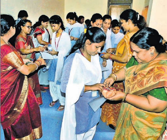
ଭୁବନେଶ୍ୱର ରମାଦେବା ବିଶ୍ୱବିଦ୍ୟାଳୟରେ ମୁକ୍ତ ପରୀକ୍ଷାର୍ଥୀଙ୍କୁ ଯାଞ୍ଚ କରାଯାଇଛି।

ଉଚ୍ଚ ମାଧ୍ୟମିକ ଶିକ୍ଷା ପରିଷଦ ଦ୍ୱାରା ପରିଚାଳିତ ମୁକ୍ତ ପରୀକ୍ଷା ମଙ୍ଗଳବାରଠାରୁ ଆରମ୍ଭ ହୋଇଛି। ପ୍ରଥମ ଦିନରେ ବିଜ୍ଞାନ ଛାତ୍ରାଛାତ୍ରୀ ମାତୃଭାଷା ଓଡ଼ିଆ ପରୀକ୍ଷା ଦେଇଛନ୍ତି। ସକାଳ ୧୦ଟାରୁ ପରୀକ୍ଷା ଆରମ୍ଭ ହୋଇ ଅପରାହ୍ନ ୧ଟାରେ ସରିଥିଲା। ୯୭ ହଜାର ୫୪୬ ଛାତ୍ରାଛାତ୍ରୀ ପରୀକ୍ଷା ଦେଇଥିବାବେଳେ ୧୧କଣ କପି କରି ଧରାପଡ଼ିଥିବା ଜଣାପଡ଼ିଛି। ସୂଚନାଅନୁସାରେ, ରାଜ୍ୟର ୨୦୨ଟି ହବ୍ରେ ପ୍ରଶ୍ନପତ୍ର ରଖାଯାଇଥିଲା। ମଙ୍ଗଳବାର ସାଢ଼େ ୯ଟା ସୁଦ୍ଧା ପ୍ରଶ୍ନପତ୍ର ପରୀକ୍ଷା କେନ୍ଦ୍ରରେ ପହଞ୍ଚିଥିଲା। ୧୦ଟାରେ ପ୍ରଶ୍ନପତ୍ର ପରୀକ୍ଷା ଆରମ୍ଭ ହୋଇଥିଲା। ଏବର୍ଷ ସମସ୍ତ ପରୀକ୍ଷା କେନ୍ଦ୍ରରେ ସିସିଟିଭି ଲାଗିଥିବାବେଳେ କପି ଓ ନକଲି ପରୀକ୍ଷାର୍ଥୀଙ୍କୁ ରୋକିବାକୁ ପରୀକ୍ଷା କେନ୍ଦ୍ରରେ ଛାତ୍ରାଛାତ୍ରୀଙ୍କୁ ବୁଲୁ ଧର ଯାଞ୍ଚ କରାଯାଇଛି। ପ୍ରଥମେ ଛାତ୍ରାଛାତ୍ରୀଙ୍କ