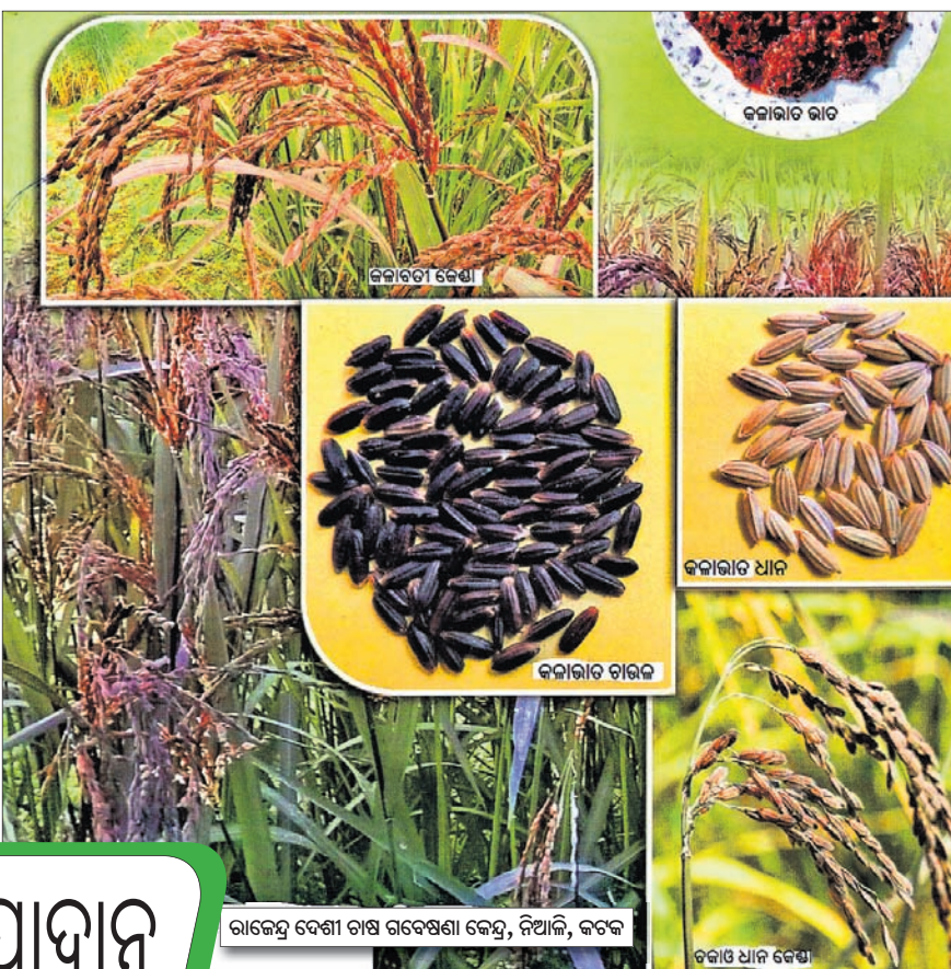
ରାଜେନ୍ଦ୍ର ଦେଶୀ ଚାଷ ଗବେଷଣା କେନ୍ଦ୍ର, ନିଆଳି, କଟକ

ଭାରତରେ ୨୦ରୁ ଅଧିକ କିସମର କଳାଧାନ ଚାଷ କରାଯାଉଛି। ପଶ୍ଚିମବଙ୍ଗ ଏବଂ ଓଡ଼ିଶାରେ କଳାଚାଉଳ ଓ କଳାବତୀ କିସମ ଚାଷ ଅଧିକ। କଳା ଚାଉଳ ଭାତର ରଙ୍ଗ ମଧ୍ୟ କଳା ବା ନାଲି ମିଶା କଳା ବାଜରେଣିଆ ହେଇଥାଏ। କଳାଚାଉଳ ରୋଷେଇ ବେଳେ ବାସ୍ନା ହୁଏ, ଏହା ଏକ ବାସ୍ନା ଚାଉଳ, କଳାଚାଉଳକୁ ପୁଖ୍ୟତଃ ଭାତ, ଖିରି, ସାଲାଡ୍ ଡ୍ରୁସି, ପାଇସାମ୍ ବା ପୁରେରେ ରନ୍ଧା ଖାଦ୍ୟ ସଜାଇବାରେ ବ୍ୟବହାର କରାଯାଇଥାଏ। ଅନ୍ୟ ଚାଉଳ ପରି ରନ୍ଧା ଭାତ ଗୋଟି ଗୋଟି ନ ହୋଇ ଜାଉଆ ହୋଇଥାଏ, ଖାଇବା ଆଳିରେ ଲାଗିଯାଏ। ଚାଉଳ, ଜାପାନ, ଭିଏତନାମ, ଚାଇନା ଭଳି ଦେଶଗୁଡ଼ିକରେ ସବୁ କିସମର ଚାଉଳ ଜାଉଆ। ସେମାନେ ଭୁଇଁଖଣ୍ଡ କାଠି ସାହାଯ୍ୟରେ ଖାଇଥାନ୍ତି। କାଠିରେ ଜାଉଆ ଭାତ ପାଟକୁ ନେବା ସହଜ ହେଇଥାଏ। ଆଇଲାଣ୍ଡରେ କଳାଧାନ କିସମକୁ ଜସମିନ୍ ରାଇସ୍ (jasmine rice) କହନ୍ତି। ରନ୍ଧାଭାତ ମଲିମୁଲ ପରି ବାସେ। ଏହି କିସମ ଚାଉଳର ଭିତର ବି କଳା।