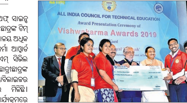
ଗ୍ରାମାଞ୍ଚଳ ରୋଜଗାର ବୁକି ଦିଗରେ ପ୍ରୋତ୍ସାହନା ପ୍ରସ୍ତୁତ କରି ଛାତ୍ରାଛାତ୍ରୀ ଏଭଳି ସଫଳତା ହାସଲ କରିଛନ୍ତି।

ଏସଆର୍ଏମ୍ ଲନଷ୍ଟିସ୍‌ମ ଅଫ୍ ସାଇଟ୍ ଆଣ୍ଡ ରେକୋଲେକ୍ସନ୍ ଛାତ୍ରାଛାତ୍ରୀଙ୍କ ଚିନ୍ତାମାନ ସମ୍ମାନ ବିକାଶ ମନ୍ତ୍ରାଳୟ ଅଧିକ ଏଆଇସିଆଇର ଛାତ୍ର ବିଶ୍ୱକର୍ମୀ ଆଫ୍ଡାୱାର୍ଡ ଲାଭ କରିଛନ୍ତି।