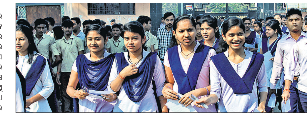
ଅନୁଗୋଳ ସ୍ୱୟଂଶାସିତ ମହାବିଦ୍ୟାଳୟ ପରୀକ୍ଷା କେନ୍ଦ୍ରକୁ ପରୀକ୍ଷାର୍ଥୀମାନେ ପ୍ରବେଶ କରୁଛନ୍ତି।