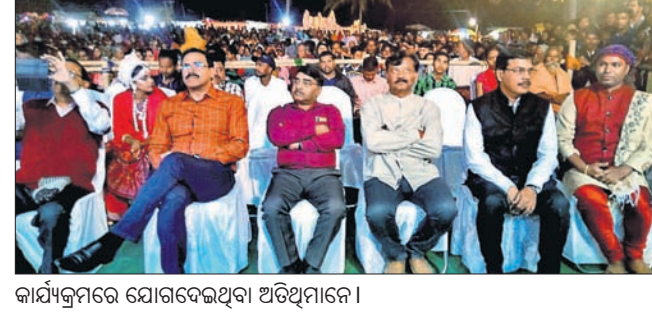
କାର୍ଯ୍ୟକ୍ରମରେ ଯୋଗଦେଇଥିବା ଅତିଥିମାନେ।