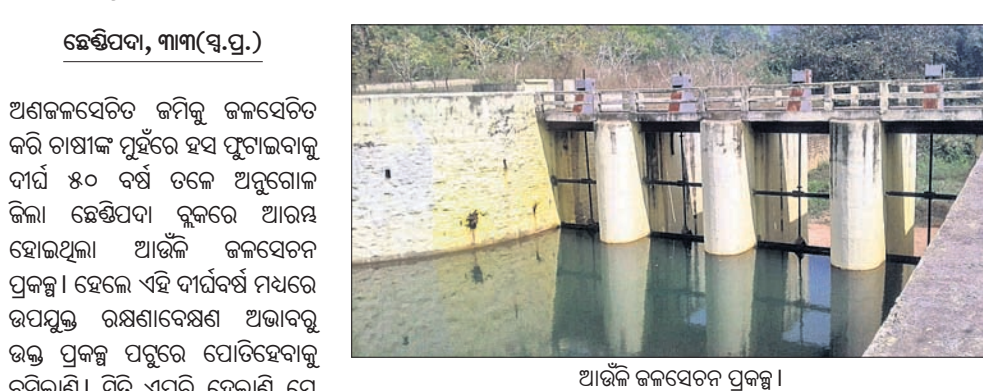
ଆଉଁଳ ଜଳସେଚନ ପ୍ରକଳ୍ପ।

କ୍ଷେତ୍ରପଦା, ୩୩୩(ସ.ପ୍ର.)- ଅଣକଳସେଚିତ ଜମିକୁ ଜଳସେଚିତ କରି ଚାଷୀଙ୍କ ପୂର୍ଣ୍ଣରେ ହସ୍ତ ଫୁଟାଇବାକୁ ଦୀର୍ଘ ୫୦ ବର୍ଷ ତଳେ ଅନୁଗୋଳ ଜିଲ୍ଲା କ୍ଷେତ୍ରପଦା ବ୍ଲକ୍‌ରେ ଆରମ୍ଭ ହୋଇଥିଲା ଆଉଁଳ ଜଳସେଚନ ପ୍ରକଳ୍ପ। ହେଲେ ଏହି ଦୀର୍ଘବର୍ଷ ମଧ୍ୟରେ ଉପଯୁକ୍ତ ରକ୍ଷଣାବେକ୍ଷଣ ଅଭାବକୁ ଉକ୍ତ ପ୍ରକଳ୍ପ ପବୁରେ ପୋତିହେବାକୁ ବସିଲାଣି। ରୁଟି ଏପରି ହେଲାଣି ଯେ କ୍ଷେତ୍ରପଦାରେ ଆଉଁଳ ମଧ୍ୟମ ଜଳସେଚନ ପ୍ରକଳ୍ପ ଆରମ୍ଭ ହୋଇଥିଲା। ପ୍ରକଳ୍ପ କାର୍ଯ୍ୟକ୍ରମ ପରେ ଦୀର୍ଘ ୩୦ କିମିରୁ ଉର୍ଦ୍ଧ୍ୱ କୋଳାଳ ଦ୍ୱାରା ୨୨୭୧ ହେକ୍ଟର ଜମିକୁ ଜଳସେଚିତ କରାଯାଇଥିଲା। ବିଶେଷକରି କର୍ଣ୍ଣପାଳ, କଣଲୋଇ, ନୂଆଗାଁ, ଭାଲିଆସର, ଡଙ୍ଗାପାଳ, ମାଗୁଡ଼ିପ, ଡେଲିଆସ, କରପାଳ ଆଦି ଅଞ୍ଚଳର ୫୨୫ ହେକ୍ଟର ରବି ଋତୁରେ ୧୨୪୬ ହେକ୍ଟର ଖରପ ଋତୁରେ ପାଣି ମଡ଼ାଯାଇ ଚାଷ କରାଯାଉଥିଲା। ହେଲେ ଏବେ ପ୍ରକଳ୍ପର ସୁଇଚ୍‌ଗେଟ୍ ଗୁଡ଼ିକ ଅଚଳ ହୋଇଗଲାଣି। ଏପରିକି ଅନେକ ଯନ୍ତ୍ରାଂଶ ମଧ୍ୟ ନେଇ ହୋଇଗଲାଣି। ଫଳରେ ଚାଳିଥିବା ଚାଷୀ ମହଲରେ ଚାପ ଅବରୋଧ ସୃଷ୍ଟି ହୋଇଛି। ତୁରନ୍ତ ପ୍ରକଳ୍ପର ରକ୍ଷଣାବେକ୍ଷଣ କରାଯିବାକୁ ଦାବି ହୋଇଛି। ସୂଚନାକୁ ଜଣାଯାଏ, ୧୯୬୪ରେ