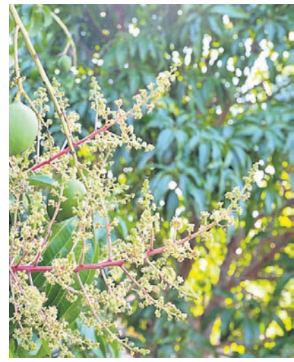
ସହିଆ ପୋକକୁ ନିୟନ୍ତ୍ରଣ କରିବାକୁ ହେଲେ ଗଛର ଗଣ୍ଡି ଚାରିପଟେ ଗ୍ରୀନ୍‌କ୍ସ ଲେପ୍ ଚୁମ୍ବି ପତ୍ରନାଓରୁ ଦେହ ଫୁଟ ଉଠାଇ ଦିଅନ୍ତୁ ।

ଅଧିକ ଅମଳ ପାଇବା ପାଇଁ ଗଛର ସୁରକ୍ଷା ପ୍ରତି ଧ୍ୟାନ ଦିଅନ୍ତୁ । ଆମ ଡାହାଣା ଦମନ ଲାଗି ଆମ କୃଷି ଧରିବା ଅବସ୍ଥାରେ ଥରେ ୩ ମି.ଲି. ଲମ୍ବିତାକୁ ୧୦ ଲିଟର ପାଣିରେ ମିଶାଇ ସିଞ୍ଚନ କରନ୍ତୁ । ଫିମ୍ପି ତଥା ପାଉଁଶିଆ ରୋଗର ପ୍ରତିକାର ନିମନ୍ତେ ବଜ୍ର ହେବାର ୧୫ ଦିନପରେ ଥରେ ସକଫର (ସେଚିତ ଗୁଣ୍ଡ) ୦.୪% କିମ୍ବା ୦.୧୫% ବାଉଁଶିନ୍ ବା ପେନ୍‌କୋନାଜୋଲ୍ ୦.୫ ମି.ଲି./ଲିଟର ସିଞ୍ଚନ କରନ୍ତୁ । ଅଧିକ ଅମଳ ପାଇବା ସକାଶେ ଚଣା ଅବସ୍ଥାରେ ଗଛରେ ପ୍ଲାନୋଫିଲ୍ କିମ୍ବା ପ୍ଲାନୋଡିଆ ୨ ମି.ଲି.କୁ ୨୦ ଲିଟର ପାଣିରେ ମିଶାଇ ସିଞ୍ଚନ କରନ୍ତୁ । କୃଷି ଧରି ସାରିଥିଲେ ଜଳସେଚନର ବ୍ୟବସ୍ଥା କରନ୍ତୁ । ଫଳ ବରିଚାକୁ ଉଚ୍ଚ ଦାଉରୁ ରକ୍ଷା କରିବା ପାଇଁ ଜଳସେଚନ ପୂର୍ବରୁ କ୍ଲୋରୋପାଇରିଫୋସ୍ ଗୁଣ୍ଡ ଗଛପ୍ରତି ୧୦ ଗ୍ରାମ୍ ହିସାବରେ ପ୍ରୟୋଗ କରନ୍ତୁ ।