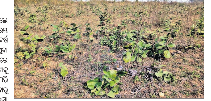
କଟେଜ ହୋଇ ନ ଥିବା କେନ୍ଦୁ ଗୋଛା।

ଫେବୃୟାରୀ ଯାଇ ମାର୍ଚ୍ଚ ହେଲାଣି। ହେଲେ ଏଯାଏ ଗାଳଚେର ଉପଖଣ୍ଡରେ ଆରମ୍ଭ ହୋଇଛି କେନ୍ଦୁପତ୍ର ଉତ୍ପାଦନ। ଗତବର୍ଷ ଧାର୍ଯ୍ୟଲକ୍ଷ୍ୟ ପୂରଣ ହୋଇପାରି ନ ଥିବା ବେଳେ ଚଳିତବର୍ଷ ଗୋଛା କଟେଜରେ ଏପରି ବିକ୍ରୟ ଉତ୍ପାଦନ ହ୍ରାସ ଆଶଙ୍କାକୁ ପୂର୍ଣ୍ଣ ଉଜ୍ଜୀବିତ କରିଛି। ସେହିପରି ଗୋଛା କଟା ଆରମ୍ଭ ହେଉ ନ ଥିବାରୁ ଗୋଲିମାନଙ୍କ ହାତକୁ ବୁଲିପଇସା ଆସିପାରୁ ନାହିଁ। ଏ ନେଇ କେନ୍ଦୁପତ୍ର ଶ୍ରମିକଙ୍କ ମଧ୍ୟରେ ଅସନ୍ତୋଷ ସୃଷ୍ଟି ହୋଇଛି। ଅନୁଗୋଳ ଜିଲ୍ଲା କଣିହାଁ ବ୍ଲକ୍ ଅଞ୍ଚଳର ବହୁ ଖିରିଆ କେନ୍ଦୁପତ୍ର ଉତ୍ପାଦନ ଉପରେ ନିର୍ଭରଶୀଳ। କିନ୍ତୁ ବିଭାଗୀୟ ଅବହେଳାକୁ ଯୋଗୁ ଗ୍ରାମାଞ୍ଚଳକୁ ପ୍ରତ୍ୟୁତ୍ପାଦି ଦିନକୁ ଦିନ ହ୍ରାସ ପାଉଥିବାବେଳେ ଦୀର୍ଘ ୩ ବର୍ଷ ହେବ କଣିହାଁ ମହକୁମାକୁ ରେଖି କାର୍ଯ୍ୟାଳୟ ଉଠାଇଛି। ବର୍ତ୍ତମାନ ବଜ୍ରକୋଟ ଓ ଶିବୁର ରେଖି କାର୍ଯ୍ୟାଳୟ ଅଧୀନରେ କାମ ଚାଲିଥିବାବେଳେ ଗାଳଚେର ଉପଖଣ୍ଡରେ ଏସିଏଫ କାର୍ଯ୍ୟାଳୟ ରହିଛି। ତେବେ ଚଳିତବର୍ଷ