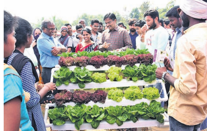
ଅତିଥି ଓ ଅନ୍ୟମାନେ ଏକ ସ୍ଥଳ ରୁଚି ଦେଖୁଛନ୍ତି।

ଆଲୋଚନା ହୋଇଥିଲା। ସେହିପରି ଜିଲା ଜରୁରିକାଳୀନ ଅଧିକାରୀ ଏବଂ ପ୍ରତ୍ୟେକ ବ୍ଲକ୍ ତହସିଲ କାର୍ଯ୍ୟାଳୟ ପକ୍ଷରୁ ରିପୋର୍ଟ ପ୍ରସ୍ତୁତ କରିବାକୁ ଜିଲା ଜରୁରିକାଳୀନ ଅଧିକାରୀ ଦେଖାଯାଇଥିଲା।