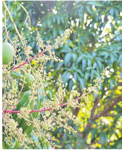
ସହିଆ ପୋକକୁ ନିୟନ୍ତ୍ରଣ କରିବାକୁ ହେଲେ ଗଛର ଗଣ୍ଡି ଚାରିପଟେ ଗ୍ରୀନ୍ ଲେଫ୍ ଛୁମ୍ପି ପତ୍ରନାଠାକୁ ଦେଖି ଫୁଟ ଉଠାଇ ଦିଅନ୍ତୁ ।

ଅଧିକ ଅମଳ ପାଇବା ପାଇଁ ଗଛର ସ୍ତରସା ପ୍ରତି ଧ୍ୟାନ ଦିଅନ୍ତୁ । ଆମ ଡାହାଣା ଦମନ ଲାଗି ଆମ କୃଷି ଧରିବା ଅବସ୍ଥାରେ ଥରେ ୩ ମି.ଲି. ଇମିଡ଼ାକୁ ୧୦ ଲିଟର ପାଣିରେ ମିଶାଇ ସିଞ୍ଚନ କରନ୍ତୁ ।