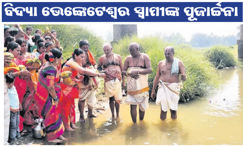
ଜଳସ ଶୋଭାଯାତ୍ରା ପୂର୍ବରୁ ପୂଜାର୍ଚ୍ଚନା କରାଯାଇଛି।

ପାରଳାଖେମୁଣ୍ଡିରେ ଯେଉଁଠି ଆଦର୍ଶ ଥାନା ପୋଲିସ୍ ଡିଭିଜନ୍ ପରିସରରେ ଦେଶାନ୍ତର ଜଗତ ଉପଲକ୍ଷେ ପ୍ରତିଷ୍ଠା କରାଯାଇଥିଲା।