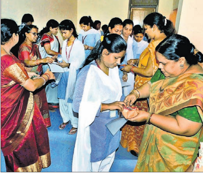
ଭୁବନେଶ୍ୱର ରମାଦେବୀ ବିଶ୍ୱବିଦ୍ୟାଳୟରେ ମୁକ୍ତ ପରୀକ୍ଷା ଆରମ୍ଭ ହୋଇଛି।

ଉଚ୍ଚ ମାଧ୍ୟମିକ ଶିକ୍ଷା ପରିଷଦ ଦ୍ୱାରା ପରିଚାଳିତ ମୁକ୍ତ ପରୀକ୍ଷା ମଙ୍ଗଳବାରଠାରୁ ଆରମ୍ଭ ହୋଇଛି। ପ୍ରଥମ ଦିନରେ ବିଜ୍ଞାନ ଛାତ୍ରାଛାତ୍ରୀ ମାତୃଭାଷା ଓଡ଼ିଆ ପରୀକ୍ଷା ଦେଇଛନ୍ତି। ସକାଳ ୧୦ଟାରୁ ପରୀକ୍ଷା ଆରମ୍ଭ ହୋଇ ଅପରାହ୍ନ ୧ଟାରେ ସରିଥିଲା। ୯୭ ହଜାର ୫୫୬ ଛାତ୍ରାଛାତ୍ରୀ ପରୀକ୍ଷା ଦେଇଥିବାବେଳେ ୧୧କଣ କପି କରି ଧରାପଡ଼ିଥିବା ଜଣାପଡ଼ିଛି। ସୂଚନା ଅନୁସାରେ, ରାଜ୍ୟର ୨୦୨ଟି ହବ୍ରେ ପ୍ରଶ୍ନପତ୍ର ରଖାଯାଇଥିଲା। ମଙ୍ଗଳବାର ସାଢ଼େ ୯ଟା ସୁଦ୍ଧା ପ୍ରଶ୍ନପତ୍ର ପରୀକ୍ଷା କେନ୍ଦ୍ରରେ ପହଞ୍ଚିଥିଲା। ୧୦ଟାରେ ପ୍ରଶ୍ନପତ୍ର ପରୀକ୍ଷା ଆରମ୍ଭ ହୋଇଥିଲା। ଏବର୍ଷ ସମସ୍ତ ପରୀକ୍ଷା କେନ୍ଦ୍ରରେ ସିପିଆଇ ଲାଗିଥିବାବେଳେ କପି ଓ ନକଲି ପରୀକ୍ଷା ଆରମ୍ଭ ହୋଇଥିଲା। ପରୀକ୍ଷା କେନ୍ଦ୍ରରେ ଛାତ୍ରାଛାତ୍ରୀଙ୍କୁ ବୁଲୁ ଧର ଯାଞ୍ଚ କରାଯାଇଛି। ପ୍ରଥମେ ଛାତ୍ରାଛାତ୍ରୀଙ୍କ