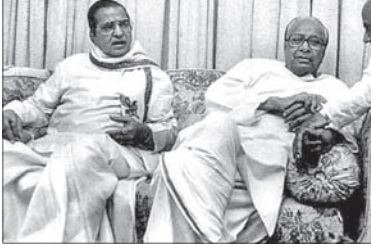
ଜାତୀୟସ୍ତରୀୟ ନେତା ଏନ୍.ଡି.ରାମାୟା, ଏ.ଏ.ଭି.ଦେବେନ୍ଦ୍ରଭୌଡ଼ା, ଜ୍ୟୋତି ବସୁ, ଏମ୍. କରୁଣାନିଧିଙ୍କ ଗହଣରେ ବିଜୁ ବାବୁ ।