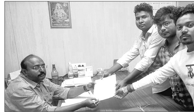
ପ୍ରତିନିଧିମଣ୍ଡଳ ନେତ୍ରୋ ଅଧୀକାରୀଙ୍କୁ ଭେଟିବା ପାଇଁ ପ୍ରସ୍ତୁତ ହୋଇଥିଲା।

ମୟୂରଭଞ୍ଜ ମୁକ୍ତିମୋର୍ଚ୍ଚା (ଏମ୍.ଏମ୍.ଏମ୍.) ସଂଗଠନ ପକ୍ଷରୁ ନେତ୍ରୋ ଅଧୀକାରୀଙ୍କୁ ସମ୍ମାନୀତ ଭାବେ ଭେଟିବା ପାଇଁ ପ୍ରସ୍ତୁତ ହୋଇଥିଲା।