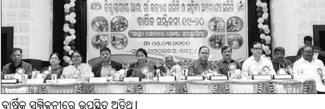
ବାର୍ଷିକ ସମିତିରେ ଉପସ୍ଥିତ ଅତିଥି।