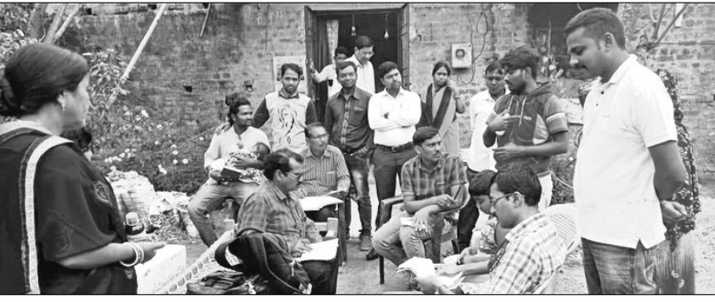
ଡାକ୍ତରୀ ଦଳ ଜଣିତ୍ୱ ଆକ୍ରାନ୍ତକ ସାମ୍ବାଦିନୀ ପ୍ରତିନିଧିମଣ୍ଡଳ।

ଡାକ୍ତରୀ, ୪୩ (ଡି.ଏନ୍.ଏ.): ମୟୂରଭଞ୍ଜ ଜିଲ୍ଲା ସମ୍ବଲପୁର ଥାନା ଅଧୀନ ଏକତାଳି ଗ୍ରାମରେ ବୁଧବାର ସକାଳେ ଭାଲୁ ଆକ୍ରମଣରେ ଜଣେ ବୃଦ୍ଧ ଗୁରୁତର ଆହତ ହୋଇଛନ୍ତି।