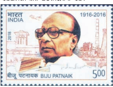
ବିଜୁ ବାବୁଙ୍କ ଉଦ୍ଦେଶ୍ୟରେ ପ୍ରଚଳିତ ପୋଷ୍ଟାଳ ଷ୍ଟାମ୍ପ ।