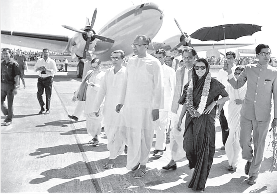
ପୂର୍ବତନ ପ୍ରଧାନମନ୍ତ୍ରୀ ଇନ୍ଦିରା ଗାନ୍ଧୀଙ୍କ ସହ ବିଜୁ ବାବୁ ।

ବିମାନ ଉଡ଼ାଣ ଶିକ୍ଷା ସମାପ୍ତ ପରେ ବିଜୁବାବୁ ଇଞ୍ଜିନିୟର ଏୟାରଫୋରସ୍ରେ ପାଇଲଟ ଭାବରେ ଚାକିରି କରିଥିଲେ । ଏକ ଘଡ଼ିସିଦ୍ଧି ମୁହୂର୍ତ୍ତରେ ସେ ନିଜ ବିମାନ ଚଳାଇ ଇଣ୍ଡୋନେସିଆର ରାଷ୍ଟ୍ରପତି, ଉପରାଷ୍ଟ୍ରପତି ଓ ପ୍ରଧାନମନ୍ତ୍ରୀଙ୍କୁ ଡରମାନଙ୍କଠାରୁ ଉଦ୍ଧାର କରିଥିଲେ । ଏହି ଦୁଃସାହସିକ କାର୍ଯ୍ୟ ପାଇଁ ତାଙ୍କୁ ଇଣ୍ଡୋନେସିଆର ସର୍ବୋଚ୍ଚ 'ଭୃମିପୁତ୍ର' ସମ୍ମାନରେ ସମ୍ମାନିତ କରାଯାଇଥିଲା ।