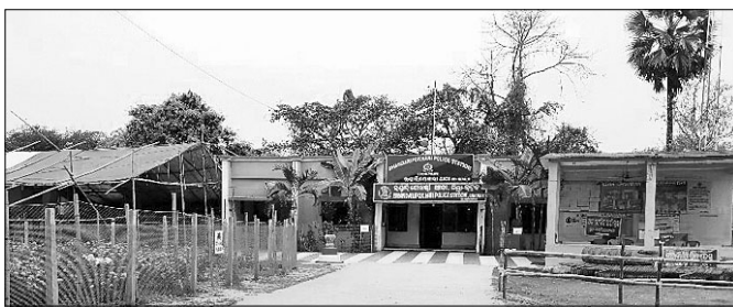
ମେଳଣ ପାଇଁ ସଜ୍ଜିତ ହୋଇଛି ଭଦ୍ରକପୋଖରୀ ଥାନା।