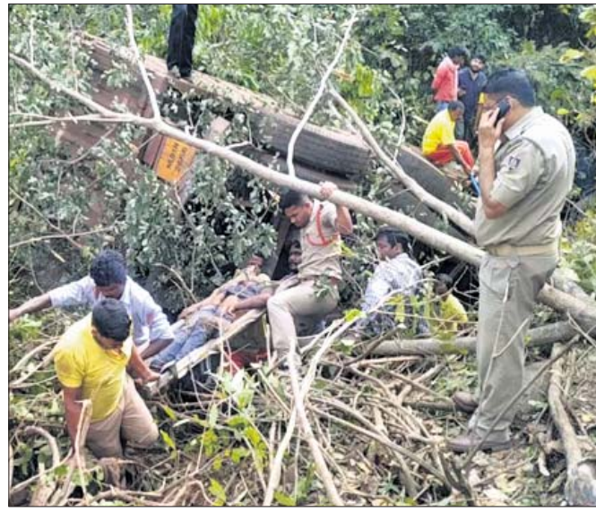
ଦୁର୍ଘଟଣା ପରେ ଓଲଟି ପଡ଼ିଥିବା ଟ୍ରକ ।

ବାଲିରିପୋଷି, ୪।୩(ଡି.ଏନ.ଏ.): ମୟୂରଭଞ୍ଜ ଜିଲ୍ଲା ବାଲିରିପୋଷି ଦେଇ ଯାଇଥିବା ୪୯୯. କାଟାୟ ରାଜପଥର ଦ୍ଵାରଶୁଣୀ ଘାଟିରେ ପୁଣି ଏକ ଦୁର୍ଘଟଣା ଘଟିଛି । ବୁଧବାର ଅପରାହ୍ନ ସାଢ଼େ ଗୋଟାଏ ବେଳେ ଏକ ଯାତ୍ରାବାହି ବସକୁ ଧକ୍କା ଦେଇ ଲୁହାପଥର ଗୁଡ଼ି ବୋଝେଇ ଟ୍ରକ ୫୦ ଫୁଟ ତଳକୁ ଓଲଟି ପଡ଼ିଛି । ଏହି ଦୁର୍ଘଟଣାରେ ୭ ଜଣ ଆହତ ହୋଇଥିବା ବେଳେ ସେମାନଙ୍କ ମଧ୍ୟରୁ ୨ ଜଣଙ୍କ ଅବସ୍ଥା ଗୁରୁତର ଥିବା ଜଣାପଡ଼ିଛି । ସୂଚନା ଅନୁଯାୟୀ, ବାରିପଦାରୁ ବାଦାମପାହାଡ଼ ଯାଉଥିବା ଯାତ୍ରାବାହି ବସ (ଓଡ଼ିଏ ୧ଆର-୫୧୦୩)କୁ ଘାଟିର ପ୍ରଥମ ବଙ୍କାଣିରେ ବିପରୀତ ଦିଗ ଯୋଡ଼ାରୁ ପଶ୍ଚିମବଙ୍ଗର ହଳଦିଆ ଅଭିମୁଖେ ଯାଉଥିବା ଟ୍ରକ (ଏଲ୦୧ଏନ-୨୬୬୭) ଧକ୍କାଦେଇ ରାସ୍ତାରୁ ୫୦ ଫୁଟ ଦୂର ଏକ ନାଳ ମଧ୍ୟକୁ ଓଲଟି ପଡ଼ିଥିଲା । ଖବର ପାଇ ବାଲିରିପୋଷି ଅଗ୍ନିଶମ ବିଭାଗ କର୍ମଚାରୀ ଏବଂ ପୋଲିସ୍