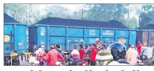
ଲେଭଲ କ୍ରସିଂ ନିକଟରେ ଇଞ୍ଜିନ୍ରୁ ବିଚ୍ଛିନ୍ନ ବଗି ଅଟକି ରହିଛି । ଯାତ୍ରା କରିଥିଲା । କେଉଁ କାରଣରୁ ଏଭଳି ଘଟଣା ଘଟିଲା ରେଳବାଇ ପ୍ରତ୍ନକୁ କୌଣସି ସୂଚନା ମିଳି ନାହିଁ । ଏହାର ତଦତ୍ତ କରାଯାଉଛି ବୋଲି କେବଳ ଷ୍ଟେଶନ ପକ୍ଷରୁ କୁହାଯାଇଛି । ଏଭଳି ଘଟଣା ଲାଗି ଡାଉନ୍ ଲାଇନ୍ରେ ଟ୍ରେନ୍ ଚଳାଚଳ ପ୍ରାୟ ୧ଘଣ୍ଟା ୨୦ ମିନିଟ୍ ଧରି ବନ୍ଦ ରହିଥିବା ଜଣାପଡ଼ିଛି ।

ପଛରେ ଲାଗିଥିବା କେବଳ ୩ଟି ବଗି ନେଇ ଇଞ୍ଜିନ୍ ପଲାଇ ଯାଇ ଷ୍ଟେଶନ ନିକଟରେ ଅଟକିଥିଲା । ଉକ୍ତ ମାଲବାହୀ ଟ୍ରେନର ବିଚ୍ଛିନ୍ନ ବଗିଗୁଡ଼ିକ କିଛି ଦୂର ଗଢ଼ି ଆସି ଦକ୍ଷିଣ କ୍ୟାବିନ୍ ନିକଟରେ ରହିଯିବାରୁ ଲେଭଲ କ୍ରସିଂ ବନ୍ଦ ହୋଇ ଯାଇଥିଲା । ଫଳରେ ରାସ୍ତାରେ ଶତାଧିକ ଗାଡ଼ିମୋଟର ଅଟକି ରହିଥିଲା । ଦୀର୍ଘ ଘଣ୍ଟାଏ ପରେ ରେଳବାଇ କର୍ମଚାରୀ ଇଞ୍ଜିନ୍କୁ ନେଇ ବଗି ସହିତ ଯୋଡ଼ିଥିଲେ । ଇଞ୍ଜିନ୍ ନେଇ ପଲାଇଥିବା ୩ଟି ବଗିକୁ ୪ନମ୍ବର ଲୁପ୍ ଲାଇନ୍ରେ ରଖି ଅନ୍ୟ ୫୫ଟି ବଗି ନେଇ ଟ୍ରେନ୍ଟି ସନ୍ଧ୍ୟା ୭ଟା ସମୟରେ ଗନ୍ତବ୍ୟସ୍ଥଳ ଅଭିମୁଖେ