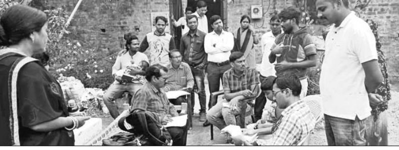
ଭାବୁରୀ ଦଳ ଜଣିତ୍ୱ ଆକ୍ରାନ୍ତକ ବାହାଣୀରୁ ପରୀକ୍ଷା କରୁଛନ୍ତି।