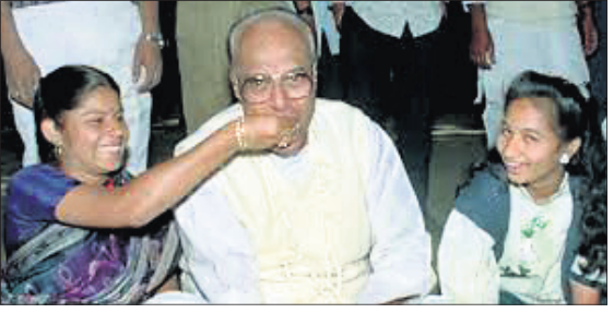
ଏକ ବିଶେଷ ମୁହୂର୍ତ୍ତରେ ବିଜୁ ପଟ୍ଟନାୟକ ।