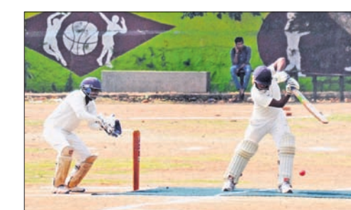
ଧନବାଦ୍ ସ୍ୱାର୍ସ ଦଳର ଖିଳାଳୀମାନଙ୍କ ଦ୍ୱାରା ଗଠିତ ଟିମ୍ ଖେଳ ଚଳୁଥିବା ଦିନ ବିଜୁ ପଟ୍ଟନାୟକ ମେମୋରିଆଲ କ୍ରିକେଟ ଟୁର୍ଣ୍ଣାମେଣ୍ଟର ପ୍ରଥମ ଦିନ ଚଳିଥିଲା।

ବିଜୁ ପଟ୍ଟନାୟକ ମେମୋରିଆଲ ଟୁର୍ଣ୍ଣାମେଣ୍ଟ ଧନବାଦ୍ ସ୍ୱାର୍ସ ଦଳ ୩୦.୪ ଓଭରରେ ୮ ରନରେ ହାରା ହେଇଥିଲା।