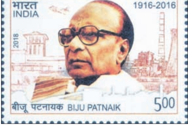
ବିଜୁ ବାବୁଙ୍କ ଉଦ୍ଦେଶ୍ୟରେ ପ୍ରଚଳିତ ପୋଷ୍ଟାଳ ଷ୍ଟାମ୍ପ।