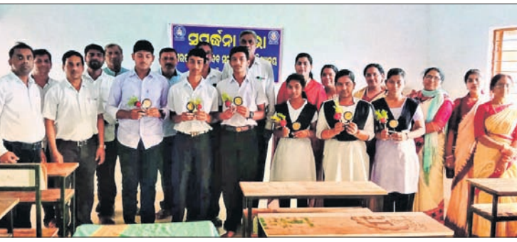
କୃତୀ ଛାତ୍ରାଛାତ୍ରୀଙ୍କୁ ସମର୍ଥନ କରାଯାଇଛି ।