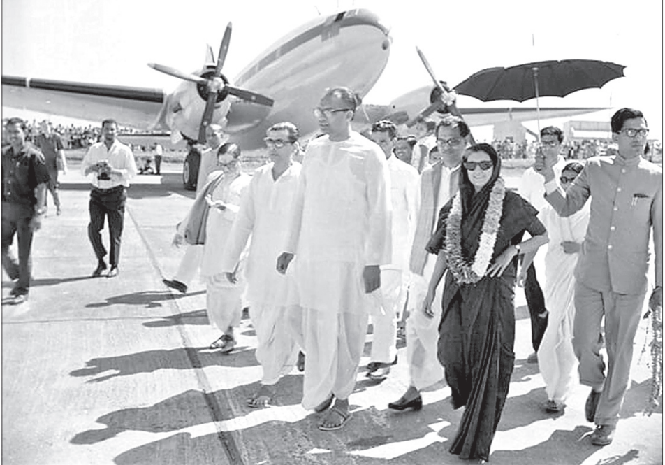
ପୂର୍ବତନ ପ୍ରଧାନମନ୍ତ୍ରୀ ଇନ୍ଦିରା ଗାନ୍ଧୀଙ୍କ ସହ ବିଜୁ ବାବୁ।

ବିମାନ ଉଡ଼ାଣ ଶିକ୍ଷା ସମାପ୍ତ ପରେ ବିଜୁବାବୁ ଇଞ୍ଜିନିୟର ଏୟାରଲେନ୍ଦ୍ରେ ପାଇଲଟ ଭାବରେ ଚାକିରି କରିଥିଲେ। ଏକ ଘଡ଼ିସିଦ୍ଧି ମୁହୂର୍ତ୍ତରେ ସେ ନିଜ ବିମାନ ଚଳାଇ ଇଣ୍ଡୋନେସିଆର ରାଷ୍ଟ୍ରପତି, ଉପରାଷ୍ଟ୍ରପତି ଓ ପ୍ରଧାନମନ୍ତ୍ରୀଙ୍କୁ ତତ୍ତ୍ୱାବଳୀତ ଭାବେ ଭେଟାଣି କରିଥିଲେ। ଏହି ଦୃଷ୍ଟିସାହସିକ କାର୍ଯ୍ୟ ପାଇଁ ତାଙ୍କୁ ଇଣ୍ଡୋନେସିଆର ସର୍ବୋଚ୍ଚ 'ଭୂମିପୁତ୍ର' ସମ୍ମାନରେ ସମ୍ମାନିତ କରାଯାଇଥିଲା।