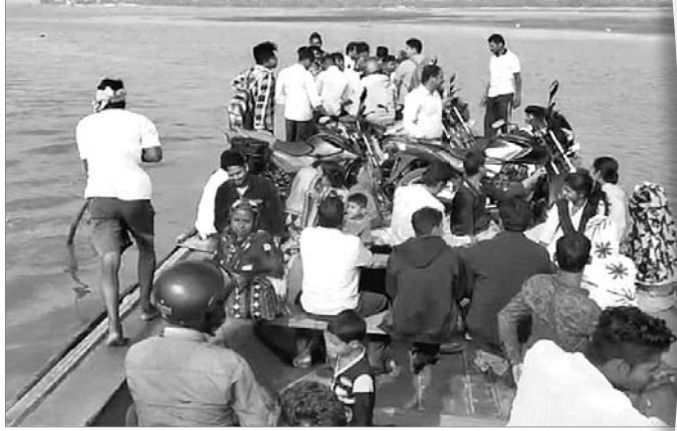
ଅନ୍ୟ ତଙ୍ଗାରେ ଯାତ୍ରୀମାନଙ୍କୁ ଗରବସ୍ଥଳକୁ ନିଆଯାଇଛି।

କୃଷ୍ଣପ୍ରସାଦ, ୪ମାର୍ଚ୍ଚ(ବି.ଏନ.ଏ.): ପୁରୀ ଜିଲ୍ଲା କୃଷ୍ଣପ୍ରସାଦ ବ୍ଲକର ଜନ୍ମଭୂମିଠାରୁ ସାତପଡ଼ା ଯାଉଥିବା ଯାତ୍ରୀବାହୀ ତଙ୍ଗା ଯାତ୍ରିକ ଛୁଟି ଯୋଗୁଁ ରୂପାୟନ ଟିଲିକା ମଝିରେ ଅଟକି ଯାଇଥିଲା। ସେଥିରେ ଯାଉଥିବା ୩୦ ଜଣ ଯୁକ୍ତ ୨ ପରୀକ୍ଷାର୍ଥୀଙ୍କ ସମେତ ପ୍ରାୟ ୭୦ ଯାତ୍ରୀ ୧ ଘଣ୍ଟା ଧରି ଜଳବନ୍ଦୀ ହୋଇ ରହିଥିଲେ। ଉକ୍ତ ତଙ୍ଗାରେ ୨୦ରୁ ଉର୍ଦ୍ଧ୍ୱ ମୋଟରଯାନକେଲ ମଧ୍ୟ ରହିଥିଲା। ତଙ୍ଗା ଗାଳକ ସାତପଡ଼ାକୁ ଚେଲିଫୋନ କରି ଅନ୍ୟ ତଙ୍ଗାଗାଳକଙ୍କୁ ଖବର ଦେବା ପରେ ଆଉ ଏକ ତଙ୍ଗା ଆସି ସମସ୍ତ ଯାତ୍ରୀଙ୍କୁ ଉଦ୍ଧାର କରିଥିଲା। ସୁରକ୍ଷିତ ଭାବେ ସାତପଡ଼ା କୁଳରେ ପହଞ୍ଚିଥିଲେ ସମସ୍ତ ଯାତ୍ରୀ। ପରୀକ୍ଷାରୁ ବଞ୍ଚିତ ହେବାକୁ ଅନୁକୂଳ ରକ୍ଷା ପାଇବାର ୩୦ ପରୀକ୍ଷାର୍ଥୀ।