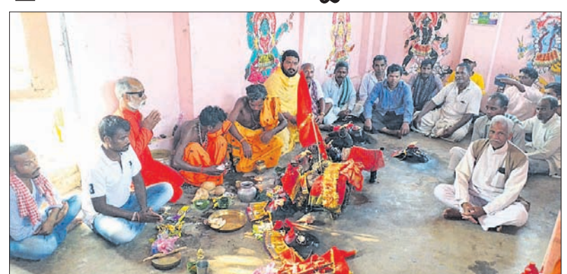
ପୀଠରେ ଆଦିବାସୀ କୁଳ ଉନ୍ନୟନ ସଂଘର ସଦସ୍ୟମାନେ।

ଦଶପଲ୍ଲୀ, ୪/୩(ଡି.ଏ.ଏ.)-ଦଶପଲ୍ଲୀ କୁଳୁବନଗଡ଼ରେ ହୋଇଥିବା ଐତିହାସିକ କଳ୍ପବୃକ୍ଷ ପ୍ରତିଷ୍ଠା ଦିବସ ରୂପେ କୁଳୁବନ ଗ୍ରାମ, ପାଳନ କରିଛନ୍ତି ଆଦିବାସୀ କୁଳ ଉନ୍ନୟନ ସଂଘର ସଦସ୍ୟମାନେ।