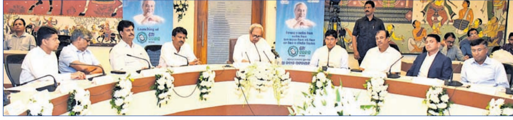
ମୋ ସରକାର କାର୍ଯ୍ୟକ୍ରମରେ ମୁଖ୍ୟମନ୍ତ୍ରୀ ନବୀନ ପଟ୍ଟନାୟକ ଓ ଅନ୍ୟମାନେ ।