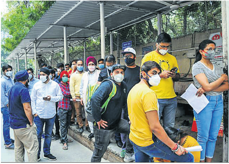
ନୂଆଦିଲ୍ଲୀରୁ ରାମ୍ ମନୋହର ଲୋହିଆ ହସ୍ତିଶାଳାରେ ଲୋକମାନେ ମାଝ ପିଠି ଖାଡ଼ିବେ ଛିଡ଼ା ହୋଇଛନ୍ତି।