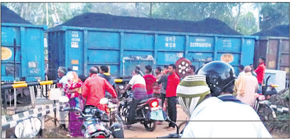
ଲେଭଲ କ୍ରସିଂ ନିକଟରେ ଇଞ୍ଜିନ୍‌ରୁ ବିଚ୍ଛିନ୍ନ ବଗି ଅଟକି ରହିଛି । ଷ୍ଟେଶନ ପକ୍ଷରୁ କୁହାଯାଇଛି । ଏଭଳି ଘଟଣା ଲାଗି ଡାଉନ୍ ଲାଇନ୍‌ରେ ଟ୍ରେନ୍ ଚଳାଚଳ ପ୍ରାୟ ୧ଘଣ୍ଟା ୨୦ ମିନିଟ୍ ଧରି ବନ୍ଦ ରହିଥିବା ଜଣାପଡ଼ିଛି ।

ବସ୍ତା,୪୩୩(ଡି.ଏନ.ଏ.) ଯାଉଥିବା ବେଳେ ବସ୍ତା ରେଳଷ୍ଟେଶନ ନିକଟରେ ଦକ୍ଷିଣ-ପୂର୍ବ ରେଳପଥର ବସ୍ତା ଷ୍ଟେଶନ ନିକଟରେ ବୁଧବାର ସନ୍ଧ୍ୟା ୫ଟା ୫୦ ମିନିଟ୍ ସମୟରେ ଏକ କୋଇଲା ବୋଝେଇ ଟ୍ରେନ ଦୁର୍ଘଟଣାରୁ ଅଳ୍ପକେ ବର୍ତ୍ତି ଯାଇଛି । କୋଇଲା ନେଇ ଯାଉଥିବା ଏହି ଟ୍ରେନ(ନଂ. ୩୨୪୨୧ )ରେ ମୋଟ ୫୮ଟି ବଗି ରହିଥିଲା । ଏହା ବାଲେଶ୍ୱରରୁ ଡାଉନ୍ ଲାଇନ୍‌ରେ ଜନେଶ୍ୱର ଯାଉଥିବା ବେଳେ ବସ୍ତା ରେଳଷ୍ଟେଶନ ନିକଟରେ ପହଞ୍ଚିବା ପୂର୍ବରୁ ଦକ୍ଷିଣ କ୍ୟାବିନ୍ ଠାରେ ହଠାତ୍ ଇଞ୍ଜିନ୍ ସହ ୩ଟି ବଗି ଅନ୍ୟ ବଗିଠାରୁ ଛିଣ୍ଡି ଅଲଗା ହୋଇଯାଇଥିଲା । ପଛରେ ଲାଗିଥିବା କେବଳ ୩ଟି ବଗି ନେଇ ଇଞ୍ଜିନ୍ ପକାଇ ଯାଇ ଷ୍ଟେଶନ ନିକଟରେ ଅଟକିଥିଲା । ଉକ୍ତ ମାଲବାହୀ ଟ୍ରେନର ବିଚ୍ଛିନ୍ନ ବଗିଗୁଡ଼ିକ କିଛି ଦୂର ଗଢ଼ି ଆସି ଦକ୍ଷିଣ କ୍ୟାବିନ୍ ନିକଟରେ ରହିଯିବାରୁ ଲେଭଲ କ୍ରସିଂ ବନ୍ଦ ହୋଇ ଯାଇଥିଲା । ଫଳରେ ରାସ୍ତାରେ ଶତାଧିକ ଗାଡ଼ିମୋଟର ଅଟକି ରହିଥିଲା । ଦୀର୍ଘ ଘଣ୍ଟାଏ ପରେ ରେଳବାଇ କର୍ମଚାରୀ ଇଞ୍ଜିନ୍‌କୁ ନେଇ ବଗି ସହିତ ଯୋଡ଼ିଥିଲେ । ଇଞ୍ଜିନ୍ ନେଇ ପକାଇଥିବା ୩ଟି ବଗିକୁ ୪ନମ୍ବର ଲୁପ୍ ଲାଇନ୍‌ରେ ରଖି ଅନ୍ୟ ୫୫ଟି ବଗି ନେଇ ଟ୍ରେନ୍‌ଟି ସନ୍ଧ୍ୟା ୭ଟା ସମୟରେ ଗଡ଼ବ୍ୟୟକ ଅଭିଯୁକ୍ତେ ଯାତ୍ରା କରିଥିଲା । କେଉଁ କାରଣରୁ ଏଭଳି ଘଟଣା ଘଟିଲା ରେଳବାଇ ସ୍ୱତ୍ତ୍ୱ କୌଶଳୀ ସୂଚନା ମିଳି ନାହିଁ । ଏହାର ତଦନ୍ତ କରାଯାଉଛି ବୋଲି କେବଳ ଘୋଷଣା କରାଯାଇଛି । ଏଭଳି ଘଟଣା ଲାଗି ଡାଉନ୍ ଲାଇନ୍‌ରେ ଟ୍ରେନ୍ ଚଳାଚଳ ପ୍ରାୟ ୧ଘଣ୍ଟା ୨୦ ମିନିଟ୍ ଧରି ବନ୍ଦ ରହିଥିବା ଜଣାପଡ଼ିଛି ।