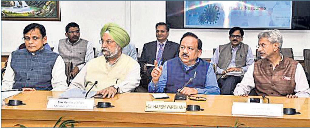
କରୋନା ଭାଇରସ୍ ସମ୍ପର୍କିତ ସମୀକ୍ଷା ବୈଠକରେ କେନ୍ଦ୍ର ସ୍ୱାସ୍ଥ୍ୟମନ୍ତ୍ରୀ ଡ. ହର୍ଷବର୍ଦ୍ଧନ ବିଜୟ ଅଧିକାରୀଙ୍କ ସହ ନୂଆଦିଲ୍ଲୀରେ ଆଲୋଚନା କରୁଛନ୍ତି। ନିକଟରେ ବହୁସଂଖ୍ୟାରେ ମୃତ୍ୟୁ ଏବଂ ଜନଶଙ୍କର ଉପସ୍ଥିତ ଅଛନ୍ତି।

ଭାରତରେ କରୋନା ଭାଇରସ୍ ଆକ୍ରାନ୍ତଙ୍କ ସଂଖ୍ୟା ବଡ଼ି ୨୮ ରେ ପହଞ୍ଚିଛି। ଏମାନଙ୍କ ମଧ୍ୟରେ ୧୬ ଜଣଙ୍କା ପର୍ଯ୍ୟଟକ ଅଛନ୍ତି ବୋଲି ସ୍ୱାସ୍ଥ୍ୟମନ୍ତ୍ରୀ ହର୍ଷବର୍ଦ୍ଧନ ରୁଧିରା ପ୍ରକାଶ କରିଛନ୍ତି। ବାହାର ଦେଶରୁ ଭାରତକୁ ଆସୁଥିବା ପ୍ରତ୍ୟେକ ଯାତ୍ରୀଙ୍କୁ ବିମାନବନ୍ଦରଗୁଡ଼ିକରେ କଡ଼ା ଯାଞ୍ଚ କରାଯାଇଥିବା ସେ କହିଛନ୍ତି। ଦିଲ୍ଲୀର ମୟୂରବିହାରରେ ଜଣେ ମୃତ୍ୟୁ (୪୫), ଆଗ୍ରାରେ ଥିବା ଡାକ୍ତର ୬ ସମ୍ପର୍କୀୟ କରୋନା ଭାଇରସ୍ରେ ଆକ୍ରାନ୍ତ ହେବା ପରେ ସେମାନଙ୍କୁ ସଫଟ୍ଟରୁଣ ହସ୍ତିଶାଳାରେ ଚିକିତ୍ସା କରାଯାଇଛି। ହାଇଦ୍ରାବାଦର ଜଣେ