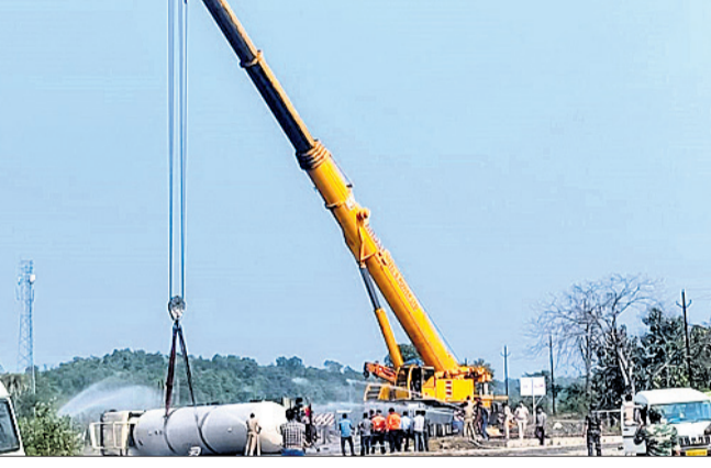
କ୍ରେନ୍ ଯୋଗେ ଟ୍ୟାଙ୍କ ଲିଫ୍ଟ ହେଉଥିବା ଟ୍ୟାଙ୍କରକୁ ରାଜପଥରୁ ହଟାଯାଇଛି ।

ଅନୁଗୋଳ ଜିଲ୍ଲା କିଶୋରନଗର ବୁକ୍ ହସ୍ତପା ଆନା କମରେଇ ନିକଟ ୫୫୮ମ. ଜାତୀୟ ରାଜପଥରେ ମଙ୍ଗଳବାର ଦୁର୍ଘଟଣାଗ୍ରସ୍ତ ଏକ ଟ୍ରାକ୍ଟର ଟ୍ୟାଙ୍କ ବୋମ୍ବେଇ ଟ୍ୟାଙ୍କରକୁ ଟ୍ୟାଙ୍କ ଲିଫ୍ଟ ନେଇ ଯେଉଁ ଆତଙ୍କ ସୃଷ୍ଟି ହୋଇଥିଲା ।