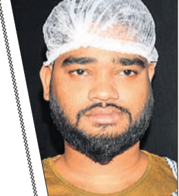
ସେଫ୍ ପୁଜିତ ଦେହୁରା