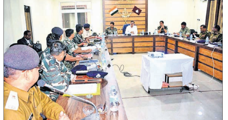
ଜିଲା ପୋଲିସ୍ କାର୍ଯ୍ୟାଳୟର ସମ୍ମିଳନୀ କକ୍ଷରେ ଅନୁଷ୍ଠିତ ବୈଠକରେ ଜାତୀୟ ସୁରକ୍ଷା ବରିଷ୍ଠ ପରାମର୍ଶଦାତା କେ. ବିଜୟ କୁମାର ସମୀକ୍ଷା କରୁଛନ୍ତି ।

■ ଭବାନୀପାଟଣାରେ ଜାତୀୟ ସୁରକ୍ଷା ବରିଷ୍ଠ ପରାମର୍ଶଦାତା କେ. ବିଜୟ କୁମାର ଭବାନୀପାଟଣା, ୪ମାର୍ଚ୍ଚ(ବି.ଏ.ଏ.)