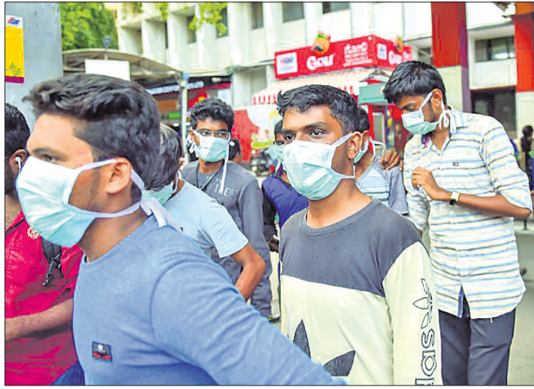
ବେଙ୍ଗାଳୁରୁ ସିଟି ରେଲୱେ ଷ୍ଟେଶନରେ ଛାତ୍ରମାନେ କରୋନା ସଂକ୍ରମଣ ଭୟରେ ମୁହଁରେ ମାଝ ବାନ୍ଧି ଯାଉଛନ୍ତି।