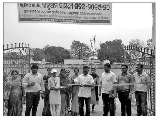
ବୁକସ୍ତରୀୟ ଭାଗ ଭୋଲ ଭିକ୍ଷକ ସାମର୍ଥ୍ୟ ଶିବିରକୁ ଅତିଥିମାନେ ଉଦ୍‌ଘାଟନ କରୁଛନ୍ତି ।