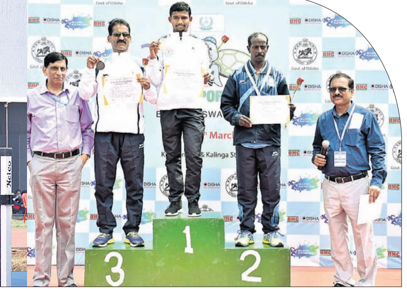
ସର୍ବଭାରତୀୟ ବନ ବିଭାଗ କ୍ରୀଡ଼ାର କଳିଙ୍ଗ ସ୍ଥଳରେ ରୂପକାର ଅନୁଷ୍ଠିତ ଶୁଟିଂ ଓ ମହିଳା ହାଲଜମ୍ପ ଅବସରରେ ପ୍ରତିଯୋଗୀମାନେ। ପୁରୁଷ ୫୦୦୦ ମିଟର ରେସ୍ କ୍ରୀଡ଼ା ପ୍ରତିଯୋଗୀଙ୍କୁ ପଦକ ପ୍ରଦାନ କରାଯାଇଛି।