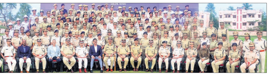
ସମ୍ମିଳନୀରେ ଚିକିତ୍ସିତ ଅଭୟଙ୍କ ସହ ବରିଷ୍ଠ ପୋଲିସ ଅଧିକାରୀ।

କଟକ ଅଫିସ, ୬୩୩: କଟକସ୍ଥିତ ଓଏସଏସି ସମ୍ପଦ ବାଟାଲିୟନ ପରିସରରେ ରାଜ୍ୟପ୍ରଭାସ ମହିଳା ପୋଲିସ ସମ୍ମିଳନୀ ଶୁକ୍ରବାର ଆରମ୍ଭ ହୋଇଯାଇଛି।