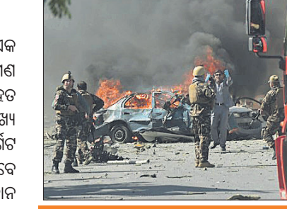
୨୯ ନିହତ, ବର୍ତ୍ତମାନେ ଅବ୍ଦୁଲ୍ଲା

ଆଫଗାନିସ୍ତାନ ରାଜଧାନୀ କାବୁଲରେ ଏକ ରାଜନୈତିକ ସଭା ଚାଲିଥିବାବେଳେ ଆକ୍ରମଣ ହୋଇଛି। ଏଥିରେ ଅନ୍ୟତମ ୨୯ ଜଣ ନିହତ ଓ ୩୦ ଆହତ ହୋଇଛନ୍ତି। ଦେଶର ମୁଖ୍ୟ କାର୍ଯ୍ୟନିର୍ବାହୀ ଅବ୍ଦୁଲ୍ଲା ଅବ୍ଦୁଲ୍ଲାଙ୍କୁ ଗର୍ଭେଷ୍ଟ କରି ଏହି ଗୁଳିକାଣ୍ଡ ଘଟାଯାଇଛି। ତେବେ ସେ ଏଥିରୁ ଅକ୍ଷତ ବର୍ତ୍ତିଯାଇଛନ୍ତି। ତାଲିବାନ ସହ ଆମେରିକାର ରୁକ୍ଷି ସ୍ୱାକ୍ଷର ପରେ ଏହା ହେଉଛି ସବୁଠାରୁ ବଡ଼ ଘାତକ ଆକ୍ରମଣ। ୧୯୯୫ରେ ଆଫଗାନିସ୍ତାନର ହେକଟ-ଲ ଓହ୍ଲେଟା ପାର୍ଟି ନେତା ଅବ୍ଦୁଲ୍ଲା ଅଲି ମଜାରିଙ୍କୁ ତାଲିବାନ ଆତଙ୍କବାଦୀମାନେ ହତ୍ୟା କରିଥିଲେ। ଶୁକ୍ରବାର କାବୁଲରେ ମଜାରିଙ୍କ ୨୫ତମ ଶ୍ରାଦ୍ଧ ଦିବସ ପାଳନ କରାଯାଇଥିଲା। ଏହି ସମାରୋହରେ ଆଫଗାନିସ୍ତାନର ଚିତ୍ ଅବ୍ଦୁଲ୍ଲାଙ୍କ ଉପରେ ଆକ୍ରମଣ ହୋଇଥିଲା। ଅବ୍ଦୁଲ୍ଲା, ପୂର୍ବତନ ରାଷ୍ଟ୍ରପତି ହମିଦ୍ କାର୍‌ଜାଇ, ହାଇ ପିସ୍ କାଉନ୍‌ସିଲ୍ ଅଧ୍ୟକ୍ଷ ମହମ୍ମଦ କରିମ ଖଲିଲି, ସେକେଣ୍ଡ ଡେପୁଟି ଚିତ୍ ଅବ୍ଦୁଲ୍ଲାଙ୍କେଟିକ୍ ମହମ୍ମଦ ମହମ୍ମଦଙ୍କ ସମେତ ଅନ୍ୟ କେତେଜଣ ରାଜନେତା ଏଥିରେ ସାମିଲ ଥିଲେ। ପୂର୍ବାହ ୧୧ଟା ୨୦ରେ ଖଲିଲି ଭାଷଣ ଦେଉଥିବାବେଳେ ସଭାସ୍ଥଳ ନିକଟ ଏକ ନିର୍ମାଣାଧୀନ କୋଠାରୁ ଜଣେ ବନ୍ଧୁକଧାରୀ ହଠାତ୍ ଗୁଳି ଚଳାଇଥିଲେ। ଏଥିରେ ୨୯ ଜଣଙ୍କ ମୃତ୍ୟୁ ଘଟିଥିବାବେଳେ ଅବ୍ଦୁଲ୍ଲା, କାର୍‌ଜାଇ ଓ ଖଲିଲି ସୁରକ୍ଷିତ ଭାବେ ଘରକୁ ଫେରିବାରେ ସକ୍ଷମ ହୋଇଥିଲେ। ତାଲିବାନ ମୁଖପାତ୍ର ଜବିହୁଲ୍ଲା ମୁଜାହିଦ୍ ଏକ ବିବୃତିରେ