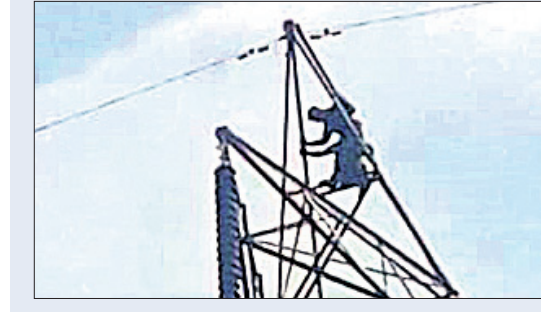
କାମାକ୍ଷାନଗର, ୬ମାର୍ଚ୍ଚ (ପି.ବି.ଏ.)