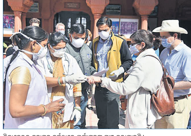
ବିକାନେରର ଜୁନାଗଡ଼ ଦୁର୍ଗଠାରେ ପର୍ଯ୍ୟଟକଙ୍କୁ ଯାଞ୍ଚ କରାଯାଇଛି।

ଦିଲ୍ଲୀରେ ଆଉଜଣେ ବ୍ୟକ୍ତିଙ୍କଠାରେ କରୋନା ଭୂତାଣୁ ଥିବା ଜଣାପଡିବା ପରେ ଦେଶରେ ମୋଟ ସଂକ୍ରମିତଙ୍କ ସଂଖ୍ୟା ୩୧ରେ ପହଞ୍ଚିଛି। ଦିଲ୍ଲୀରେ ଏହା ଦ୍ୱିତୀୟ ସଂକ୍ରମଣ। କରୋନା ପଜିଟିଭ୍ ଟିକ୍ସଟ ହୋଇଥିବା ଉଚ୍ଚ ବ୍ୟକ୍ତି ପୂର୍ବରୁ ଆଇଲାଣ୍ଡ ଓ ମାଲେସିଆ