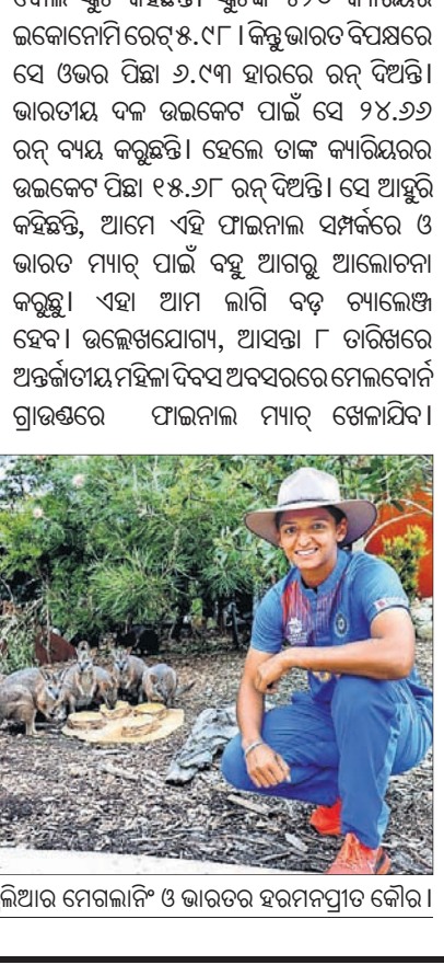
ଦୁଇଦଳର ଅଧିନାୟକ ଅଷ୍ଟ୍ରେଲିଆର ମେଗଲିନି ଓ ଭାରତର ହରମନପ୍ରୀତ କୌର ।

ମେଲବୋର୍ନ୍, ୬ମାର୍ଚ୍ଚ ବହୁ ପ୍ରତୀକ୍ଷିତ ମହିଳା ବିଶ୍ୱକପ୍ ସେମିଫାଇନାଲ ପୂର୍ବରୁ ଅଷ୍ଟ୍ରେଲିଆ ଦଳର ମୁଖ୍ୟ ପେସର ମେଗନ ସ୍କୋଟ୍ ଭାରତୀୟ ବ୍ୟାଟ୍ସମେନଙ୍କ ପ୍ରତି ଭୟ ଥିବା ସ୍ୱାଭାବ କରିଛନ୍ତି । ସେ ମୁଖ୍ୟତଃ ଶେଫାଳି ଦୀର୍ଘ ଓ ଓପନର ସ୍ମୃତି ମହାନଙ୍କୁ ବୋଲି କରିବାକୁ ଚାହୁଁ ନାହାନ୍ତି । ଦୁଇଟି ପ୍ରଥମ ଓଭରରୁ ହିଁ ଆଗାକି ଶର୍ତ୍ତ ଖେଳନ୍ତି, ଯାହାକି ବିଶ୍ୱକପ୍ ପୂର୍ବରୁ ଅନୁଷ୍ଠିତ ଡ୍ରୋଷ୍ଟା ସିରିଜ୍ରେ ଦେଖିବାକୁ ମିଳିଥିଲା । ଏଥିସହ ଦୁଇଟି ଅଷ୍ଟ୍ରେଲିଆ ବିପକ୍ଷ ଲିଗ୍ ମ୍ୟାଚ୍ରେ ପ୍ରଥମ ଓଭରରେ ସ୍କୋଟ୍ ୧୭ ରନ୍ ଆଦାନ କରିଥିଲେ । ପୂର୍ଣ୍ଣ ଭାରତ ବିପକ୍ଷରେ ଖେଳିବାକୁ ସ୍ଥଗା କରୁଛି । ସେମାନେ ମୋ ବିପକ୍ଷରେ ଅତ୍ୟଧିକ ଆକ୍ରମଣ କରନ୍ତି । ମୁଖ୍ୟତଃ ସ୍ମୃତି ଓ ଶେଫାଳି ଡ୍ରୋଷ୍ଟା ସିରିଜ୍ରେ ବୋଲି ମୋତେ ସ୍କ୍ୱେକ୍ ବଡ଼ ଛକା ମାରିଥିଲେ । ମୋତେ ଏତେ ବଡ଼ ଛକା କେହି ମାରି ନ ଥିଲେ । ପାଞ୍ଚର ଘେ ଚେକେ ପୂର୍ଣ୍ଣ ସେମାନଙ୍କୁ ବୋଲି କରିବାକୁ ଚାହେଁ ନାହିଁ । ସେମାନେ ମୋତେ ସହଜରେ ଖେଳନ୍ତି । କିନ୍ତୁ ଫାଇନାଲରେ