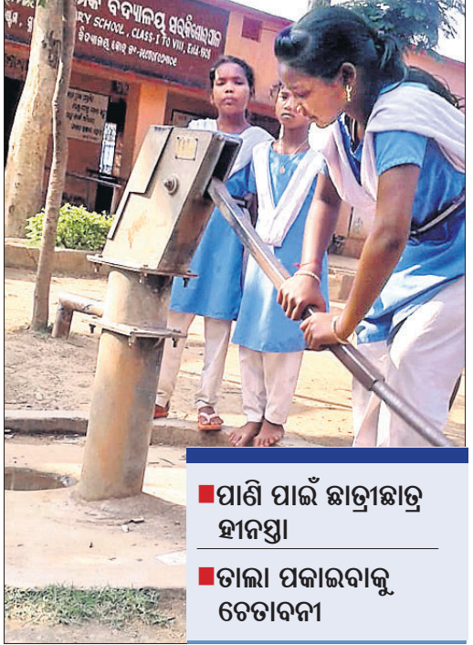
ଅଟଳ ହୋଇପଡ଼ିଥିବା ନଳକୂପ।