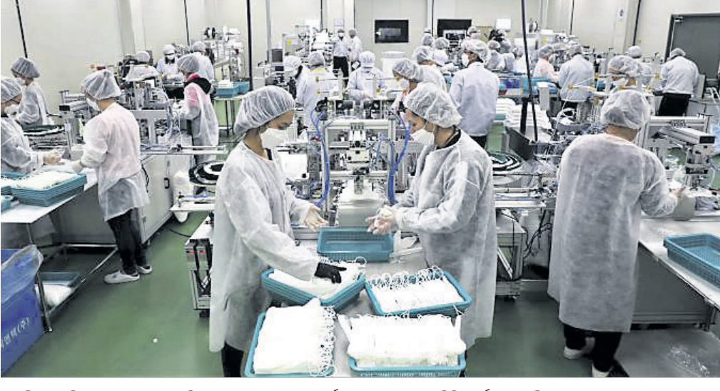
ଦକ୍ଷିଣକୋରିଆର ପୋଆଙ୍ଗଟେକ୍ସ୍ଟିଏଟ୍ ଏକ କାରଖାନାରେ କର୍ମଚାରୀମାନେ ମାସ୍କ ପିନ୍ଧି କାର୍ଯ୍ୟ କରୁଛନ୍ତି।

ବ୍ୟାକ୍ଟି, ୬୩୩ ନୋଭେଲ କରୋନା ଭୂତାଣୁ ବାରା ସଂକ୍ରମିତ ରୋଗୀସଂଖ୍ୟା ଶୁକ୍ରବାର ଲକ୍ଷେ ଚପିଛି। ଏହାକୁ ନେଇ ସାରା ବିଶ୍ୱରେ ଆତଙ୍କର ବାତାବରଣ ସୃଷ୍ଟି ହୋଇଛି। ଏହାର ପ୍ରଭାବରେ ଖାଲିସ୍ଥିତରେ କାରବାର ମାନ୍ୟ ହେବା ସହିତ ଏସିଆ ଓ ଯୁରୋପୀୟ ଶେୟାର ବଜାର ନିମ୍ନଗାମୀ ହୋଇଛି। ବିଭିନ୍ନ ଦେଶ ଭିତ୍ତୀ କଟକଣା ଲଗାଇବା ଫଳରେ ଅର୍ଥନୀତି ଗୁରୁତର ପ୍ରଭାବିତ ହୋଇଛି। ପର୍ଯ୍ୟଟନ ଓ ହୋଟେଲ ଶିଳ୍ପ ଉପରେ ଏହାର ଅଧିକ