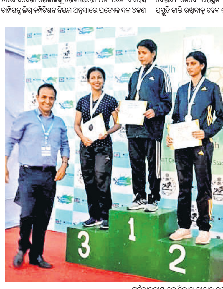
ସର୍ବଭାରତୀୟ ବନ ବିଭାଗ କ୍ରୀଡ଼ା ଚଳୁଥିବା ଦିନରେ କ୍ରୀଡ଼ା ପ୍ରତିଯୋଗୀଙ୍କୁ ପୁରସ୍କୃତ କରାଯାଇଛି ।