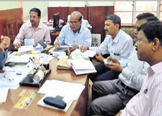
ଦୈନିକରେ ମନ୍ତ୍ରୀ ସମୀର ରଞ୍ଜନ ଦାଶ ଏବଂ ଅନ୍ୟ ବରିଷ୍ଠ ଅଧିକାରୀମାନେ।

ଭୁବନେଶ୍ୱର, ୬୩୩(ବୁଧବେଳା): ପାଠ୍ୟପୁସ୍ତକ ପ୍ରସ୍ତୁତ ଓ ବିତରଣ ସମୟରେ ଦୈନିକ ଶୁକ୍ରବାର ବିଦ୍ୟାଳୟ ଓ ଗଣଶିକ୍ଷା ମନ୍ତ୍ରୀ ସମୀର ରଞ୍ଜନ ଦାଶଙ୍କ ଅଧ୍ୟକ୍ଷତାରେ ଅନୁଷ୍ଠିତ ହୋଇଯାଇଛି।