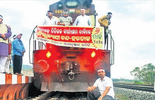
ନୟାଗଡ଼ ଷ୍ଟେସନଠାରେ ସେବା ଏକ୍ସପ୍ରେସ୍ ଉପକାରୀ।

ନୟାଗଡ଼ ଅଫିସ, ୬୩୩: ଭିଜିଲାନ୍ସ ଏକମାତ୍ର କୃଷିଭିଜିକ ଶିଳ୍ପ ଚିନିକଳ ପୁନଃ ଚାଲୁ କରିବା ଦାବିରେ ଶୁକ୍ରବାର ନୟାଗଡ଼ ବନ୍ଦ ପାଳନ କରାଯାଇଛି।