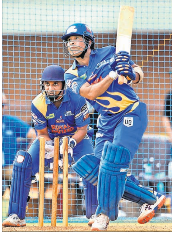
ଶୁକ୍ରବାର ନେଟ୍‌ରେ ବୋଲିଂ ଅବସରରେ ଫ୍ଲେକ୍ସିବଲ୍‌ର ତିନୋ ବେଷ୍ଟ । ଭାରତର ସଚିନ ଟେଣ୍ଡୁଲକରଙ୍କ ବ୍ୟାଟ୍ ଅଭ୍ୟାସ ।