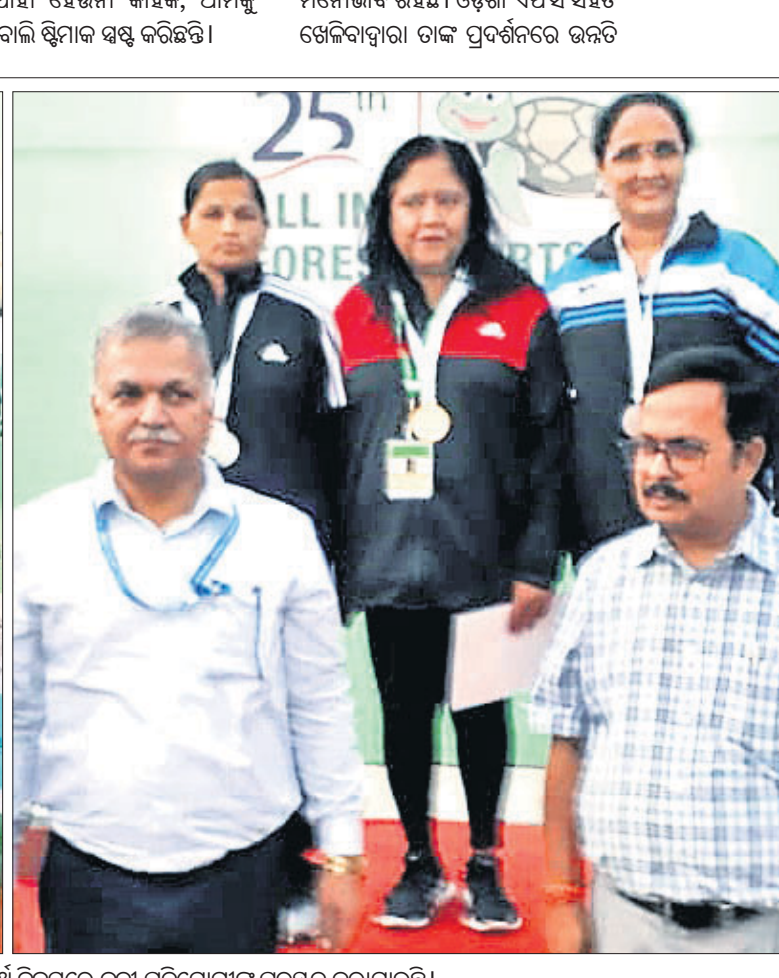
ସର୍ବଭାରତୀୟ ବନ ବିଭାଗ କ୍ରୀଡ଼ା ଚଳୁଥିବା ଦିନରେ କ୍ରୀଡ଼ା ପ୍ରତିଯୋଗୀଙ୍କୁ ପୁରସ୍କୃତ କରାଯାଇଛି ।