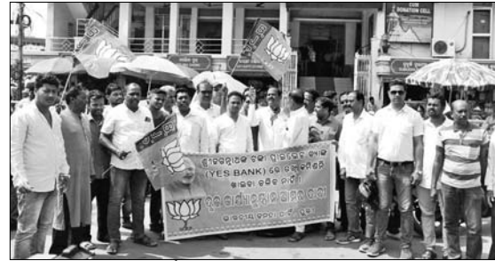
ଶ୍ରୀମନ୍ଦିର ପ୍ରଶାସନ କାର୍ଯ୍ୟାଳୟ ସମ୍ମୁଖରେ ଭାଜପା ପକ୍ଷରୁ ବିରୋଧ ।