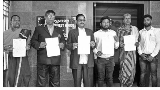
ଭିଜିଲାନ୍ସ ଅଫିସର ଦାବିପତ୍ର ଦେବା ପାଇଁ ଆସିଥିବା ଶ୍ରୀଜଗନ୍ନାଥ ସେନାର ସଦସ୍ୟ ।