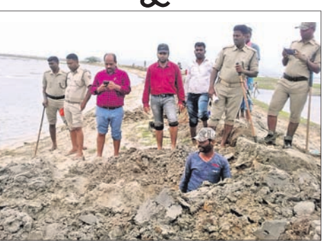
ଚିଲିକାରୁ ମାଟି ବେଆଇନ ଘେରି ଉଚ୍ଛେଦ କରାଯାଉଛି।

କୃଷ୍ଣପ୍ରସାଦ, ୭ମାର୍ଚ୍ଚ(ବି.ଏନ୍.ଏ.) ପୁରୀ ଜିଲ୍ଲା କୃଷ୍ଣପ୍ରସାଦ ତହସିଲ ଆଧୀନ ଚିଲିକାରୁ ଲିମ୍ବାପାଳଙ୍କ ନିର୍ଦ୍ଦେଶକ୍ରମେ ବେଆଇନ ଘେରି ଉଚ୍ଛେଦ କାର୍ଯ୍ୟ ଶନିବାର ଠାରୁ ଆରମ୍ଭ ହୋଇଛି।