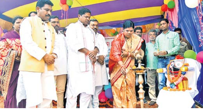
କାର୍ଯ୍ୟକ୍ରମକୁ ଅଭିମୁଖେ ଉଦ୍ଘାଟନ କରୁଛନ୍ତି ।