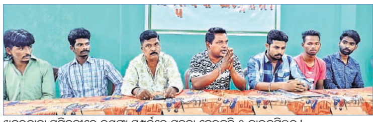
ଖବରଦାତା ସମ୍ପର୍କରେ ଇସ୍ତଫା ସମ୍ପର୍କରେ ସୂଚନା ଦେଇଛନ୍ତି ୨ କାଉନସିଲର ।