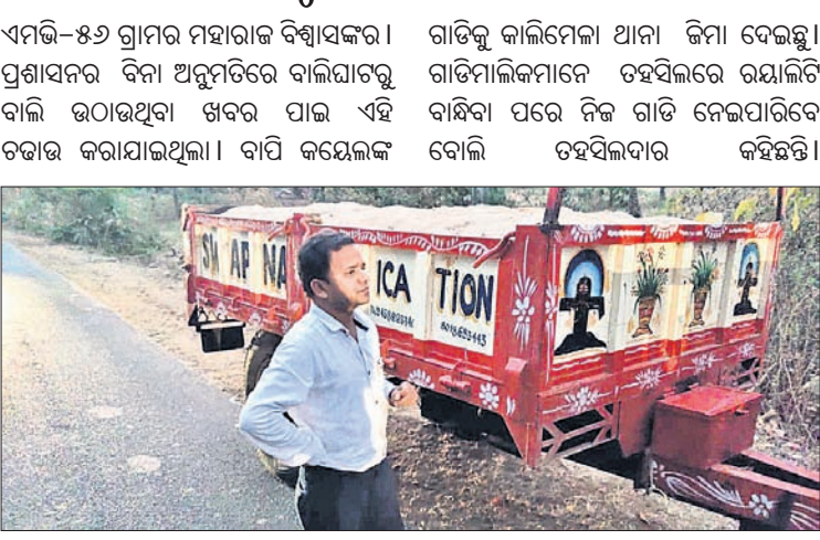
ଜବତ ବାଲି ବୋହେଇ ଟ୍ରାକ୍ଟର ।

ଗାଡ଼ିକୁ କାଳିମେଳା ଥାନା ଜିମା ଦେଇଛି। ଗାଡ଼ିମାଲିକମାନେ ତହସିଲରେ ରୟାଲିଟି ବାନ୍ଧିବା ପରେ ନିଜ ଗାଡ଼ି ନେଇପାରିବେ ବୋଲି ତହସିଲଦାର କହିଛନ୍ତି।