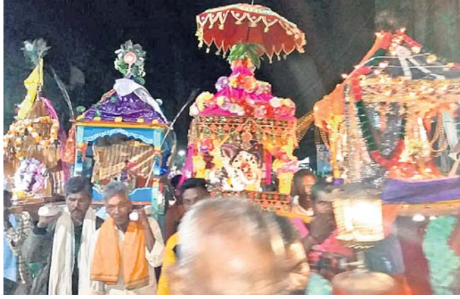
ବିମାନଗୁଡ଼ିକ ସହର ପରିକ୍ରମା କରୁଛି ।

କରୁଛି । ଦଶମୀ ଠାରୁ ତ୍ରୟୋଦଶୀ ପର୍ଯ୍ୟନ୍ତ ବିମାନଗୁଡ଼ିକ ସହର ପରିକ୍ରମା