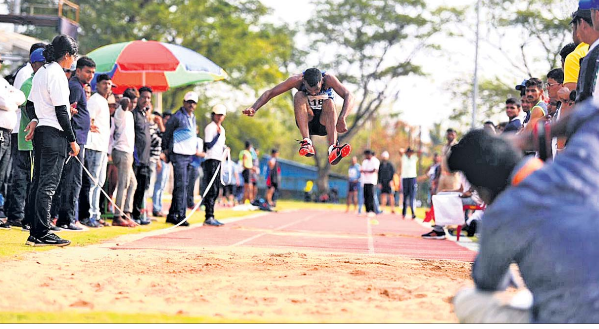
ସର୍ବଭାରତୀୟ ବନ ବିଭାଗ କ୍ରୀଡ଼ାରେ ଶନିବାର ଲଙ୍ଗଜମ୍ପ ଅବସରରେ ଜଣେ ପ୍ରତିଯୋଗୀ ।

ସିଲହେଟ୍, ୭ମା: ବର୍ଷା ବାଧାପ୍ରାପ୍ତ ଜିମ୍ବାୱେ ବିପକ୍ଷ ତୃତୀୟ ଦିନିକିଆ ମ୍ୟାଚ୍‌ରେ ଘରୋଇ ବାଂଲାଦେଶ ତକ୍‌ସ୍ତ୍ରୀ/ଲୁଲ୍‌ସ୍ ନିୟମରେ ୧୨୩ ରନରେ ବିଜୟ ହୋଇଛି । ଟପ୍ ହାର୍ଡି ବାଂଲାଦେଶ ପ୍ରଥମେ ବ୍ୟାଟିଂ କରି ୪୩ ଓଭରରେ ୩ ଉଇକେଟ୍ ହରାଇ ୩୨୨ ରନ ସଂଗ୍ରହ କରିଥିଲା । ପୁଣି ବର୍ଷା ଯୋଗୁ ମ୍ୟାଚ୍ ବାଧାପ୍ରାପ୍ତ ହେବା କାରଣରୁ ଜିମ୍ବାୱେ ସମ୍ପୂର୍ଣ୍ଣରେ ସମାନ ୪୩ ଓଭରରେ ୩୪୨ ରନର ବିଜୟ ଲକ୍ଷ୍ୟ ଧାର୍ଯ୍ୟ ହୋଇଥିଲା ।