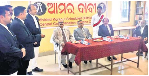
ଜଷ୍ଟିସ ଓ ଅନ୍ୟମାନେ ।

ବିମଳଚନ୍ଦ୍ର ରାୟ ଏବଂ ଅନ୍ୟ ଜଜ୍ଙ୍କ ସହିତ ଜଷ୍ଟିସ ଆଲୋଚନା କରିଥିଲେ । ଏଥିସହ ବିଭିନ୍ନ ମାମଲା ଏବଂ କାର୍ଯ୍ୟର