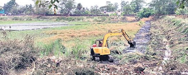
କେସିବି ସାହାଯ୍ୟରେ ପୋଖରୀକୁ ସଫା କରାଯାଇଛି ।