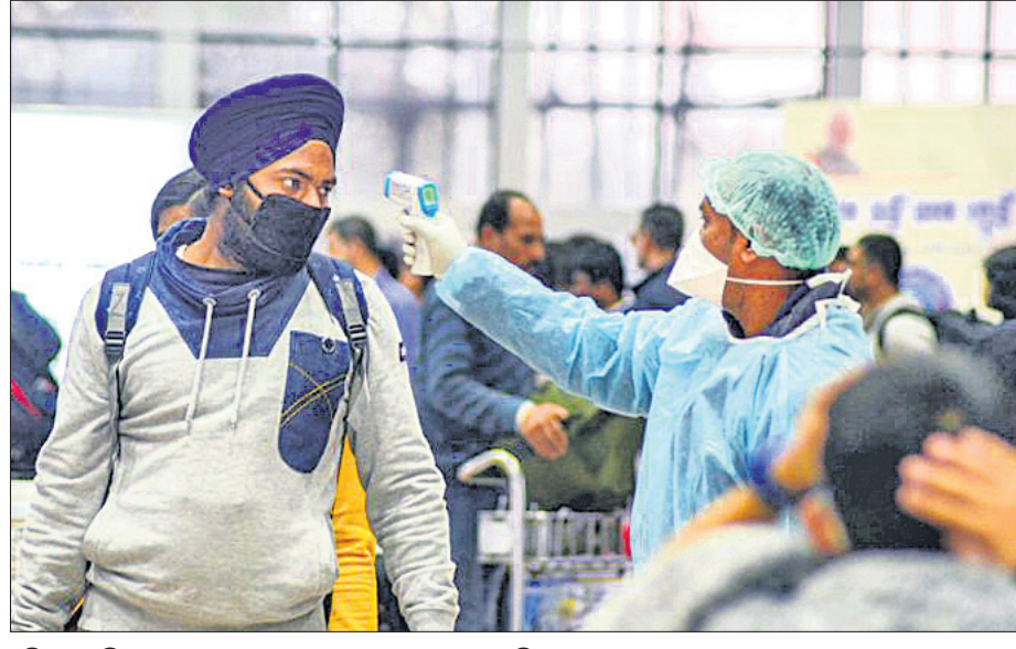
ଦିବୁଗଡ଼ ବିମାନବନ୍ଦରରେ ଯାତ୍ରୀମାନଙ୍କୁ ଯାଞ୍ଚ କରାଯାଉଛି ।