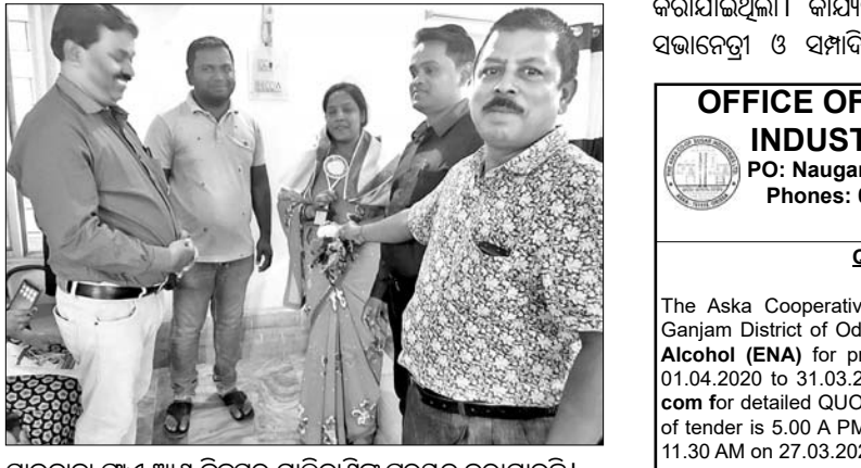
ସାଇବାବା ପ୍ଲାଏ ଆଶ ଟ୍ରିକ୍ସର ମାଲିକାଣିକୁ ପୁରସ୍କୃତ କରାଯାଇଛି।