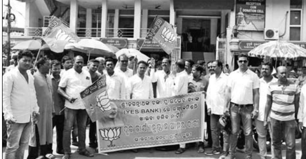
ଶ୍ରୀମନ୍ଦିର ପ୍ରଶାସନ କାର୍ଯ୍ୟାଳୟ ସମ୍ମୁଖରେ ଭାଜପା ପକ୍ଷରୁ ବିକ୍ଷୋଭ।