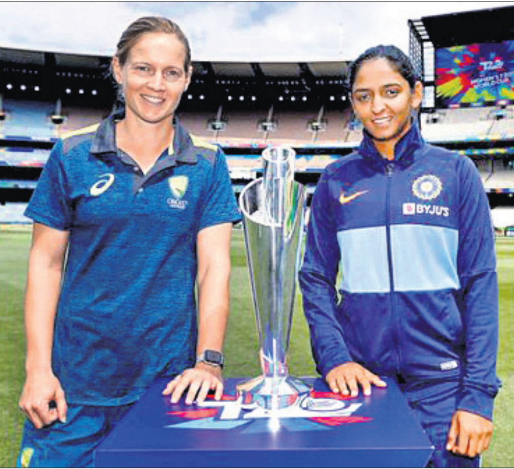
ଗ୍ରୁପ୍ ସହ ଅଷ୍ଟ୍ରେଲିଆ ଅଧିନାୟିକା ମେଗ୍ ଲାନିଂ ଓ ଭାରତର ହରମନପ୍ରୀତ କୌର।

ଅଷ୍ଟ୍ରେଲିଆରେ ଚାଲିଥିବା ମହିଳା ଟି୨୦ ବିଶ୍ୱକପ୍‌ର ସପ୍ତମ ସଂଘରଣ ଅନ୍ତିମ ପର୍ଯ୍ୟାୟରେ ପହଞ୍ଚିଛି। ରବିବାର ମେଲବୋର୍ନ କ୍ରିକେଟ ଗ୍ରାଉଣ୍ଡରେ ଫାଇନାଲ ମ୍ୟାଚ୍ ଆୟୋଜନ ହେବ। ଚାଇନା ପାଇଁ ଫାଇନାଲରେ ଗତଥର ଭାରତୀୟ ଟୀମ୍ ଆୟୋଜକ ଅଷ୍ଟ୍ରେଲିଆ ଓ ଭାରତ ମୁହାଁମୁହିଁ ହେବେ। ପ୍ରଥମଥର ପାଇଁ ବିଶ୍ୱକପ୍ ଚାମ୍ପିୟନ ହେବାର ସୁଯୋଗ ପାଇଛି ଭାରତ। ଅନ୍ୟପକ୍ଷେ ଧର୍ମ୍ୟ ଚାଇନା ହାସଲ କରିସାରିଥିବା ଅଷ୍ଟ୍ରେଲିଆ ଏଠାରେ ବିଜୟୀ ହୋଇ ପ୍ରଥମଥର ପାଇଁ ଚାମ୍ପିୟନ ହେବା ଲକ୍ଷ୍ୟରେ ରହିଛି। ଘରୋଇ ପରିବେଶରେ ରେକର୍ଡ ସଂଖ୍ୟକ ଦର୍ଶକଙ୍କ ସାମ୍ନାରେ ଅଷ୍ଟ୍ରେଲିଆକୁ ହରାଇବା ଭାରତ ପାଇଁ ନିଶ୍ଚିତ ଭାବେ ଏକ ବଡ଼ ଚ୍ୟାଲେଞ୍ଜ। ଅପରାଜିତ ରହିବା ସହ ଭାରତ ଗ୍ରୁପ୍ ଏଂର ଶୀର୍ଷରେ ରହି ସେମିଫାଇନାଲରେ ପ୍ରବେଶ କରିଥିଲା। ଚୁନାମଣ୍ଡଳ ଉଦ୍‌ଯାତନା ମ୍ୟାଚ୍‌ରେ ଭାରତ ଅଷ୍ଟ୍ରେଲିଆକୁ ହରାଇ ବିଜୟ ଅଭିଯାନ ଆରମ୍ଭ କରିଥିଲା। ଇଂଲଣ୍ଡ ବିପକ୍ଷ ସେମିଫାଇନାଲ ବର୍ଷା ଯୋଗୁ ବାତିଲ ହେବା ଫଳରେ ଗ୍ରୁପ୍ ଚମ୍ପିୟନ ହୋଇଥିବାରୁ ଭାରତ ପ୍ରଥମଥର ପାଇଁ ଫାଇନାଲକୁ ଉଠିଥିଲା। ସେହିପରି ବର୍ଷା ବାଧାପ୍ରାପ୍ତ ଦ୍ୱିତୀୟ ସେମିଫାଇନାଲରେ ଅଷ୍ଟ୍ରେଲିଆ ପ୍ରତିପକ୍ଷ ଦକ୍ଷିଣ ଆଫ୍ରିକାକୁ ହରାଇ କ୍ରମାଗତ ଷଷ୍ଠଥର ପାଇଁ ଫାଇନାଲରେ ପ୍ରବେଶ କରିଥିଲା। ୧୬ ବର୍ଷୀୟା ବିଶ୍ୱୋରକ ଓପନର ଶେଫାଳି ବର୍ମାଙ୍କ ଜବାବଦ୍ରୁ ବ୍ୟାଟିଂ ଓ ସ୍ଟ୍ରିକମାନଙ୍କ ଦ୍ୱାରା ପ୍ରବର୍ତ୍ତନ ଭାରତକୁ ଚଳିତ ବିଶ୍ୱକପ୍‌ରେ ବେଶ୍ ସଫଳ କରାଇଛି। କିନ୍ତୁ ଦୁଇ ଚାରିକା ବ୍ୟାଟ୍‌ସମ୍ୟାନ ସ୍କଟ୍ ମାନ୍‌ସା ଓ ହରମନପ୍ରୀତ କୌର ଏପର୍ଯ୍ୟନ୍ତ ଚମକ ଦେଖାଇପାରିନାହାନ୍ତି। ତେବେ ଫାଇନାଲ ମ୍ୟାଚ୍‌ରେ ଏହି ଦୁଇ ଅଭିଜ୍ଞ ଖେଳାଳିଙ୍କୁ ନିଜ ଦକ୍ଷତା ଅନୁଭୂତ ଖେଳିବାକୁ ପଡିବ। ଭାରତ ଚାଇନାକୁ ହାସଲ କରିବାକୁ ହେଲେ ଏହି ଦୁଇ ଖେଳାଳି ଉପଯୋଗୀ ଭୂମିକା ଖେଳିବା ଜରୁରୀ ହୋଇପଡିବ। ଏଥିପ୍ରତି ଭାରତକୁ ଚା'ର ମିଡ଼ଲ ଅର୍ଡର