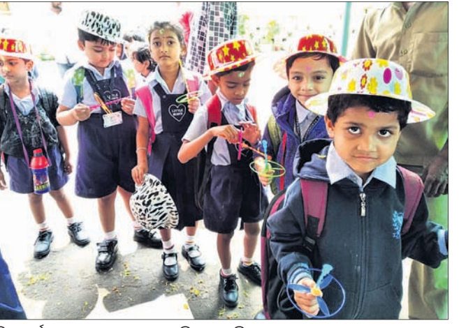
ଲିଟିଲ ହାର୍ଟରେ ଛାତ୍ରଛାତ୍ରୀମାନେ ହୋଲି ଖେଳୁଛନ୍ତି।

ଅନୁଗୋଳ ଶିମିଳିପଡ଼ାସ୍ଥିତ ଲିଟିଲ ହାର୍ଟ ଉପସଭାରେ ଲିଟିଲ ହାର୍ଟର ହୋଲି ପାଳନ କରାଯାଇଥିଲା।