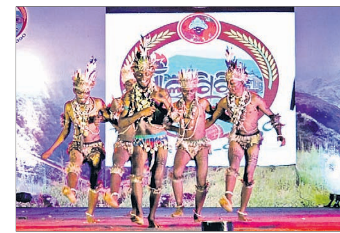
ମାଳ୍ୟଗିରି ମହୋତ୍ସବର ତୃତୀୟ ସମ୍ପାଦନାରେ ଲୋକନୃତ୍ୟ ପରିବେଷଣା।

ଅନୁଗୋଳ କିଲି ପାଳଲକ୍ଷ୍ମୀ ଉପସଭାରେ ମାନ ଛୁଇଁଲା ନୃତ୍ୟ ପରିବେଷଣା କରାଯାଇଥିଲା।