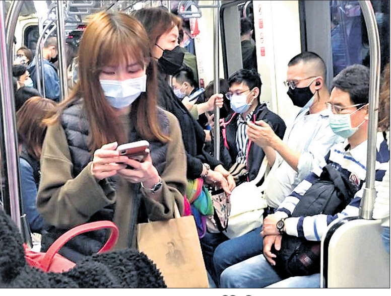
ତାଇପେଇଠାରେ କରୋନା ଭୟରେ ଯାତ୍ରୀମାନେ ମାସ୍କ ପିନ୍ଧିଛନ୍ତି ।