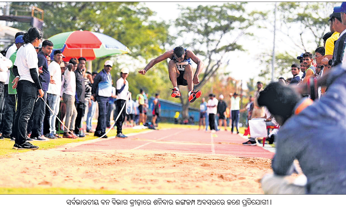
ସର୍ବଭାରତୀୟ ବନ ବିଭାଗ କ୍ରୀଡ଼ାରେ ଶନିବାର ଲଙ୍ଗକମ୍ପ ଅବସରରେ ଜଣେ ପ୍ରତିଯୋଗୀ ।

ଭୁବନେଶ୍ଵର, ୭ମା (ସ୍ପୋର୍ଟ୍‌ସ୍ ଟ୍ୟୁଭୋ): ଭୁବନେଶ୍ଵରରେ ଚାଲିଥିବା ସର୍ବଭାରତୀୟ ବନ ବିଭାଗ କ୍ରୀଡ଼ା ୨୫ତମ ସଂସ୍କରଣ ଶନିବାର ଉଦ୍‌ଯାପିତ ହୋଇଯାଇଛି । କିନ୍ତୁ ବିଶ୍ଵବିଦ୍ୟାଳୟ ପରିସରରେ ଗତ ୩ ତାରିଖରୁ ଏହି ପ୍ରତିଯୋଗିତା ଚାଲିଥିଲା ।