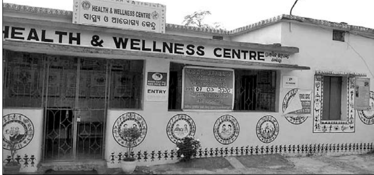
ଖର୍ଚ୍ଚା ପ୍ରାଥମିକ ସ୍ୱାସ୍ଥ୍ୟକେନ୍ଦ୍ରରେ ରୋଗୀସେବା ବନ୍ଦ।