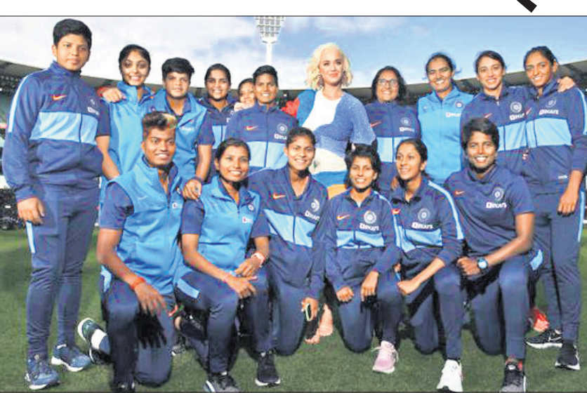
ପପ୍ ସିଙ୍ଗର କେଟି ପେରୀଙ୍କ ସହ ଭାରତୀୟ ଦଳର ଖେଳାଳିମାନେ।

ମେଲବୋର୍ନ, ୭ ମାର୍ଚ୍ଚ: ଫାଇନାଲ ମ୍ୟାଚ୍‌ରେ ଅଧ୍ୟକ୍ଷତା ପୂର୍ବରୁ ଆମେରିକାର ଜଣାଶୁଣା ମହିଳା ପପ୍ ଗାୟିକା କେଟି ପେରୀ ଉଭୟ ଅଷ୍ଟ୍ରେଲିଆ ଓ ଭାରତୀୟ ଦଳର ସଦସ୍ୟମାନଙ୍କୁ ଭେଟିଛନ୍ତି। ପ୍ରଥମ ସନ୍ଧାନର ଜନନୀ ହେବାକୁ ଯାଉଥିବା ପେରୀ ଓ ତାଙ୍କ ସ୍ୱାମୀ ତଥା ହଲିଉଡ ଅଭିନେତା ଓଲିଭିଆ ନ୍ୟୁ ଫାଇନାଲ ପୂର୍ବରୁ ବିଶ୍ୱକପ୍‌ର ଉଦ୍‌ଯାତନା ଉତ୍ସବରେ ଚୁକ୍ତିଚର ଗୀତ ଗାଇବେ। ବିଶ୍ୱ ମହିଳା ଦିବସରେ ଏହି ମ୍ୟାଚ୍ ଆୟୋଜନ ହେବାକୁ ଯାଉଥିବାରୁ ପୂର୍ଣ୍ଣ ସ୍ୱାଭାବିକ ମହିଳା କେନ୍ଦ୍ରୀୟ ହେବ ବୋଲି ପେରୀ ଆଶା ପ୍ରକାଶ କରିଛନ୍ତି। ଗର୍ଭଧାରଣ କରିବା ସତ୍ତ୍ୱେ ସଙ୍ଗୀତ ପରିବେଷଣ କରିବାକୁ ଯାଉଛି। ଏହି ମେଗା ଇଭେଣ୍ଟରେ ସବୁ ସମ୍ଭବସର୍ବର ଲୋକ ଓ ବିଶ୍ୱର କୋଣ ଅନୁକୋଣରୁ ଦର୍ଶକ ଉପସ୍ଥିତ ରହିବେ। ଉଦ୍‌ଯାତନା ଉତ୍ସବରେ କବରଦ୍ରୁ ସଙ୍ଗୀତ ଦୃଶ୍ୟ ଦେଖିବାକୁ ମିଳିବ ବୋଲି ସେ କହିଛନ୍ତି।