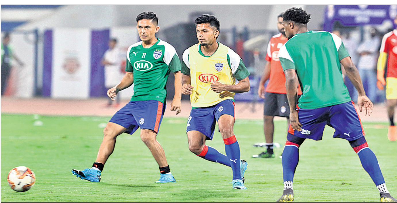
ଆଇସିସିସି ସେମିଫାଇନାଲ ପୂର୍ବରୁ ବେଙ୍ଗାଲୁରୁ ଏସିଏ ଖେଳାଳିଙ୍କ ଅଭ୍ୟାସ।

ମେଲବୋର୍ନ, ୭ ମାର୍ଚ୍ଚ: ଫାଇନାଲ ମ୍ୟାଚ୍‌ରେ ଅଧ୍ୟକ୍ଷତା ପୂର୍ବରୁ ଆମେରିକାର ଜଣାଶୁଣା ମହିଳା ପପ୍ ଗାୟିକା କେଟି ପେରୀ ଉଭୟ ଅଷ୍ଟ୍ରେଲିଆ ଓ ଭାରତୀୟ ଦଳର ସଦସ୍ୟମାନଙ୍କୁ ଭେଟିଛନ୍ତି। ପ୍ରଥମ ସନ୍ଧାନର ଜନନୀ ହେବାକୁ ଯାଉଥିବା ପେରୀ ଓ ତାଙ୍କ ସ୍ୱାମୀ ତଥା ହଲିଉଡ ଅଭିନେତା ଓଲିଭିଆ ନ୍ୟୁ ଫାଇନାଲ ପୂର୍ବରୁ ବିଶ୍ୱକପ୍‌ର ଉଦ୍‌ଯାତନା ଉତ୍ସବରେ ଚୁକ୍ତିଚର ଗୀତ ଗାଇବେ। ବିଶ୍ୱ ମହିଳା ଦିବସରେ ଏହି ମ୍ୟାଚ୍ ଆୟୋଜନ ହେବାକୁ ଯାଉଥିବାରୁ ପୂର୍ଣ୍ଣ ସ୍ୱାଭାବିକ ମହିଳା କେନ୍ଦ୍ରୀୟ ହେବ ବୋଲି ପେରୀ ଆଶା ପ୍ରକାଶ କରିଛନ୍ତି। ଗର୍ଭଧାରଣ କରିବା ସତ୍ତ୍ୱେ ସଙ୍ଗୀତ ପରିବେଷଣ କରିବାକୁ ଯାଉଛି। ଏହି ମେଗା ଇଭେଣ୍ଟରେ ସବୁ ସମ୍ଭବସର୍ବର ଲୋକ ଓ ବିଶ୍ୱର କୋଣ ଅନୁକୋଣରୁ ଦର୍ଶକ ଉପସ୍ଥିତ ରହିବେ। ଉଦ୍‌ଯାତନା ଉତ୍ସବରେ କବରଦ୍ରୁ ସଙ୍ଗୀତ ଦୃଶ୍ୟ ଦେଖିବାକୁ ମିଳିବ ବୋଲି ସେ କହିଛନ୍ତି।