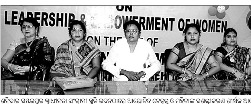
ଶନିବାର ସମ୍ବଲପୁର ସଂଗ୍ରାମୀ ସ୍ତ୍ରୀ କବନରେ ଆୟୋଜିତ ନେତୃତ୍ଵ ଓ ମହିଳାଙ୍କ ସଶକ୍ତୀକରଣ ଶୀର୍ଷକ ଆଲୋଚନାଚକ୍ରରେ ବକ୍ତାମାନେ (ବାମ)।

ସମ୍ବଲପୁର/ରେଙ୍ଗାଳି, ୭ମା (ବୁଧବେଳା/ବି.ଏନ.ଏ.): ରେଙ୍ଗାଳି ବ୍ଲକ୍ ଖୁଣ୍ଟା ପ୍ରାଥମିକ ସ୍କୁଲର ଡାକ୍ତର ଅଭିଯୋଗରେ ଡେପୁଟେଶନ ବାତିଲ କରାଯାଇଥିଲା।