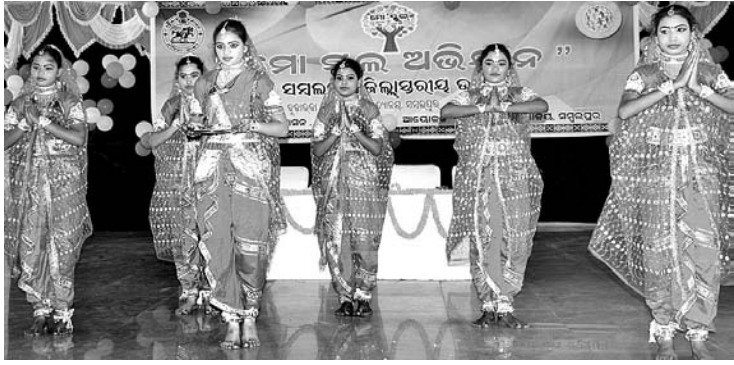
ଶନିବାର ସମ୍ବଲପୁର ଜିଲ୍ଲାପ୍ରଧାନ ମୋ ସ୍କୁଲ ଅଭିଯାନ ଉତ୍ସବରେ କପୁରବା ଗାଣୀ ମାଡୁନିକେତନ ଛାତ୍ରୀମାନେ ସ୍ଵାଗତ ନୃତ୍ୟ ପରିବେଷଣ କରୁଛନ୍ତି (ବାମ)।

ସମ୍ବଲପୁର, ୭ମା (ବୁଧବେଳା): ଧନୀ ଆନା ଅଧୀନ ଗୁଲୁଣ୍ଡିପାଲି ନିକଟ ମାଳତୀ ନଦୀରୁ ଶନିବାର ଅପରାହ୍ଣ ୨ଟାରେ ଯୋଗିସ ଏକ ଅରଣ୍ୟ ବ୍ୟକ୍ତିଙ୍କ ମୃତଦେହ ଉଦ୍ଧାର କରିଛି।