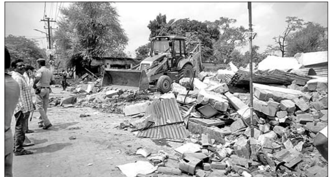
ବିକ୍ରମ ଛକ ନିକଟ ମହାତ୍ଵ ଗାନ୍ଧୀ ମାର୍ଗର ଉଭୟ ପଟ ସରକାରୀ ଜମିରୁ ଜବରଦଖଲ ଉଚ୍ଛେଦ କରାଯାଇଛି।

ବଲାଙ୍ଗୀର ସହର ପିପି ଏକାଡେମୀ ଛକରୁ ବିକ୍ରମ ଛକ ପର୍ଯ୍ୟନ୍ତ ମହାତ୍ଵ ଗାନ୍ଧୀ ମାର୍ଗର ଉଭୟ ପଟରେ ଶନିବାର ପ୍ରଶାସନ ପକ୍ଷରୁ ଜବରଦଖଲ ଜମିରୁ ଜବରଦଖଲ ଉଚ୍ଛେଦ କରାଯାଇଛି। ଫଳରେ ରାସ୍ତାର ଉଭୟ ପଟରେ ଥିବା ବହୁ ବୋକାଳକୁ କେହି ବିକିଆରେ ଭଙ୍ଗାଯାଇଛି। ଦୀର୍ଘ ବର୍ଷ ହେଲା ସରକାରୀ ଜମାରେ କେତେକ ଲୋକ ଜବରଦଖଲ କରି ବୋକାଳ ବଜାର ତିଆରି କରିଥିଲେ। ପୂର୍ବରୁ ଟୋରୁ ଜବରଦଖଲ ଉଚ୍ଛେଦ କାର୍ଯ୍ୟ ଆରମ୍ଭ ହୋଇଥିଲା। ଏହି ଉଚ୍ଛେଦ କାର୍ଯ୍ୟରେ ଉପଜିଲ୍ଲାପାଳ ସଞ୍ଜୟ କୁମାର ମିଶ୍ର,