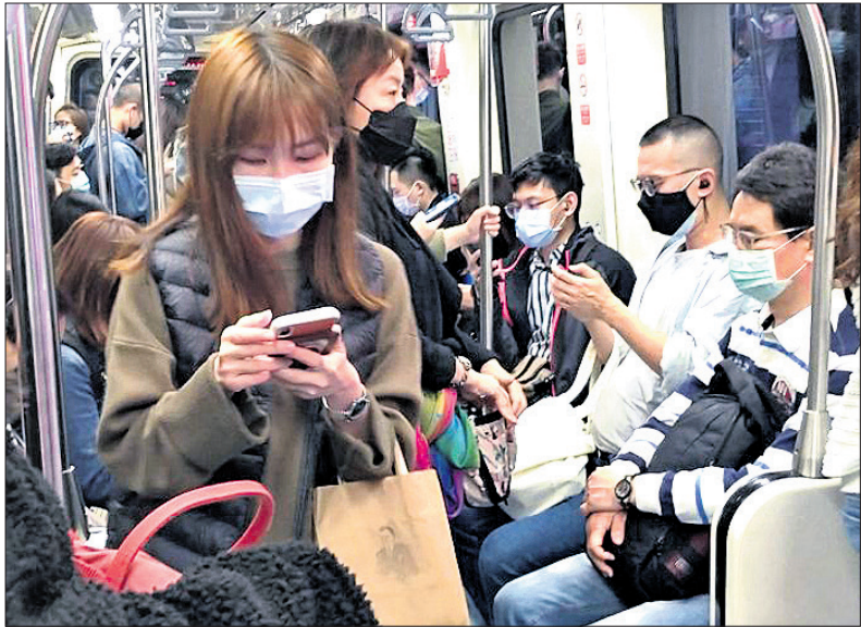
ଚାଇପେଇଠାରେ କରୋନା ଭୟରେ ଯାତ୍ରୀମାନେ ମାସ୍କ ପିନ୍ଧିଛନ୍ତି।