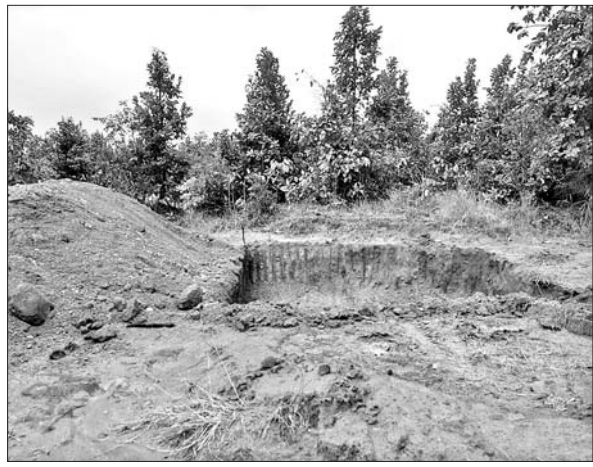
ଲୋକଙ୍କ ବିରୋଧପରେ ପୋଖରୀ ଖୋଳା କାମ ଅଧାରୁ ଛାଡି ଠିକାଦାର ମେଣ୍ଟିନ ନେଇ ପକାଇଛନ୍ତି ।