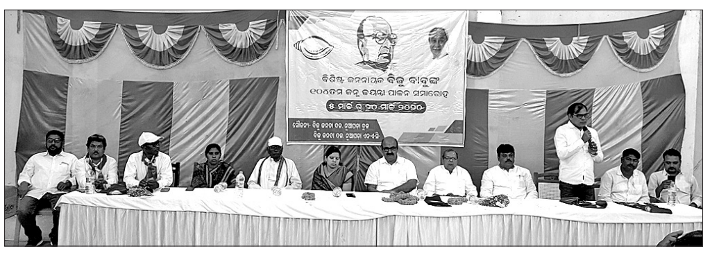
ନୂଆପଡ଼ାଠାରେ ବିଜୁ ଜୟନ୍ତୀ ଉତ୍ସବରେ ମଞ୍ଚାଧୀନ ଅତିଥିବୃନ୍ଦ ।

କୁନାଗଡ଼, ୭ମାର୍ଚ୍ଚ (ଡି.ଏନ.ଏ.): କଳାହାଣ୍ଡି ଜିଲ୍ଲା କୁନାଗଡ଼ ଷ୍ଟେଶନରୁ ଶନିବାର ଜଣେ ନାବାଳିକାଙ୍କୁ ଚାଇଲୁ ଉଦ୍ଧାର କରି ସିଡ଼ିପୁରୀକୁ ହସ୍ତାନ୍ତର କରିଥିବା ଜଣାପଡ଼ିଛି । ପ୍ରକାଶ ଯେ, ନାବାଳିକାଙ୍କ କହିବାନୁଯାୟୀ ସେ ଖୋର୍ଦ୍ଧା ଅଞ୍ଚଳର ହୋଇଥିବାବେଳେ ବାଲେଶ୍ୱର ଏକ ସାଙ୍ଗ ଘରକୁ କୌଣସି କାମ ପାଇଁ ଯାଇଥିଲେ । ସେଠାରେ ଫେରିବା ସମୟରେ ବାଲେଶ୍ୱରକୁ ଖୋର୍ଦ୍ଧା ଯିବା ପରିବର୍ତ୍ତେ ଭୁବନେଶ୍ୱର କୁନାଗଡ଼ ଷ୍ଟେସନରେ ବସିପଡ଼ିଥିଲେ । ନାବାଳିକା ଜଣକ କୁନାଗଡ଼ ଷ୍ଟେସନରେ ପହଞ୍ଚିବା ପରେ ଷ୍ଟେସନ କର୍ମଚାରୀ ଯତ୍ନ ସମ୍ପର୍କରେ ଚାଇଲୁ ଲାଇନକୁ ଜଣାଇଥିଲେ । ପରେ ଚାଇଲୁ ଲାଇନର ସହଯୋଗୀ ଲୋକମାନଙ୍କୁ ପ୍ରାଣ ଓ ସୁରାକ୍ଷା ଚଳୁ ନାଏକ କୁନାଗଡ଼ ଆନାକ୍ ଆଣି ସେଠାରେ ଏକ ମାମଲା ଗୁରୁ କରି ଜିଲ୍ଲା ଶିଶୁ ମଙ୍ଗଳ ସମିତି (ସିଡ଼ିପୁରୀ)ରେ ଉପସ୍ଥିତରେ ହାତର କରାଯିବା ପାଇଁ ଜଣାପଡ଼ିଛି ।