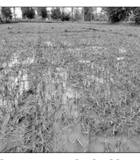
ପିଆଜ କ୍ଷେତରେ ପାଣି ଜମି ରହିଛି। କୁଶମେଳ, ବାଦିମୁଣ୍ଡା, ତଳଭଉଡ଼ ଅଞ୍ଚଳରେ ହୋଇଥିବା ପନିପରିବା ଚାଷ ନଷ୍ଟ ହୋଇଥିବା ଅଭିଯୋଗ ହୋଇଛି। ଲୋଇସିଂହା ଓ ଆଗଲପୁର ବ୍ଲକ୍ କୃଷି ବିଭାଗ କର୍ମଚାରୀ କ୍ଷେତ୍ର ପରିଦର୍ଶନ ସହ କ୍ଷୟକ୍ଷତି ଆକଳନ କରିବାକୁ ସାଧାରଣରେ ଦାବି ହେଉଛି। ଅପରପକ୍ଷରେ ଶୁକ୍ରବାର ରାତିରୁ ସାନଟିକା, ଚେଟୁଳିଖୁଣ୍ଟିରେ ବିଦ୍ୟୁତ୍ ବିଚ୍ଛିନ୍ନ ହୋଇ ଲୋକେ ଅସୁବିଧାରେ ରହିଛନ୍ତି। ଏଥିପାଇଁ ଜନ ଅସନ୍ତୋଷ ପ୍ରକାଶ ପାଇଛି।

ବଲାଙ୍ଗୀର ଜିଲ୍ଲା ଲୋଇସିଂହା ଓ ଆଗଲପୁର ବ୍ଲକ୍ରେ ଶୁକ୍ରବାର କୁଆପଥର ଓ ଝଡ଼ବର୍ଷାରେ ପରିବା ଓ ଅନ୍ୟାନ୍ୟ ଉଦ୍ଭିଦ ଶକ୍ତିଗ୍ରସ୍ତ ହୋଇଛି। ଆଗଲପୁର ବ୍ଲକ୍ରେ ବଡ଼ଟିକା, ବେନ୍ଦୁ, ନଅଗାଁ(ଖ) ପଞ୍ଚାୟତ ଅଞ୍ଚଳରେ ବ୍ୟାପକଭାବେ ଉଦ୍ଭିଦ ଘାତ ହୋଇଥିଲା। ନଅଗାଁ(ଖ) ପଞ୍ଚାୟତର ସାନଟିକା, ଚେଟୁଳିଖୁଣ୍ଟି, ନଅଗାଁ(ଖ), ବଡ଼ଟିକା ପଞ୍ଚାୟତର ଗୁଡ଼ାଭାଡ଼ି, ବେନ୍ଦୁ ପଞ୍ଚାୟତର ଧଉରାବାଦର ଗାଁରେ ବାଉଁଶ, ଚମାଟ, ଲଙ୍କା, ପିଆଜ ପ୍ରଭୃତି ପରିବା ଓ ଚାଳି ଜାତୀୟ ଫସଲ ବ୍ୟାପକ ମାତ୍ରାରେ କରାଯାଇଥିଲା। ଚଳିତ ବର୍ଷ ଚାଷ ଆରମ୍ଭକୁ ଅତିନିଆ ବର୍ଷା ସାଙ୍ଗକୁ ଶୁକ୍ରବାର ଝଡ଼ବର୍ଷା ସାଙ୍ଗକୁ କୁଆପଥର ମାଡ଼ ଚାଷୀର ନିଦ ହଜାଇ ଦେଇଛି। ସେହିପରି ଲୋଇସିଂହା ବ୍ଲକ୍ରେ ଉପରବାହାଳ, ସରଗାଡ଼ା,