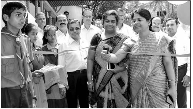
ମୋ ସ୍କୁଲ ଅଭିଯାନ ଫଟୋ ପ୍ରଦର୍ଶନୀକୁ ଛାତ୍ରୀଛାତ୍ର ଦେଖୁଛନ୍ତି (ମଝି)। ମୋ ସ୍କୁଲ ଅଭିଯାନ ଉତ୍ସବରେ ଫଟୋଗ୍ରାଫି ପ୍ରଦର୍ଶନୀରୁ ଅଭିଯାନରେ ଉଦ୍ଘାଟନ କରୁଛନ୍ତି।