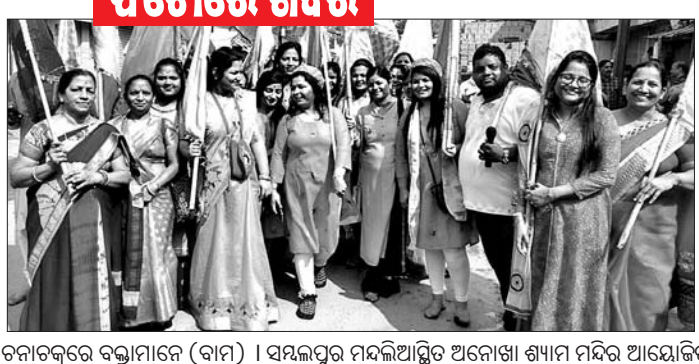
ସମ୍ବଲପୁର ମହାବିଦ୍ୟାଳୟ ଅନେକା ଶ୍ୟାମ ମନ୍ଦିର ଆୟୋଜିତ ଫଟୁନ ଉତ୍ସବ ଉପଲକ୍ଷେ ନିଶାନ ଯାତ୍ରା (ମଝି)।