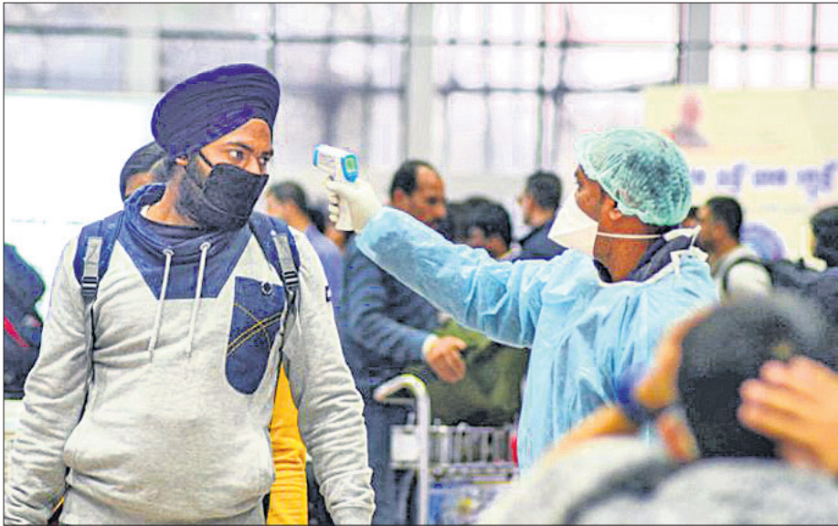
ବିଷୁବାଡ଼ ବିମାନବନ୍ଦରରେ ଯାତ୍ରୀମାନଙ୍କୁ ଯାଞ୍ଚ କରାଯାଉଛି।