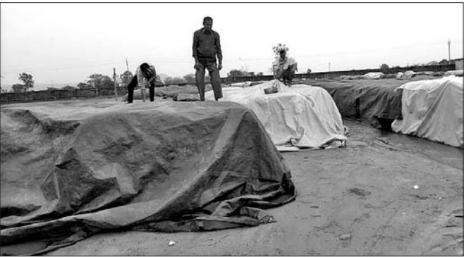
ସାରାବର୍ଗ ମଞ୍ଚରେ ଧାନ ବର୍ଷାରେ ଭିଜିଛି ।

ରାଜ୍ୟ ସରକାରଙ୍କ ନିଷ୍ପତ୍ତିକ୍ରମେ ଜିଲ୍ଲା ପ୍ରଶାସନ ସମସ୍ତ ଚାଷୀଙ୍କୁ ଧାନର ସର୍ବନିମ୍ନ ମୂଲ୍ୟ ଦିଆଯିବ। ଠିକ ସମୟରେ ଦିଆଯିବ ଏବଂ କୌଣସି ପ୍ରକାର ଅନିୟମିତତା ହେଲେ କାର୍ଯ୍ୟାନୁଷ୍ଠାନ ହେବ ବୋଲି ଖୋଦ ଜିଲ୍ଲାପାଳ ଦେଓଙ୍କ କବି ନିଷ୍ପତ୍ତି ଶୁଣାଇ ଦେଇଥିଲେ । ହେଲେ ସବୁ ଧୂଆଁବାଣୀ ହୋଇଛି । ଜିଲ୍ଲାରେ ମୋଟ ୧୩ ଲକ୍ଷ କୁଇଣ୍ଟାଲ ଧାନ କିଣାଯିବାକୁ ଲକ୍ଷ୍ୟ ଧାର୍ଯ୍ୟ କରାଯାଇଥିବାବେଳେ କେବଳ ୧୨ ଲକ୍ଷ କୁଇଣ୍ଟାଲ ଧାନ କିଣି ହୋଇ ବନ୍ଦ କରି ଦିଆଗଲା । ଲକ୍ଷ କୁଇଣ୍ଟାଲ ଧାନ ବିକ୍ରି ମଞ୍ଚ ଏବଂ ଚାଷୀଙ୍କ ନିକଟରେ ପଡ଼ି ରହିଛି। ଚାଷୀ ହଜାର ହଜାର କୁଇଣ୍ଟାଲ ଧାନ ଧରି ମଞ୍ଚରେ ଖରା ବର୍ଷାରେ ଜଳି ରହିଛନ୍ତି । ଏଣେ ନାହିଁତେ ଦେଇ ବସିରହିଛନ୍ତି ପ୍ରଶାସନ । ପ୍ରଶାସନ ବାରମ୍ବାର ରାଜ୍ୟ ସରକାରଙ୍କୁ ଜଣାଇଥିଲେ ମଧ୍ୟ କୌଣସି ପୁଞ୍ଜିକ ମିଳିପାରୁନାହିଁ । ଏଭଳିସ୍ଥିତି ଜିଲ୍ଲାର ଚାଷୀଙ୍କୁ କେଉଁଆଡ଼କୁ ଚାଣିନେବ ତାହା କହିହେଉନାହିଁ । ଏଭଳି ଗମ୍ଭୀର ସ୍ଥିତି ଉପରେ ରାଜ୍ୟ ଏବଂ କେନ୍ଦ୍ର ସରକାର ଦେଖି ଦୃଷ୍ଟି ଦେବାକୁ ଦାବି ହେଉଛି । ନୂଆପଡ଼ା ଏକ କୃଷି ପ୍ରଧାନ ଜିଲ୍ଲା ।