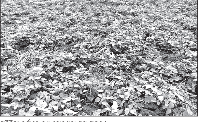
ଅଦିନିଆ ବର୍ଷାରେ ନଷ୍ଟ ହୋଇଥିବା ପୂର ଫସଲ ।

ମୋଟ ୨୪୪୦ ହେକ୍ଟର ଜମିରେ ଚାଷ ହୋଇଥିବା କୃଷି ବିଭାଗରୁ ସୂଚନା ମିଳିଛି । ବର୍ତ୍ତମାନ ପୂର, ବିରି, ଚଣା ଫସଲରେ ଫୁଲ୍ ଫଳ ଧରିବା ସମୟ । ଏହି ସମୟରେ ଅଦିନିଆ ବର୍ଷା ଯୋଗୁ ସବୁ ଝଡ଼ିଯାଇଛି । ଏହି ଚାଷରୁ ବୁଲି ପଇସା ରୋଜଗାର କରିବା ଆଶା କରିଥିବା ଚାଷୀ ଏବେ ଚିନ୍ତାରେ ପଡ଼ିଛନ୍ତି । କୋକସରା କୃଷି ବିଭାଗ ପକ୍ଷରୁ ବ୍ଲକ୍ରେ ତାଲିଚା ପଞ୍ଚାୟତରେ ୫୦ ହେକ୍ଟର, ଚାଉଡ଼ୋଲା ପଞ୍ଚାୟତରେ ୫୦ ହେକ୍ଟର, କଦାଗୁରୁରା ଓ ଫୁଲ୍‌ପାଠୀ ପଞ୍ଚାୟତରେ ୫୦ ହେକ୍ଟର ମୋଟ ୧୫୦ ହେକ୍ଟର ତାଲି ଜାତୀୟ ବିହନ ଚାଷୀଙ୍କୁ ଯୋଗାଇ ଦିଆଯାଇଛି । ଏ ନେଇ କୋକସରା କୃଷି ବିଭାଗ ସାହିତ୍ୟରେ ଥିବା କୃଷି ଅଧିକାରୀଙ୍କୁ ପ୍ରଧାନଶିକ୍ଷକ ପ୍ରଦାନ କରିବା ପାଇଁ ସଚେତନତା ସେକ୍ସର ମେଣିନ ଓ କିଟନାଶକ ଔଷଧ କୃଷି ବିଭାଗ ପକ୍ଷରୁ ଯୋଗାଇ ଦେବା ବ୍ୟବସ୍ଥା ରହିଛି । ବର୍ତ୍ତମାନ ଅଦିନିଆ ବର୍ଷାରେ ତାଲି ଜାତୀୟ ଫସଲ କେତେ କାଉଡ଼ୋଲା ପଞ୍ଚାୟତରେ ୫୦ ହେକ୍ଟର, କଦାଗୁରୁରା ଓ ଫୁଲ୍‌ପାଠୀ ପଞ୍ଚାୟତରେ ୫୦ ହେକ୍ଟର