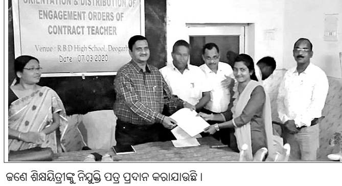
ଜଣେ ଶିକ୍ଷୟିତ୍ରୀଙ୍କୁ ନିଯୁକ୍ତି ପତ୍ର ପ୍ରଦାନ କରାଯାଇଛି।