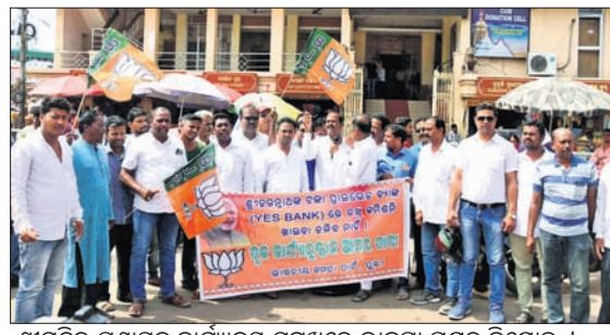
ଶ୍ରୀମନ୍ଦିର ପ୍ରଶାସନ କାର୍ଯ୍ୟାଳୟ ସମ୍ମୁଖରେ ଭାଜପା ପକ୍ଷରୁ ବିରୋଧ ।