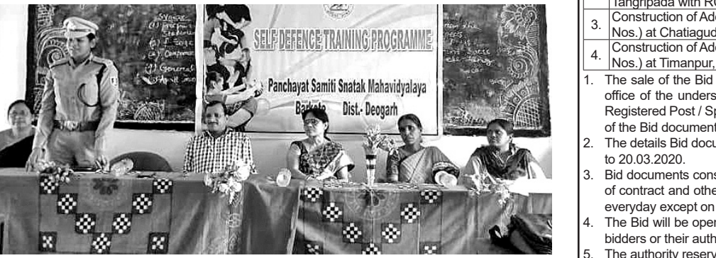
ଛାତ୍ରୀ ଆତ୍ମସୁରକ୍ଷା ତାଲିମ ଶିବିରରେ ମହାସାଧନ ଅତିଥି।

ସମ୍ବଲପୁର, ୭ମା (ବି.ଏନ.ଏ.): ସମ୍ବଲପୁର ଜିଲ୍ଲାପ୍ରଧାନ ମୋ ସ୍କୁଲ ଅଭିଯାନ ଉତ୍ସବରେ ସାମିଲ ହୋଇଥିବା ମହିଳାମାନେ ଗାୟତ୍ରୀ ମହାଯଜ୍ଞ ପ୍ରସ୍ତୁତ କରିଥିଲେ।