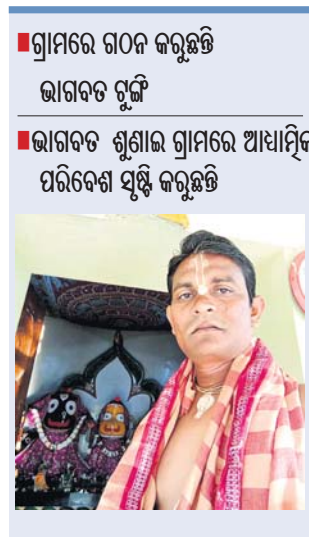
ବିଭିନ୍ନ ଗ୍ରାମ ବୁଲି ଲୋକମାନଙ୍କୁ ସଚେତନ କରି ଭାଗବତ ଚୁଙ୍ଗି ଗଠନ କରୁଛନ୍ତି । ଭାଗବତ ପ୍ରଚାର ପ୍ରସାର

ଚନ୍ଦ୍ରାହାଣ୍ଡି, ୮୩(ଡି.ଏନ.ଏ.) ପୂର୍ବରୁ ଗାଁ ଗାଁରେ ଭାଗବତ ଚୁଙ୍ଗି ରହିଥିଲା । ପ୍ରତି ସନ୍ଧ୍ୟାରେ ଗ୍ରାମବାସୀ