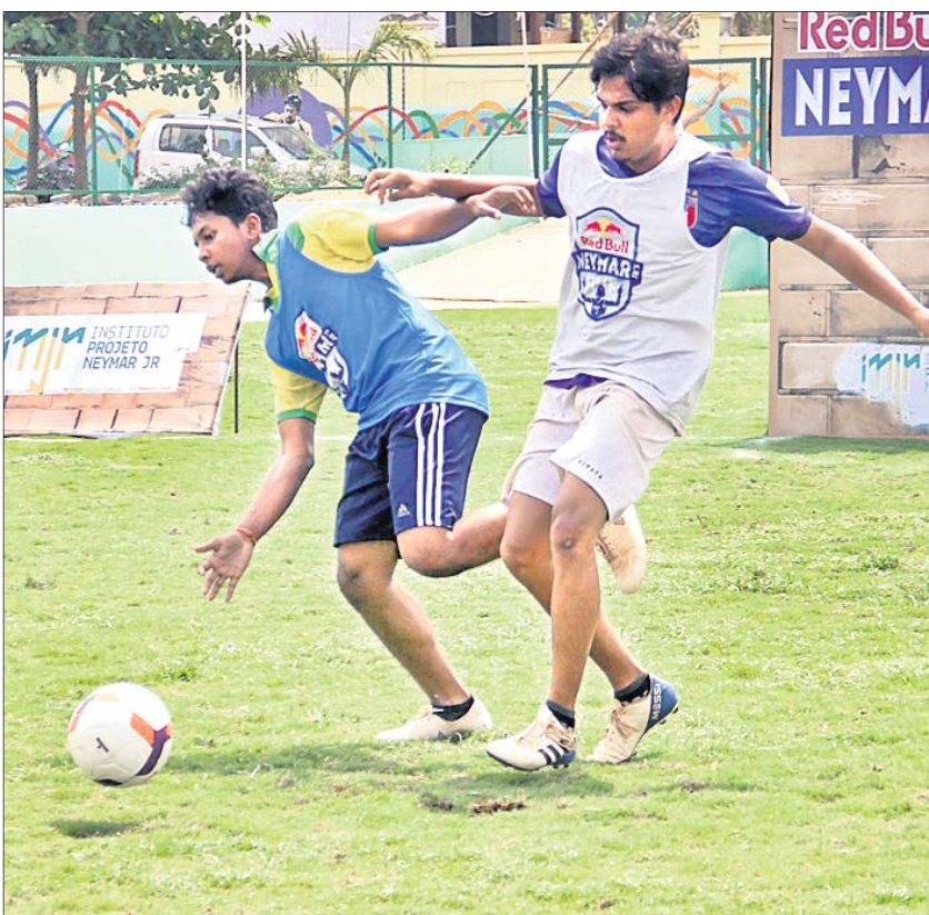
ରେଡ୍‌ବୁଲ୍ ନେମାର କୁନିୟର ଫାଇଲ୍-ଏ ସାଇଡ୍ ଯୁଗ୍ମବଳ ଅନ୍ତର୍ଗତ ଭୁବନେଶ୍ୱର ଯୋଗ୍ୟତା ପର୍ଯ୍ୟାୟରେ ରବିବାର କିର୍ ପରିସରରେ ଅନୁଷ୍ଠିତ ମ୍ୟାଚ।