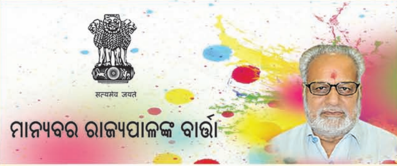
ମାନ୍ୟବର ରାଜ୍ୟପାଳଙ୍କ ବାର୍ତ୍ତା

ଦେଶର ପୂର୍ଣ୍ଣିମାବାରୁ ବିଦେଶୀ ନିବେଶକମାନେ ବର୍ତ୍ତମାନ ପୁଞ୍ଜା ୧୩, ୧୫୬ କୋଟି ଟଙ୍କା ପ୍ରତ୍ୟାହାର କରି ନେଇଛନ୍ତି। କରୋନା ଭାଇରସ ଯୋଗୁ ବିଦେଶୀ ନିବେଶକଙ୍କ ୬ ମାସର ନିବେଶ ଧାରା ଉପରେ ସାମାନ୍ୟ ପ୍ରଭାବ ପରିଲକ୍ଷିତ ହୋଇଛି ଷ୍ଟକ ବଜାର ଡିପୋଜିଟୋରୀ ତାର