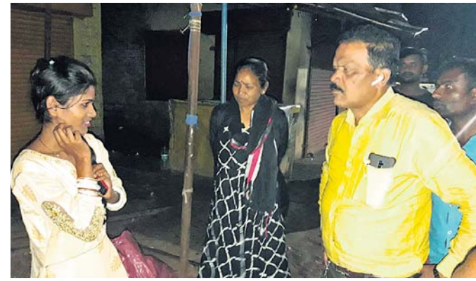
ଭବାର ମହିଳାଙ୍କୁ ପୋଲିସ ପତରାବେରା କରୁଛି ।

କଷ୍ଟ କରିପାରିଛନ୍ତି । ପବିତ୍ର କାର୍ତ୍ତିକ ଓ ବୈଶାଖ ମାସରେ ବିଭିନ୍ନ ଗ୍ରାମକୁ