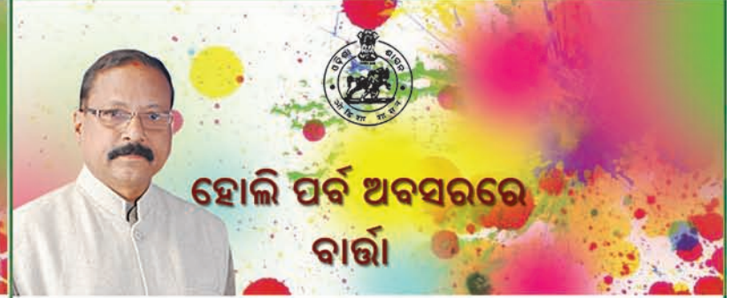
ହୋଲି ପର୍ବ ଅବସରରେ ବାର୍ତ୍ତା