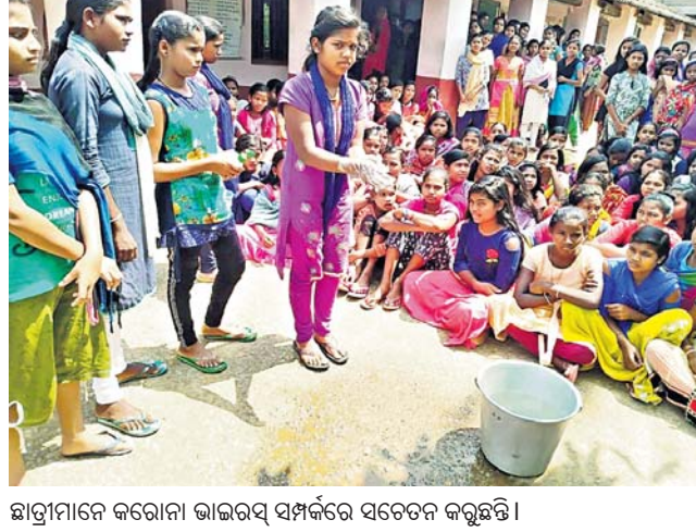
ଛାତ୍ରୀମାନେ କରୋନା ଭାଇରସ ସମ୍ପର୍କରେ ସଚେତନ କରୁଛନ୍ତି ।

ଡାକ୍ତରୀ, ୮୩ (ଡି.ଏନ.ଏ.) ସାରା ବିଶ୍ୱରେ କରୋନା ରୋଗର ଭୟଭୟ ନେଇ ଲୋକଙ୍କ ଚିନ୍ତା ବଢ଼ାଇ