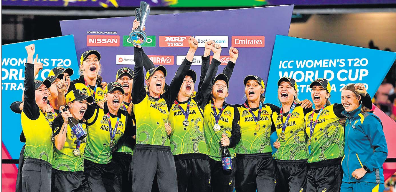
ବିଶ୍ୱକପ୍ ବିଜୟୀ ଅଷ୍ଟ୍ରେଲିଆ ମହିଳା କ୍ରିକେଟ ଦଳର ଖେଳାଳିମାନେ ଖୁସି ମନାଉଛନ୍ତି ।