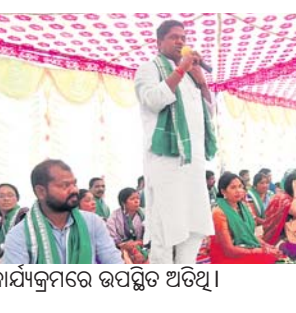
କାର୍ଯ୍ୟକ୍ରମରେ ଉପସ୍ଥିତ ଅତିଥି ।

ନବରଙ୍ଗପୁର ଜିଲ୍ଲା ରାଇଘର ବ୍ଲକ୍ ରାଇଘର ଜଗନ୍ନାଥ ମନ୍ଦିର ପ୍ରାଙ୍ଗଣରେ ବିକେଟି ତରଫରୁ ବିଶ୍ୱ