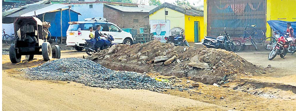
ରାସ୍ତାରେ ଗଦା ହୋଇଥିବା ଚିପ୍‌ସ୍ ଓ ବାଲି ।

ଝରିଗାଁ, ୮୩(ସ.ପ୍ର.) ନବରଙ୍ଗପୁର ଜିଲ୍ଲା ଝରିଗାଁ ବ୍ଲକ୍ ସଦର ମହକୁମା ଠାରେ ଗତ ଫେବୃଆରୀ