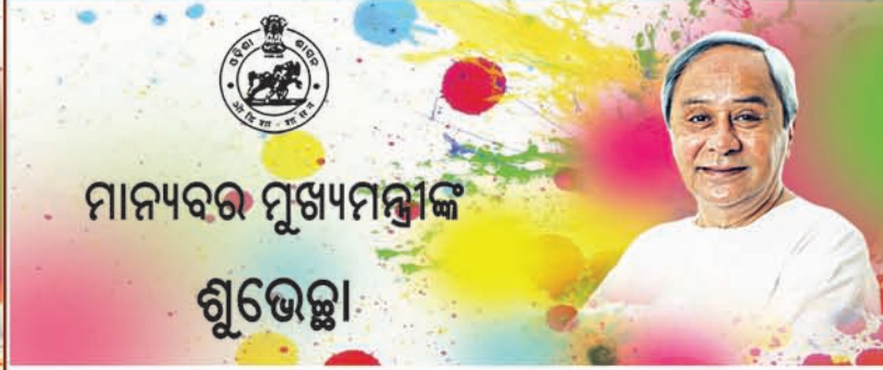
ମାନ୍ୟବର ମୁଖ୍ୟମନ୍ତ୍ରୀଙ୍କ ଶୁଭେଚ୍ଛା