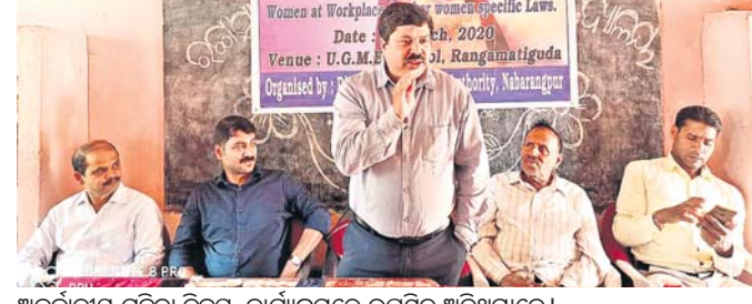
ଅନ୍ତର୍ଜାତୀୟ ମହିଳା ଦିବସ କାର୍ଯ୍ୟକ୍ରମରେ ଉପସ୍ଥିତ ଅତିଥିମାନେ ।

ଏମ୍‌ଇ ୭୯, ୮୩(ଡି.ଏନ.ଏ.) ମାଲକାନଗିରି ଜିଲ୍ଲା ପତିଆ ବ୍ଲକ୍ ଶିମିଳିବାଣୀ ପଞ୍ଚାୟତ ଅନ୍ତର୍ଗତ