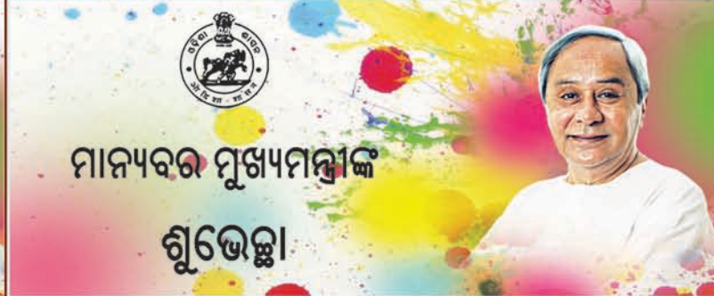
ମାନ୍ୟବର ମୁଖ୍ୟମନ୍ତ୍ରୀଙ୍କ ଶୁଭେଚ୍ଛା