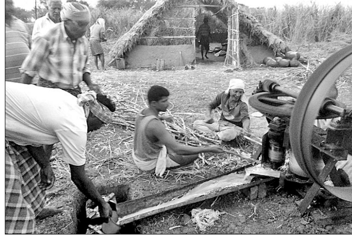
ବଜାରୀ ଗଣେ ଚାଷୀ ଆଖୁ ପେଟୁଛି ।

ଚିନି ନ ଖାଇ ଆଖୁ ତିଆରି ରୁଟି ଖାଇବା ପାଇଁ ବିଭିନ୍ନ କ୍ଷେତ୍ରରେ ପରାମର୍ଶ ଦିଆଯାଉଛି । କିନ୍ତୁ ବ୍ୟୟବହୁଳ ଆଖୁଚାଷ ପାଇଁ ସରକାରୀ ସ୍ତରରେ ପ୍ରୋତ୍ସାହନ ମିଳୁ ନ ଥିବାରୁ ଆଖୁଚାଷୀମାନେ ଏହି ଚାଷ ପ୍ରତି ମୁହଁ ଫେରାଇବାରେ ଲାଗିଛନ୍ତି । ଦେବାଦେବୀଙ୍କ ବିଭିନ୍ନ ପୂଜାରେ ରୁଚିତ ଆବଶ୍ୟକତା ବହୁତ ଅଧିକ ଥିବା ବେଳେ ଜନସାଧାରଣ ଏହାକୁ ସେମାନଙ୍କ ଖାଦ୍ୟରେ ସାମିଲ କରିଥାଆନ୍ତି । ବଜାରରେ ଚିନି କିଲୋଗ୍ରାମ ପିଛା ୪୦ ଟଙ୍କା ଥିବା ବେଳେ ରୁଚି କିଲୋ ଗ୍ରାମ ପିଛା ୫୦ ଟଙ୍କାରେ ବିକ୍ରୟ ହେଉଛି । ତଥାପି ଚାଷରେ ଅଧିକ ଖର୍ଚ୍ଚ ଓ ପରିଶ୍ରମ ହେଉଥିବାରୁ ଉପଯୁକ୍ତ ବଜାର ମୂଲ୍ୟ ମିଳୁନାହିଁ ବୋଲି ଆଖୁ ଚାଷୀମାନେ ପ୍ରକାଶ କରିଛନ୍ତି । ପାଟକୁରା ଥାନା ଆଖୁଆ ଗ୍ରାମ ପଞ୍ଚାୟତ ବଜାରୀ ଗ୍ରାମରେ କେତେକ ଚାଷୀ ଆଖୁଚାଷ କରିଛନ୍ତି । ସେମାନେ ଧାର କରଇ କରି ଏହି ଚାଷ କରୁଥିବା ବେଳେ କୌଣସି ବ୍ୟାଙ୍କରୁ କୃଷି ରଣ