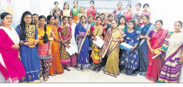
ଓଡ଼ିଶାରେ ଅନ୍ତର୍ଜାତୀୟ ମହିଳା ଦିବସରେ ସମବେତ ମହିଳାମାନେ।