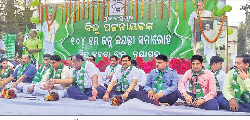
ଜୟନ୍ତୀ ଉତ୍ସବରେ ଯୋଗ ଦେଇଥିବା ଅତିଥିମାନେ।