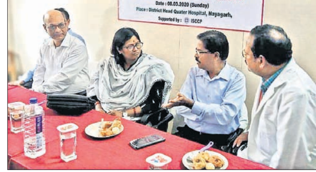
ଶିବିରରେ ଯୋଗ ଦେଇଥିବା ଅତିଥିବୃନ୍ଦ।