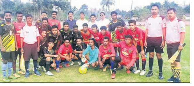
ଖେଳାଳିଙ୍କ ଗହଣରେ ଅତିଥି ।

ଧର୍ମଶାଳା, ୮ମାର୍ଚ୍ଚ(ବିଧିବନ୍ଧ) ଧର୍ମଶାଳା ଷ୍ଟାଡ଼ିୟମ୍ ଏକାଡେମୀ ଆନୁକୂଲ୍ୟରେ ବାଣୀପାଠ ପଢ଼ିଆରେ ଚାଲିଥିବା ରାଜ୍ୟସ୍ତରୀୟ ଷଷ୍ଠ ବାର୍ଷିକ ଧର୍ମଶାଳା କପ୍ ଫୁଟବଲ ଟୁର୍ନାମେଣ୍ଟର ଦ୍ୱିତୀୟ ସେମିଫାଇନାଲ ମ୍ୟାଚରେ ଖୋର୍ଦ୍ଧାର ଜୟଦୁର୍ଗା କ୍ଲବ୍ ବିଜୟୀ ହୋଇଛି। ମ୍ୟାଚରେ ଖୋର୍ଦ୍ଧାର ଜୟଦୁର୍ଗା କ୍ଲବ୍ ୨/୦ ଗୋଲରେ ଧର୍ମଶାଳା ଷ୍ଟାଡ଼ିୟମ୍ ଏକାଡେମୀକୁ ପରାସ୍ତ କରି ଫାଇନାଲରେ