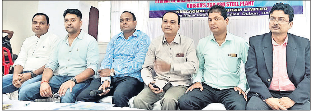
ନୀଳାଚଳ ଏକକିଣ୍ଟାଟିଭ୍ ଆସୋସିଏଟସ୍ ପକ୍ଷରୁ ଆୟୋଜିତ ଖବରଦାତା ସମ୍ମିଳନୀ।

ଭାରତର ବୃହତ୍ ପିପ୍ପା ଆଇରନ୍ ଉତ୍ପାଦନା କମ୍ପାନୀ ଭାବେ ଖ୍ୟାତି ଅର୍ଜନ କରିଥିବା ନୀଳାଚଳ ଉତ୍ପାଦନା ନିଗମ ଲିମିଟେଡ୍ (ଏନ୍‌ଆଇଏନ୍‌ଏଲ୍)କୁ ବନ୍ଦ କରିବାକୁ କେନ୍ଦ୍ର ସରକାର ମସୁଧା କରୁଛନ୍ତି। ଭାରତ ସରକାରଙ୍କ ମେଟାଲ ଆଣ୍ଡ ମିନେରାଲସ୍ ଟ୍ରେଡିଂ କର୍ପୋରେଶନ(ଏମ୍‌ଏମ୍‌ଟିସି) ଏବଂ ଓଡ଼ିଶା ସରକାରଙ୍କ ଲାଓର୍‌ସ୍ ଏବଂ ଓପେସିସିସିଆରିଟାରେ କଳିଙ୍ଗନଗରରେ ଥିବା ଏହି ଏକମାତ୍ର ରାସ୍ତାରେ ସଂସ୍ଥା ଏବେ ତାଲା ଝୁଲିବା ଅବସ୍ଥାକୁ ଆସିଛି। ନିକଟରେ କେନ୍ଦ୍ର ସରକାର ନୀଳାଚଳକୁ ସମ୍ପୂର୍ଣ୍ଣ ପୁଞ୍ଜି ପ୍ରତ୍ୟାହାର କରିବାର ନିଷ୍ପତ୍ତି ନେଇଥିବା ବେଳେ ନିବେଶ ଏବଂ ଲୋକପରିସଂପୃକ୍ଷିତ ପ୍ରବନ୍ଧନ ବିଭାଗ ଏହି ପ୍ରକ୍ରିୟା ସମ୍ପାଦନ କରିବାର ଦାୟିତ୍ୱ ନେଇଛି। ୧.୧ ମିଲିୟନ୍ ଟନ୍ ସ୍ଥପନା ବିଶିଷ୍ଟ ଏହି ଉତ୍ପାଦନା କାରଖାନା ଯଦି ବନ୍ଦ ହୁଏ ତା' ହେଲେ ପରୋକ୍ଷ ଏବଂ ପ୍ରତ୍ୟକ୍ଷ ଭାବେ ୧୦ ହଜାରରୁ ଊର୍ଦ୍ଧ୍ୱ କର୍ମଚାରୀ ଜୀବିକା ହରାଇବେ। ନୀଳାଚଳ ଏକକିଣ୍ଟାଟିଭ୍