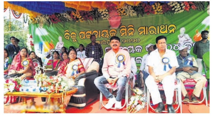
ବିଜୁ ପଟ୍ଟନାୟକ ମିନି ମାରାଥନ ଅବସରରେ ମହାସୀମା ଅତିଥି।