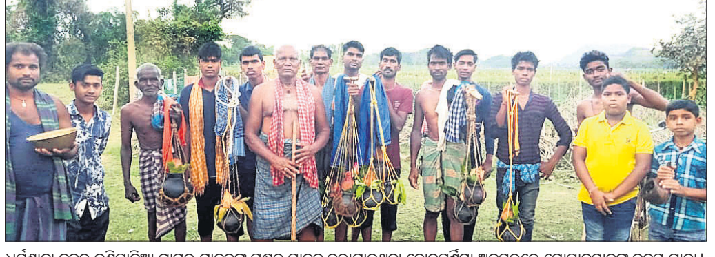
ଧର୍ମଶାଳା ବୁକର କଣିପାଟିଆ ଗ୍ରାମର ଯାବଦକ ପକ୍ଷରୁ ପାଳନ କରାଯାଇଥିବା ଦୋଳପୂର୍ଣ୍ଣିମା ଅବସରରେ ହୋଇଥିବା ଦୋଳପାଳନ କଳସ ଯାତ୍ରା।

କଳିଙ୍ଗନଗର, ଚମକା, ସୁଲଭା, କାଳିଆପାଣି ଆଦି ଥାନା ଅଞ୍ଚଳକୁ ନେଇ ଏକ ନୂତନ ଜିଲ୍ଲା ଗଠନ ପାଇଁ ବୈଠକରେ ପ୍ରସ୍ତାବ ହୋଇଥିଲା। ଏହିସବୁ ଅଞ୍ଚଳର ବୈଠକରେ ସୂଚିତ କରାଯାଇଥିଲା ଯେ, ୨୦୧୧ ମସିହା ଜନଗଣନା ଅନୁଯାୟୀ ଅନୁଗୋଳ ଜିଲ୍ଲାର ଲୋକସଂଖ୍ୟା ୧୨,୭୩,୮୨୧, ନବରଙ୍ଗପୁର ଜିଲ୍ଲାର ୧୨,୨୦,୯୪୬, ଢେଙ୍କାନାଳ ଜିଲ୍ଲାର ୧୧,୯୨,୮୧୧ ଆଦି ଜିଲ୍ଲାର ୧୩ ଲକ୍ଷରୁ କମ ଲୋକସଂଖ୍ୟାରେ ଗଠନ ହୋଇଛି। ତେଣୁ ପ୍ରଶାସନିକ ସୁବିଧା, ସର୍ବାଙ୍ଗୀନ ଭବନ ତଥା ସାଧାରଣ ଲୋକଙ୍କ ସମ୍ବନ୍ଧିତକ୍ଷେତ୍ର ଉପରୋକ୍ତ ଅଞ୍ଚଳକୁ ନେଇ ଏକ ସ୍ୱତନ୍ତ୍ର ଜିଲ୍ଲା ଗଠନ କରାଯାଉ ବୋଲି ବୈଠକରେ ମତପ୍ରକାଶ ପାଇଥିଲା।