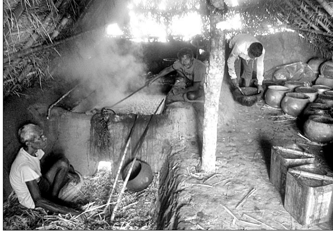
ଗଣେ ଚାଷୀ କତେଇରେ ରୁଚି ପ୍ରସ୍ତୁତ କରୁଛନ୍ତି ।