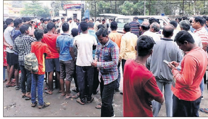
ଦୁର୍ଘଟଣାସ୍ଥଳରେ ଲୋକଙ୍କ ଭିଡ଼।

ଚିକିତ୍ସା ପାଇଁ ଅନୁଗୋଳ ସହରକୁ ଆସିଥିବା ସାନବେରକାଜ ଗ୍ରାମର ଏକ ଦମ୍ପତି ଉତ୍ତରୀ ଟ୍ରକ୍ ଧକ୍କାରେ ପ୍ରାଣ ହରାଇଛନ୍ତି। ଉଭୟେ ଏକ ସ୍ତ୍ରୀ ଯୋଗେ ୫୫୫୯. ଜାତୀୟ ରାଜପଥରେ ଯାଉଥିବାବେଳେ ଅନୁଗୋଳ ଏସ୍ପିକ କାର୍ଯ୍ୟାଳୟ ନିକଟରେ ବୁଟ ଗତିରେ ଆସୁଥିବା ଏକ ଟ୍ରକ୍ ସେମାନଙ୍କୁ ଧକ୍କା ଦେଇଥିଲା। ଫଳରେ ଘଟଣାସ୍ଥଳରେ ହିଁ ଉଭୟଙ୍କ ଜୀବନ ଚାଲିଯାଇଥିଲା। ଏହାକୁ ନେଇ ସେଠାରେ କିଛି ସମୟ ପାଇଁ ଉତ୍ତରଜନା ଦେଖାଦେଇଥିଲା। ଘଟଣାସ୍ଥଳରେ ଜଣାପଡିଛି, ସାନବେରକାଜର ବାଉରାଣା ଗୋଲାଘର(୪୦) ଅସୁସ୍ଥ ଥିବାରୁ ସ୍ତ୍ରୀମାନେ ଚିକିତ୍ସା ଗୋଲାଘର (୪୫) ଟାଙ୍କୁ ସୁଟିରେ (ନଂ. ଓଡ଼ିଶ-୧୧-୦୫୪୯) ଅନୁଗୋଳ ସହର କାଳିଙ୍ଗ ଛକକୁ ଆସୁଥିଲେ। ଏସ୍ପିକ କାର୍ଯ୍ୟାଳୟ ନିକଟରେ ପଛରୁ ଆସୁଥିବା ଏକ ବୁଟ(ନଂ. ଓଡ଼ିଶ-୫୪-୮୭୯୫) ସୁଟିକୁ ଧକ୍କା ଦେଇଥିଲା।