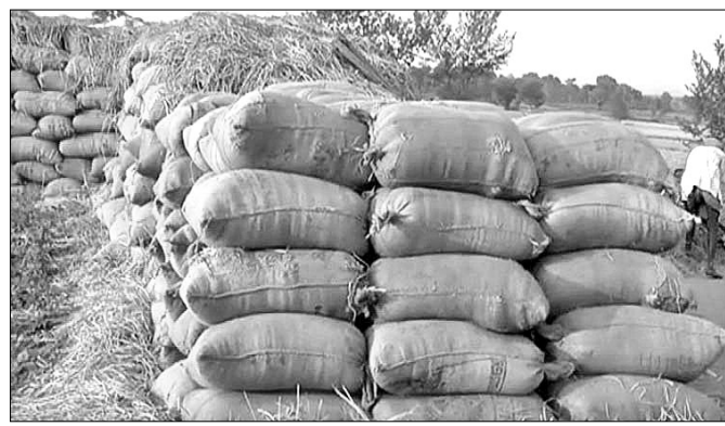
ଜିଲାର ଏକ ମଣ୍ଡିରେ ଗଦା ହୋଇଥିବା ଧାନ ।

ଜମିରେ ଧାନ ଫସଲ କରୁଥିବା ବେଳେ ବକଳା ଧାନ ବିକ୍ରୟକୁ ନେଇ ସମସ୍ୟା ଅଛି । ବକଳା ଧାନ ବିକ୍ରୟ ପାଇଁ ଚାଷୀଙ୍କ ନାମ ପୂର୍ବରୁ ପଞ୍ଜୀକରଣ ହେବା ଜରୁରୀ ବୋଲି ରାଜ୍ୟ ସରକାର ଘୋଷଣା କରିଛନ୍ତି । ଏହି କ୍ରମରେ ଜିଲାର ମୋଟ ୩୪,୧୯୭ ଜଣ ଚାଷୀଙ୍କ ନାମ ପଞ୍ଜୀକୃତ ହୋଇଥିବା ବେଳେ ଅଦ୍ୟାବଧି ୩୨,୨୨୮ ଚାଷୀଙ୍କୁ ଧାନ ବିକ୍ରୟ ପାଇଁ ଅନୁମତି ମିଳିଛି । ଏଥିମଧ୍ୟରୁ ମାତ୍ର ୧୬ ହଜାର ୬୬୮ ଜଣ ଚାଷୀ ବର୍ତ୍ତମାନ ସୁଦ୍ଧା ଧାନ ବିକ୍ରୟ କରିଛନ୍ତି । ସେହିପରି ବିଭିନ୍ନ କାରଣରୁ ମହାକାଳପଡା ବ୍ଲକ ଅଞ୍ଚଳରେ ୫୮, ରାଜନଗରରେ ୪, ଗରଦପୁରରେ ୩, ରାଜନଗରରେ ୨ ଓ ଅନ୍ୟ ବ୍ଲକରେ