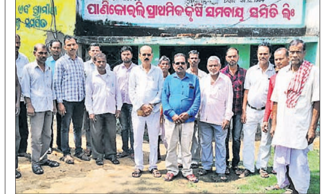
ଚାଷୀମାନେ ଧାରଣା ଦେଇଛନ୍ତି।