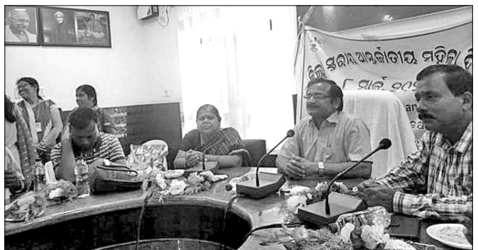
କାର୍ଯ୍ୟକ୍ରମରେ ଯୋଗଦେଇଥିବା ଅତିଥିମାନେ ।