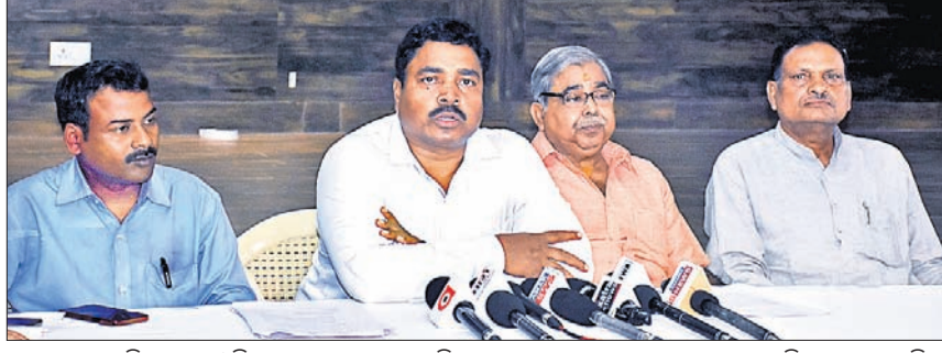
ଖବରଦାତା ସମ୍ମିଳନୀରେ ଉଡ଼ିଶା ସୁଚନା ଅଧିକାରୀ ଅଭିଯାନ ରାଜ୍ୟ ଆବାହକ ପ୍ରଦୀପ ପ୍ରଧାନ ଅଭିଯୋଗ କରୁଛନ୍ତି।