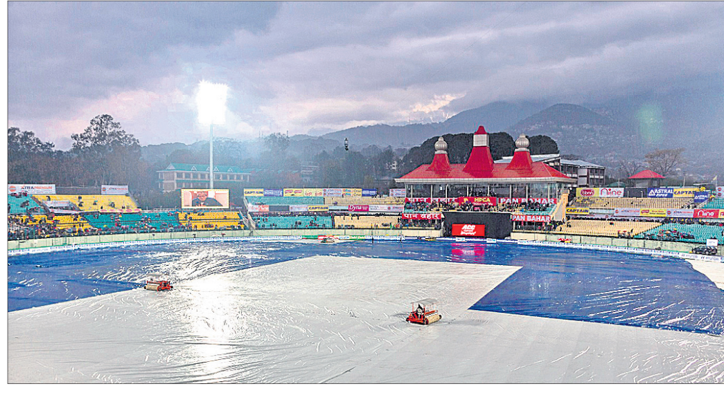
ବର୍ଷା ଦ୍ୱାରା ପ୍ରଭାବିତ ଷ୍ଟାଡ଼ିୟମ ଗ୍ରାଉଣ୍ଡ।

ପ୍ରଶଂସକମାନେ ଘାନ୍ତା ଲଢୁନାଗ ମନ୍ଦିରରେ ପ୍ରାର୍ଥନା କରିଥିଲେ ମଧ୍ୟ କିଛି ଲାଭ ହୋଇ ନ ଥିଲା।