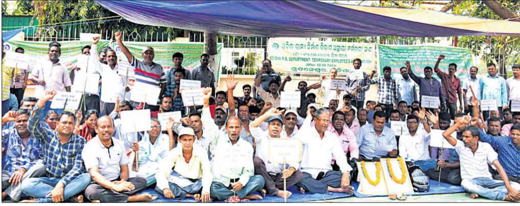
ଧାରଣାରେ ବସିଥିବା ରାଜ୍ୟ ଗ୍ରାମ୍ୟ ନିର୍ମାଣ ବିଭାଗ ଅସ୍ଥାୟୀ କର୍ମଚାରୀ।

ଦୁଇବର୍ଷ ହେଲା ବେତନ ମିଳୁନି। ବିନା ବେତନରେ ପରିବାର ଚଳାଇବା କଷ୍ଟକର ହୋଇ ପଡ଼ିଲାଣି। ନିଜର ଓ ପିଲାଛୁଆଙ୍କ ଗୁଜରାଣା ନେଶାଇବା ଆଉ ସମ୍ଭବ ନ ହେଉଛି।