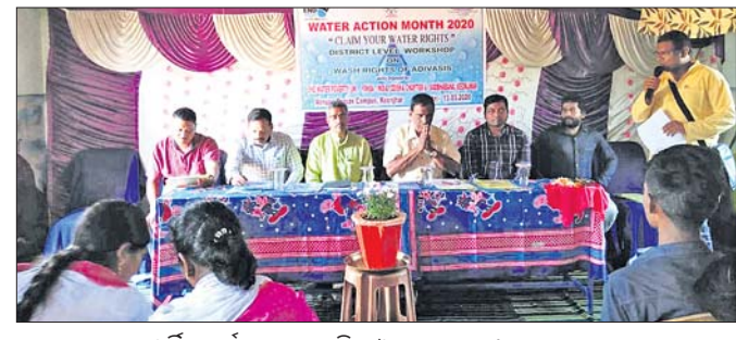
ଜଳ ଅଧିକାର ସମ୍ପର୍କିତ କର୍ମଶାଳାରେ ଅତିଥି ଓ ଅନ୍ୟମାନେ।

ଜଳ, ଜମି ପରେ ଏବେ ଜଳ ଅଧିକାର ଦାବି ନେଇ ଜନଜାତି ସମ୍ପ୍ରଦାୟ ଏକଜୁଟ ହେବାରେ ଲାଗିଛନ୍ତି। ଜଳଅଧିକାର ପାଇଁ ଆରମ୍ଭ ହୋଇଛି ଦସ୍ତଖତ ସଂଗ୍ରହ ଅଭିଯାନ।