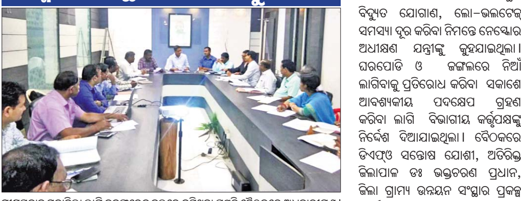
ଗ୍ରୀଷ୍ମପ୍ରବାହ ମୁକାବିଲା ଲାଗି କର୍ମଚାରୀଙ୍କୁ ସଚେତନ କରିବା ପାଇଁ ଗ୍ରୀଷ୍ମ ପ୍ରସ୍ତୁତି ବୈଠକରେ ଅଧିକାରୀମାନେ।

ଅବହେଳା କଲେ ଦୂର କାର୍ଯ୍ୟାଳୟରେ ୨୪ ଘଣ୍ଟା ଗ୍ରୀଷ୍ମ କରାଯିବ ବୋଲି ସେ ଚେତାବନା ଦେଇଥିଲେ।