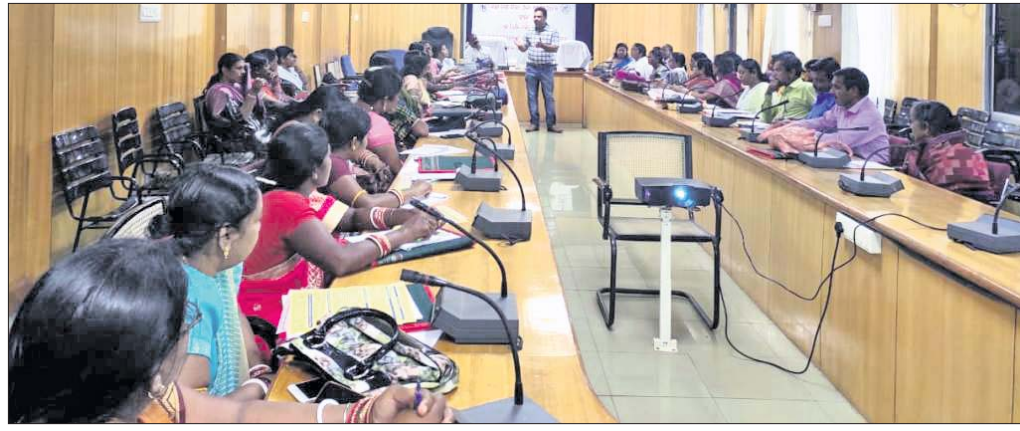
ତାଲିମ ଶିବିରରେ ଉପସ୍ଥିତ ଅଧିକାରୀ ଓ ବିଭିନ୍ନ ସଂସ୍ଥାର କର୍ମଚାରୀ।

କେନ୍ଦୁଝର ଜିଲ୍ଲା ପ୍ରଶାସନ ଓ ଜିଲ୍ଲା ଶିଶୁ ସୁରକ୍ଷା ବିଭାଗ ଆନୁକୂଲ୍ୟରେ ଜିଲ୍ଲା ଗ୍ରାମ୍ୟ ଉନ୍ନୟନ ସଂସ୍ଥାର କର୍ମଚାରୀମାନଙ୍କ ଦ୍ୱାରା ବାଲ୍ୟ ବିବାହ ନିରୋଧ ଆଇନ ଏବଂ ଶିଶୁ ସୁରକ୍ଷା ଆଇନ ସମ୍ପର୍କିତ ଏକ ତାଲିମ ଶିବିର ଅନୁଷ୍ଠିତ ହୋଇଯାଇଛି।