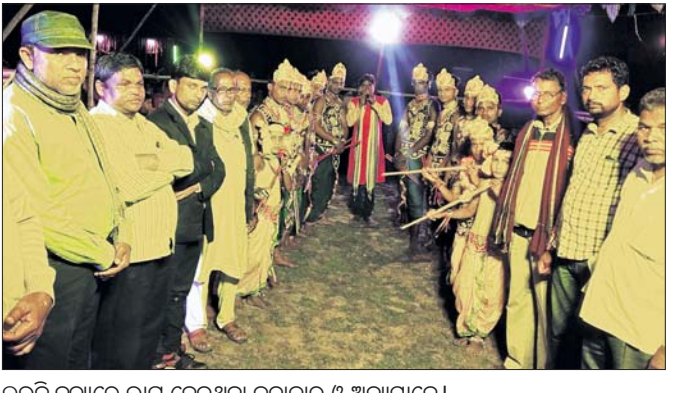
ଲଭଢ଼ି ନୃତ୍ୟରେ ଭାଗ ନେଇଥିବା କଳାକାର ଓ ଅନ୍ୟମାନେ।

କେନ୍ଦୁଝର ଜିଲ୍ଲା ପ୍ରଶାସନ ଓ ଜିଲ୍ଲା ଶିଶୁ ସୁରକ୍ଷା ବିଭାଗ ଆନୁକୂଲ୍ୟରେ ଜିଲ୍ଲା ଗ୍ରାମ୍ୟ ଉନ୍ନୟନ ସଂସ୍ଥାର କର୍ମଚାରୀମାନଙ୍କ ଦ୍ୱାରା ବାଲ୍ୟ ବିବାହ ନିରୋଧ ଆଇନ ଏବଂ ଶିଶୁ ସୁରକ୍ଷା ଆଇନ ସମ୍ପର୍କିତ ଏକ ତାଲିମ ଶିବିର ଅନୁଷ୍ଠିତ ହୋଇଯାଇଛି।