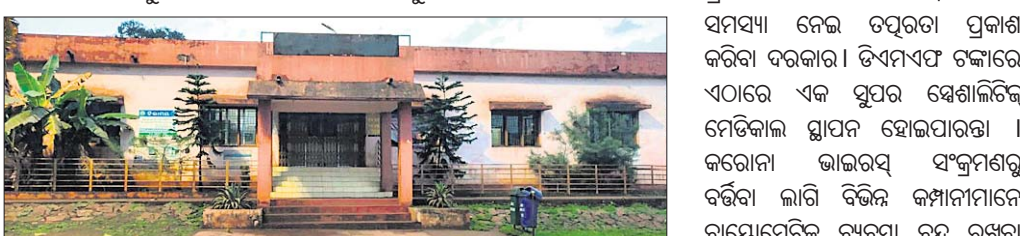
ଯୋଡ଼ା ସରକାରୀ ଡାକ୍ତରଖାନା।

ଯୋଡ଼ା, ୧୩୩୩ (ଡି.ଏନ.ଏ.)- କେନ୍ଦୁଝର ଜିଲ୍ଲାର ଖଣି ଉପତ୍ୟକା ଯୋଡ଼ାକୁ ବିଭିନ୍ନ ରାଜ୍ୟରୁ ବ୍ୟବସାୟୀ ଓ ଅନ୍ୟ ଲୋକ ଆସୁଥିବାରୁ ଏଠାରେ କରୋନା ବ୍ୟାପିବା ଭୟ ଦେଖାଦେଇଛି।