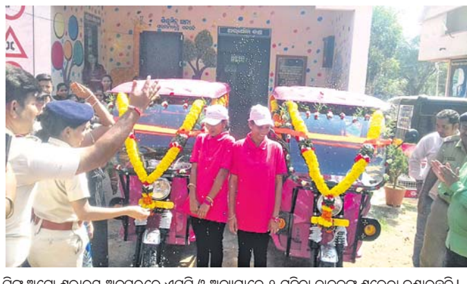
ପିଙ୍କ୍ ଅଟୋ ଶୁଭାରମ୍ଭ ଅବସରରେ ଏସ୍ପି ଓ ଅନ୍ୟମାନେ ୨ ମହିଳା ଚାକିରୀକୁ ଶୁଭେଚ୍ଛା ଜଣାଉଛନ୍ତି।