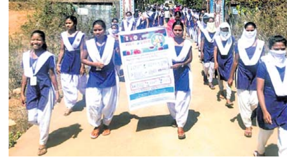
ସଚେତନତା ଶୋଭାଯାତ୍ରାରେ ବାହାରିଥିବା ଛାତ୍ରୀମାନେ।

ଡିବ୍ରୁକୋଣ୍ଡା ଏସଏସଡି ବାଳିକା ଉଚ୍ଚ ବିଦ୍ୟାଳୟ ପକ୍ଷରୁ ପ୍ରାଥମିକ ଉପାୟ ଛୁମ୍ପାରେ ସେଠାକୁ ଡିବ୍ରୁକୋଣ୍ଡା ଡିଭିଜନର କରୋନା ଭୂତାଣୁ ସମ୍ପର୍କରେ ଏକ ସଚେତନତା କାର୍ଯ୍ୟକ୍ରମ ଶୁଭକାରୀ ଅନୁଷ୍ଠିତ ହୋଇଯାଇଛି।