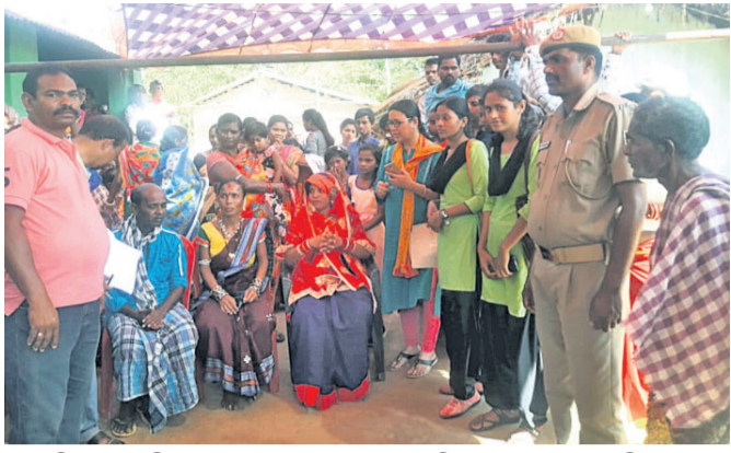
ବାଲ୍ୟବିବାହ ରୋକିବାକୁ ଅଧିକାରୀମାନେ ପାପଡ଼ାହାଣ୍ଡିରେ ସଚେତନ କରୁଛନ୍ତି।

ପ୍ରଶାସନର ତାରିଖ ସତ୍ତ୍ୱେ ନବରଙ୍ଗପୁର ଜିଲ୍ଲାରେ ଅନୁମତି ବାଲ୍ୟ ବିବାହ। ସଚେତନତା ଆଭାବ ଓ କର୍ତ୍ତବ୍ୟ ସାଧନ ପାଇଁ କମ୍ ବୟସରୁ ପିଲାମାନଙ୍କୁ ବିବାହ କରାଉଛନ୍ତି ମା' ବାପା।