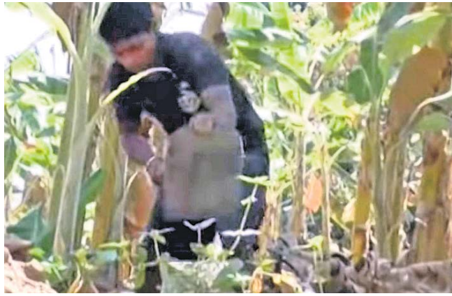
ନିଜ କର୍ମଚାରୀ ବଟାଣିଗୁଡ଼ା ପାଲସୁ।

ମାଲକାନଗିରି ଜିଲ୍ଲା ଖଜୁରପୁର ବ୍ଲକ୍ ବଟାଣିଗୁଡ଼ା ପାଲସୁ ପାଲିକୁ ପରିଶ୍ରମ ଦେଇଛି ସଫଳତା। ଜଣେ ସଫଳ କର୍ମଚାରୀ ରୂପେ ସେ ନିଜ ପରିଚୟ ସୃଷ୍ଟି କରିପାରିଛନ୍ତି।