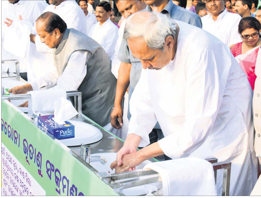
ମୁଖ୍ୟମନ୍ତ୍ରୀ ନବୀନ ପଟ୍ଟନାୟକ ହାତ ଧୋଇ କରୋନା ସଂକ୍ରମଣ ପ୍ରତିଷ୍ଠେୟକ ସତରଞ୍ଜିତ କାର୍ଯ୍ୟକ୍ରମରେ ଭାଗ ନେଇଛନ୍ତି।