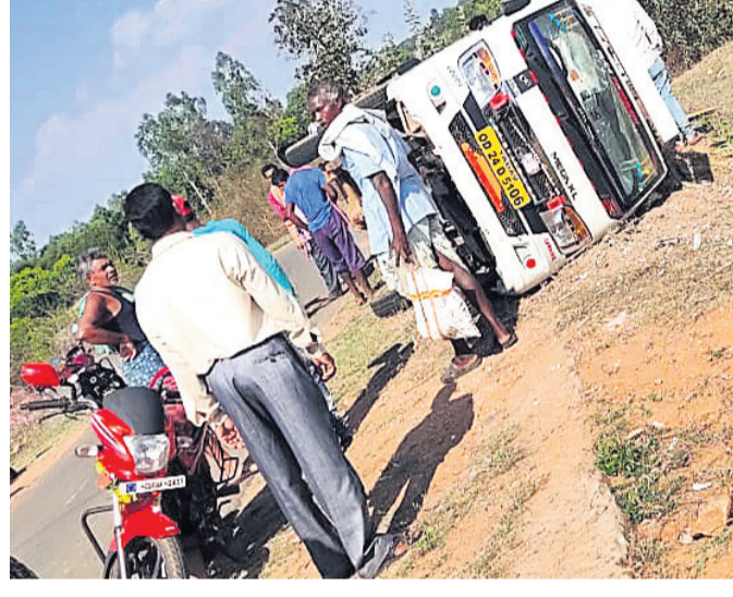
ପୂର୍ବଚଣାଗ୍ରସ୍ଥ ବରଯାତ୍ରୀ ଗାଡ଼ି।

ବରଯାତ୍ରୀ ଗାଡ଼ି ଓଲଟି ଶୁକ୍ରବାର ନବରଙ୍ଗପୁର ଜିଲା ତାପୁଗାଁ ବ୍ଲକ୍ ଚିକିଳି ଗାଁର ୧୦ ଯାତ୍ରୀ ଆହତ ହୋଇଛନ୍ତି। ଘଟଣାରୁ ପ୍ରକାଶ ଯେ, ଗାଁରୁ ୨୦ ଯାତ୍ରୀ ଏକ ବାରିଡିଆ ଗାଡ଼ି(୫୭୨୪ଟି-୫୧୦୬)ଯୋଗେ ନନ୍ଦାହାଣ୍ଡି ବ୍ଲକ୍ ସରୁରୁଡ଼ା ଗ୍ରାମକୁ ଯାଉଥିଲେ।