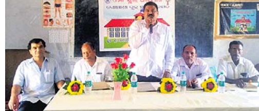
କାର୍ଯ୍ୟକ୍ରମରେ ମଞ୍ଚାସୀନ ଅତିଥିମାନେ।

ଗଜପତି ଜିଲ୍ଲା ଗୋଷାଣା ବ୍ଲକ୍ ଅଧୀନ ଗୋରାବନ୍ଧ ଭେକଟେସ୍ଟର ହାଇସ୍କୁଲ ପରିସରରେ ଶୁକ୍ରବାର ବ୍ଲକ୍ପ୍ରଧାନ ମୋ ସ୍କୁଲ୍ ଅଭିଯାନରେ ସଚେତନତା କାର୍ଯ୍ୟକ୍ରମ ଅନୁଷ୍ଠିତ ହୋଇଛି।