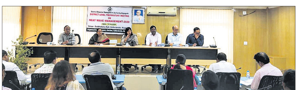
ବୈଠକରେ ଜିଲ୍ଲାପାଳ ଓ ବିଭାଗୀୟ ଅଧିକାରୀମାନେ ।