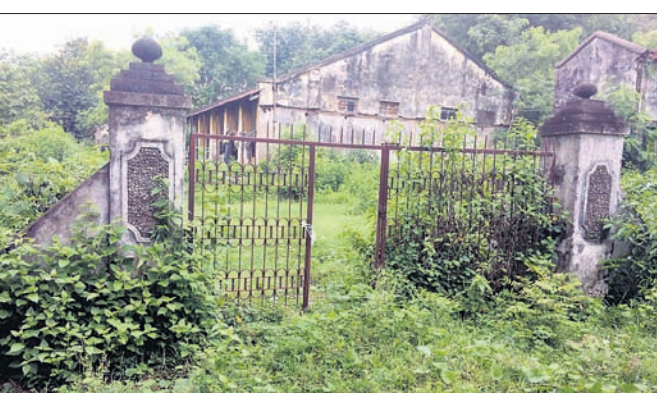
କରାକାର୍ଯ୍ୟ ହୋଇପଡ଼ୁଥିବା କଣ୍ଠିଲୋସ୍ଥିତ ନାଳମାଧ୍ୟ ଆଲୁମିନିୟମ ବାସନ ଶିଳ୍ପାନୁଷ୍ଠାନ

ଦୀର୍ଘ ୬୦ ବର୍ଷ ତଳେ ତତ୍କାଳୀନ ରାଜ୍ୟ ସରକାରଙ୍କର ନିଷ୍ପତ୍ତି ଅନୁଯାୟୀ କେତେକ ଗ୍ରାମପଞ୍ଚାୟତରେ ଶିଳ୍ପାନୁଷ୍ଠାନ ପ୍ରତିଷ୍ଠା କରାଯାଇଥିଲା । ଏହି ପରିପ୍ରେକ୍ଷାରେ ଅବିଭକ୍ତ ପୁରୀ ଜିଲ୍ଲା ଅଧୀନରେ ଥିବା ନୟାଗଡ଼ର ପ୍ରତ୍ୟେକ ବ୍ଲକକୁ ପଞ୍ଚାୟତ ସମିତି ଭାବେ ଆଖ୍ୟା ଦିଆଯାଇ ଖଣ୍ଡପଡ଼ା ବ୍ଲକରେ ଏକ ଚିନିକଳ ଓ କଣ୍ଠିଲୋଠାରେ ନାଳମାଧ୍ୟ ଆଲୁମିନିୟମ ବାସନ ଶିଳ୍ପାନୁଷ୍ଠାନ ପ୍ରତିଷ୍ଠା କରାଯାଇଥିଲା । ଲକ୍ଷ୍ୟାତ୍ମକ ଚଳା ବ୍ୟୟରେ ପ୍ରତିଷ୍ଠା ହୋଇଥିବା ଏହି ଆଲୁମିନିୟମ ବାସନ ଶିଳ୍ପରେ ବିଭିନ୍ନ ପ୍ରକାର ବାସନ ସାମଗ୍ରୀ