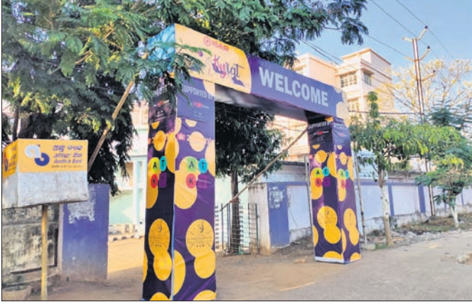
ଆଇଜର ପକ୍ଷରୁ ନିର୍ମିତ ସ୍ୱାଗତ ତୋରଣ ।