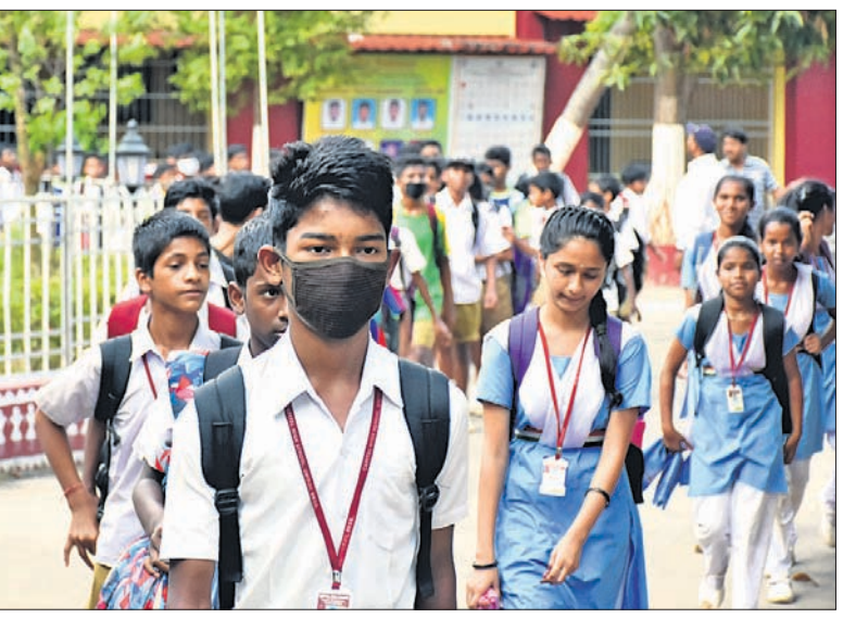
ଭୁବନେଶ୍ୱରସ୍ଥିତ ସୂନିର୍-୩ କ୍ୟାମ୍ପସର ଶାଳସୁଲ ଛାତ୍ରାଛାତ୍ରମାନେ ମାସପିସି ସ୍କୁଲ ଛୁଟି ପରେ ଫେରୁଛନ୍ତି।

ଆଜିର ସମ୍ବାଦକାୟ ଦିଆଇପିଙ୍କ ଜବରଦସ୍ତାଳ ଆଜିର ମତବ୍ୟ କିଛି ତଥ୍ୟ ଗୃହବନ୍ଦୀ ଥିବା ସମସ୍ତ ନେତା ମୁକ୍ତ ହେବା ପରେ ଭବିଷ୍ୟତ କାର୍ଯ୍ୟପନ୍ଥା ନିର୍ଦ୍ଧାରଣ କରାଯିବ। —ଫାରୁକ୍ ଅବଦୁଲ୍ଲା, ନ୍ୟାଶନାଲ କନ୍ଫେଡରେଟ୍ ଅଧ୍ୟକ୍ଷ ଗତ ୭ ମାସରେ ପ୍ରଥମ ଥର ଲାଗି ଫେବୃୟାରୀରେ ରପ୍ତାନି ୨.୯୧% ବୃଦ୍ଧି ଘଟି ୨୭.୬୫ ବିଲିୟନ ଡଲାର ରହିଛି। — ବାଣିଜ୍ୟ ମନ୍ତ୍ରାଳୟ