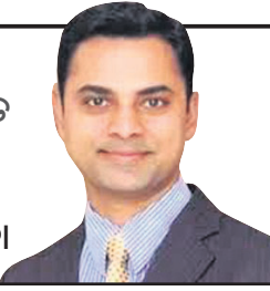
— କୃଷ୍ଣମୂର୍ତ୍ତି ସୁବ୍ରହ୍ମଣ୍ୟନ, ମୁଖ୍ୟ ଅର୍ଥନୈତିକ ପରାମର୍ଶଦାତା

କରୋନା ଭାଇରସ ଯୋଗୁ ନିବେଶକଙ୍କ ମନରେ ଉପୁଜିଥିବା ଭୟ ଏବଂ ପ୍ରଭାବିତ ମନୋଭାବକୁ ଠିକ୍ କରିବା ଦିଗରେ ସରକାର ଆବଶ୍ୟକ ପଦକ୍ଷେପ ନେଉଛନ୍ତି।