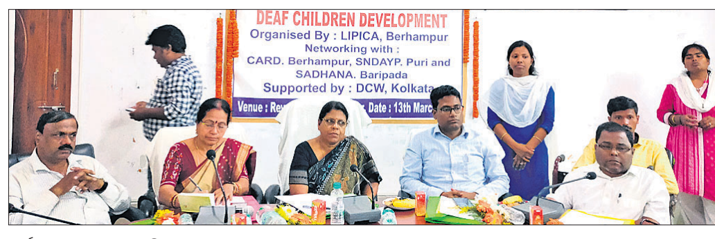
କାର୍ଯ୍ୟକ୍ରମରେ ମଞ୍ଚାସୀନ ଅତିଥି ।