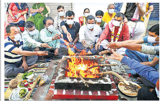
କରୋନା ରୋଗୀଙ୍କୁ ଆଶ୍ୱାସ ଦେବା ପାଇଁ ଅଧିକାରୀଙ୍କୁ ଲୋକେ ସମ୍ମାନ କରୁଛନ୍ତି।