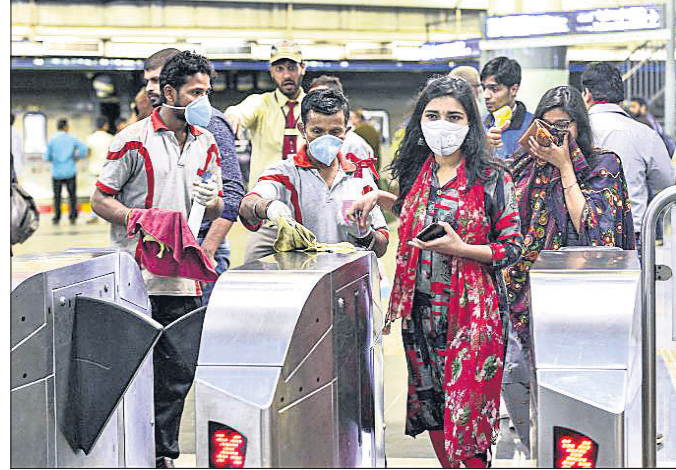
କରୋନା ସଂକ୍ରମଣ ରୋକିବା ପାଇଁ ନୂଆଦିଲ୍ଲୀ ରାଜୀବ ଚୌକ ମେଡ଼ିକାଲ୍ ସେଣ୍ଟର ପଥକୁ କର୍ମଚାରୀମାନେ ସଫା କରୁଛନ୍ତି।

ବିଶ୍ୱବ୍ୟାପୀ କରୋନା ଭାଇରସ୍‌ଜନିତ ମୃତ୍ୟୁସଂଖ୍ୟା ଶୁକ୍ରବାର ୫, ୦୪୩ରେ ପହଞ୍ଚିଛି। କେବଳ ଉତ୍ତର ଗୋଲ ଗୋଲ୍ଡରେ ୩, ୧୭୬ ମୃତ୍ୟୁ ଏଥିଲାଗି ରହିଲାଣି। ଏହା ବ୍ୟତୀତ ଇଟାଲୀରେ ୧, ୦୧୬, ଇରାନରେ ୫୧୪ ବ୍ୟକ୍ତି ଏହି ରୋଗରେ ସଂକ୍ରମିତ ହୋଇ ପ୍ରାଣ ହରାଇଲେଣି। ଗତ ତିନିଦିନରେ ଏପର୍ଯ୍ୟନ୍ତ ମୋଟ ୧୨୧ ଦେଶର ୧, ୩୪, ୩୦୦ ଲୋକ କରୋନା ସଂକ୍ରମିତ ହୋଇଥିବା ରିପୋର୍ଟ ପ୍ରକାଶ ପାଇଛି। କ୍ରମଶଃ ଏହା ଅନ୍ୟ ଦେଶଗୁଡ଼ିକୁ ବ୍ୟାପିବାରେ ଲାଗିଛି। ବିଶ୍ୱ ସ୍ୱାସ୍ଥ୍ୟ ସଙ୍ଗଠନ(ଡବ୍ଲ୍ୟୁଏଚ୍ଡି)