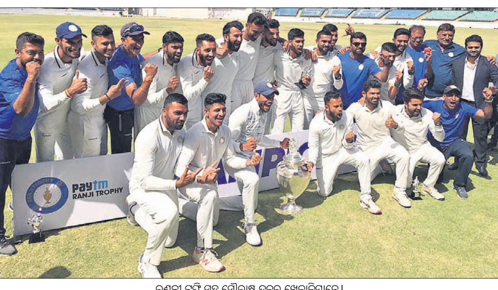
ରଣଜୀ ଟ୍ରଫି ସହ ସୌରାଷ୍ଟ୍ର ଦଳର ଖେଳାଳିମାନେ।

ରାଜକୋଟ, ୧୩ମାର୍ଚ୍ଚ (ପି.ଟି.) ଦେଶର ସର୍ବବୃହତ୍ କ୍ରିକେଟ ଟୁର୍ଣ୍ଣାମେଣ୍ଟ ରଣଜୀ ଟ୍ରଫିରେ ସୌରାଷ୍ଟ୍ର ଦୁଆ ଚାମ୍ପିୟନ ଭାବେ ଉଦ୍ଘାଟିତ ହୋଇଛି। ସ୍ଵାନାୟ ସୌରାଷ୍ଟ୍ର କ୍ରିକେଟ ଆସୋସିଏଶନ ଗ୍ରାଉଣ୍ଡରେ ଅନୁଷ୍ଠିତ ବେଙ୍ଗାଳ ବିପକ୍ଷ ଫାଇନାଲ ମ୍ୟାଚ୍ରେ ସୌରାଷ୍ଟ୍ର ପ୍ରଥମ ଇନିଂସ୍ ଅଗ୍ରଣୀ ଭିତ୍ତିରେ ବିଜୟୀ ଚାମ୍ପିୟନ ହୋଇଛି। ଗତ ସଂସ୍କରଣରେ ସୌରାଷ୍ଟ୍ର ଫାଇନାଲ ମ୍ୟାଚ୍ରେ ବିପକ୍ଷରେ ପରାସ୍ତ ହୋଇ ରନଅପ୍ରେସନ୍ତର ହୋଇଥିଲା। ତେବେ ଏଥର ଟ୍ରଫି ପୁଣି ଗିରଫ ହୋଇଛି। ପ୍ରଥମ ଇନିଂସ୍ରେ ୧୦୬ ରନର ଶତକୀୟ ପାଳି ଖେଳିଥିବା ସୌରାଷ୍ଟ୍ର ମିଡଲଅର୍ଡର ବ୍ୟାଟ୍ସମ୍ୟାନ ଅର୍ପିତ ଭାସଭତା ଦ୍ଵେୟାର ଅର୍ପ୍ ଦି ମ୍ୟାଚ୍ ବିବେଚିତ ହୋଇଛନ୍ତି। ଅନ୍ୟପକ୍ଷେ ୧୯୮୯-୯୦ ପରେ ବେଙ୍ଗାଳ ପ୍ରଥମ ରଣଜୀ ଚାଉଳ ଚିତ୍ତିବା ସ୍ଵପ୍ନ ଥିଲା।