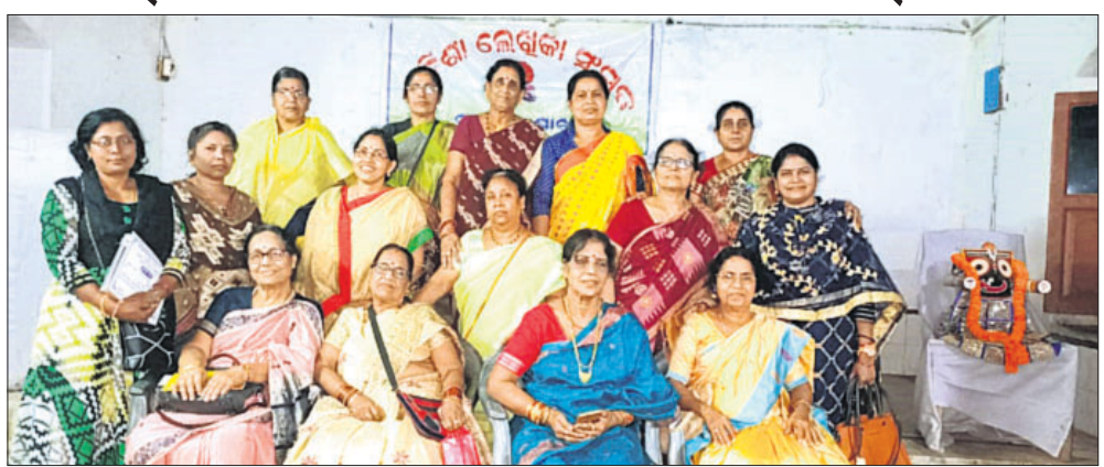
କାର୍ଯ୍ୟକ୍ରମରେ ଉପସ୍ଥିତ ଥିବା ଲେଖିକା ସଂସଦ ସଦସ୍ୟ ।