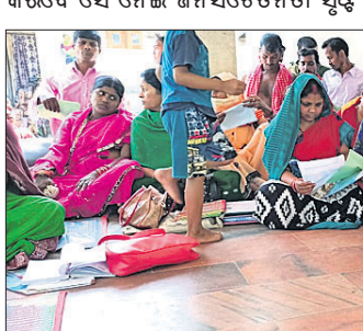
ଡାକ୍ତରୀ ଦଳ ସଚେତନତା ସୃଷ୍ଟି କରୁଛନ୍ତି ।

କରିଥିଲେ । ଏହି ଉଚ୍ଚସ୍ତରୀୟ ଡାକ୍ତରୀ ଦଳ ଗାଁରେ ପହଞ୍ଚି ମହିଳା, ପୁରୁଷ, ଯୁବକଙ୍କୁ ସଚେତନ କରିଥିଲେ । ଉଲ୍ଲେଖଯୋଗ୍ୟ ଯେ, ବଳଦିଆନୂଆଗାଁ ଗ୍ରାମର ଜଣେ ଯୁବକ ତାମିଲନାଡୁରେ ଶ୍ରମିକ ଭାବେ କାର୍ଯ୍ୟ କରୁଥିବା ସମୟରେ ଏହି ରୋଗର ଆକ୍ରାନ୍ତ ହୋଇଥିବାର ସନ୍ଦେହ କରି ଗାଁକୁ ଚାଲିଆସିଥିଲେ । ତାଙ୍କୁ ପ୍ରଥମେ ନୟାଗଡ଼ ଓ ପରେ ଭୁବନେଶ୍ୱରରେ ନିର୍ଦ୍ଦେଶ କରାଯାଇଛି ଓ ତାଙ୍କର ଉଚ୍ଚ ନିମ୍ନ ପରୀକ୍ଷା ପାଇଁ ପଠାଯାଇଥିଲା । ତେବେ ତାଙ୍କ ଉଚ୍ଚରେ କରୋନା ଭୂତାଣୁ ନ ଥିବା ସଚ୍ଚେତନତା ସୃଷ୍ଟି କରାଯାଇଛି ।