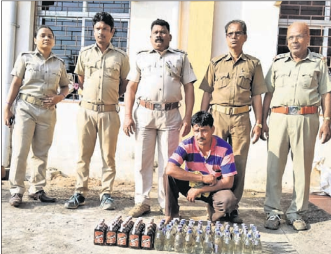
ଗିରଫ ଅଭିଯୁକ୍ତ ଓ ଜବତ ମଦ ।