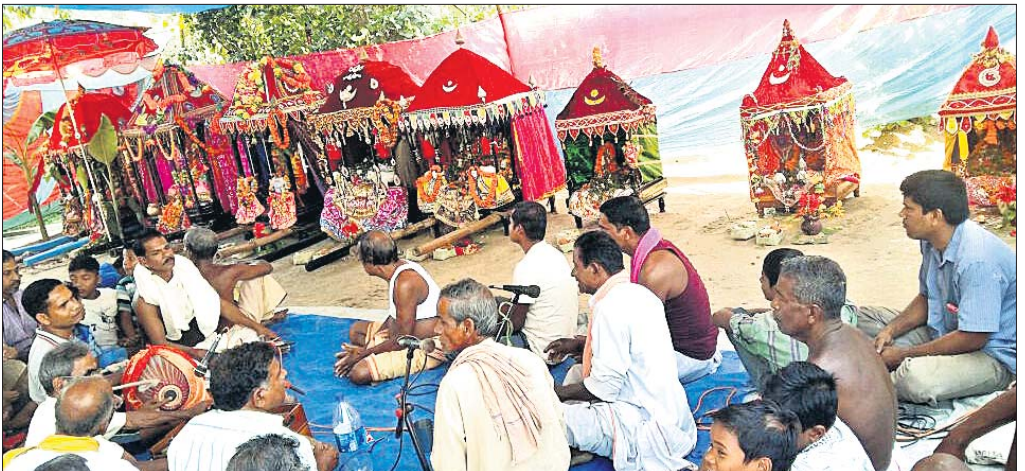
ମେଲଣରେ ସାମିଲ ହୋଇଥିବା ଦୋଳ ବିନାମ।