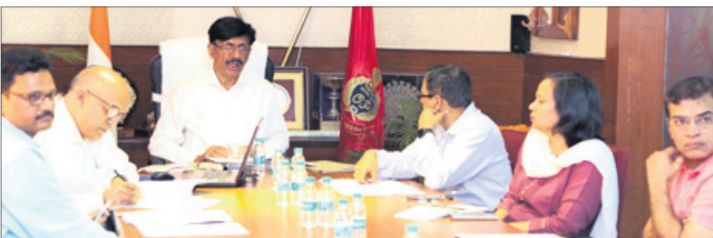
ଭିଡିଓ କନଫରେନ୍ସରେ ଆଲୋଚନାବେଳେ ଉପସ୍ଥିତ ଭିଡିଓ ଅଭିଯନ୍ତ ସହ ଅନ୍ୟମାନେ।