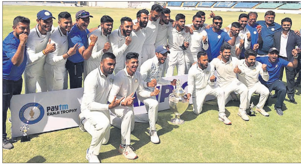
ରଣଜୀ ରୂପି ସହ ସୌରାଷ୍ଟ୍ର ଦଳର ଖେଳାଳିମାନେ।

ରାଜକୋଟ, ୧୩ମାର୍ଚ୍ଚ (ପି.ଟି.) ଦେଶର ସର୍ବବୃହତ୍ କ୍ରିକେଟ ଚୁନିମୋକ୍ଷ ରଣଜୀ ରୂପିରେ ସୌରାଷ୍ଟ୍ର ନୂଆ ଚାମ୍ପିୟନ ଭାବେ ଉଦ୍ଘାଟିତ ହୋଇଛି। ସ୍ଥାନୀୟ ସୌରାଷ୍ଟ୍ର କ୍ରିକେଟ ଆସୋସିଏଶନ ଗ୍ରାଉଣ୍ଡରେ ଅନୁଷ୍ଠିତ ବେଙ୍ଗାଳ ବିପକ୍ଷ ଫାଇନାଲ ମ୍ୟାଚ୍ରେ ସୌରାଷ୍ଟ୍ର ପ୍ରଥମ ଇନ୍ଦିୟ ଅଗ୍ରଣୀ ଭିତ୍ତିରେ ବିଜୟୀ ଚାମ୍ପିୟନ ହୋଇଛି। ଗତ ସଂସ୍କରଣରେ ସୌରାଷ୍ଟ୍ର ଫାଇନାଲ ମ୍ୟାଚ୍ରେ ବିପକ୍ଷରେ ପରାସ୍ତ ହୋଇ ରନଅପ୍ରେସରେ ସଫଳ ହୋଇଥିଲା। ତେବେ ଏଥର ତୃତୀୟ ଥର ପାଇଁ ଗଠି ମାରିଛି। ପ୍ରଥମ ଇନ୍ଦିୟରେ ୧୦୬ ରନର ଶତକୀୟ ପାଳି ଖେଳିଥିବା ସୌରାଷ୍ଟ୍ର ମିତଲଅର୍ଥର ବ୍ୟାଟ୍ସମ୍ୟାନ ଅର୍ପିତ ଭାସଭତା ଦ୍ଵେୟାର ଅର୍ପ ଦି ମ୍ୟାଚ୍ ବିବେଚିତ ହୋଇଛି। ଅନ୍ୟପକ୍ଷେ ୧୯୮୯-୯୦ ପରେ ବେଙ୍ଗାଳ ପ୍ରଥମ ରଣଜୀ ଚାଉଳ ଚିତ୍ତିବା ସ୍ଵପ୍ନ ଅଧିକାରୀ ରହିଛି। ୧୩ ବର୍ଷ ପରେ ବେଙ୍ଗାଳ ଫାଇନାଲରେ ପ୍ରବେଶ କରିଥିଲା। ଚନ୍ଦ୍ର ଛିତି ସୌରାଷ୍ଟ୍ର ପ୍ରଥମ ଇନ୍ଦିୟରେ ୧୭୧.୫ ଓଭରରେ ୪୨୫ ବ୍ୟାଟିବାରେ ସମାପନା ଥିବାରୁ ଏହିପି ଓ ଡବ୍ଲ୍ୟୁଏଚ୍ଓ ମିଆମି ଓପନ ଚେମ୍ପିୟନ୍ସ ଷ୍ଟାମିୟନ ବାତିଲ କରିଥିବାରୁ ଏହି ଇଭେଣ୍ଟ ଚଳିତ ମାସ ୨୩ ତାରିଖରୁ ଏପ୍ରିଲ ୫ ପର୍ଯ୍ୟନ୍ତ ଖେଳାଯିବାରୁ ଥିଲା। କରୋନା ଭାଇରସ ଯୋଗୁ ବାତିଲ ହେବାରେ ଏହା ପ୍ରଥମ ଚେମ୍ପିୟନ ଇଭେଣ୍ଟ ନୁହେଁ। ଏଥିପ୍ରତି ଇଣ୍ଡିଆନ୍ ଷ୍ଟେଡିଓ କାଲିଫର୍ନିଆ ଭଳି ଏହିପି ଓ ଡବ୍ଲ୍ୟୁଏଚ୍ଓ ଇଭେଣ୍ଟ ବାତିଲ ହୋଇଯାଇଛି।