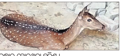
ଉଦ୍ଧାର ହୋଇଥିବା ହରିଣ।

ପାଟକୁରା, ୧୩ମାର୍ଚ୍ଚ (ତି.ଏନ୍.ଏ.) କେନ୍ଦ୍ରୀୟ ପାଣିପାଗ ବିଭାଗର ପକ୍ଷରୁ ଜଣାପଡ଼ିଛି ଯେ କୋରୁଆ ହାଇସ୍କୁଲ ନିକଟରୁ ଶୁକ୍ରବାର ଅପରାହ୍ନରେ ଗୋଟିଏ ହରିଣ ଉଦ୍ଧାର କରାଯାଇଛି।