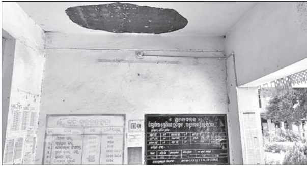
ଶ୍ରେଣୀଗୃହ କାଳ ଫାଟିବା ସହ ଛାତ୍ରରୁ ସିମେଣ୍ଟ ଖସିଛି।

ଏକଦା ଶିକ୍ଷାକ୍ଷେତ୍ରରେ ନାଁ କମାଇଥିବା ଅନୁଗୋଳ ଜିଲ୍ଲା ଛେଡ଼ିପଦା ବ୍ଲକସ୍ଥିତ ପୁରାତନ ଶିକ୍ଷାନୁଷ୍ଠାନ ଶିକ୍ଷା ଓ ପ୍ରଶିକ୍ଷଣ ପ୍ରତିଷ୍ଠାନ ଏବେ ନାନା ସମସ୍ୟାରେ ଗତି କରୁଛି। ଭିତ୍ତିଭୂମି, ଆନୁଷ୍ଠାନିକ ବ୍ୟବସ୍ଥା ପ୍ରତି ଗୁରୁତ୍ୱ ଦିଆଯାଉ ନ ଥିବା