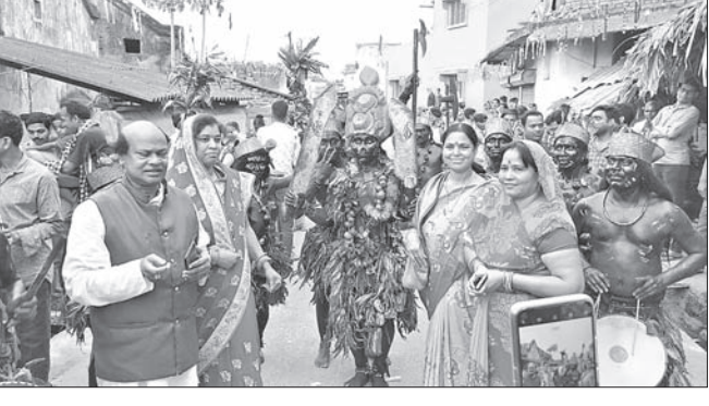
ଶୋଭାଯାତ୍ରାରେ ନୃତ୍ୟଗୀତ ପରିବେଷଣ କରାଯାଇଛି।

ବଅଁରପାଳ ବ୍ଲକ ଅନ୍ତର୍ଗତ ବନ୍ଦା ଗ୍ରାମରେ ଶୁକ୍ରବାର ପଞ୍ଚଦୋଳ ଉତ୍ସବ ପାଳିତ ହୋଇଯାଇଛି। ଅପରାହ୍ଣରେ ପ୍ରଭୁ ରାଧାକୃଷ୍ଣଙ୍କୁ ସୁସଜ୍ଜିତ ରଥରେ ଏକ ଶୋଭାଯାତ୍ରାରେ ଗ୍ରାମ ପରିକ୍ରମା କରାଯାଇଥିଲା। ଶୋଭାଯାତ୍ରାରେ ଲଢ଼ି ଖେଳ, ପାଇକ ଖେଳ, ଆଦିବାସୀ ନୃତ୍ୟ, ଘଣ୍ଟ ବାଦ୍ୟ ପରିବେଷଣ ହୋଇଥିଲା। ଉତ୍ସବରେ ଆଖପାଖ ଅଞ୍ଚଳର ବହୁ ଶ୍ରଦ୍ଧାଳୁ ଯୋଗ ଦେଇଥିଲେ। ଆୟୋଜିତ କାର୍ଯ୍ୟକ୍ରମରେ ଜିଲ୍ଲା ପରିଷଦ ସଭ୍ୟା ମଞ୍ଜୁଳତା ସାହୁ, ନିର୍ମଳ ସାହୁ, ସରପଞ୍ଚ ମନୋରମା ସାହୁ, ସମିତି ସଭ୍ୟା ସୁକୋଶିନୀ ବୈଦ୍ୟ ପ୍ରମୁଖ ଅତିଥି ଭାବେ