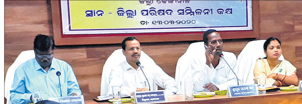
ବୈଠକରେ ଏମ୍.ଏ.ଜି.ଫ୍ରେମ୍.ର ଅଧ୍ୟକ୍ଷମାନେ ।

ଦେଶାନ୍ତର ଅଧିକାରୀ, ୧୩୩୩ ଦେଶାନ୍ତର ଗ୍ରାମ୍ୟ ଉନ୍ନୟନ ସମ୍ମିଳନୀ କକ୍ଷରେ ଶୁକ୍ରବାର ଜିଲ୍ଲା ଉନ୍ନୟନ ସମନ୍ୱୟ ଓ ପର୍ଯ୍ୟାଳୋଚନା କମିଟି (ଦିଶା) ବୈଠକ ଅନୁଷ୍ଠିତ ହୋଇଯାଇଛି । ଏମ୍.ଏ.ଜି.ଫ୍ରେମ୍. ସାହୁ ଏଥିରେ ଅଧ୍ୟକ୍ଷତା କରିଥିଲେ । ଜନପ୍ରତିନିଧି ଏବଂ ପ୍ରଶାସନିକ ଅଧିକାରୀ ସମନ୍ୱୟ ରକ୍ଷା କରି ଜିଲାର ବିକାଶ ପାଇଁ କାର୍ଯ୍ୟ କରିବାକୁ ସେ ଆହ୍ୱାନ ଦେଇଥିଲେ । ଜିଲ୍ଲାରେ ପ୍ରଧାନମନ୍ତ୍ରୀ ଆଦର୍ଶ ଗ୍ରାମ ଯୋଜନା (ସିଏମ୍.ଏ.ଜି.ଫ୍ରେମ୍.)ରେ ୨୦ ଗ୍ରାମ ଚିହ୍ନଟ ହୋଇଛି । ଆଗାମୀ ଠାକୁର ମଧ୍ୟରେ ଯୋଜନା ଅନୁଯାୟୀ ଉକ୍ତ ଗ୍ରାମରେ ସମସ୍ତ କାର୍ଯ୍ୟ ଶେଷ ହେବ । ଡାକ୍ତରୀ ନ ଥିବା ୧୬ ପଞ୍ଚାୟତରେ ଡାକ୍ତର ଖୋଲାଯିବ ବୋଲି ଏମ୍.ଏ.ଜି. ଫ୍ରେମ୍. ନାହିଁ । ବକେୟା ଦେୟ ପାଇଁ କୌଣସି ପରିସ୍ଥିତିରେ ଜଳଯୋଗାଣ ସଂସ୍ଥାର ବିଦ୍ୟୁତ୍ ସଂଯୋଗ ବିଚ୍ଛିନ୍ନ ନ କରିବାକୁ ଜିଲ୍ଲାପାଳ ସେପ୍ଟି ଏନ୍.ଜେ.ଏ. କର୍ତ୍ତୃପକ୍ଷକୁ ନିର୍ଦ୍ଦେଶ ଦେଇଛନ୍ତି । ଅଭିଯୋଗର ୪୮ ଘଣ୍ଟା ମଧ୍ୟରେ ନକଲ୍ ଅମରାପତି କରିବାକୁ ସେ ବିଦିଷ୍ଟ ଚାରିଦ୍ କରିଛନ୍ତି । ପ ଞ୍ଚ । ଯ ତ ରେ ଏମ୍.ଏ.ଜି.ଫ୍ରେମ୍.ସଂସ୍ଥାରେ ୧୦୦% ସଫଳତା, ଖାଦ୍ୟ ସୁରକ୍ଷା ଯୋଜନାକୁ ଅଯୋଗ୍ୟକୁ ବାଦ୍ ଦେଇ ଯୋଗ୍ୟକୁ