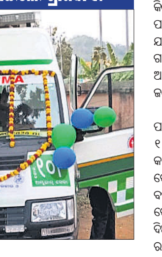
ନୂତନ ଆୟୁଲ୍ୟାନ୍ସ ।

କିଶୋରନଗର ବ୍ଲକ ବଇଣ୍ଡା ଅଞ୍ଚଳକୁ ଏକ ନୂତନ ୧୦୮ ଆୟୁଲ୍ୟାନ୍ସ ପଞ୍ଚାୟତବାସୀଙ୍କୁ କରୁଛି । ଦୀର୍ଘବର୍ଷ ହେବ ଏଠାରେ ଥିବା ୧୦୮ ଆୟୁଲ୍ୟାନ୍ସ ଭାଙ୍ଗି ଯାଇଥିବା ବେଳେ ତୋରୁରେ ବଡ଼ି ଭିଡି ସେବା ଯୋଗାଇ ଦିଆଯାଇଥିଲା । ଏ ସମ୍ପର୍କରେ ଗତ ୩ ତାରିଖରେ ଏକ ଖବର ‘ଧରତ୍ରୀ’ରେ ପ୍ରକାଶ ପାଇବା ପରେ ବିଭାଗ ପକ୍ଷରୁ ନୂତନ ଆୟୁଲ୍ୟାନ୍ସ ଯୋଗାଇ ଦିଆଯାଇଛି । ଏଥିପାଇଁ ବଇଣ୍ଡା ଅଞ୍ଚଳବାସୀ ‘ଧରତ୍ରୀ’କୁ କୃତଜ୍ଞତା ଜଣାଇଛନ୍ତି । ପ୍ରକାଶ ଯେ, ଅନୁଗୋଳ ଜିଲାର କିଶୋରନଗର ଓ ଆଠମଲିକ ବ୍ଲକର ୧୩ଟି ପଞ୍ଚାୟତବାସୀଙ୍କୁ କରୁଛି । ସ୍ୱାସ୍ଥ୍ୟସେବା ଯୋଗାଇ ଦେବା ପାଇଁ ସରକାର ବହୁ ପୂର୍ବରୁ ଏକ ୧୦୮ ଆୟୁଲ୍ୟାନ୍ସ ପ୍ରଦାନ କରିଥିଲେ । ହେଲେ ଦୀର୍ଘବର୍ଷ ହେଲେ ଆୟୁଲ୍ୟାନ୍ସରୁ ବୁଲି ଚାଲି ଯାଇଥିବା ବେଳେ ତୋରୁରେ ବଡ଼ି ଭିଡି ସେବା ଯୋଗାଇ ଦିଆଯାଇଥିଲା । ଏ ସମ୍ପର୍କରେ ଗତ ୩ ତାରିଖରେ ଏକ ଖବର ‘ଧରତ୍ରୀ’ରେ ପ୍ରକାଶ ପାଇବା ପରେ ବିଭାଗ ପକ୍ଷରୁ ନୂତନ ଆୟୁଲ୍ୟାନ୍ସ ଯୋଗାଇ ଦିଆଯାଇଛି । ଏଥିପାଇଁ ବଇଣ୍ଡା ଅଞ୍ଚଳବାସୀ ‘ଧରତ୍ରୀ’କୁ କୃତଜ୍ଞତା ଜଣାଇଛନ୍ତି ।