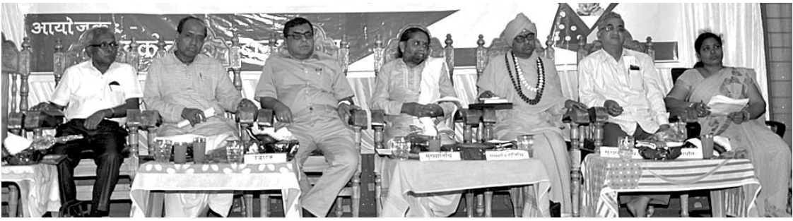
ରାଷ୍ଟ୍ରୀୟ ସଂଗୋଷ୍ଠୀ ଉଦ୍‌ଯାପନ କାର୍ଯ୍ୟକ୍ରମରେ ମଞ୍ଚାସୀନ ଅତିଥି।

ସମ୍ପର୍କରେ ଠିକଣା ସମୟରେ ତଥ୍ୟ ଦେବାକୁ ବେସରକାରୀ ସଂସ୍ଥାଗୁଡ଼ିକୁ ନିର୍ଦ୍ଦେଶ ଦିଆଯାଇଛି। ଏତଦ୍ୱ୍ୟତୀତ ଡାକ୍ତରଖାନାକୁ ବାହାରୁଥିବା କଠିନ ଓ ତରଳ ବର୍ଣ୍ଣସବୁର ସଂଗ୍ରହ ଏବଂ ପୃଥକ କରିବା ସଂକ୍ରାନ୍ତରେ ମଧ୍ୟ ଜିଲ୍ଲାପାଳ କଡ଼ା ନିର୍ଦ୍ଦେଶ ଦେଇଛନ୍ତି। କରୋନା ଭୂତାଣୁ ସମ୍ପର୍କରେ ପ୍ରତ୍ୟେକ ସକାଳେ ପୌରସଂସ୍ଥା ପକ୍ଷରୁ ସହରରେ ପ୍ରଚାର କରାଯିବା ସହ ସିଂହଦ୍ୱାର ନିକଟସ୍ଥ ସୂଚନା କେନ୍ଦ୍ରରେ ମଧ୍ୟ ସତେତନତା ବାର୍ତ୍ତା ପ୍ରଦାନ କରାଯିବ ବୋଲି ନିଷ୍ପତ୍ତି ହୋଇଛି।