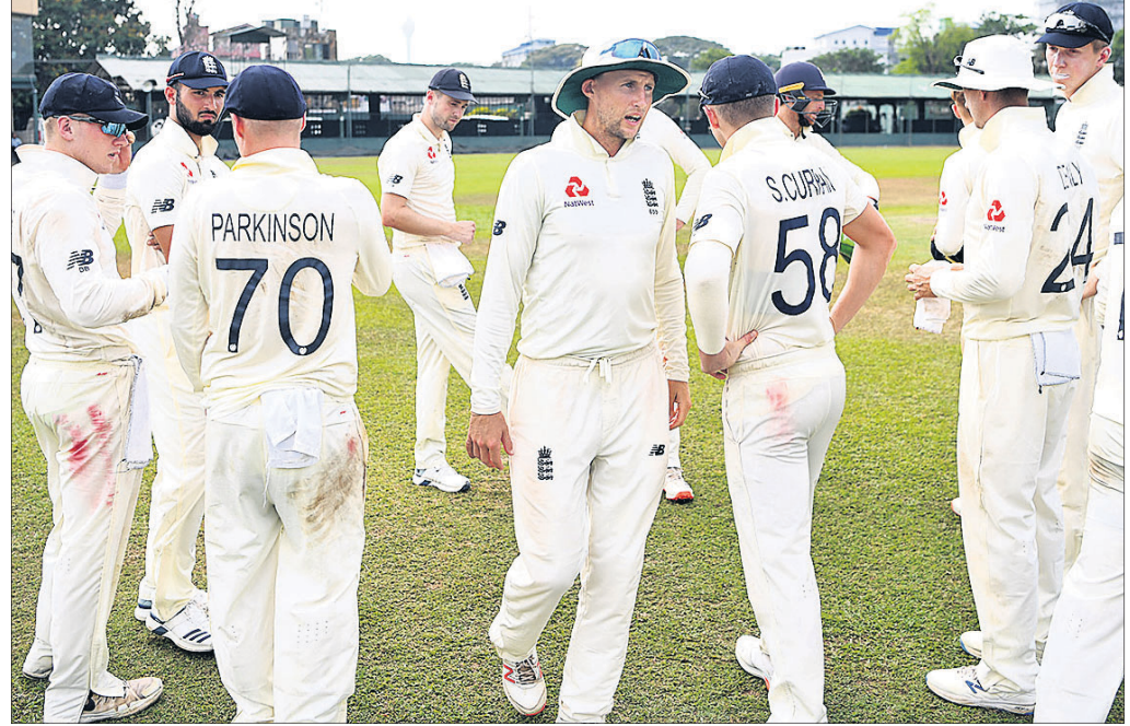
ଇଂଲଣ୍ଡ କ୍ରକେଟ ଦଳର ଶ୍ରୀଲଙ୍କା ରୁର୍ ବାତିଲ ହେବା ପରେ ଅଧିନାୟକ କୋ ରୁର୍ ଖେଳାଳିଙ୍କ ସହ ଆଲୋଚନା କରୁଛନ୍ତି ।

ଲଣ୍ଡନ, ୧୩୩୩ (ପି.ଟି.) କରୋନା ଭାଇରସ୍‌କ୍ରମିତ କାରଣରୁ ଶ୍ରୀଲଙ୍କା ଗସ୍ତରେ ଥିବା ଇଂଲଣ୍ଡ କ୍ରକେଟ ଦଳ ଏହାର ରୁର୍ ବାତିଲ କରିଛି । ଇଂଲଣ୍ଡ କ୍ରକେଟ ଦଳ କଲମ୍ବୋରେ ଉପସ୍ଥିତ ଥିବା ବେଳେ କରୋନା ଭାଇରସ୍ ଆତଙ୍କ ଘୋରୁ ଖେଳାଳିଙ୍କ ଉଦ୍ଧାର ଶାରୀରିକ ଓ ମାନସିକ ସ୍ତରରେ ଅସ୍ଥିରତା ଥିବ । ସ୍ୱଦେଶ ଫେରିବା ପରେ ସେମାନଙ୍କୁ ରୁର୍ ଫେରିବା ପରିବାର ନିକଟକୁ ପଠାଇ ଦିଆଯିବ ।