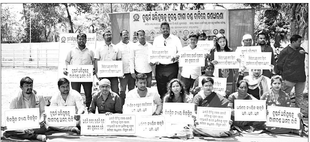
ଦିଲ୍ଲୀ ନିର୍ଭୟା ହତ୍ୟାକାଣ୍ଡରେ ସମ୍ପୂର୍ଣ୍ଣ ଦୋଷୀମାନଙ୍କୁ ତୁରନ୍ତ ଫାଣୀ ଦଣ୍ଡରେ ଦଣ୍ଡିତ କରିବା ଦାବିରେ ଶୁକ୍ରବାର ଓଡ଼ିଶା ସମାଜସେବା ମହାସଂଘ ପକ୍ଷରୁ ଲୋକସଭା ପିଏମଜିଠାରେ ବିଆଯାଇଥିବା ଧାରଣା।

ମଙ୍ଗଳ ରାତି, ବୁଧ ପାହାଡ଼ି; ଯେତେ ଗଲେ ତେଣେ ଯଶ ପାଆନ୍ତି। ମଙ୍ଗଳବାର ରାତ୍ରି ଶେଷ ପ୍ରହର ତଥା ବୁଧବାରର ପାହାଡ଼ିଆ ସମୟ ସବୁଠାରୁ ଭଲ ବା ଶୁଭ ସମୟ ହୋଇଥାଏ। ଏହି ବେଳାରେ ଯେଉଁ କାମ କଲେ ବା କ୍ଷୁଦ୍ର କାର୍ଯ୍ୟ ଗଲେ ଯଶ, ସମ୍ମାନ ପ୍ରାପ୍ତ ହେଉଥିବା ଅର୍ଥରେ ଏଭଳି ଉକ୍ତି ପ୍ରକାଶ କରାଯାଇଛି। ମୋହିଲି ମୁଁ ସକ ଦହି, ହାତ ବାନ୍ଧୁବନ୍ଧୁ ଗୁଡ଼େଇବି ବୋଲି; ପାଟରାଣୀ ସାଙ୍ଗେ ସାଙ୍ଗେ। ସାଧାରଣତଃ ଯାହାଠାରୁ କିଛି ଲାଭ ବା ଫାଇଦା ପାଇବାର ଆଶା ଥାଏ ତାକୁ ସର୍ବଦା ନିଜ ହାତପୁଠାରେ ଧରି ରଖିବାକୁ ଚେଷ୍ଟା କରାଯାଇଥାଏ। ମନରେ ଅଭିସନ୍ଧି ରଖି ତା' ସହ ଭଲେଇ ହୋଇ ମିଶି ସମ୍ପର୍କ ବଢ଼ାଯାଇଥାଏ। ବାନ୍ଧୁବନ୍ଧୁ ପାଇବା ଆଶାରେ ପାଟରାଣୀ ସଙ୍ଗେ ଭାବପ୍ରାପ୍ତି ରଖାଯିବ। ଭଲ ନିଜର ସ୍ୱାର୍ଥସିଦ୍ଧି ପାଇଁ ପରକୁ ଆପଣା କରାଯିବ। ଅର୍ଥରେ ଏଭଳି ଉକ୍ତି ଉଲ୍ଲେଖ କରାଯାଇଛି। ନିର୍ବାଚିତ ଭଗବାନି, ପ୍ରବାଦ, ପ୍ରବଚନ ଓ ଅନ୍ୟାନ୍ୟ -ପ୍ରାଚୀ ସାହିତ୍ୟ ପ୍ରତିଷ୍ଠାନ