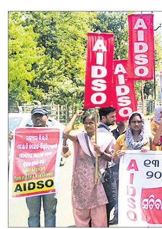
ବିଭିନ୍ନ ଦାବି ନେଇ ଏଆଇଡିଏସ୍ ପକ୍ଷରୁ ଶୁକ୍ରବାର ଭୁବନେଶ୍ୱର ଲୋୟର ପିଏମଜିରେ ବିକ୍ଷୋଭ ପ୍ରଦର୍ଶନ।

ଡେଲାଇ, ୧୩୩୩ (ଡି.ଏନ୍.ଏ.): ଅଗିତକ ପଞ୍ଚାୟତର ଜୟପୁର ଗ୍ରାମରେ ଶୁକ୍ରବାର ଅଗ୍ନିକାଣ୍ଡ ଘଟି ସହସ୍ରଦେ ଘାଟଣା ଏକ ବଖରା ସହ ଆସାମତପୁର ଜଳିଯାଇଛି। ଡେଲାଇ ଅଗ୍ନିଶମ କର୍ମଚାରୀ ପହଞ୍ଚି ନିଆଁକୁ ଆୟତ୍ତ କରିଥିଲେ।