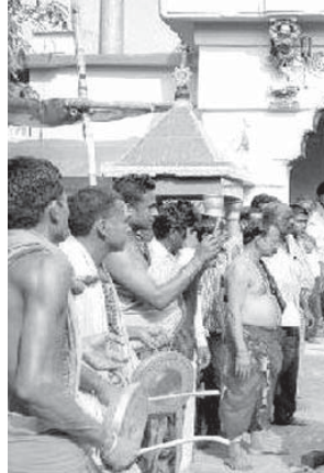
ପାଠୁଆମାନେ ପାଠୁଆ ନୃତ୍ୟ କରୁଛନ୍ତି।

ହୁଳହୁଳି ସହ ମନ୍ଦିର ବେଢାରେ ୩ଥର ପରିକ୍ରମା କରିବା ପରେ ନେତକୁ ମନ୍ଦିର ବୁଢ଼ା ଉପରକୁ ନିଆଯାଇଥିଲା। ମନ୍ଦିର ବଜ୍ରକୁ ଘିଅ ଏବଂ ପଞ୍ଚାମୃତରେ ସ୍ନାନ କରାଯିବା ପରେ ନେତ ବନ୍ଧାଯାଇଥିଲା। ଝଙ୍କଡ଼ରୁ ଆସିଥିବା ପାଠୁଆମାନେ