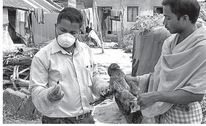
କୁକୁଡ଼ାଠାରୁ ରକ୍ତ ନମୁନା ସଂଗ୍ରହ କରାଯାଇଛି।

ବ୍ରହ୍ମଗିରି, ୧୩।୩।(ଡି.ଏନ୍.ଏ.): ଅଧିକାଂଶ ଭାବେ ମୃତ୍ୟୁ ହେଉଛି। ୪ ଦିନ ଭିତରେ ଏକ ଶହରୁ ଊର୍ଦ୍ଧ୍ୱ କାଉ ମରିଥିବାର ଜଣାପଡ଼ିଛି। ଏହି ଖବର ଗଣମାଧ୍ୟମରେ ପ୍ରକାଶ ପାଇବା ପରେ ପ୍ରାଣି ଚିକିତ୍ସା ବିଭାଗ ତତ୍ପର ହୋଇଛି। ଏ ନେଇ ଶୁକ୍ରବାର ଭକ୍ତ ଗ୍ରାମରେ ପହଞ୍ଚି ବିଭିନ୍ନ କୁକୁଡ଼ାମାନଙ୍କଠାରୁ ରକ୍ତ, ମଳ, ନାକ ଓ ପରିବେଶର ନମୁନା ସଂଗ୍ରହ କରାଯାଇଛି। ସ୍ୱତନ୍ତ୍ରାୟୋଗ୍ୟ, ଭକ୍ତ ଏହି ନମୁନାକୁ ପୁଲନଖରା ପରାକ୍ଷା ନିମନ୍ତେ ପଠାଯିବ ବୋଲି ଜଣାପଡ଼ିଛି।