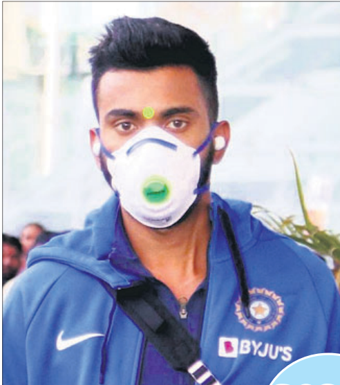
ମାସ୍କ ପିନ୍ଧି ଲକ୍ଷ୍ମୀ ବିମାନ ବନ୍ଦରରେ ଅଧିନାୟକ ବିରାଟ କୋହଲି ଓ ଲୋକେଶ ରାହୁଲ ।

କ୍ଷୁଦ୍ରାଦିତ୍ୟ, ୧୩୩୩(ପି.ଟି.) କରୋନା ଭାଇରସ୍ ଆତଙ୍କ କ୍ରୀଡ଼ା ଜଗତରେ ଏହାର କାୟା ବିସ୍ତାର କରିବାରେ ଲାଗିଛି । ଭାରତୀୟ କ୍ରୀଡ଼ା ମଧ୍ୟ ଏଥିଯୋଗୁ ଗୁରୁତର ପ୍ରଭାବିତ ହୋଇଛି । ବିଶ୍ୱ ସ୍ୱାସ୍ଥ୍ୟ ସଙ୍ଗଠନ ପକ୍ଷରୁ ଏହାକୁ ବିଶ୍ୱ ମହାମାରୀ ଘୋଷଣା ପରେ ସବୁଆଡ଼େ ସର୍ବକାରୀ ଅବଲମ୍ବନ କରାଯାଇଛି । ଏହାର ଏକ ଅଂଶସ୍ୱରୂପ ଚଳିତ ଭାରତ-ଦକ୍ଷିଣ ଆଫ୍ରିକା ଦିନିକିଆ କ୍ରକେଟ ସିରିଜର ଲକ୍ଷ୍ମୀ ଓ କୋଲକାତାରେ ହେବାକୁଥିବା ଅବଶିଷ୍ଟ ୨ଟି ମ୍ୟାଚକୁ ବାତିଲ କରାଯାଇଛି । ଭାରତରେ ସଂକ୍ରମିତଙ୍କ ସଂଖ୍ୟା ବୃଦ୍ଧି ପାଇଥିବାରୁ ଦକ୍ଷିଣ ଆଫ୍ରିକା ଖେଳାଳିମାନେ ଖେଳ ଜାରି ରଖିବାକୁ ଅନିଚ୍ଛା ପ୍ରକାଶ କରିଥିଲେ । ଦୁଇ ଦିନ ମଧ୍ୟରେ ପ୍ରଥମ ଦିନିକିଆ ବର୍ଷା ଯୋଗୁ ବାତିଲ ହୋଇ ଯାଇଥିଲା । ଦ୍ୱିତୀୟ ଦିନିକିଆ ପାଇଁ ଡ୍ରାମାଟିକ ଭାବେ ବାତିଲ ହୋଇଥିଲା ।