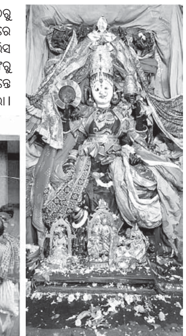
କାକଟପୁର ଆରାଧ୍ୟ ଠାକୁରାଣୀ ମା' ମଙ୍ଗଳା।

ପ୍ରାଣ ନଦୀର ଘଣ୍ଟତୋଳା ବୁଢ଼ୁ ପରିକ୍ରମା କରିବା ପରେ ନେତକୁ ମନ୍ଦିର ପାଠୁଆ ନୃତ୍ୟ କରିଥିଲେ। ପୋଲିସ ପ୍ରଶାସନ ଓ ମନ୍ଦିର ପ୍ରଶାସନ ତରଫରୁ ଶାନ୍ତିଶୃଙ୍ଖଳା ସହ ଦର୍ଶନ ନିମନ୍ତେ ଆବଶ୍ୟକ ବ୍ୟବସ୍ଥା କରାଯାଇଥିଲା।