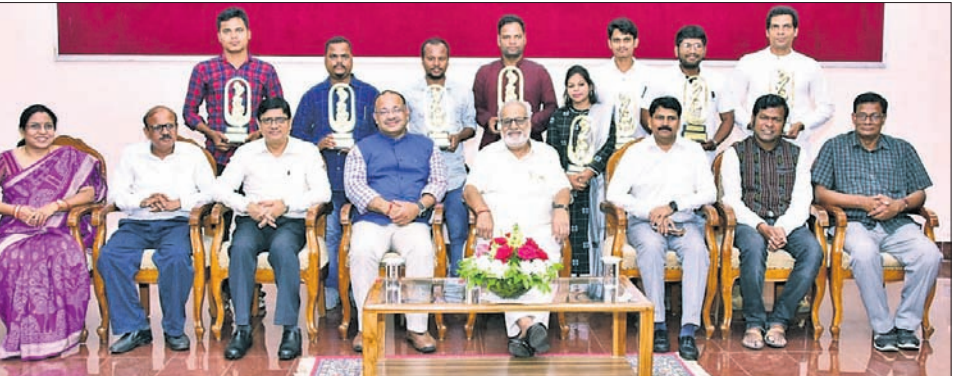
ଉତ୍ସବରେ ରାଜ୍ୟପାଳ ପ୍ରଫେସର ଗଣେଶୀ ଲାଲଙ୍କ ସହ ପୁରସ୍କୃତ ଶିଳ୍ପୀ ଓ ଅତିଥିବୃନ୍ଦ।