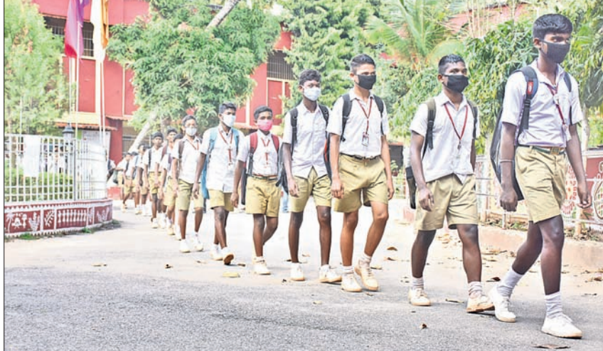
କରୋନା ପାଇଁ ଶୁକ୍ରବାର ଭୁବନେଶ୍ୱରସ୍ଥିତ ଯୁନିଟ୍-୩ କ୍ୟାମ୍ପସ୍‌ରୁ ଛୁଟି ହେବା ପରେ ଛାତ୍ରମାନେ ପୁହୁଁରେ ମାସ ପିନ୍ଧି ଫେରୁଛନ୍ତି।