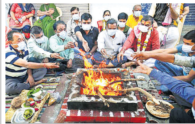
କରୋନା ରୋଗୀଙ୍କୁ ଆଶୁ ଆରୋଗ୍ୟ କାମନା କରି ଅଭିନନ୍ଦନାରେ ଲୋକେ ଯତ୍ନ କରୁଛନ୍ତି।