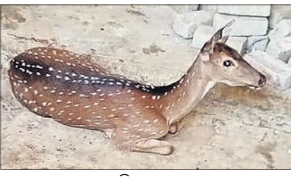
ଉଦ୍ଧାର ହୋଇଥିବା ହରିଣ। ହେପାଜତକୁ ନେଇ ଯାଇଥିଲେ। ପରିବେଶରେ ଅଧିକୃତ ଓ ଅବାଧ ଗଛକଟା ଯୋଗୁ ହରିଣମାନେ ଜଙ୍ଗଲ ଛାଡ଼ି ଗାଁ ଆଡ଼କୁ ମୁହାଁଉଛନ୍ତି। ଏଥିପ୍ରତି ବନବିଭାଗ ଦୃଷ୍ଟି ଦେବାକୁ ସାଧାରଣରେ ଦାବି ହୋଇଛି।