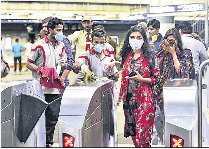
କାରୋନା ସଂକ୍ରମଣ ରୋକିବା ପାଇଁ ନୂଆଦିଲ୍ଲୀ ରାଜୀବ ଚୌକ ମେଡ଼ିକାଲ୍ ସେଣ୍ଟର ପଥକୁ କର୍ମଚାରୀମାନେ ସଫା କରୁଛନ୍ତି।

ବିଶ୍ୱବ୍ୟାପୀ କରୋନା ଭାଇରସ୍‌ଜନିତ ମୃତ୍ୟୁସଂଖ୍ୟା ଶୁଣ୍ଠିବାର ୫, ୦୪୩ରେ ପହଞ୍ଚିଛି। କେବଳ ଉତ୍ତର ଗୁଳ୍ମ ଚାନ୍ଦନୀରେ ୩, ୧୭୬ ମୃତ୍ୟୁ ଏଥିଲାଗି ଚିହ୍ନିଲାଣି। ଏହା ବ୍ୟତୀତ ଇଟାଲୀରେ ୧, ୦୧୬, ଇରାନରେ ୫୧୪ ବ୍ୟକ୍ତି ଏହି ରୋଗରେ ସଂକ୍ରମିତ ହୋଇ ପ୍ରାଣ ହରାଇଲେଣି। ଗତ ତିନିସପ୍ତାହରୁ ଏପର୍ଯ୍ୟନ୍ତ ମୋଟ ୧୨୧ ଦେଶର ୧, ୩୪, ୩୦୦ ଲୋକ କରୋନା ସଂକ୍ରମିତ ହୋଇଥିବା ରିପୋର୍ଟ ପ୍ରକାଶ ପାଇଛି। କ୍ରମଶଃ ଏହା ଅନ୍ୟ ଦେଶଗୁଡ଼ିକୁ ବ୍ୟାପିବାରେ ଲାଗିଛି। ବିଶ୍ୱ ସ୍ୱାସ୍ଥ୍ୟ ସଙ୍ଗଠନ(ଡବ୍ଲ୍ୟୁଏଚ୍‌ଓ)