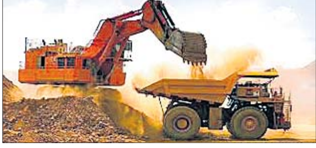
■ ଶ୍ରମିକଙ୍କ ପୁନଃନିଯୁକ୍ତି ନେଇ ସରକାରଙ୍କ ଅସ୍ପଷ୍ଟ ନୀତି ■ ଧାରଣା, ଆନ୍ଦୋଳନ ଓ ବିକ୍ଷୋଭ ପ୍ରଦର୍ଶନ ନେଇ ଚାଲିଛି ପ୍ରତିଯୋଗିତା

ରାଜ୍ୟ ସରକାରଙ୍କ ଖଣି ନିଲାମ ପ୍ରକ୍ରିୟା ପରେ ସ୍ଥାନୀୟ ଖଣିରେ କାର୍ଯ୍ୟରତ ଶ୍ରମିକ, ବନ୍ଦ ଥିବା ଖଣିଗୁଡ଼ିକର ଶ୍ରମିକ ଏବଂ ଖଣି ସଂସ୍ଥା ସହିତ ପ୍ରତ୍ୟକ୍ଷ ଓ ପରୋକ୍ଷ ଭାବେ ନିର୍ଭରଶୀଳ ଥିବା ହଜାର ହଜାର ଲୋକଙ୍କ ଜୀବନ ଜୀବିକା ସମସ୍ୟା ନେଇ ପ୍ରଶ୍ନାଚାରୀ ସୃଷ୍ଟି ହୋଇଛି । ପୂର୍ବରୁ ଖଣିରେ କାର୍ଯ୍ୟ କରୁଥିବା ଶ୍ରମିକ, କର୍ମଚାରୀଙ୍କୁ ପୁନଃ ନିଯୁକ୍ତି ମିଳିବ କି ନାହିଁ ତାହା ଏଯାଏଁ ଅସ୍ପଷ୍ଟ ରହିଛି । ସରକାରଙ୍କ ପକ୍ଷରୁ ଏନେଇ କୌଣସି ନିଷ୍ପତ୍ତି ନିଆଯାଇ ନ ଥିବା ଅଭିଯୋଗ ହେଉଛି । ଏଭଳି ସ୍ଥିତିରେ ସ୍ଥାନୀୟ ଖଣି ଅଞ୍ଚଳରେ ଧାରଣା, ଆନ୍ଦୋଳନ ଓ ବିକ୍ଷୋଭ ପ୍ରଦର୍ଶନ ଏକ ନିତରଣିଆ ଘଟଣା ହୋଇଛି । ଏପରି କି କେତେକ ସ୍ଥାନୀୟ ଗୋଷ୍ଠୀ ମଧ୍ୟରେ ଏ