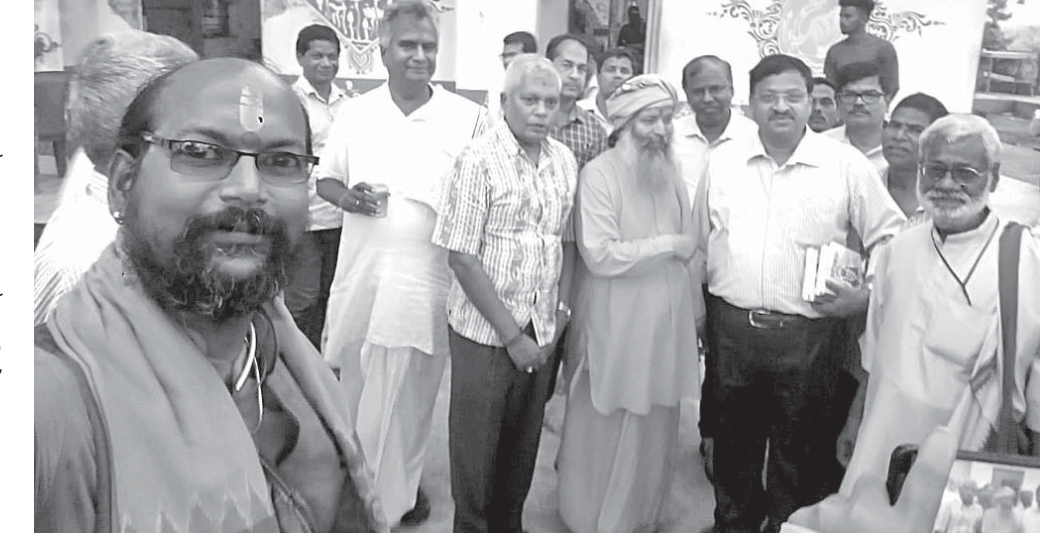
ପ୍ରାଚୀ ନଦୀର ସୁରକ୍ଷା ପାଇଁ ଅଣା ଭିଡ଼ିଥିବା ପ୍ରାଚୀ ସୁରକ୍ଷା ସମିତିର କର୍ମଚାରୀମାନେ।