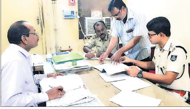
ପୋଲିସ ଅଧିକାରୀ ତଦନ୍ତ କରୁଛନ୍ତି ।