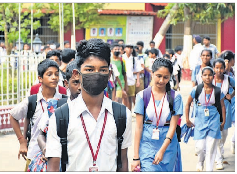
ଭୁବନେଶ୍ୱରସ୍ଥିତ ସୂନି-୧୩ କ୍ୟାମ୍ପସ୍‌ରେ ଶାଳସୁଲ ଛାତ୍ରାଛାତ୍ରୀମାନେ ମାସ୍କପିନ୍ଧି ସ୍କୁଲ ଛୁଟି ପରେ ଫେରୁଛନ୍ତି।

ଭୁବନେଶ୍ୱର, ୧୩ମାର୍ଚ୍ଚ(ବୁଧବାର) କରୋନା ଭୂତାଣୁ ସମଗ୍ର ବିଶ୍ୱକୁ ଗ୍ରାସ କରିବାରେ ଲାଗିଛି। ଭାରତରେ ଏହାର କାୟା ବିସ୍ତାର ହେଲାଣି। ଏହି ମାରମୂଳ ଭୂତାଣୁ ପାଇଁ ଏ ପର୍ଯ୍ୟନ୍ତ କୋଣସି ଔଷଧ ବାହାରି ପାରିନାହିଁ। କେବଳ ସତର୍କତା ହିଁ ରୋଗ ବ୍ୟାପିବାକୁ ରୋକି ପାରିବ। ରାଜ୍ୟ ସରକାର ଏହି ମହାମାରୀକୁ ରାଜ୍ୟ ବିପତ୍ତି ଭାବେ ଘୋଷଣା କରିଛନ୍ତି। ଏଥିସହିତ କରୁନା ଜନସାମ୍ମୁଖ୍ୟ ସେବା ପାଇଁ ୨୦୦ କୋଟି ଟଙ୍କାର ବ୍ୟୟ ବରାଦ କରାଯାଇଛି। ଶୁକ୍ରବାର ମୁଖ୍ୟମନ୍ତ୍ରୀ ନବୀନ ପଟ୍ଟନାୟକ ବିଧାନସଭାରେ ଏହି ଘୋଷଣା କରିଛନ୍ତି। ଶୁକ୍ରବାର ରାଜ୍ୟ