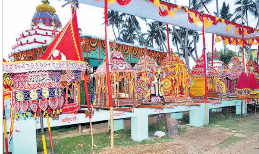
ପଞ୍ଚୁବୋଲ ଅବସରରେ ପୁରୀ ସମଗ୍ରା ମେଳଣ ପଡ଼ିଆରେ ଏକତ୍ରିତ ହୋଇଥିବା ବୋଲ ବିନା।