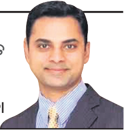
— କୃଷ୍ଣମୂର୍ତ୍ତି ସୁବ୍ରହ୍ମଣ୍ୟନ, ମୁଖ୍ୟ ଅର୍ଥନୈତିକ ପରାମର୍ଶଦାତା

କରୋନା ଭାଇରସ ଯୋଗୁ ନିବେଶକଙ୍କ ମନରେ ଉତ୍ପତ୍ତି ହେବା ଭୟ ଏବଂ ପ୍ରଭାବିତ ମନୋଭାବକୁ ଠିକ୍ କରିବା ଦିଗରେ ସରକାର ଆବଶ୍ୟକ ପଦକ୍ଷେପ ନେଉଛନ୍ତି।