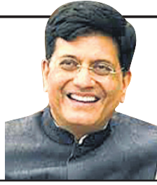
— ପୀୟୂଷ ଗୋ ଯଲ, ରେଳମନ୍ତ୍ରୀ

ରେଳ ଭିଡ଼ିଭୁମିରେ ୫୦ ଲକ୍ଷ କୋଟି ନିବେଶ ଯୋଜନା ଅନ୍ତର୍ଗତ ଘରୋଇ ନିବେଶ ଉପରେ ମଧ୍ୟ ସରକାର ଗୁରୁତ୍ୱ ଦେଉଛନ୍ତି।