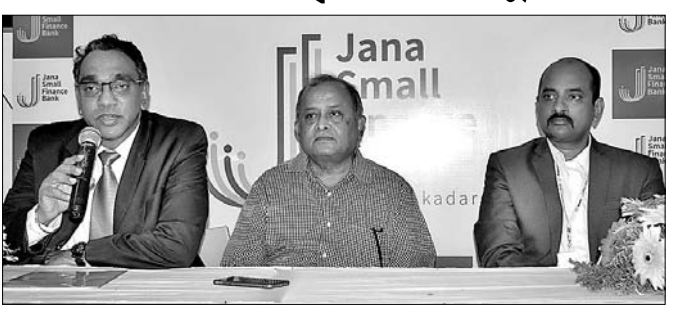
ସମ୍ମିଳନୀରେ ଯୋଗଦେଇଥିବା ବ୍ୟାଙ୍କର ଉଚ୍ଚ ପଦାଧିକାରୀ।