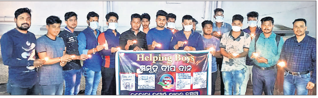
କରୋନା ରକ୍ଷା ପାଇଁ ମନ୍ଦିରରେ ଦୀପ ଦାନ କରାଯାଇଛି।

ବାରିପଦା ଅଫିସ, ୧୪୩୩ ସାରା ବିଶ୍ଵରେ ମହାମାରୀ ରୂପ ନେଇଥିବା କରୋନା ଭାଇରସ ଦାଉରୁ ରକ୍ଷା ପାଇବା ପାଇଁ ଗ୍ରାମ୍ୟ 'ହେଲିଂ ବୟ' ଅନୁଷ୍ଠାନ ପକ୍ଷରୁ ଗ୍ରାମ୍ୟ ମା' ଅମିକା ମନ୍ଦିରରେ ବର୍ତ୍ତମା ସକାଶେ ରାଜ୍ୟ ସରକାର ଆସନ୍ତା ଶନିବାର ଦୀପଦାନ କରାଯାଇଥିଲା।