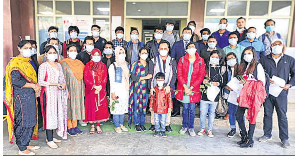
ଚାନ୍ଦନୀରୁ ଫେରି ନୂଆଦିଲ୍ଲୀର ଛାଓଲାନିଆ ଆଇସିସିସି କ୍ୱାରାଣ୍ଟାଇନ୍ କେନ୍ଦ୍ରରେ ଥିବା ଭାରତୀୟ ସେନାକୁ କରୋନା ସଂକ୍ରମଣ ହୋଇ ନ ଥିବା ପରୀକ୍ଷା କରାଯାଇଛି।

ଜେନେଭା, ୧୪ମାର୍ଚ୍ଚ ମୁରୋପ ଏବେ ମାରାତ୍ମକ କରୋନା ଭୂତାଶୁର ନୂଆ କେନ୍ଦ୍ରସ୍ଥଳ ପାଇଚିଛି ବୋଲି ବିଶ୍ୱ ସ୍ୱାସ୍ଥ୍ୟ ସଂଗଠନ (ଡବ୍ଲ୍ୟୁଏଚ୍ଡ) ପକ୍ଷରୁ ଘୋଷଣା କରାଯାଇଛି।