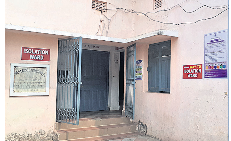
ବାରିପଦା ପିଆରଏମ୍ ମେଡିକାଲରେ କରୋନା ପାଇଁ ଖୋଲିଥିବା ସ୍ଵତନ୍ତ୍ର ଝାଡ଼ି।

କରୋନା ଭାଇରସ୍ ସେଭଳି ନ ବ୍ୟାପିବ ସେଥିଲାଗି ବିଭିନ୍ନ ପ୍ରକାରରେ ସଚେତନତା ସୃଷ୍ଟି କରାଯାଇଛି। ଏହି ରୋଗ ବିଶ୍ଵାସ୍ୟା ଆଟକ ଖୋଲାଇଥିବାରୁ ଏ ଦିଗରେ ସଚେତନତା ସୃଷ୍ଟି ଲାଗି ଏଠାକାର ପ୍ରଶାସନ ତପ୍ତର ହୋଇ ଉଠିଛି। ଏହି ପରିପ୍ରେକ୍ଷାରେ ବାରିପଦା ପିଆରଏମ୍ ମେଡିକାଲରେ କରୋନା ରୋଗୀଙ୍କ ପାଇଁ ଖୋଲା ଯାଇଛି ସ୍ଵତନ୍ତ୍ର ଆଇସୋଲେସନ ଝାଡ଼ି, ଯେଉଁଥିରେ ୬ଟି ଶଯ୍ୟା ବ୍ୟବସ୍ଥା ରହିଛି। ଯଦି କେହି ସନ୍ଦିଗ୍ଧ ରୋଗୀ ଆସନ୍ତି ତାଙ୍କୁ ସେଠାରେ ରଖି ସ୍ଵତନ୍ତ୍ର ଭାବେ ଚିକିତ୍ସା କରାଯାଇପାରିବ। ମାସ୍କ, ଗ୍ଲୋଭସ୍, ସାନିଟାଇଜର, ପିପିୟୁ ଯଥେଷ୍ଟ ମହତ୍ତ୍ଵ ରଖାଯାଇଛି ବୋଲି ପିଆରଏମ୍ ମେଡିକାଲ୍ ପକ୍ଷରୁ ଏଠାରେ ସୂଚନା ଦିଆଯାଇଛି। ଅନ୍ୟପକ୍ଷେ ଜିଲ୍ଲା ପ୍ରଶାସନ ଆସନ୍ତା ୩୧ ତାରିଖ ପର୍ଯ୍ୟନ୍ତ ସମସ୍ତ ଶିକ୍ଷାନୁଷ୍ଠାନକୁ ବନ୍ଦ