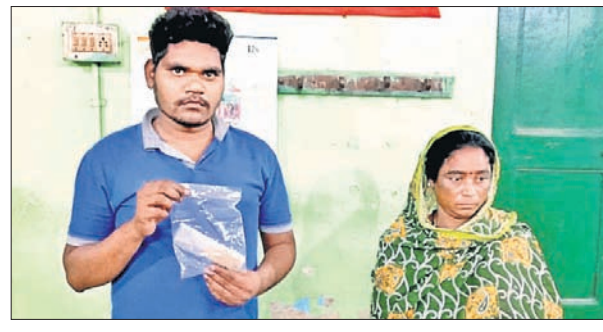
ଗିରଫ ହୁଏ ଅଭିଯୁକ୍ତ।