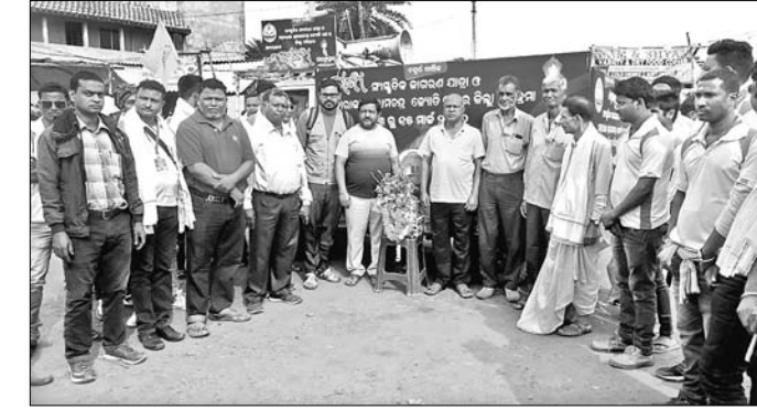
ଯଶପୁରଠାରେ ପହଞ୍ଚିଥିବା ଜ୍ୟୋତି ରଥକୁ ସମର୍ଥନ ଦିଆଯାଇଛି।