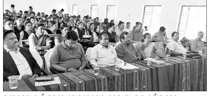
ସଚେତନତା କାର୍ଯ୍ୟକ୍ରମରେ ଯୋଗଦେଇଥିବା ସୂଚନା ଅଧିକାର କର୍ମୀମାନେ।