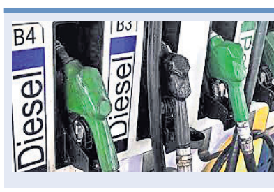
■ ଇନ୍ଦିଆ ଦର ବୃଦ୍ଧି ଯାଚିବି ■ ନିଜ ମଧ୍ୟରେ ବ୍ୟବସ୍ଥିତ କରିବେ କମ୍ପାନୀ ■ ରାଜକୋଷକୁ ଆସିବ ୩୯ ହଜାର କୋଟି

କେନ୍ଦ୍ର ସରକାର ଶନିବାର ପେଟ୍ରୋଲ ଏବଂ ଡିଜେଲ ଉତ୍ପାଦ ଟିକସ ଲିଟର ପିଛା ୩ ଟଙ୍କା ବୃଦ୍ଧି କରିଛନ୍ତି। ଏହାଦ୍ୱାରା ରାଜକୋଷକୁ ପ୍ରାୟ ୩୯ ହଜାର କୋଟି ଟଙ୍କାର ରାଜସ୍ୱ ଆସିବ ବୋଲି ଜଣାପଡ଼ିଛି। ଏବେ ଅନ୍ତର୍ଜାତୀୟ ବଜାରରେ ଅଣୋଧିତ ତୈଳ ଦର ବୃଦ୍ଧି ହୋଇଥିଲେ ମଧ୍ୟ ଏହାର ଲାଭ ସରକାର ଲୋକଙ୍କୁ ଦେଇ ନ ଥିଲେ।