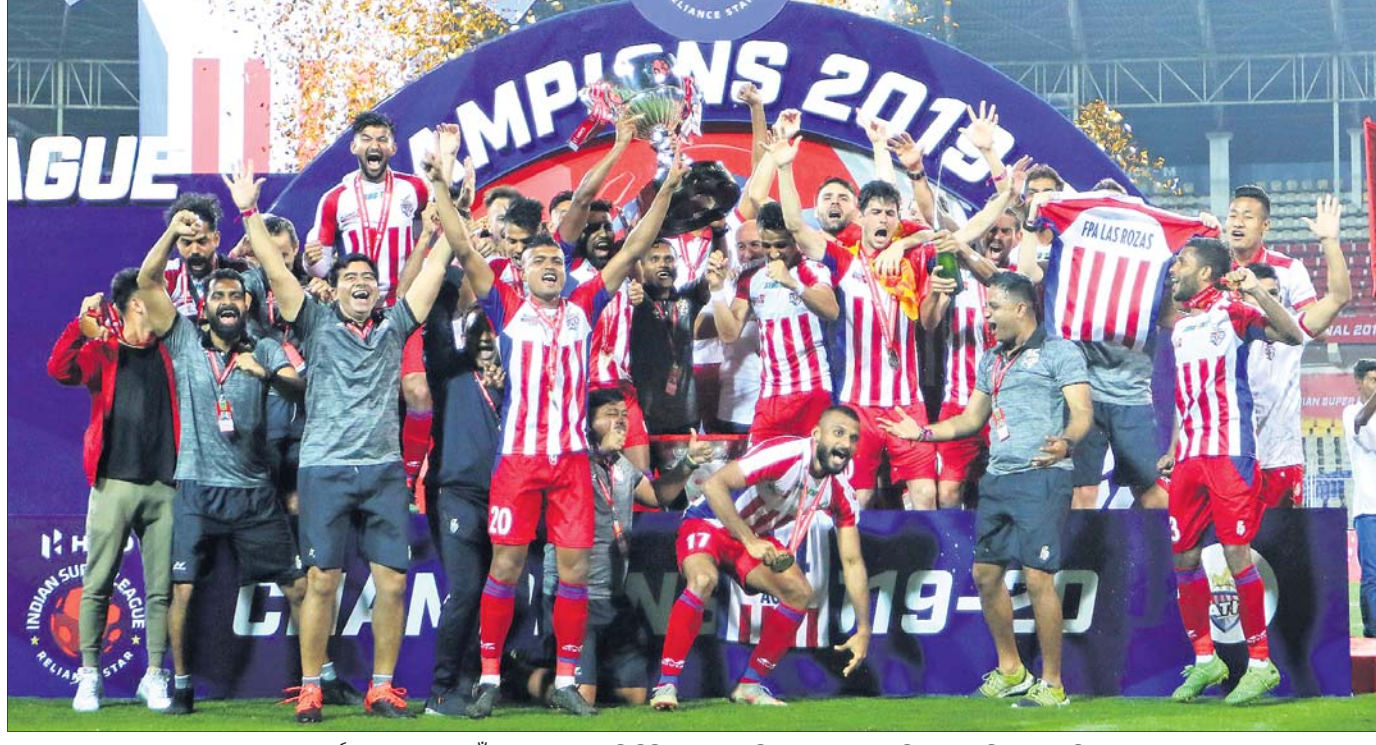
ରେକର୍ଡ ତୃତୀୟ ଥର ପାଇଁ ଆଇଏସ୍‌ଏଲ ଟ୍ରଫି ଜିତିବା ପରେ ଏଟିକେ ଦଳର ଖେଳାଳିମାନେ ଖୁସି ମନାଉଛନ୍ତି।