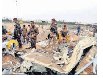
ଶନିବାର ହୋଇଥିବା ଆକ୍ରମଣ ପାଇଁ କୌଣସି ସଂଗଠନ ନିଜକୁ ଦାୟୀ କରି

ବାଗଦାଦ, ୧୫ ମାର୍ଚ୍ଚ (ଏସପି): ଆମେରିକା ଓ ଯୁରୋପୀୟ ସୈନ୍ୟ ରହୁଥିବା ଇରାକର ଏକ ଘାଟି ଉପରେ ସାନିରକେଟ ମାଡ଼ ହୋଇଛି। ବାଗଦାଦର ଉତ୍ତର ପାର୍ଶ୍ୱରେ ଥିବା ଏହି ଘାଟି ଉପରେ ଦିନବେଳା ଆକ୍ରମଣ କରାଯାଇଛି। ଗତ ଅକ୍ଟୋବରଠାରୁ ଆମେରିକା ସୈନ୍ୟ ରହୁଥିବା ଇରାକର ବିଭିନ୍ନ ଘାଟି ଉପରେ ଏହା ୨୩ତମ ଆକ୍ରମଣ।