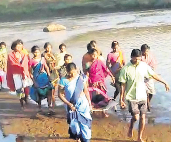
ଗର୍ଭବତୀଙ୍କୁ ଷ୍ଟ୍ରେଚରରେ ନଦୀ ପାର କରାଯାଇଛି ।

ଚିକିତ୍ସା/ରାୟଗଡ଼ା ଅଫିସ୍, ୧୪ମାର୍ଚ୍ଚ(ବି.ଏସ୍.ଏ.)