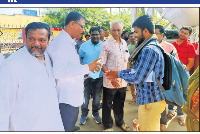
ଯାତ୍ରୀଙ୍କ ହାତଧୁଆ ଯାଉଛି।

ଛତ୍ରପୁର ବିଧାନସଭା ସଭାପତି ରଞ୍ଜନ ପୃଷ୍ଟି, ଛତ୍ରପୁର ବୁକ୍ ଅଧ୍ୟକ୍ଷ ଏମ୍. ଧନଞ୍ଜୟ ରେଡ୍ଡି, ବିଡିଓ ଅମିତା