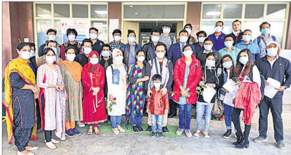
ଚାନ୍ଦନାକୁ ଫେରି ନୁଆଦିଲ୍ଲାର ଛାଓଲାସ୍ଥିତ ଆଇଡିସିସି କ୍ୱାରାଣ୍ଟାଇନ୍ କେନ୍ଦ୍ରରେ ଥିବା ଭାରତୀୟ ସେନାକୁ କରୋନା ସଂକ୍ରମଣ ହୋଇ ନ ଥିବା ପରୀକ୍ଷା କରାଯାଉଛି।

ଦେଶରେ ସଂଗ୍ରହାଳୟ, ପର୍ଯ୍ୟଟନ ସ୍ଥଳ ଓ କ୍ରୀଡା କାର୍ଯ୍ୟକ୍ରମକୁ ବନ୍ଦ କରିଦେଲେଣି। କଲମିଆ କେନ୍ଦ୍ରରେ ଲାଗୁ ସହ ଏହାର ସୀମାକୁ ବନ୍ଦ କରିଦେବ ବୋଲି କହିଛି। ସୌଦି ଆରବ ସମସ୍ତ ଅନ୍ତର୍ଜାତୀୟ ବିମାନ ଚଳାଚଳକୁ ରବିବାରଠାରୁ ବୁଲ୍ ସମ୍ପୂର୍ଣ୍ଣ ପାଇଁ ବନ୍ଦ କରିବ ବୋଲି କହିଛି। କରୋନାର ଉପସ୍ଥିତିକୁ କୁହାଯାଉଥିବା ଚାଲନାରେ ଏବେ ସଂକ୍ରମଣ ହାର ଯଥେଷ୍ଟ ହୁଏ ପାଇଥିବାବେଳେ ସ୍ତ୍ରୋତରୁ ଦେଶକୁ ଚଳିବାର ମୁହଁହାର ବଢ଼ିଗଲାଣି। ଇଟାଲିରେ ସର୍ବାଧିକ ୧୨୬୬ ଜଣଙ୍କ ମୃତ୍ୟୁ ହୋଇଥିବାବେଳେ ୧୭,୬୬୦ ଜଣ ଆକ୍ରାନ୍ତ ହୋଇଛନ୍ତି। ସ୍ପେନ୍ରେ ସଂକ୍ରମଣ ସଂଖ୍ୟା ୫୭୫୩ରେ ପହଞ୍ଚିଛି ଓ ୧୩୬ ଜଣଙ୍କ ମୃତ୍ୟୁ ହୋଇଛି। ତେଣୁ ସ୍ତ୍ରୋତ ଏବେ କରୋନାର କେନ୍ଦ୍ରସ୍ଥଳ ବୋଲି ଡବ୍ଲ୍ୟୁଏଚ୍ଡ କହିଛି। ସ୍ତ୍ରୋତର ପ୍ରମୁଖ ଦେଶ ବ୍ରିଟେନ, ଆଇଲ୍ୟାଣ୍ଡ ଆଦିରୁ